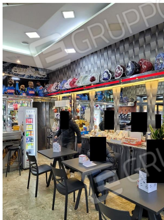
Vista locale commerciale ad uso bar