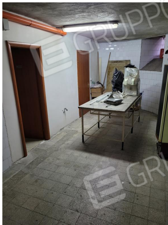
Vista dal locale seminterrato