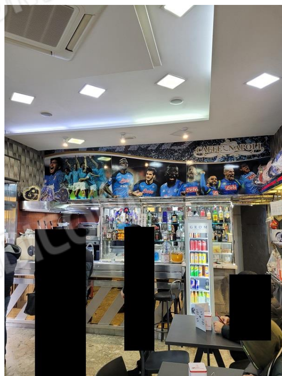
Vista locale commerciale ad uso bar