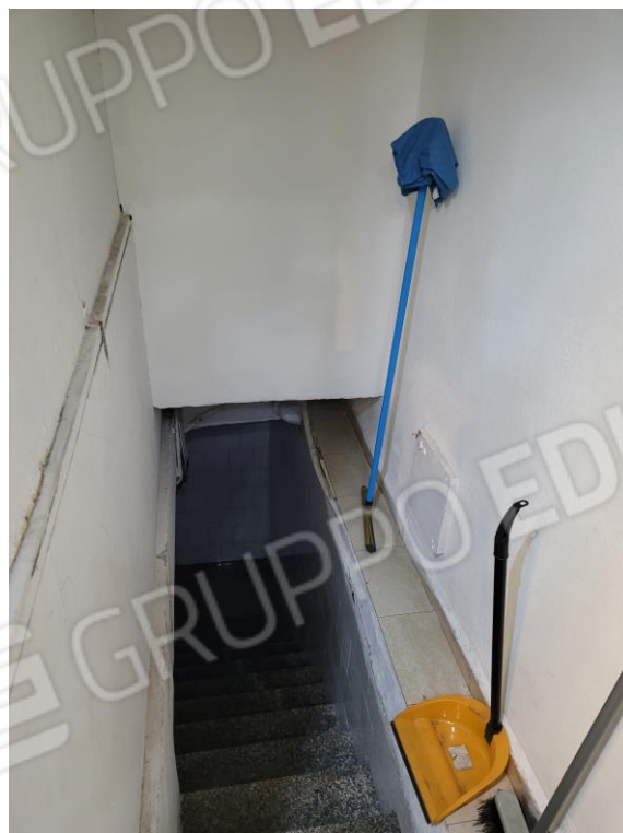
Vista rampa di accesso al locale seminterrato