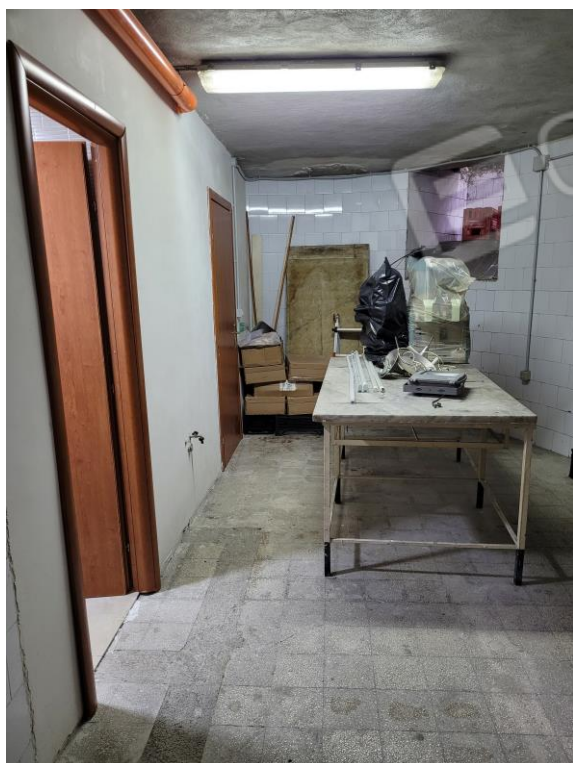
Vista locale seminterrato