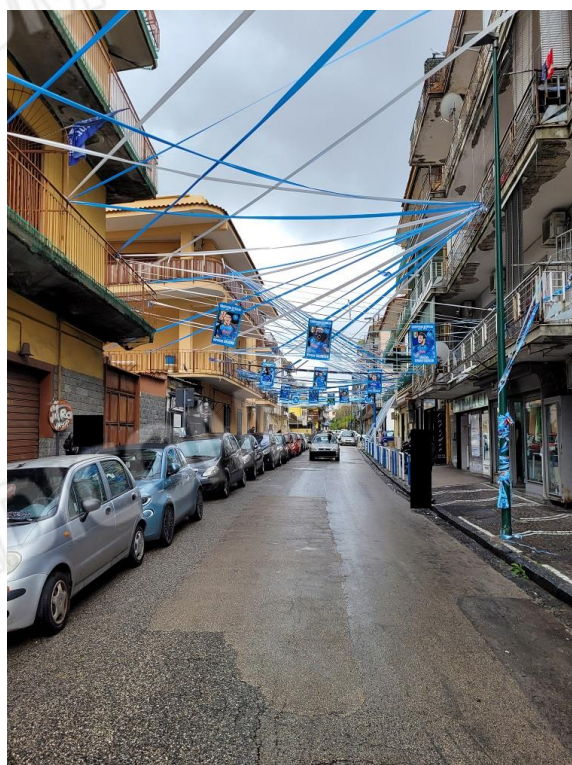
Vista 1° traversa di Via Vittorio Veneto