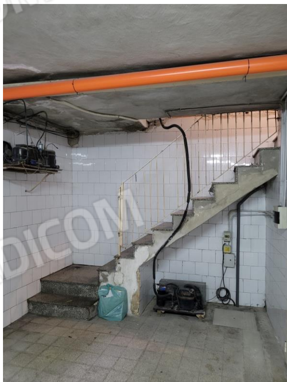
Vista accesso al locale seminterrato