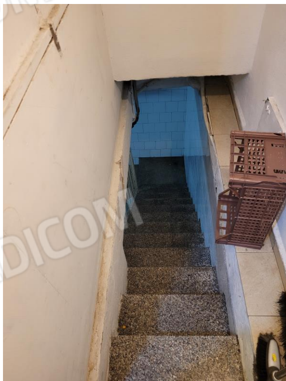
Vista rampa di accesso al locale seminterrato