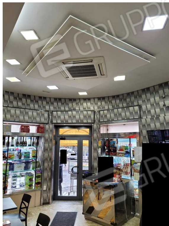
Vista area vendita locale bar