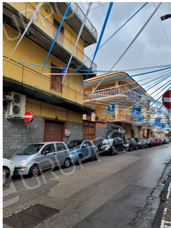
Vista 1° traversa di Via Vittorio Veneto