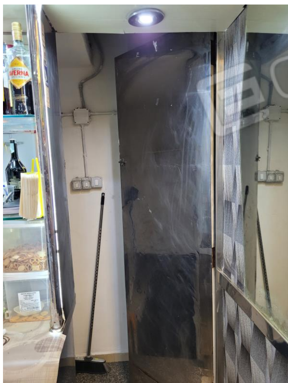
Vista vano di accesso al locale seminterrato