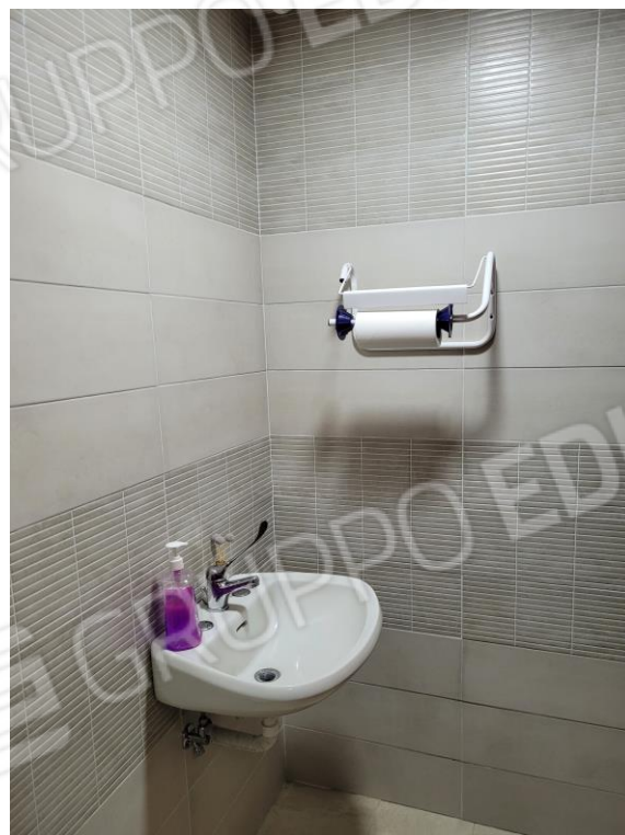
Vista locale bagno