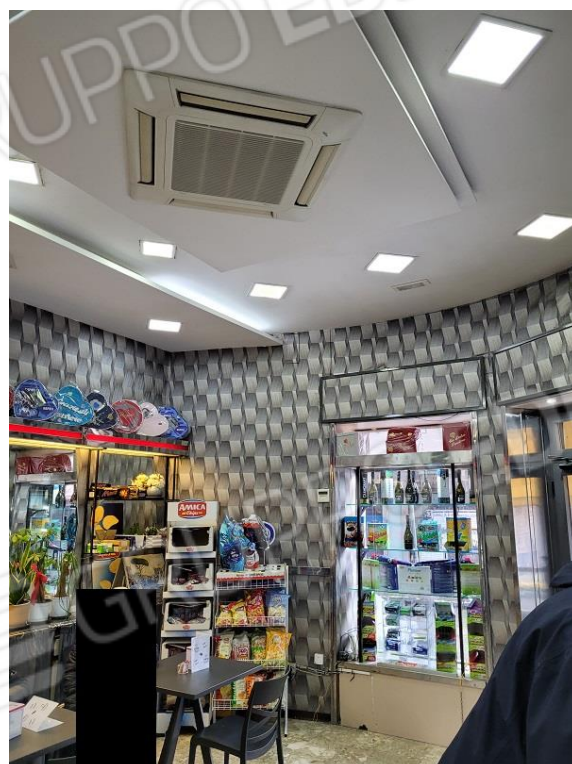
Vista locale commerciale ad uso bar