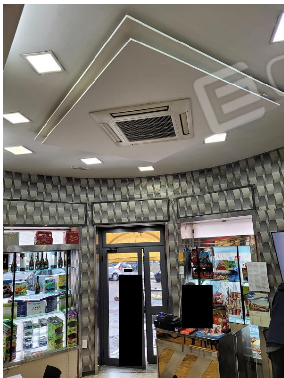
Vista locale commerciale ad uso bar