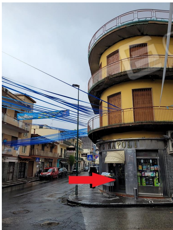
Vista accesso da via Vittorio Veneto