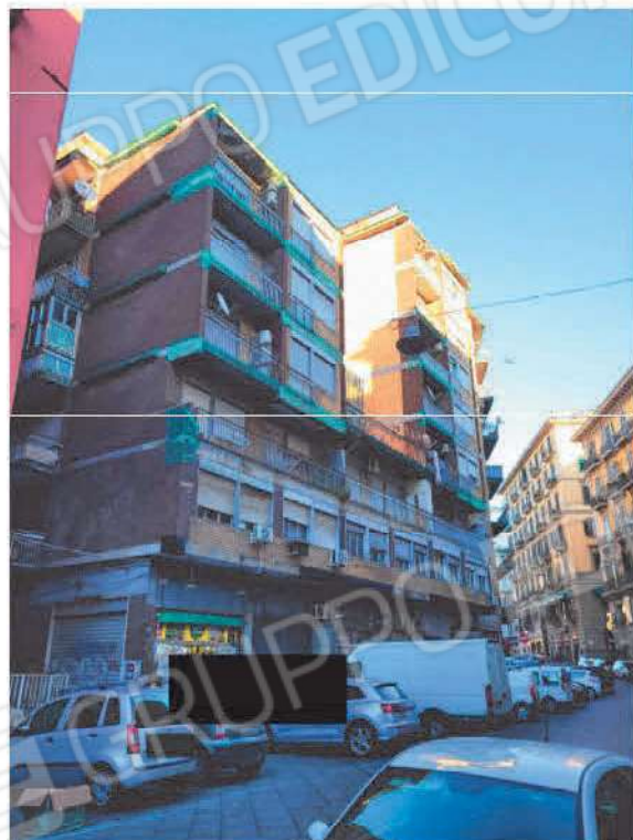
Vista Carriera Grande