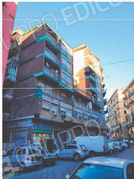
Vista stabile in cui sono allocati i beni