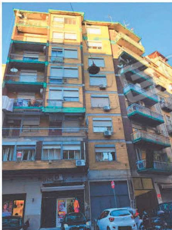
Vista stabile in cui sono allocati i beni