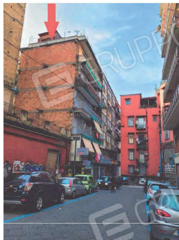
Vista generale immobile in cui sono allocati i beni