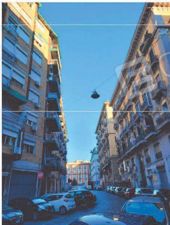
Vista Carriera Grande