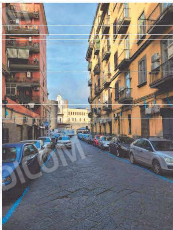
Vista Vico Vasto Capuana