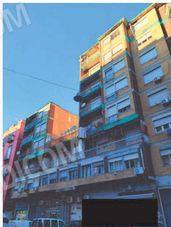
Vista generale immobile in cui sono allocati i beni