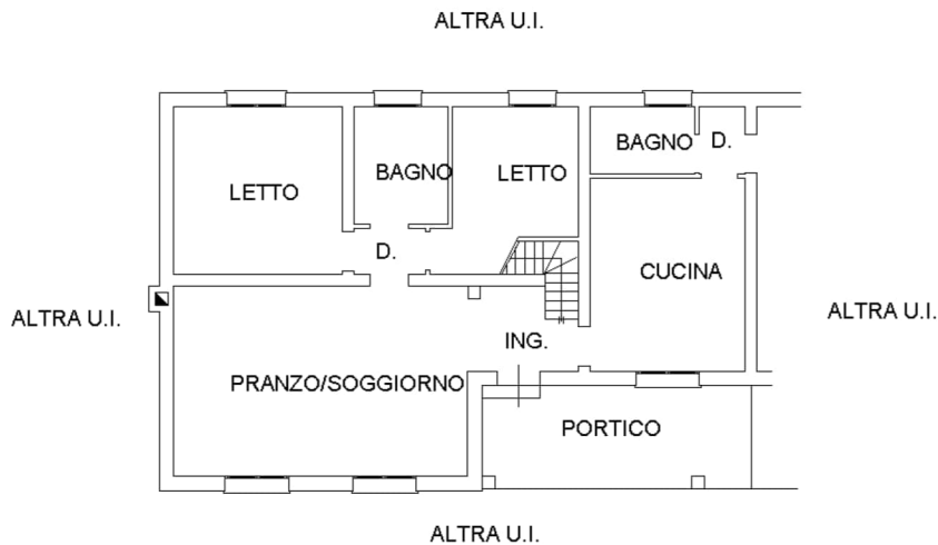
PIANO TERRA h. 2,70