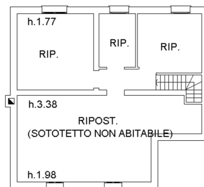
PIANO PRIMO (Sottotetto)