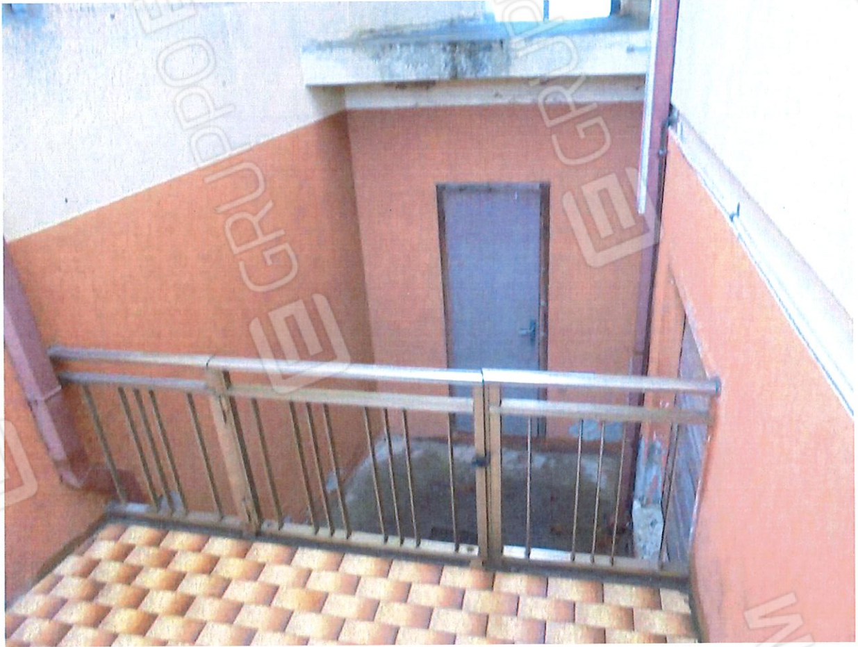
Foto 7. Particolare della scala di accesso al piano primo in comune con il lotto 5).