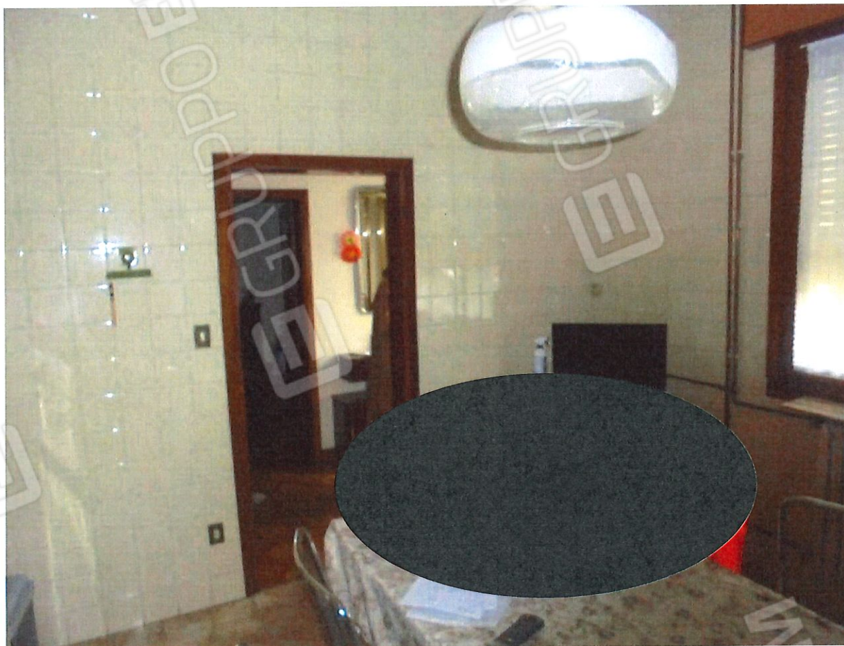
Foto 14. Abitazione. Particolare degli interni.