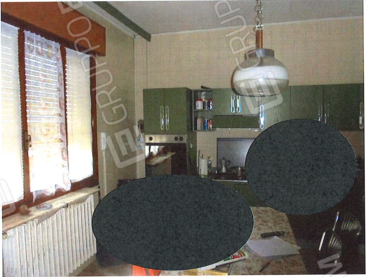
Foto 13. Abitazione. Particolare degli interni.