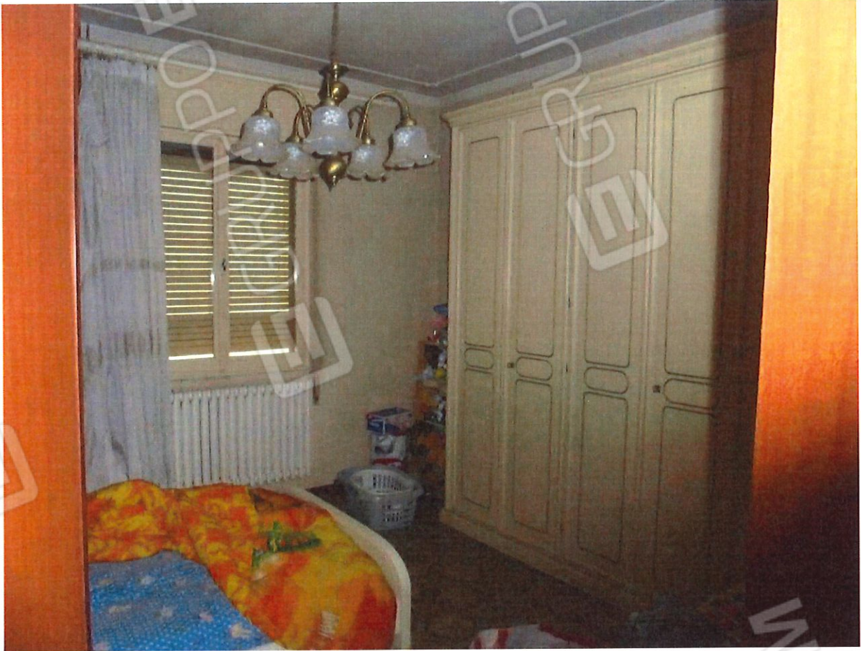
Foto 15. Abitazione. Particolare degli interni.