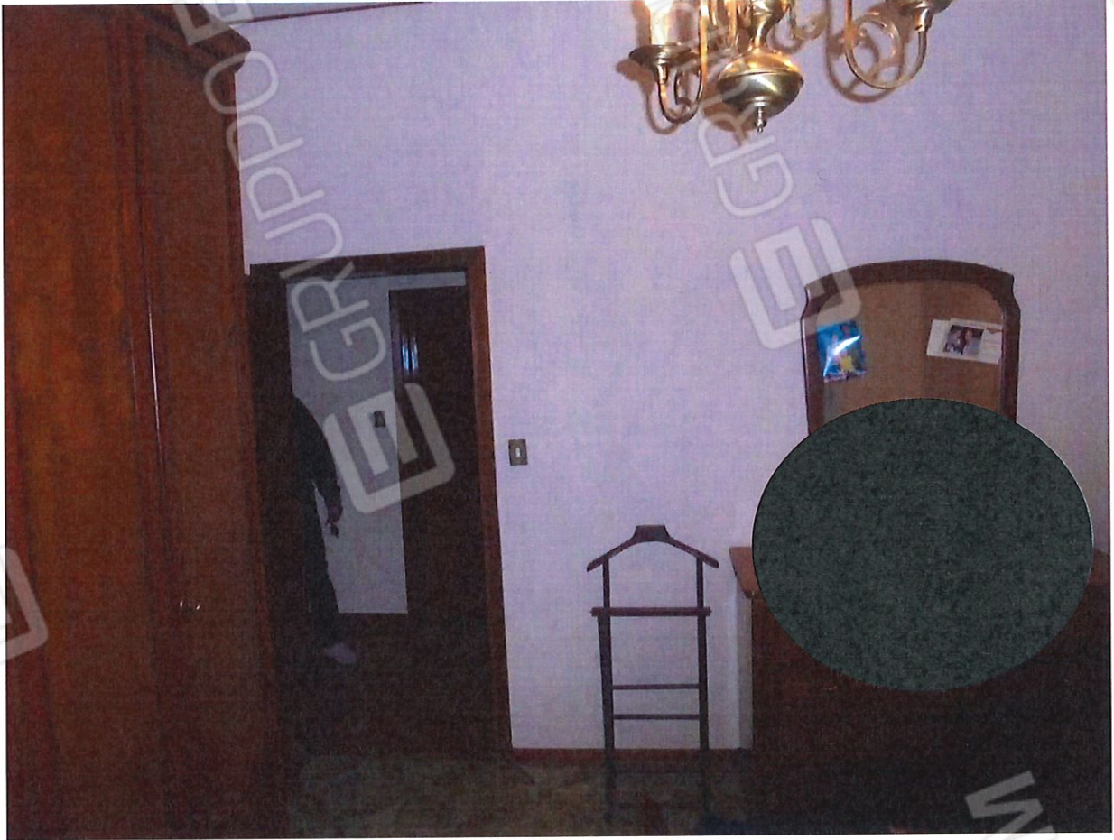
Foto 16. Abitazione. Particolare degli interni.