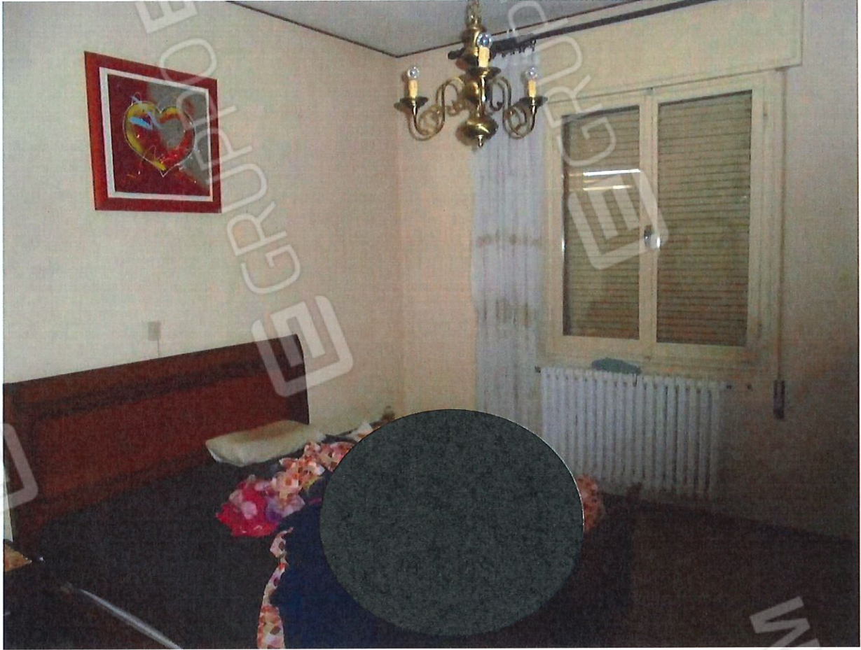
Foto 17. Abitazione. Particolare degli interni.