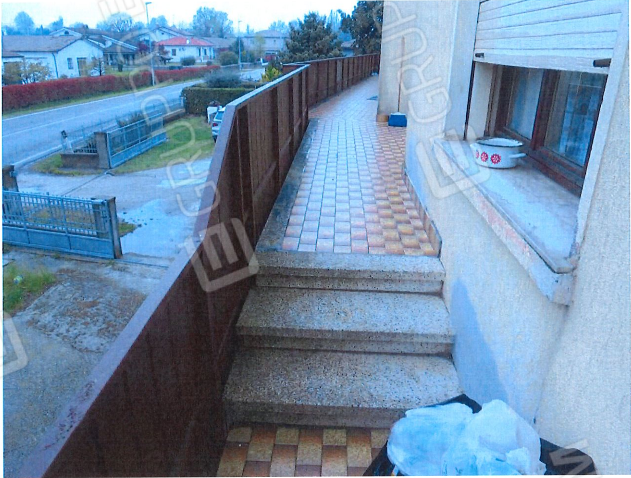
Foto 8. Abitazione. Particolare della terrazza