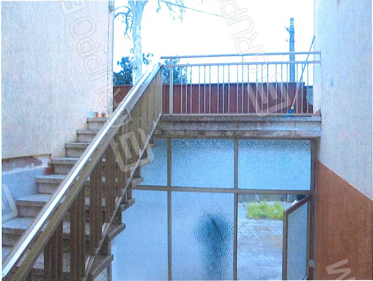
Foto 6. Particolare della scala di accesso al piano primo in comune con il lotto 5).