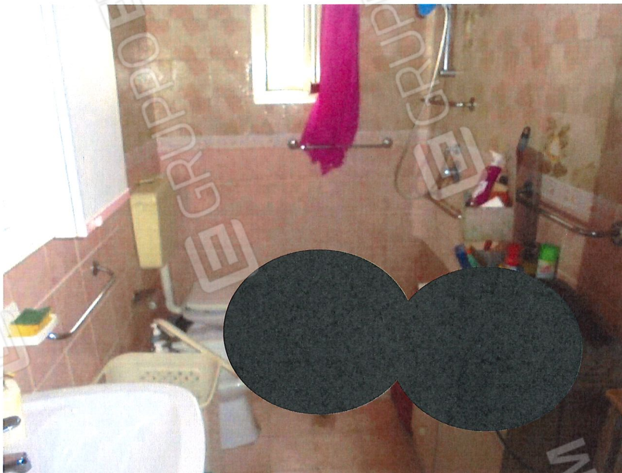
Foto 18. Abitazione. Particolare degli interni.