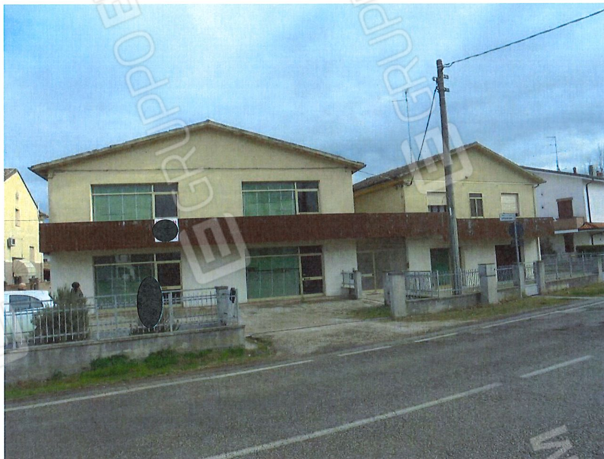
Foto 1. Ingresso. Vista da Via Provinciale.