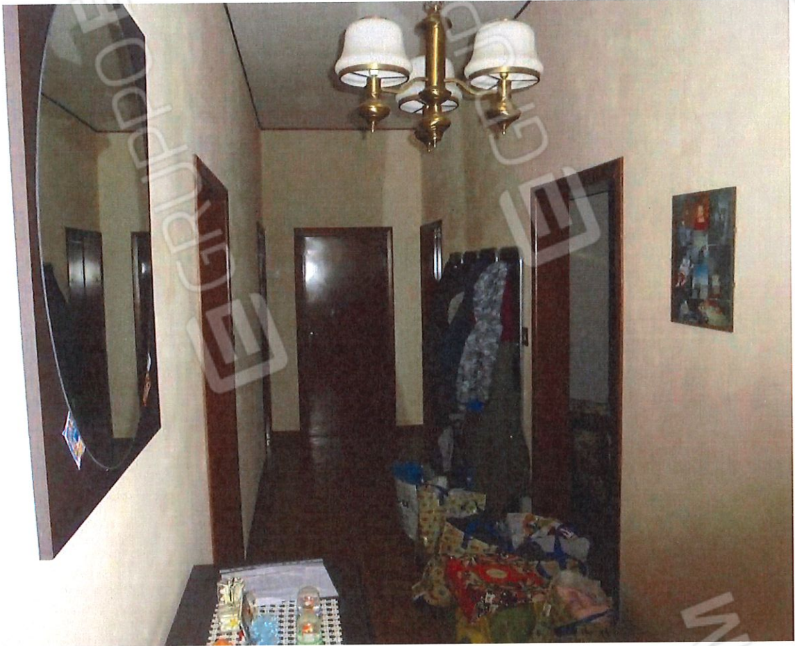
Foto 12. Abitazione. Particolare degli interni.