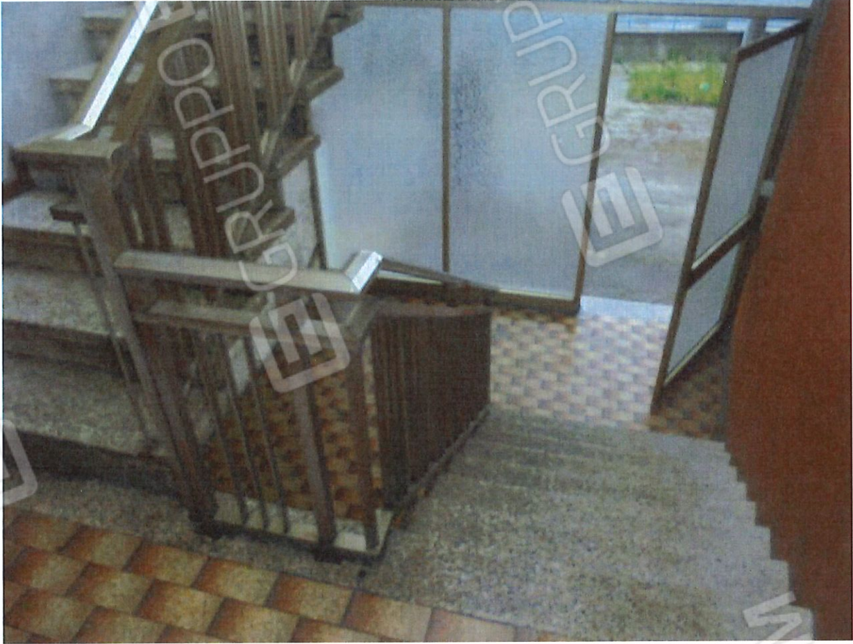
Foto 5. Particolare della scala di accesso al piano primo in comune con il lotto 5).