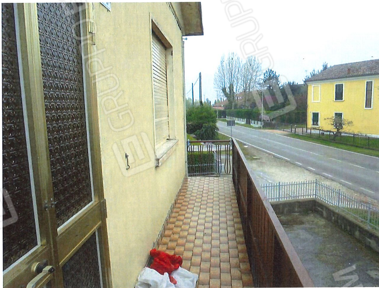
Foto 9. Abitazione. Particolare della terrazza