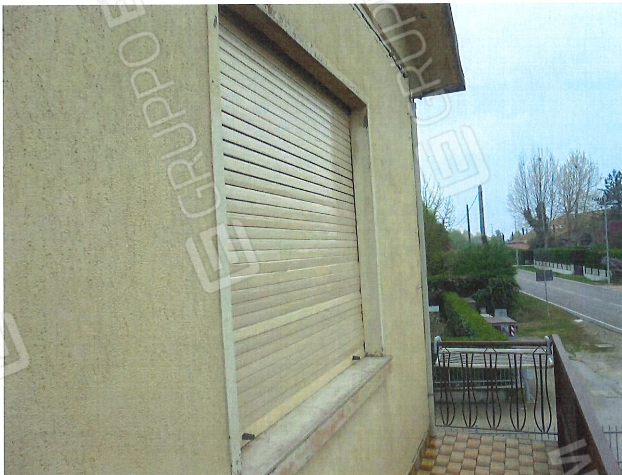
Foto 10. Abitazione. Particolare della terrazza