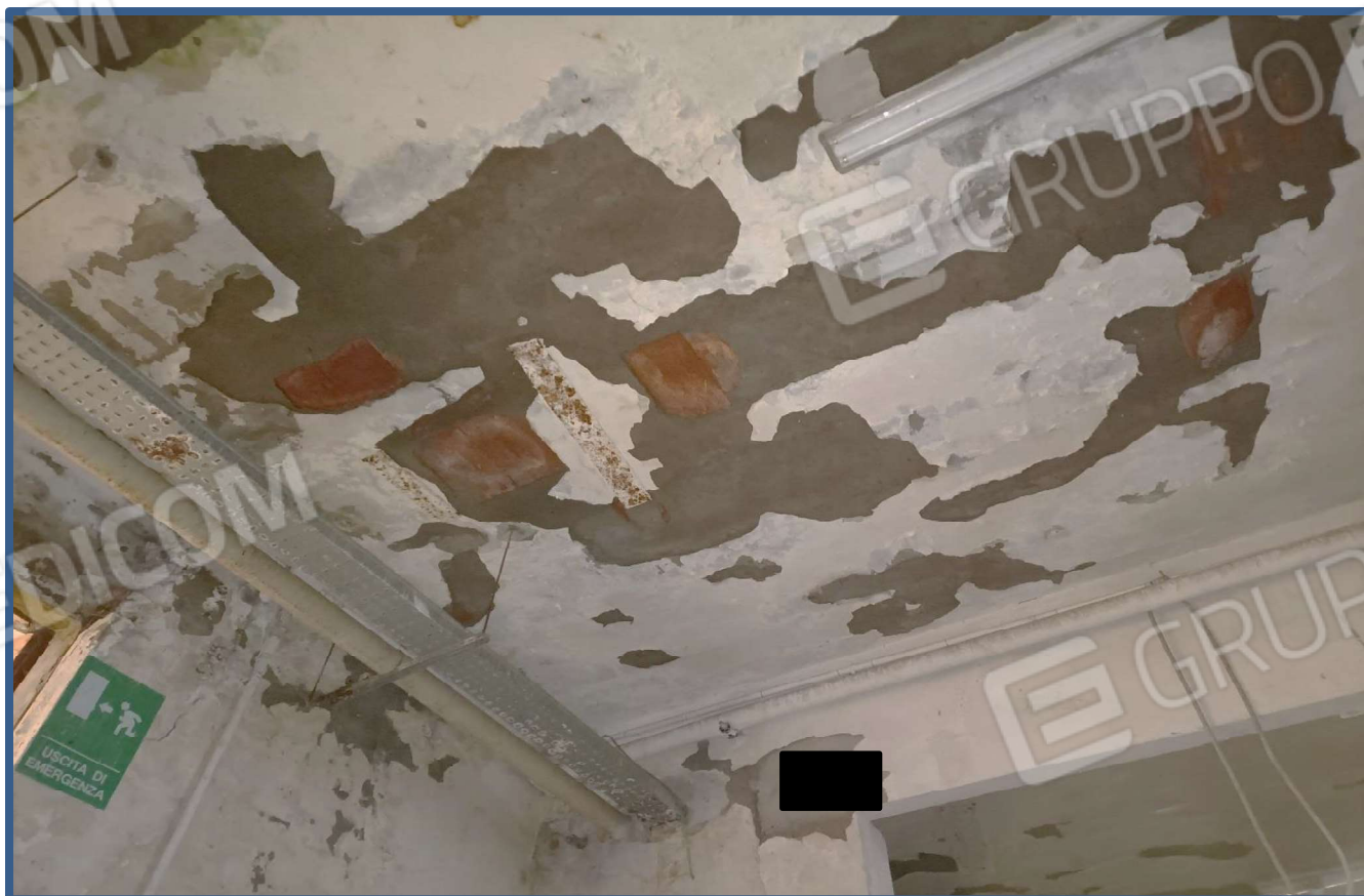
Foto 12 – infiltrazioni importati nel soffitto provenienti dalla copertura