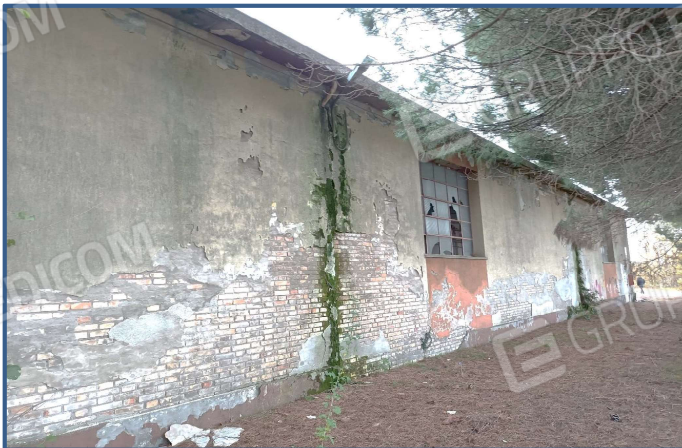
Foto 6 - Vista prospetto ovest del fabbricato