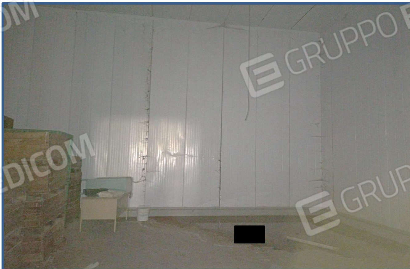
Foto 16 Vista interna di una cella sotto tettoia