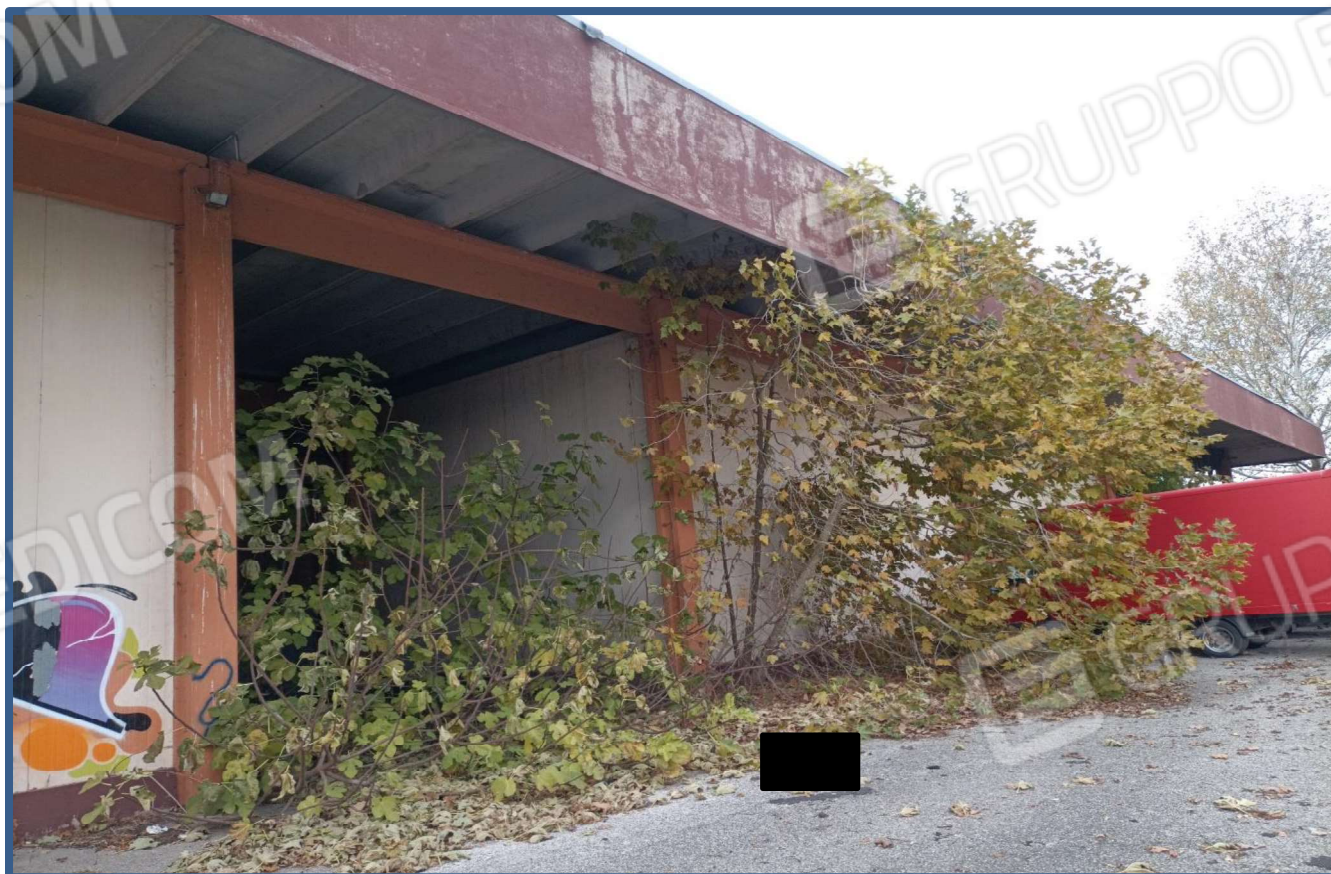
Foto 4 Tettoia celle sul lato est del fabbricato