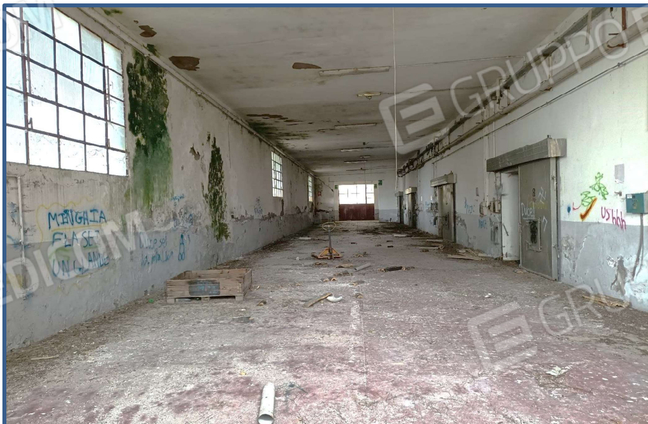
Foto 8 Vista interna in evidente stato di abbandono