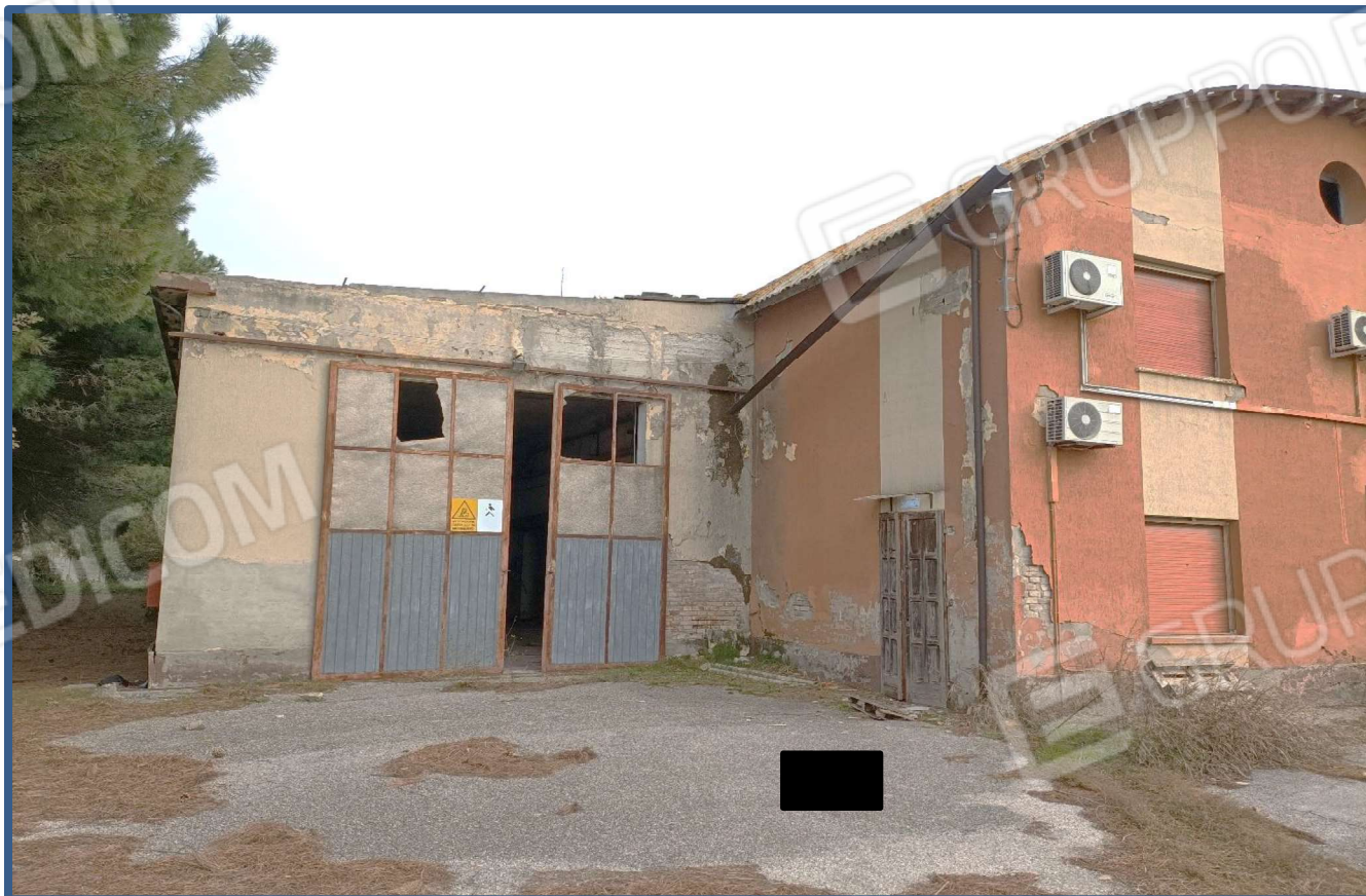
Foto 2 Vista accesso laterale