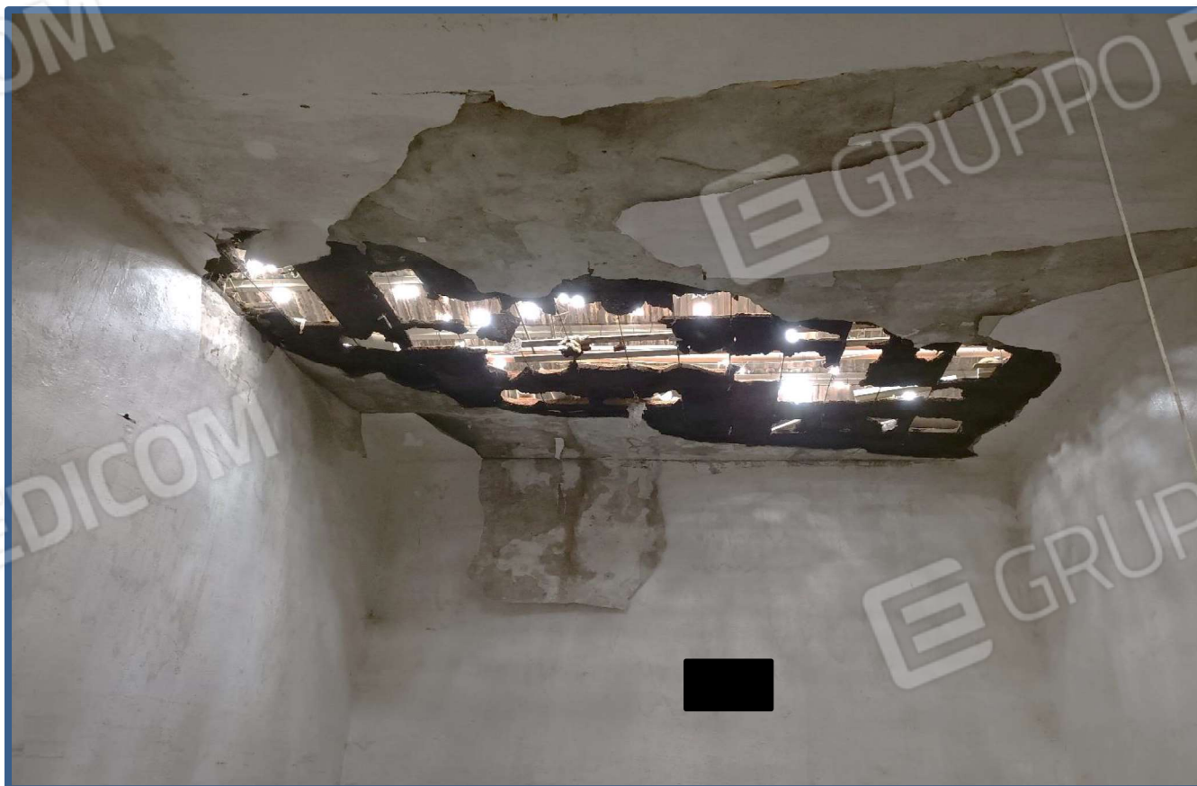
Foto 14 Soffitto crollato