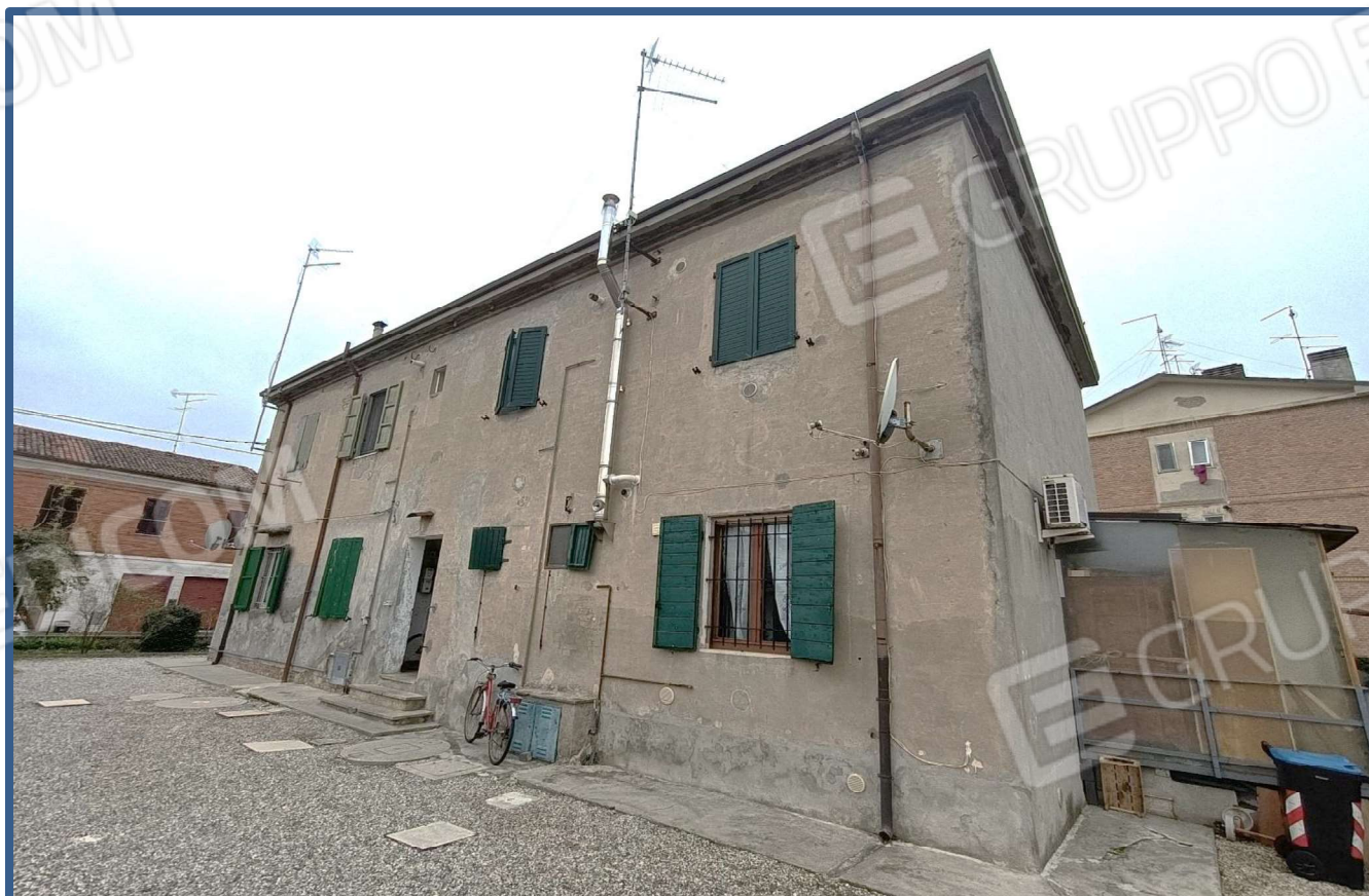
Foto 2 Vista prospetto principale