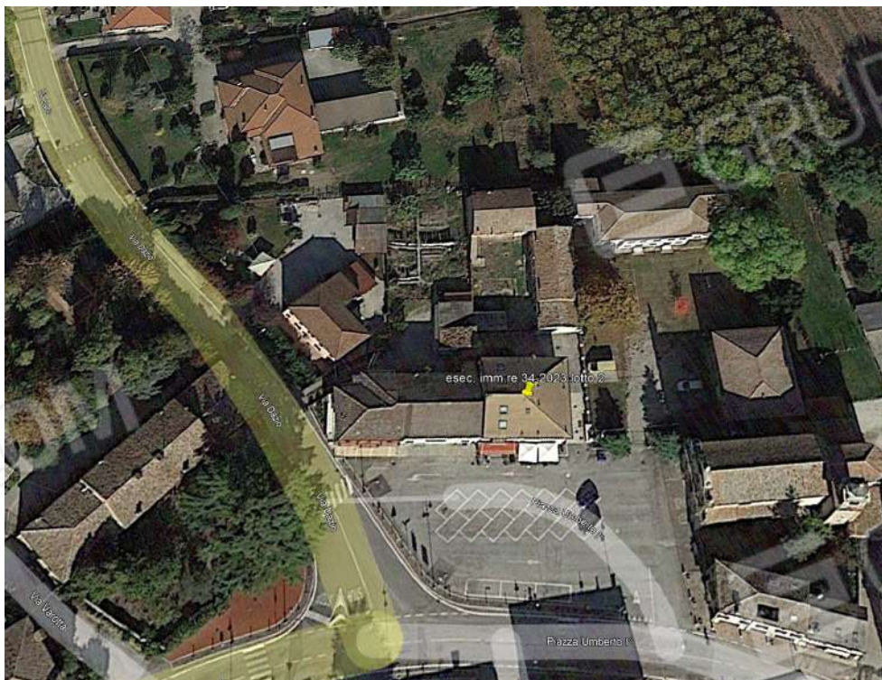
Foto satellitare particolare