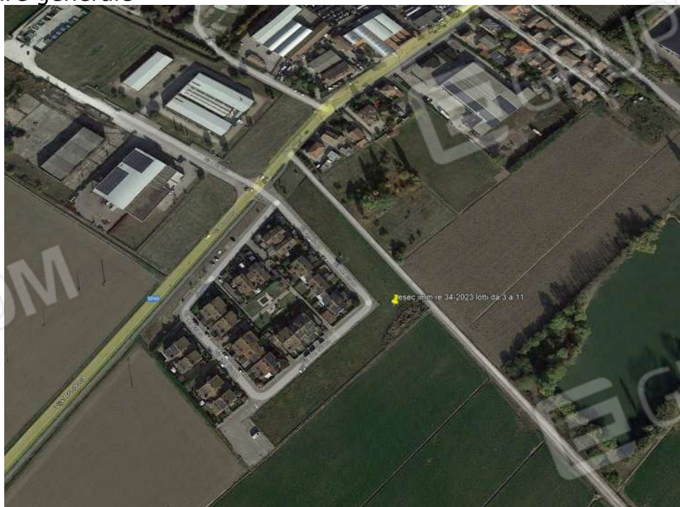
foto satellitare particolare