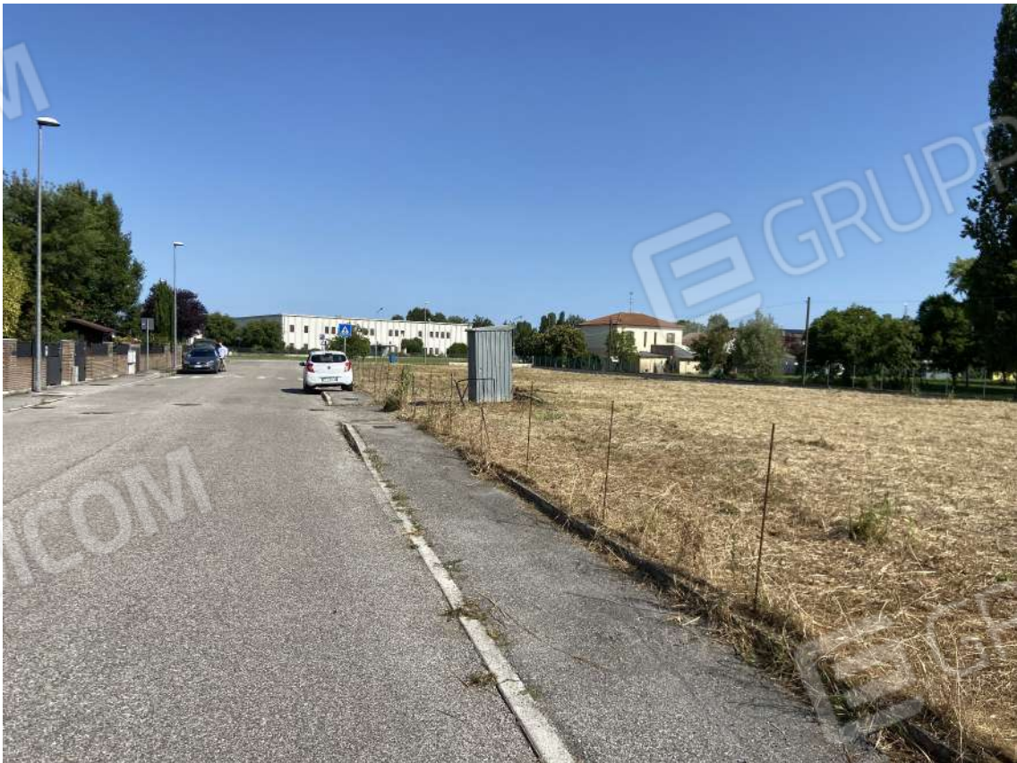
viste da via del grano