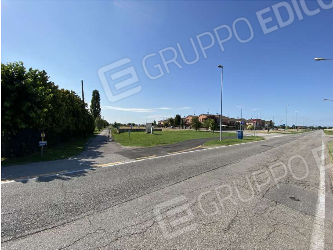
vista da via rondona