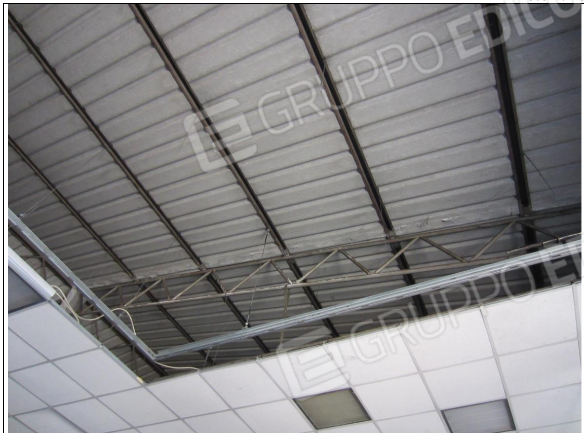
INTERNO LABORATORIO - PARTICOLARE CONTROSOFFITTO E STRUTTURA TETTO