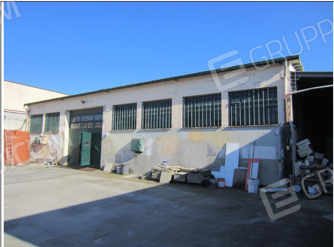
PROSPETTO FRONTALE LABORATORIO