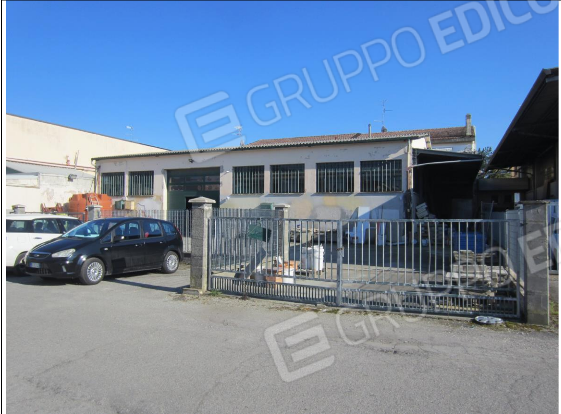
PROSPETTO LABORATORIO SU VIA PAGANINI