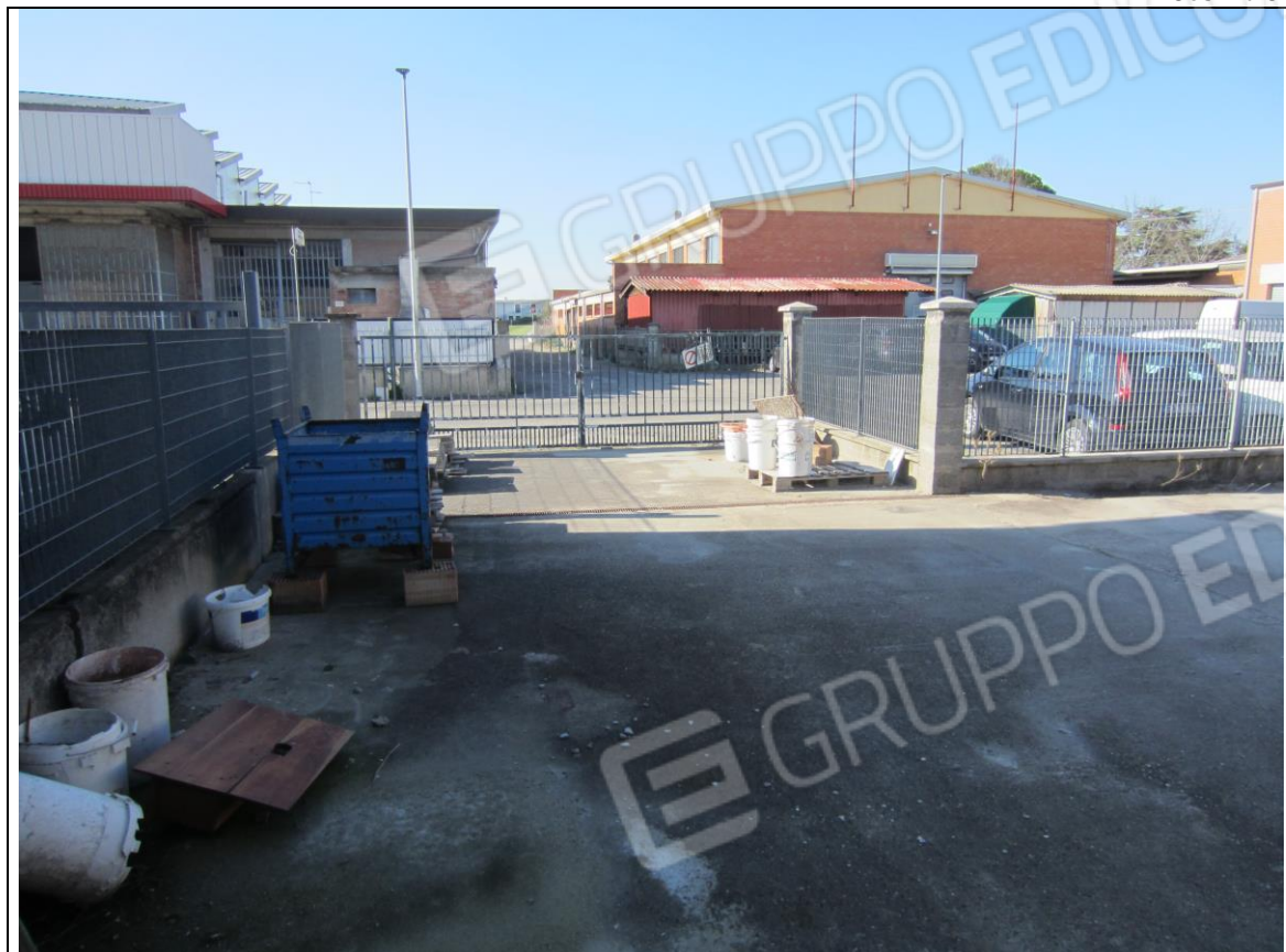
AREA ESCLUSIVA ANTISTANTE