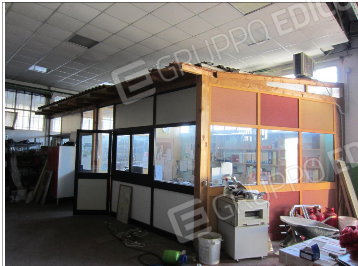
BLOCCO SEGRETERIA-UFFICIO IN PANNELLI E INFISSI