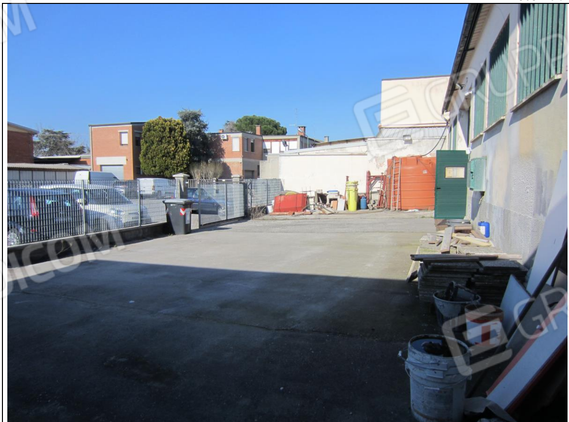
AREA ESCLUSIVA ANTISTANTE