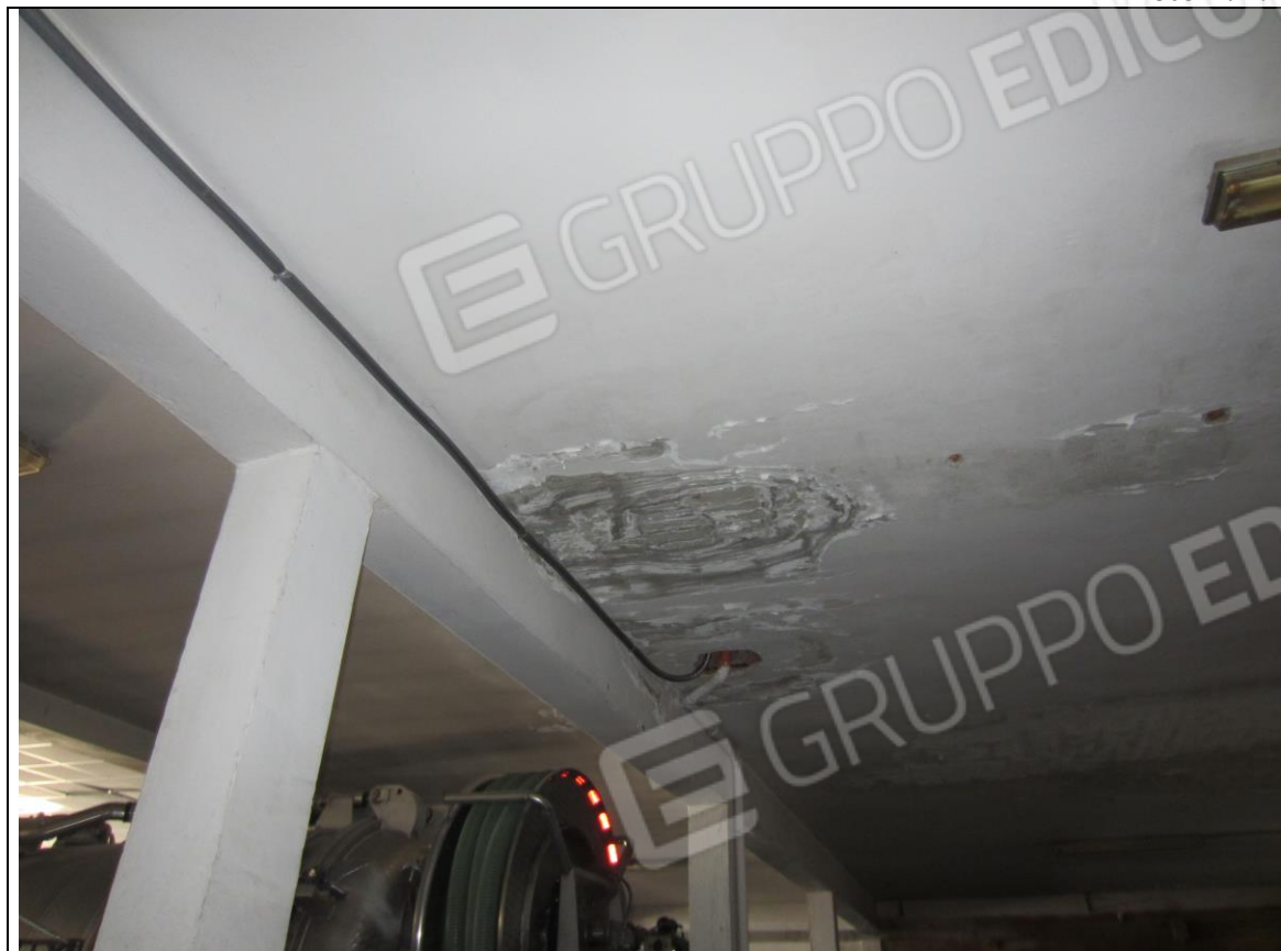
STATO ATTUALE SOFFITTO LATERO-CEMENTO DEL LABORATORIO