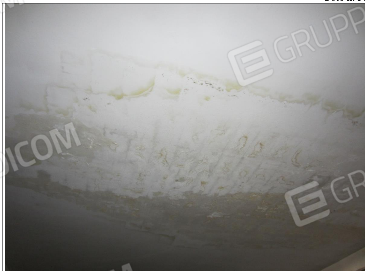
STATO ATTUALE SOFFITTO LATERO-CEMENTO DEL LABORATORIO