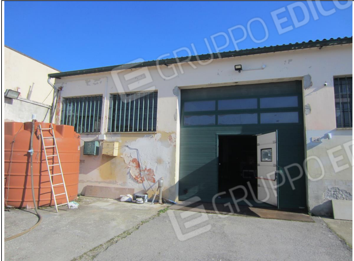
PROSPETTO FRONTALE LABORATORIO