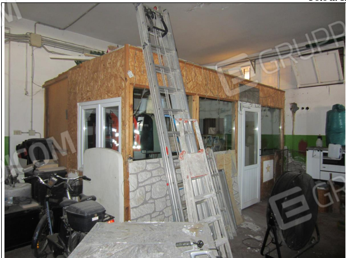
INTERNO LABORATORIO – MANUFATTO CON PANNELLI E INFISSI