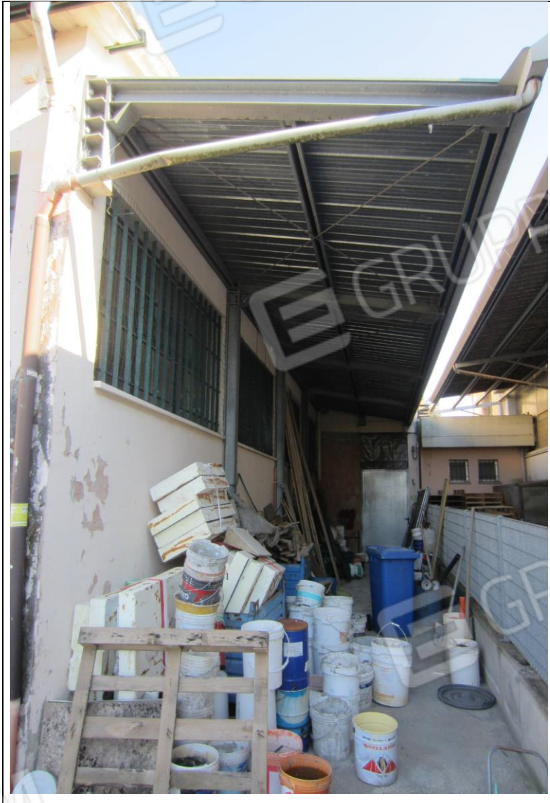
PENSILINA SU FACCIATA LATERALE