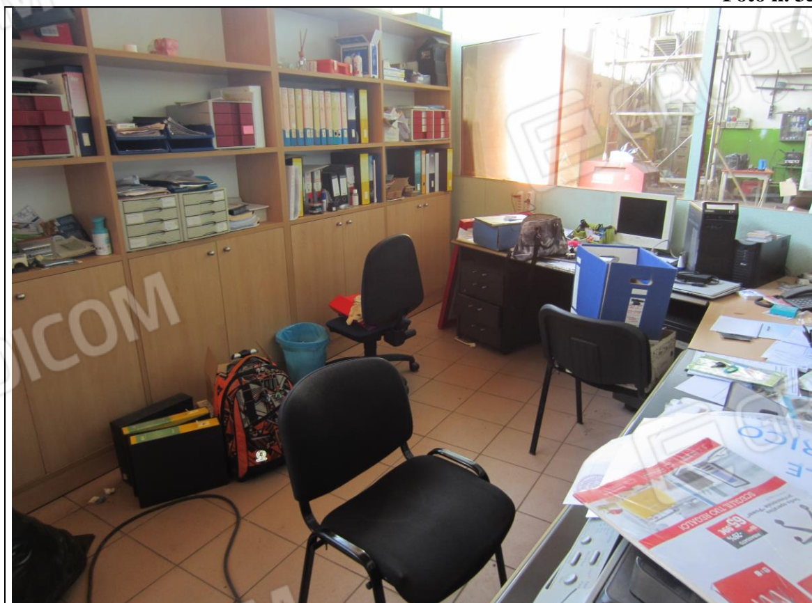
BLOCCO SEGRETERIA-UFFICIO IN PANNELLI E INFISSI