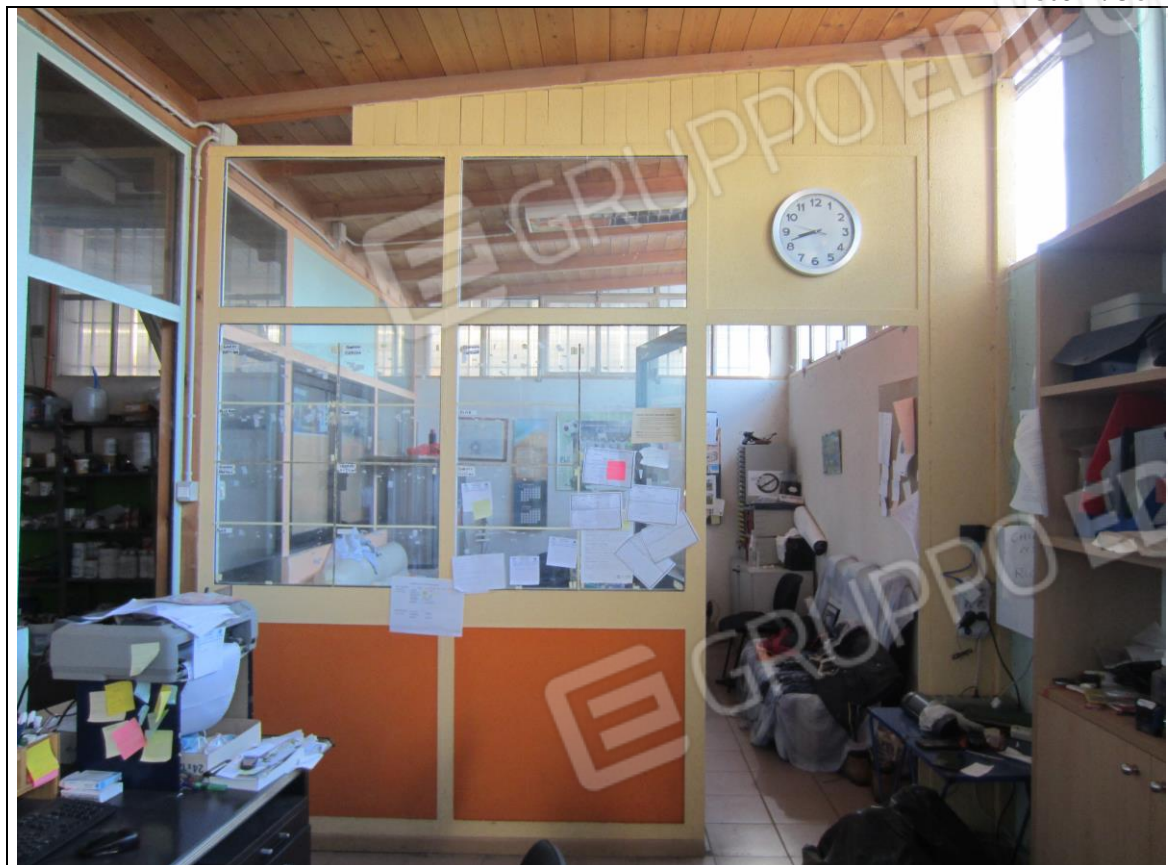
BLOCCO SEGRETERIA-UFFICIO IN PANNELLI E INFISSI