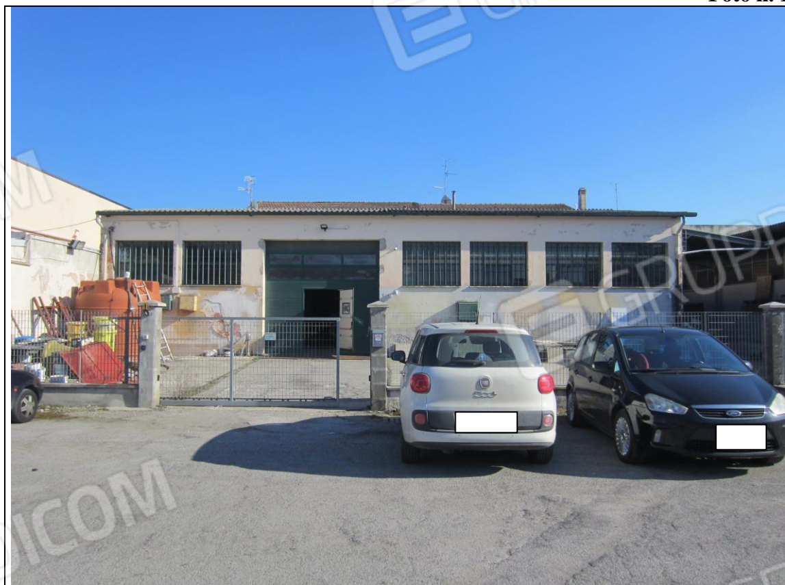
PROSPETTO LABORATORIO SU VIA PAGANINI