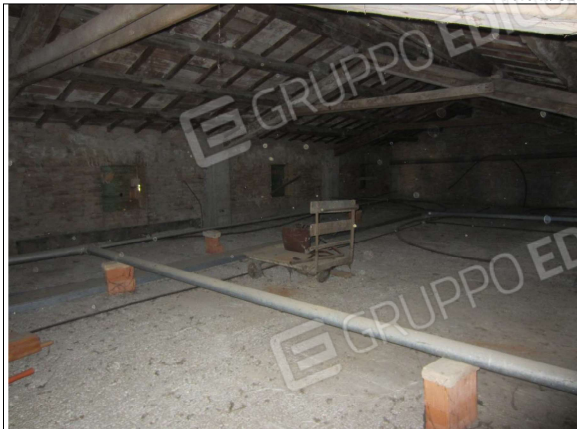
INTERNO UNITA' MAPP. 239 SUB 7 - PIANO PRIMO