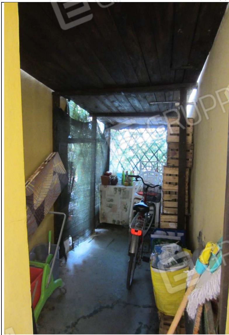
MANUFATTO INSISTENTE SU AREA MAPP. 239 SUB 8