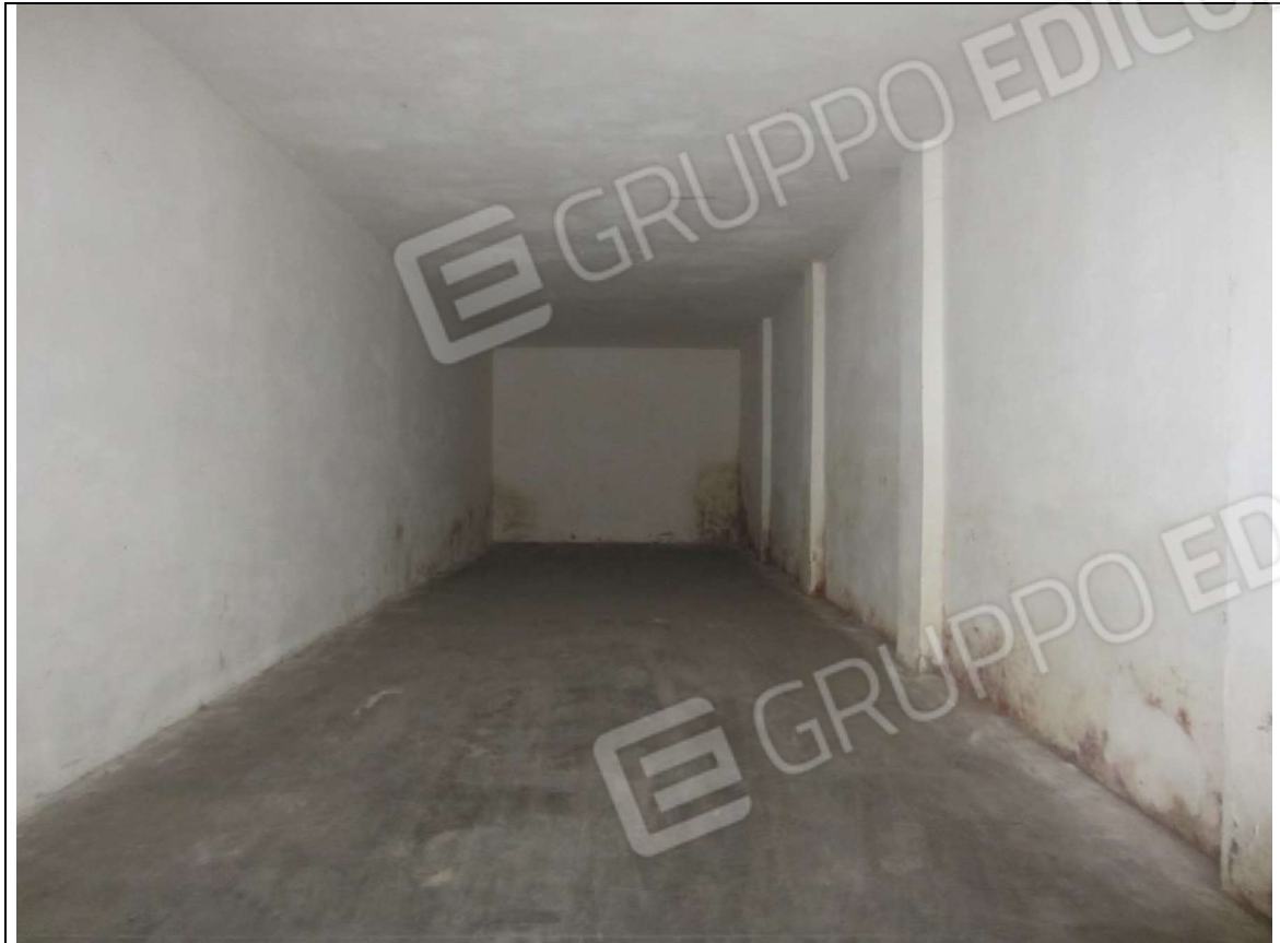
INTERNO MAGAZZINO-FRIGO-LAVORAZIONE MAPP. 239 SUB 5