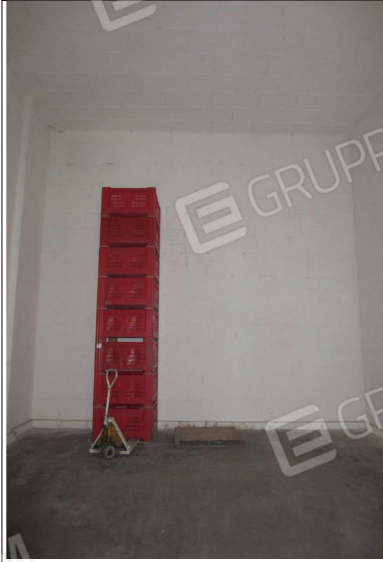
INTERNO MAGAZZINO-FRIGO-LAVORAZIONE MAPP. 239 SUB 5