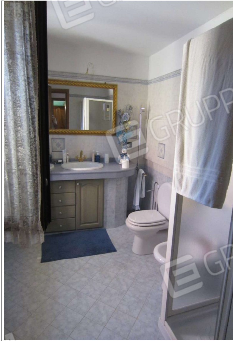
INTERNO UNITA' ABITATIVA MAPP. 239 SUB 6 - 35 SUB 28