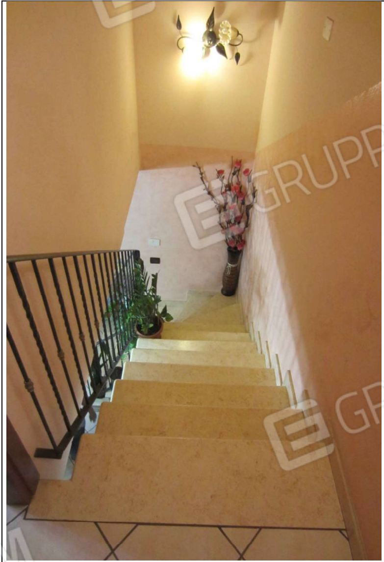
INTERNO UNITA' ABITATIVA MAPP. 239 SUB 6 - 35 SUB 28