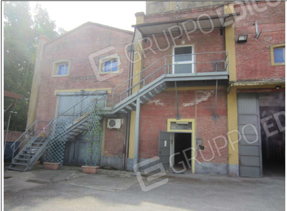
PROSPETTO GENERALE FABBRICATO CON LE UNITA' MAPPALI 239 SUB 5 E 239 SUB 7