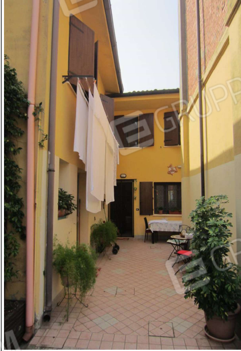
ESTERNO UNITA' ABITATIVA MAPP. 239 SUB 6 - 35 SUB 28