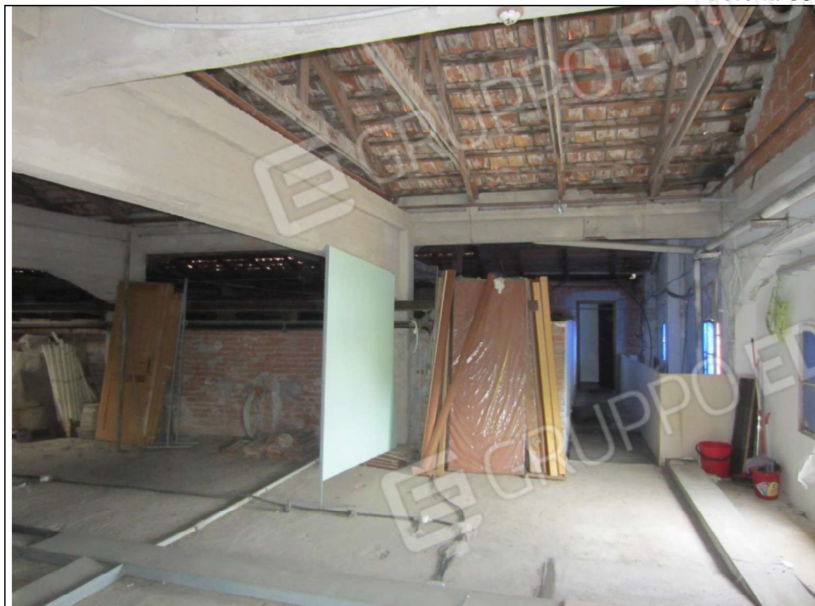
INTERNO UNITA' MAPP. 239 SUB 7 – PIANO PRIMO