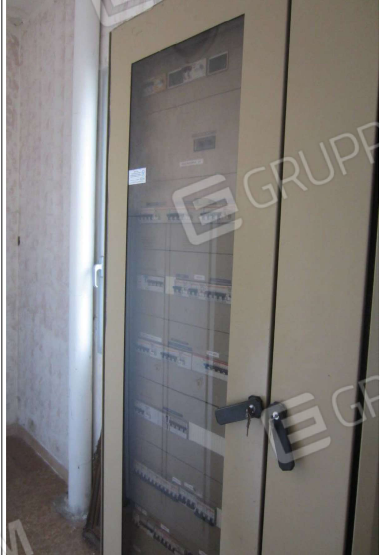
INTERNO MAGAZZINO-FRIGO-LAVORAZIONE MAPP. 239 SUB 5