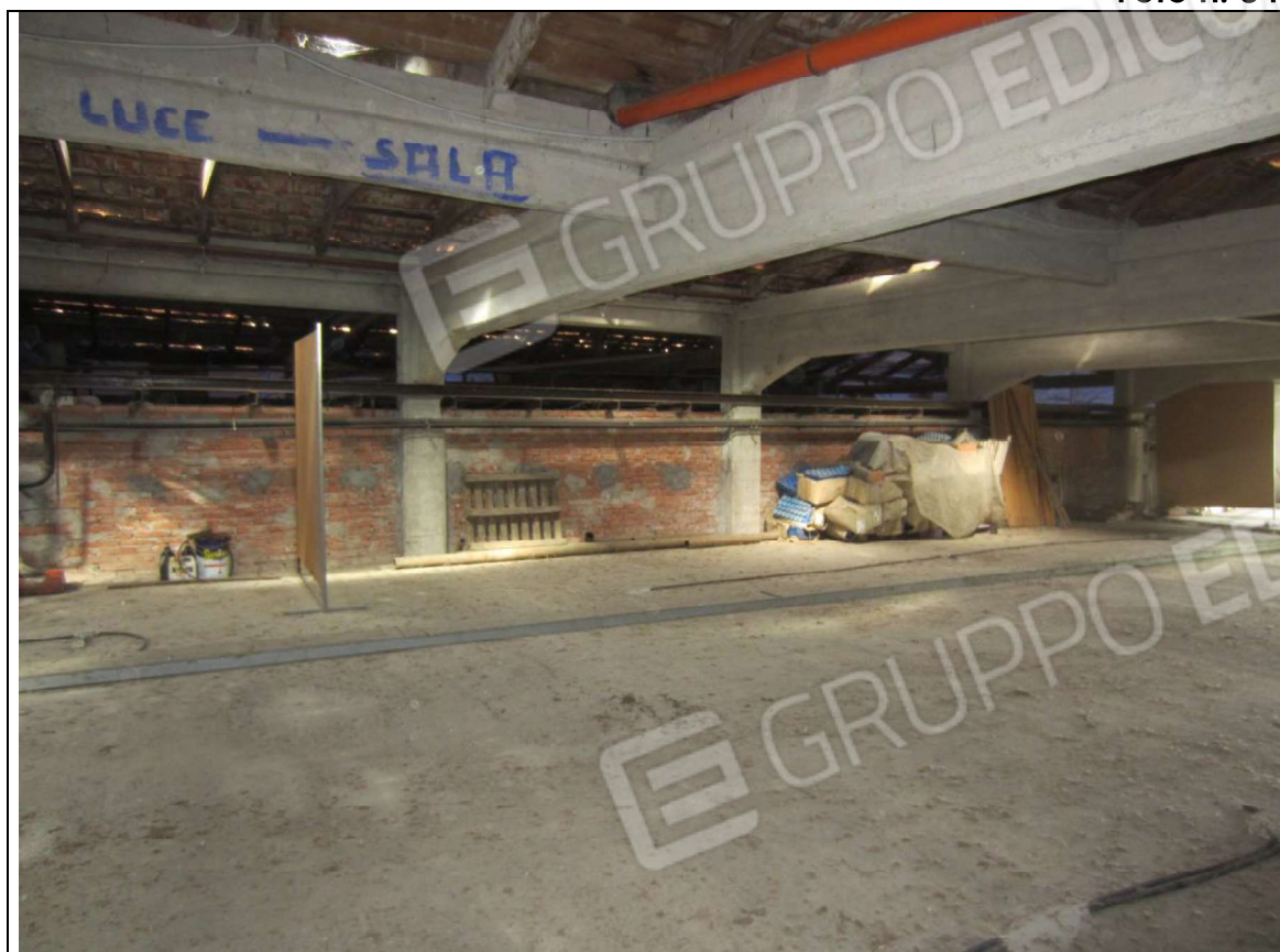
INTERNO UNITA' MAPP. 239 SUB 7 - PIANO PRIMO