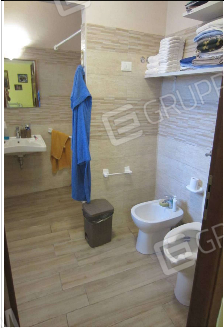
INTERNO UNITA' ABITATIVA MAPP. 239 SUB 6 - 35 SUB 28