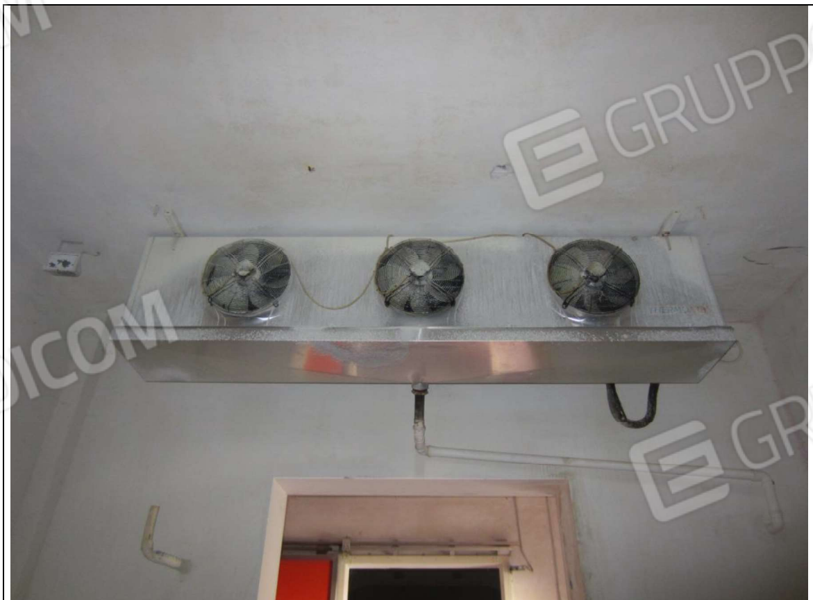
INTERNO MAGAZZINO-FRIGO-LAVORAZIONE MAPP. 239 SUB 5