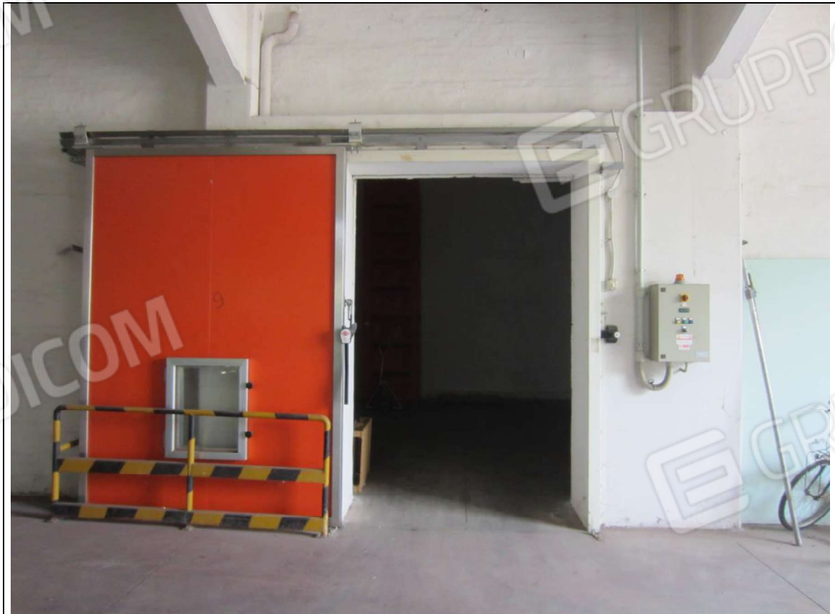
INTERNO MAGAZZINO-FRIGO-LAVORAZIONE MAPP. 239 SUB 5