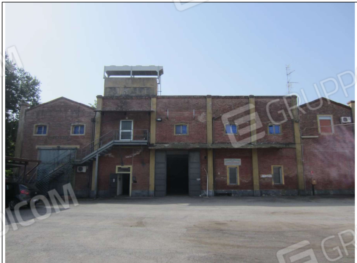
PROSPETTO GENERALE FABBRICATO CON LE UNITA' MAPPALI 239 SUB 5 E 239 SUB 7