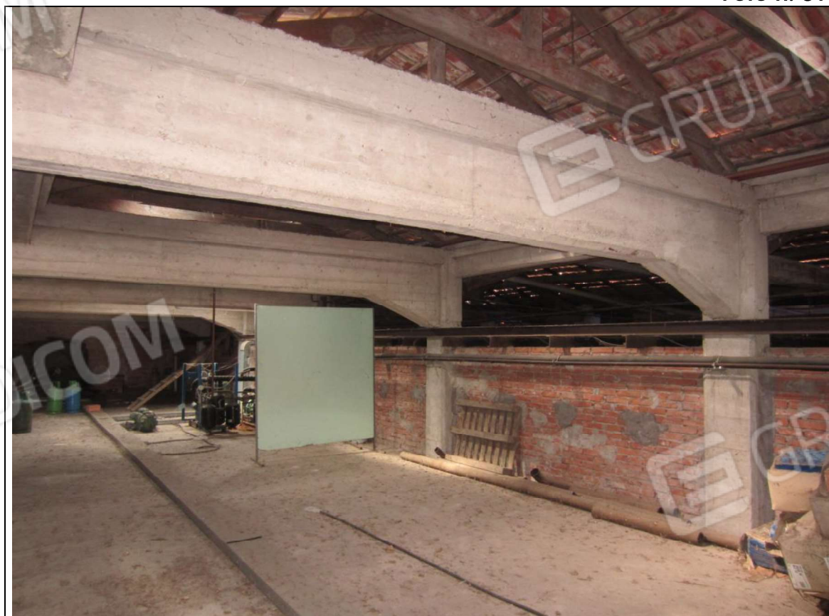
INTERNO UNITA' MAPP. 239 SUB 7 – PIANO PRIMO