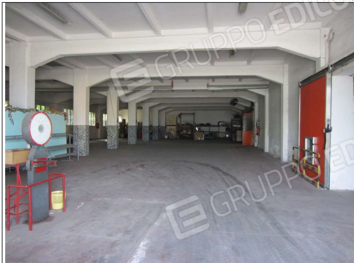
INTERNO MAGAZZINO-FRIGO-LAVORAZIONE MAPP. 239 SUB 5