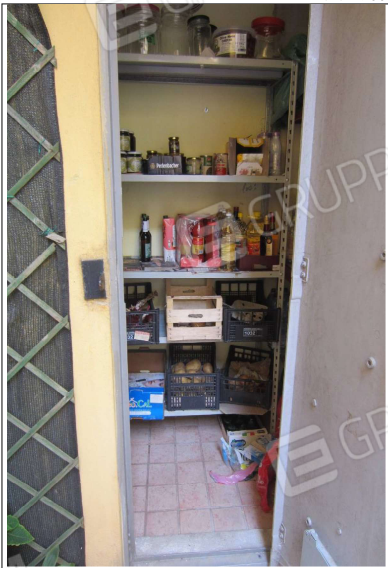
MANUFATTO INSISTENTE SU AREA MAPP. 239 SUB 8