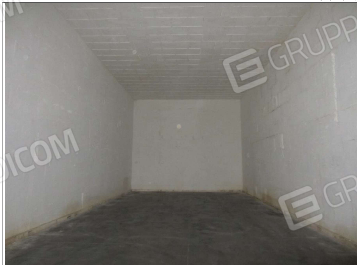
INTERNO MAGAZZINO-FRIGO-LAVORAZIONE MAPP. 239 SUB 5