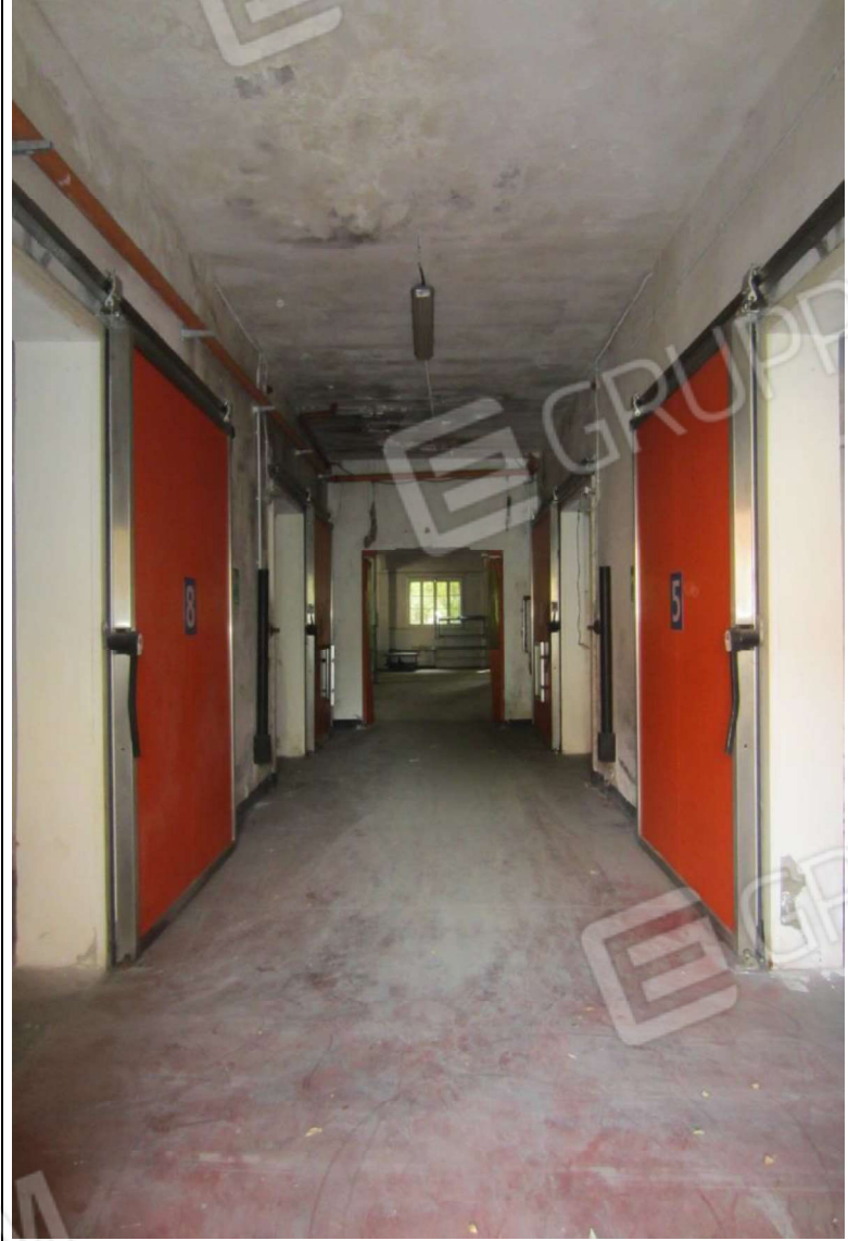
INTERNO MAGAZZINO-FRIGO-LAVORAZIONE MAPP. 239 SUB 5