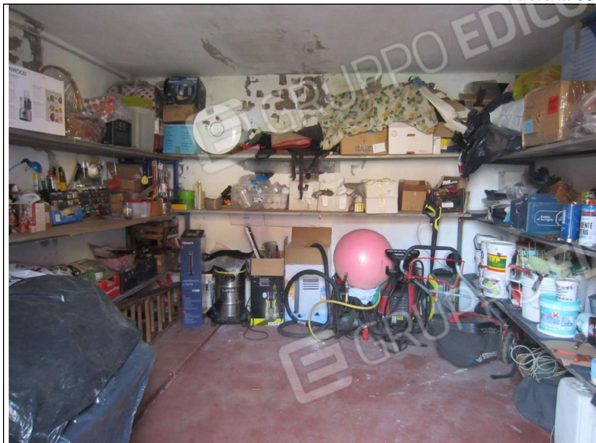
INTERNO MANUFATTO INSISTENTE SU AREA MAPP. 239 SUB 8