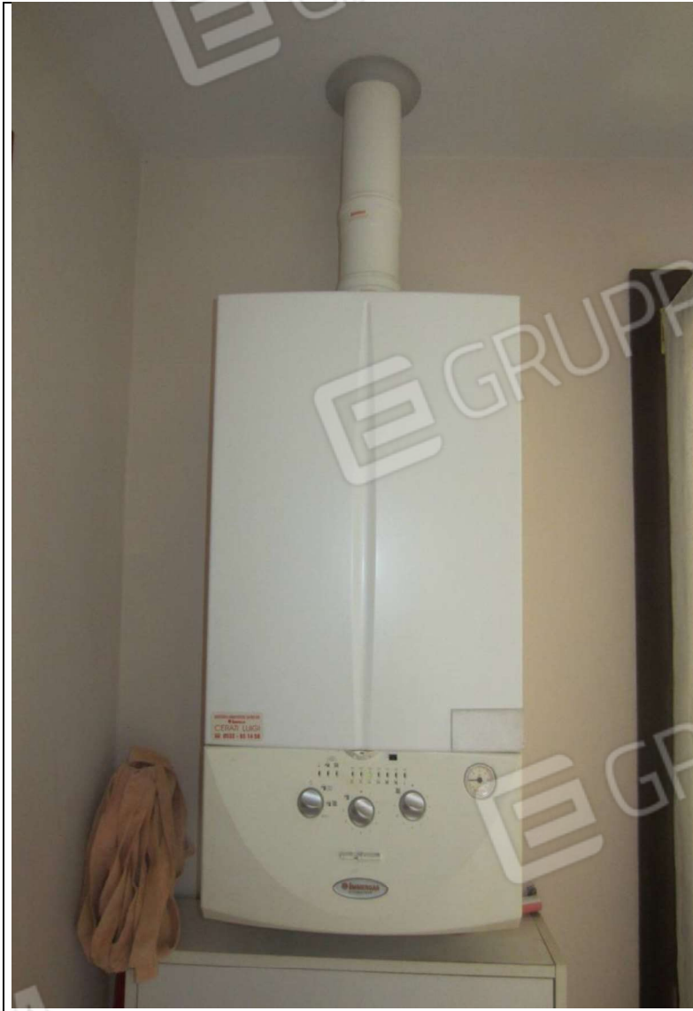
INTERNO UNITA' ABITATIVA MAPP. 239 SUB 6 - 35 SUB 28