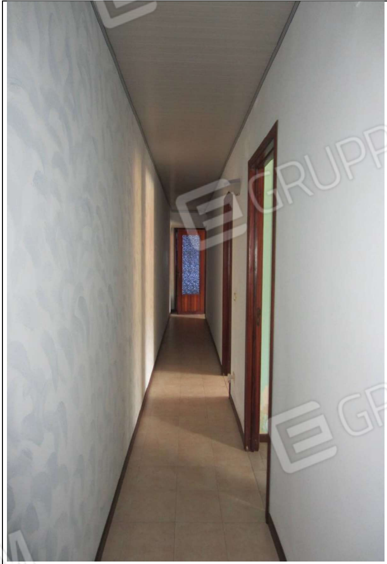
INTERNO UNITA' MAPP. 239 SUB 7 - PIANO PRIMO