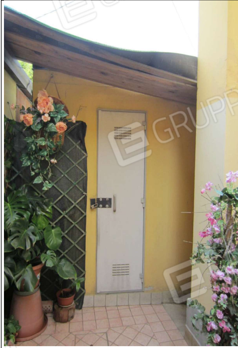
MANUFATTO INSISTENTE SU AREA MAPP. 239 SUB 8