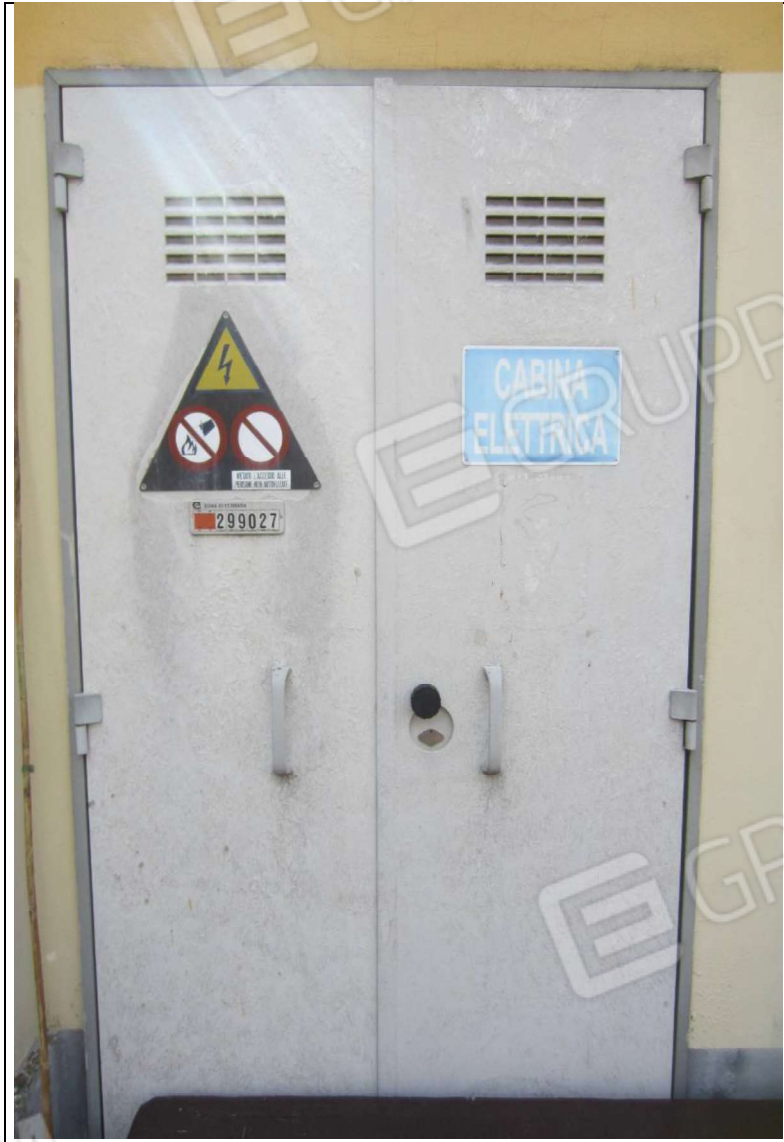
AREA URBANA MAPP. 237 SUB 1 (E SOVRASTANTE CABINA ELETT.)