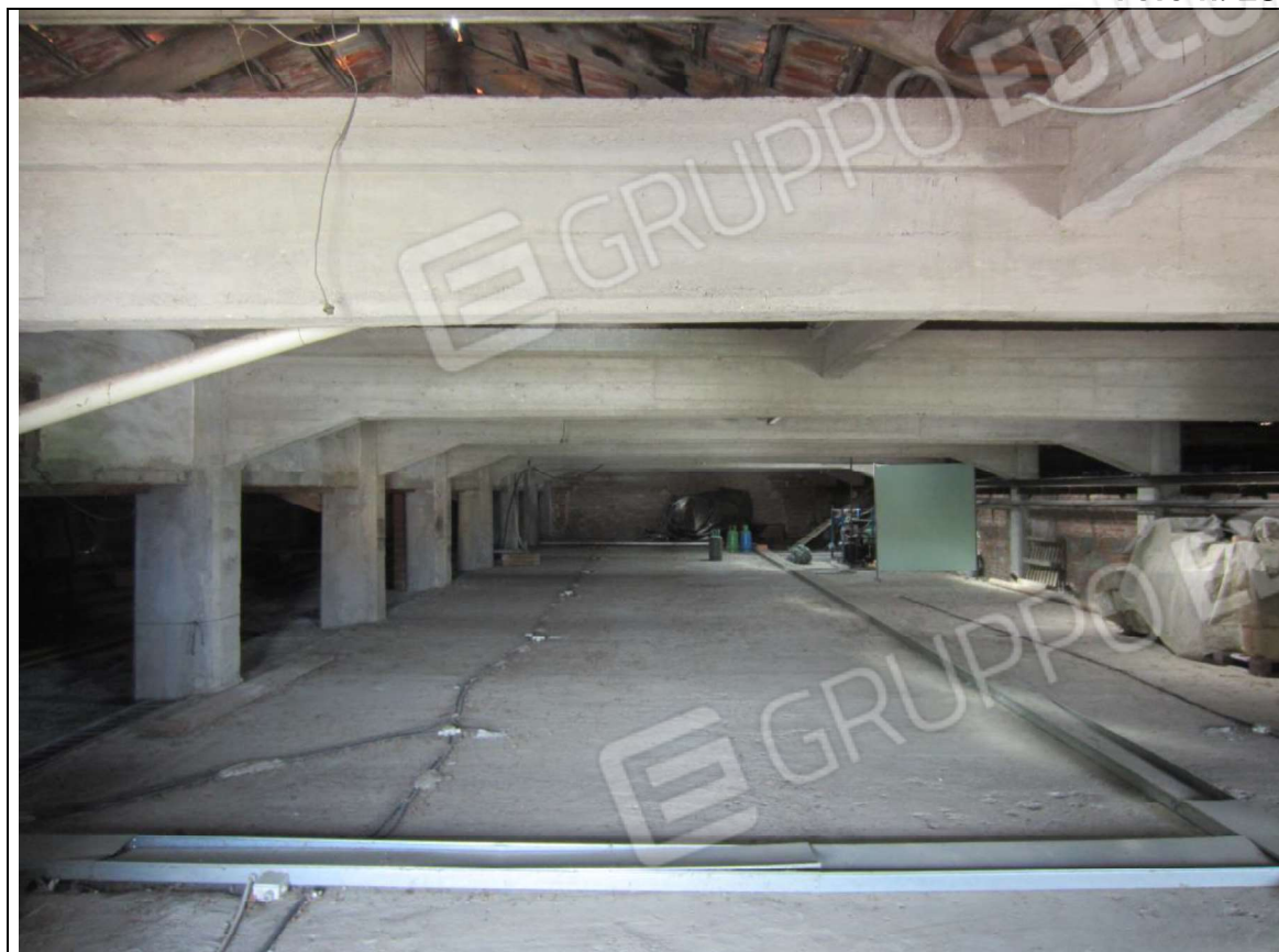
INTERNO UNITA' MAPP. 239 SUB 7 - PIANO PRIMO