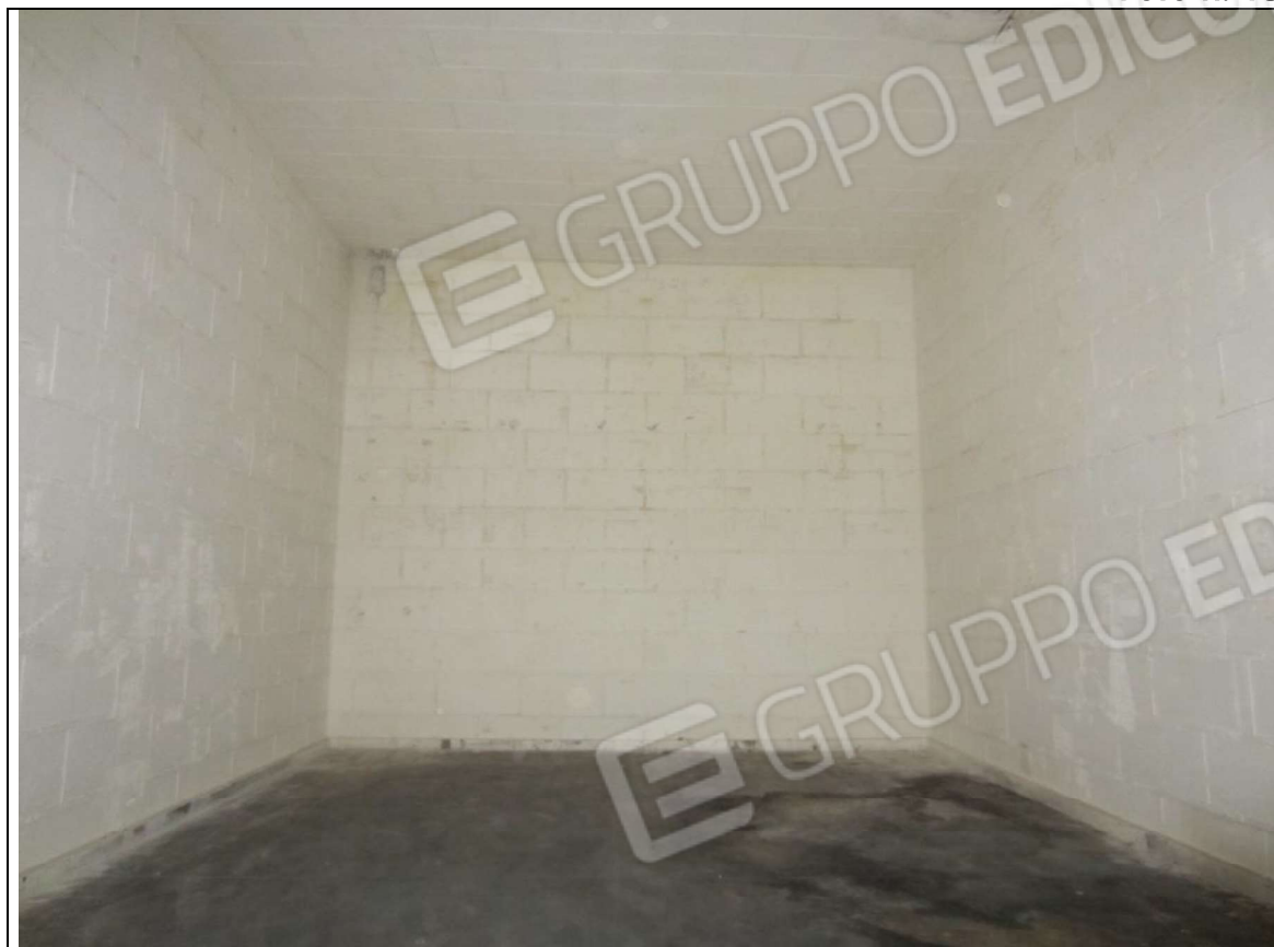
INTERNO MAGAZZINO-FRIGO-LAVORAZIONE MAPP. 239 SUB 5