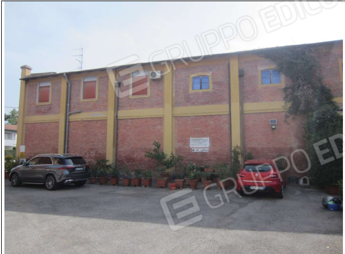
PROSPETTO GENERALE FABBRICATO CON LE UNITA' MAPPALI 239 SUB 5 E 239 SUB 7