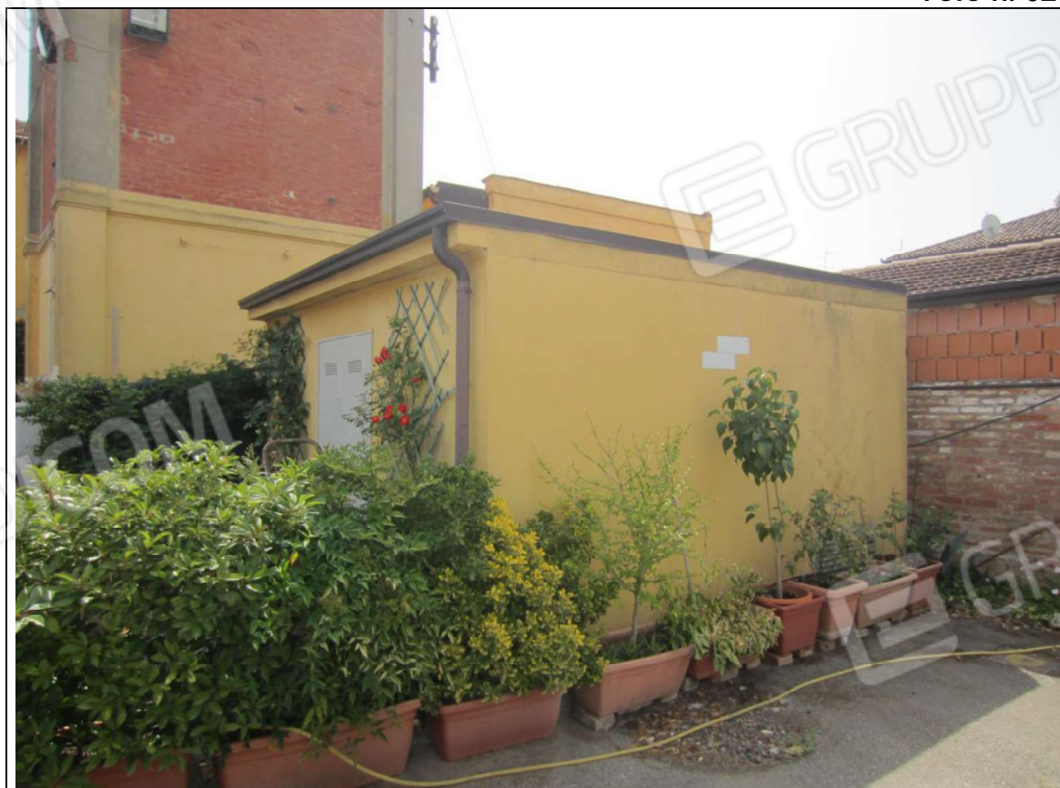
MANUFATTO INSISTENTE SU AREA MAPP. 239 SUB 8