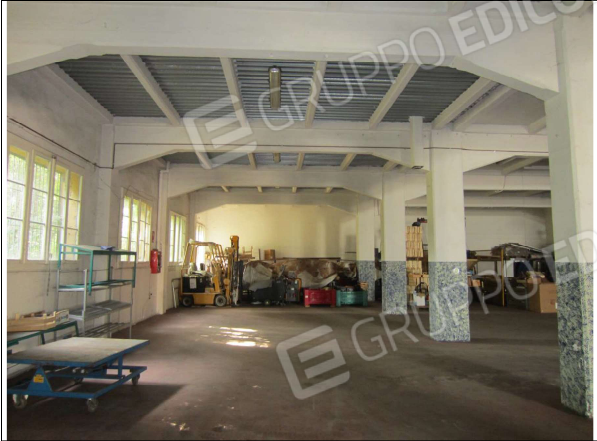
INTERNO MAGAZZINO-FRIGO-LAVORAZIONE MAPP. 239 SUB 5