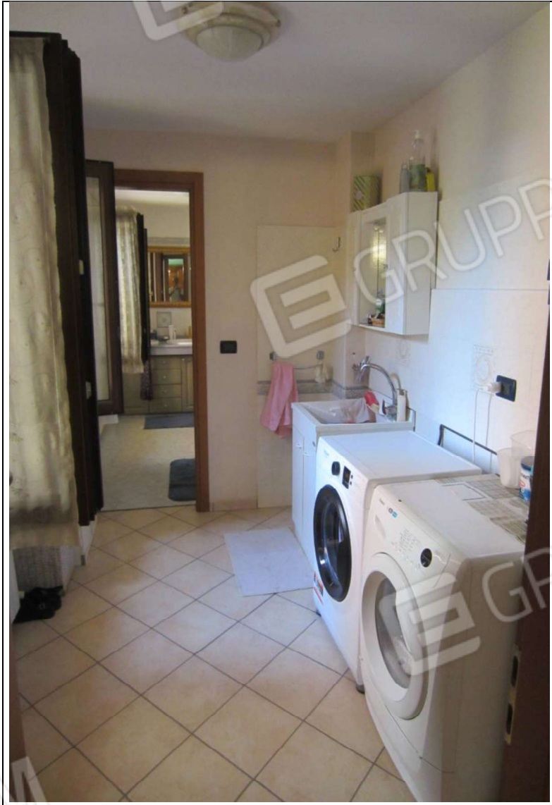
INTERNO UNITA' ABITATIVA MAPP. 239 SUB 6 - 35 SUB 28