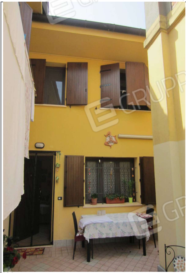
ESTERNO UNITA' ABITATIVA MAPP. 239 SUB 6 - 35 SUB 28