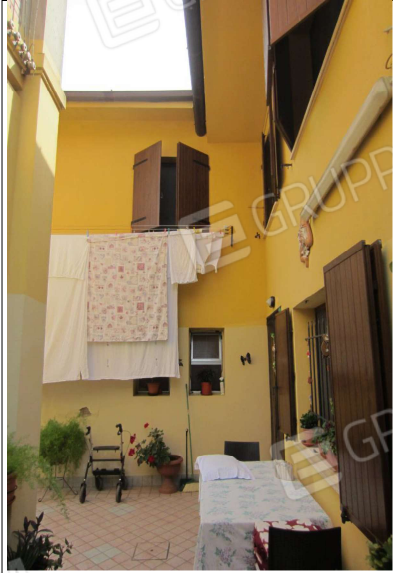
ESTERNO UNITA' ABITATIVA MAPP. 239 SUB 6 - 35 SUB 28