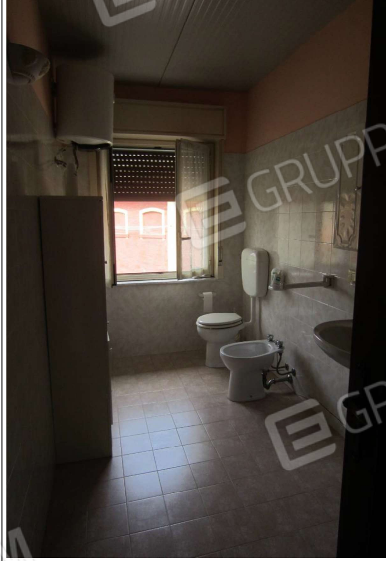
INTERNO UNITA' MAPP. 239 SUB 7 - PIANO PRIMO