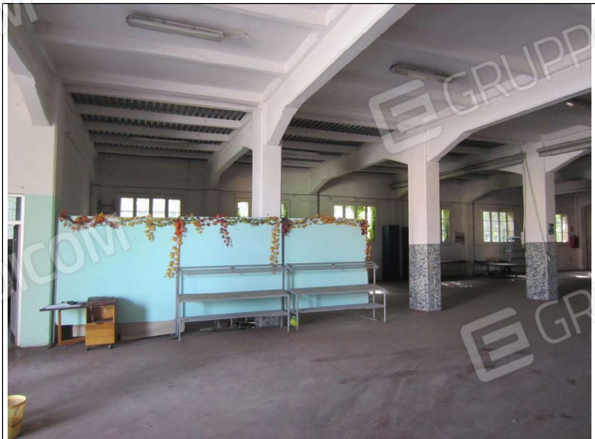
INTERNO MAGAZZINO-FRIGO-LAVORAZIONE MAPP. 239 SUB 5