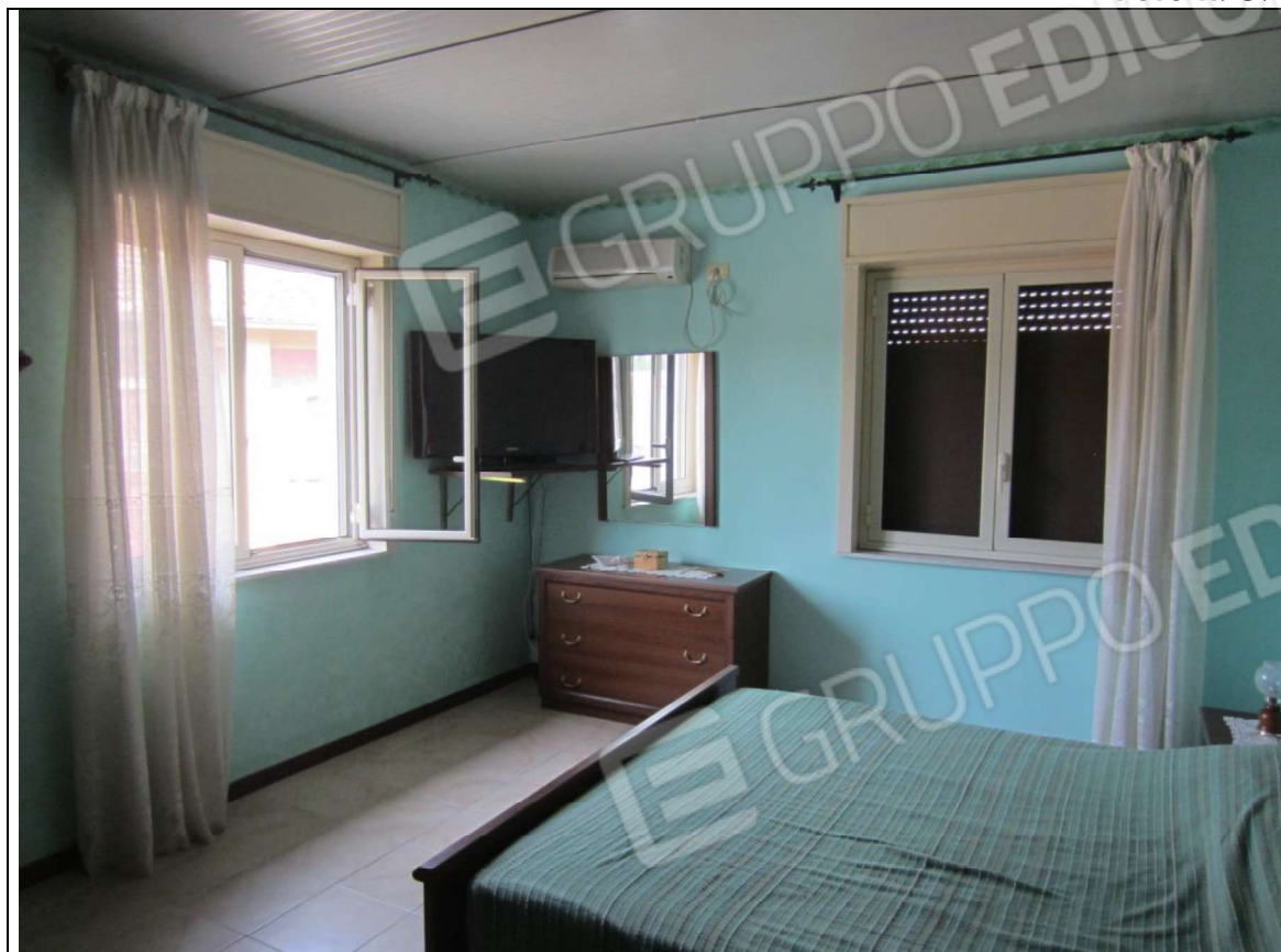
INTERNO UNITA' MAPP. 239 SUB 7 - PIANO PRIMO