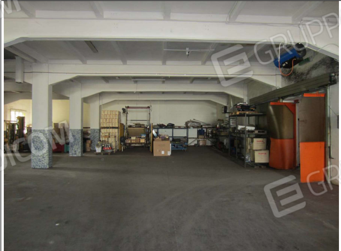
INTERNO MAGAZZINO-FRIGO-LAVORAZIONE MAPP. 239 SUB 5