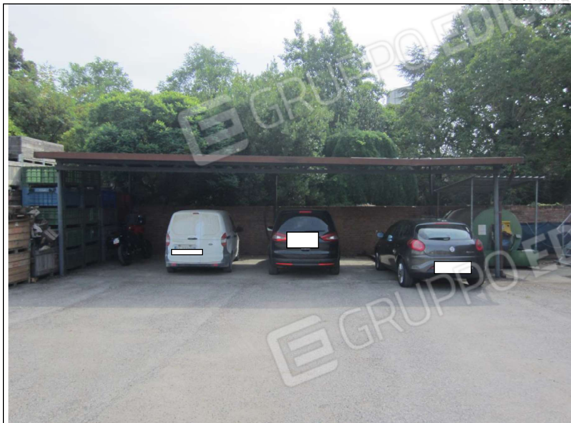
TETTOIA METALLICA MAPP. 239 SUB 9