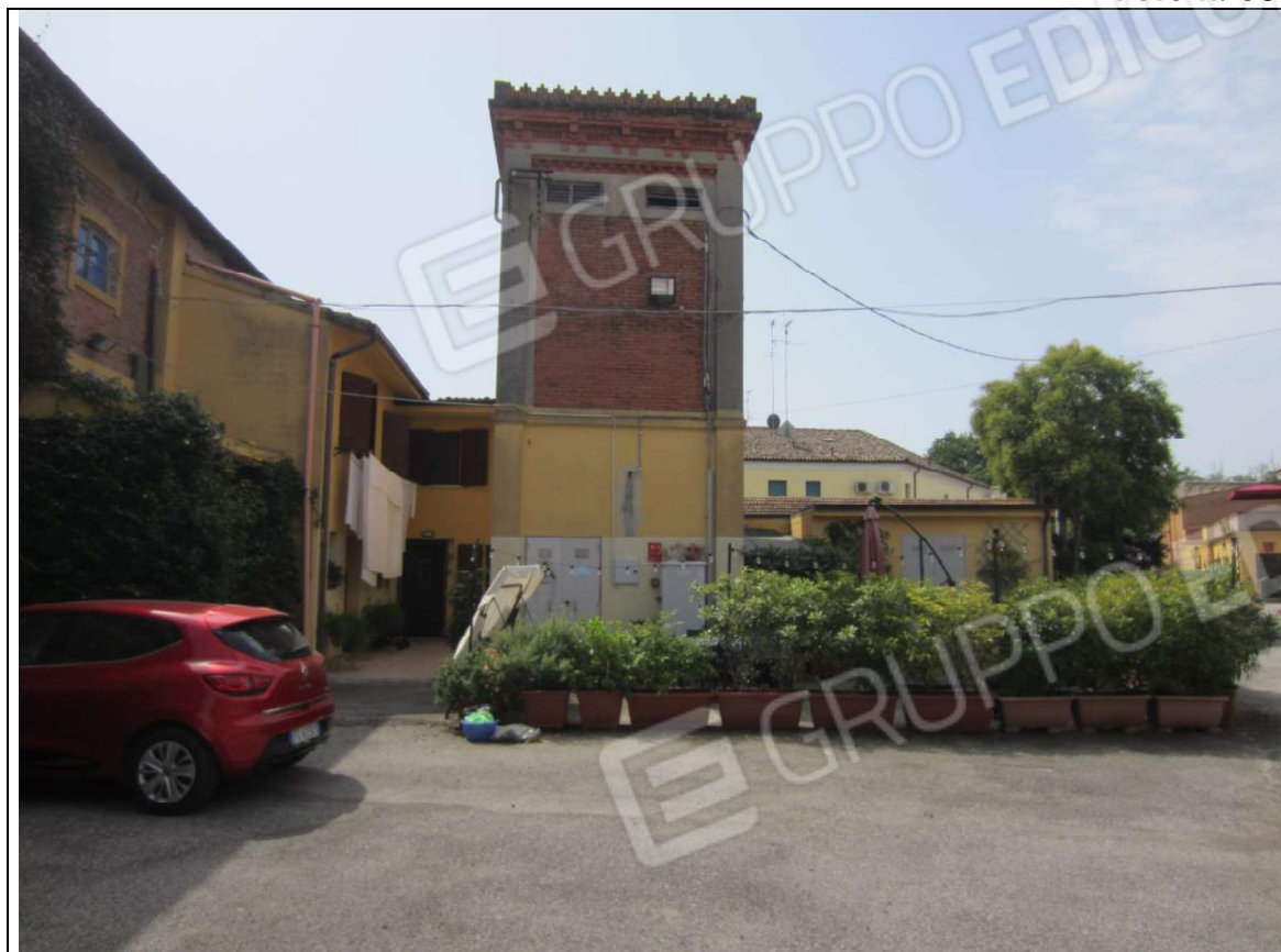
VEDUTA PROSPETTICA - AREA URBANA MAPP. 237 SUB 1 (E SOVRASTANTE CABINA ELETTRICA)