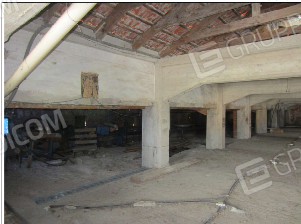
INTERNO UNITA' MAPP. 239 SUB 7 - PIANO PRIMO