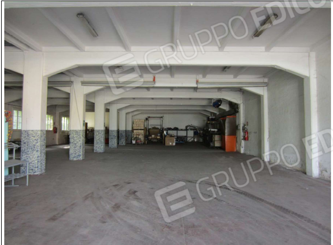
INTERNO MAGAZZINO-FRIGO-LAVORAZIONE MAPP. 239 SUB 5