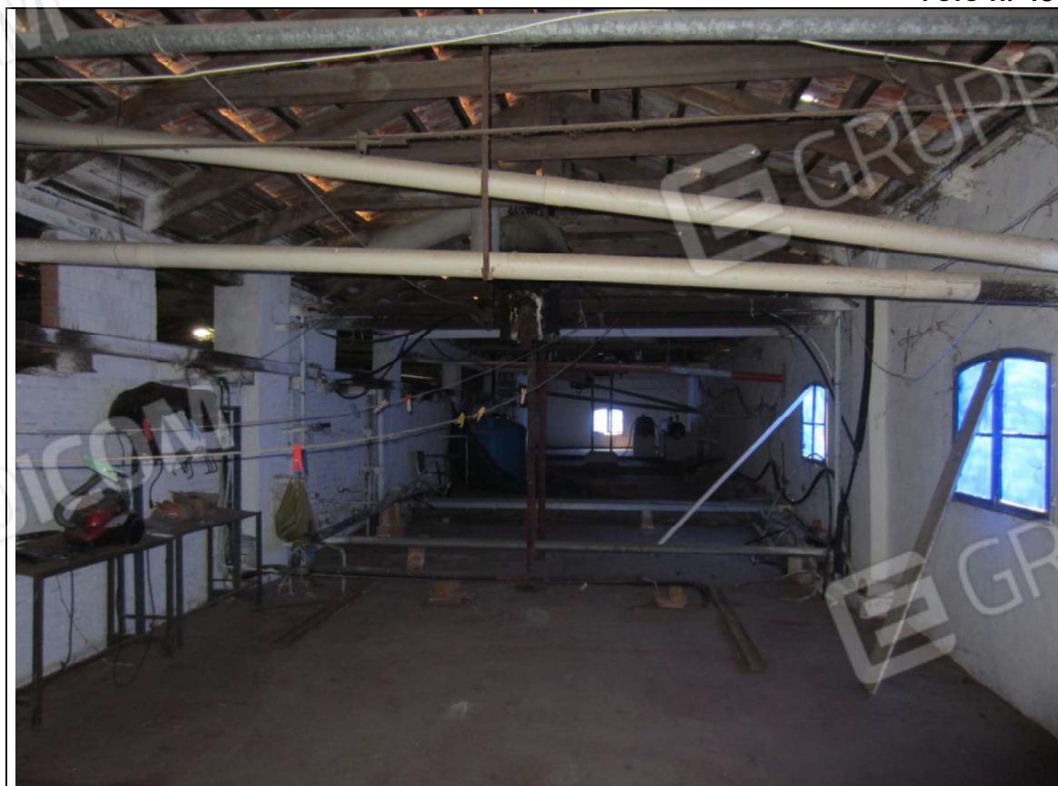
INTERNO UNITA' MAPP. 239 SUB 7 – PIANO PRIMO