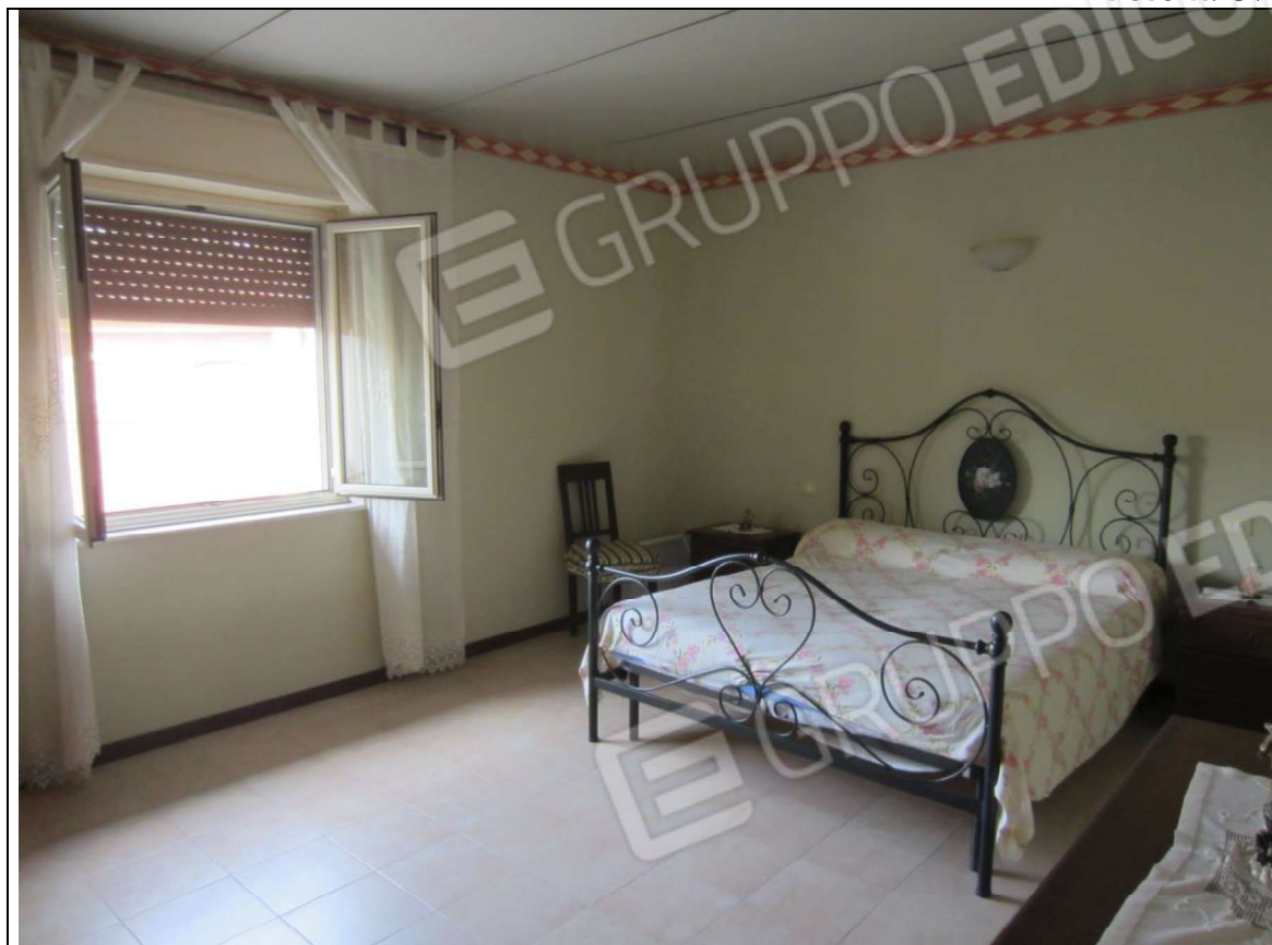
INTERNO UNITA' MAPP. 239 SUB 7 – PIANO PRIMO