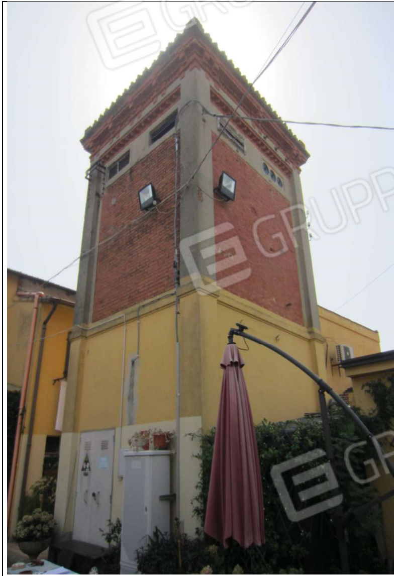
AREA URBANA MAPP. 237 SUB 1 (E SOVRASTANTE CABINA ELETR.)