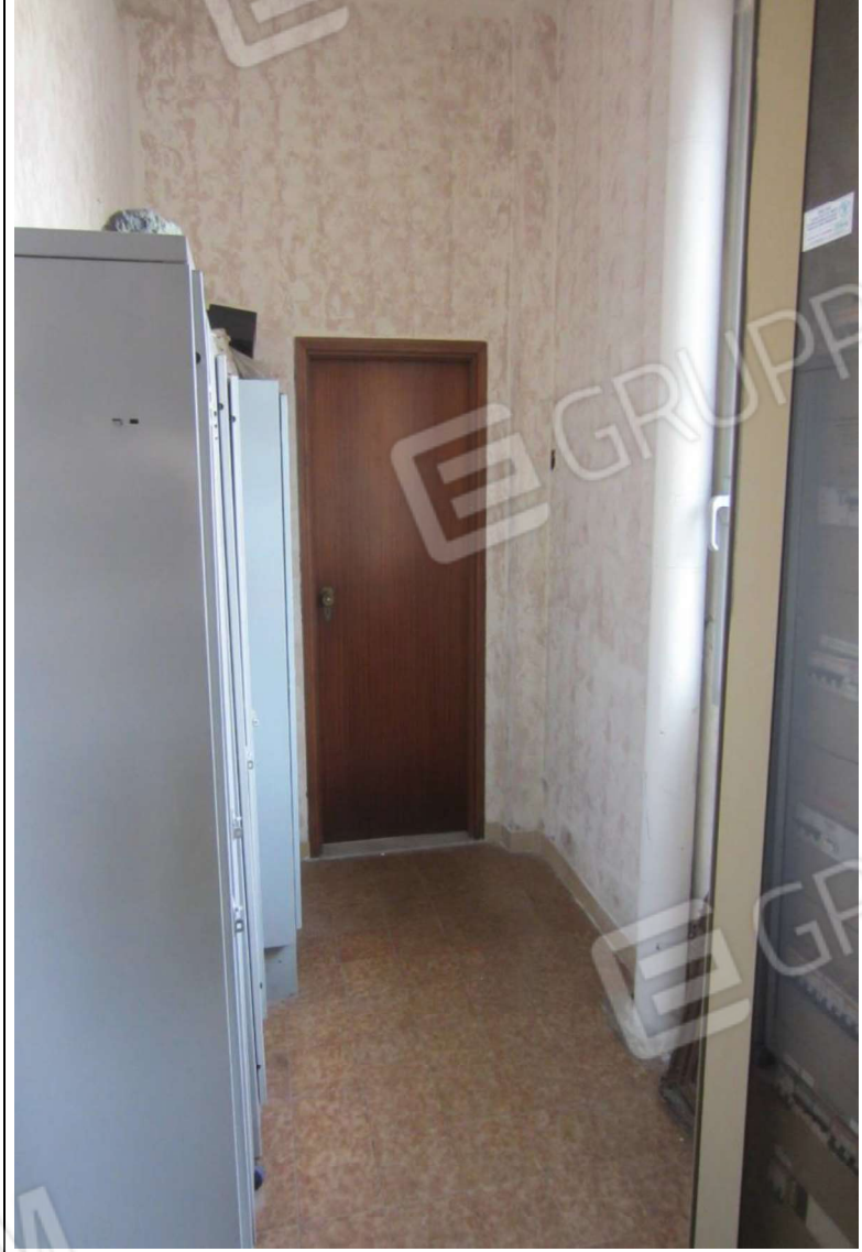
INTERNO MAGAZZINO-FRIGO-LAVORAZIONE MAPP. 239 SUB 5