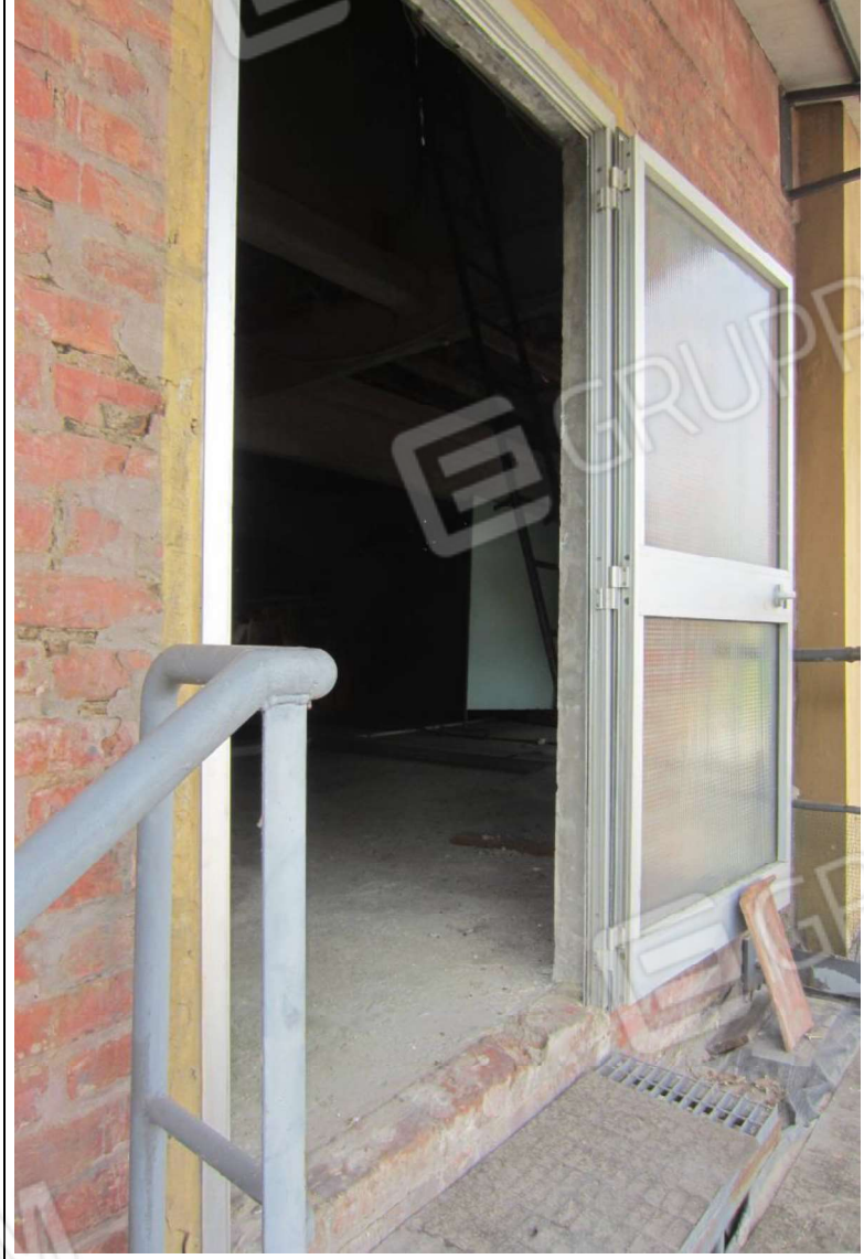
UNITA' MAPP. 239 SUB 7 – PIANO PRIMO