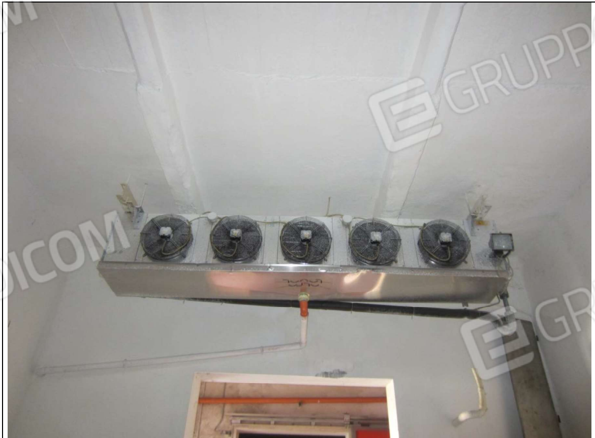
INTERNO MAGAZZINO-FRIGO-LAVORAZIONE MAPP. 239 SUB 5