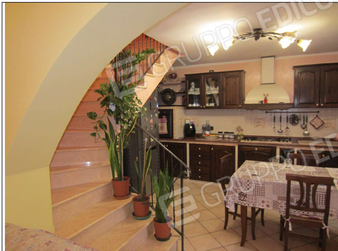
INTERNO UNITA' ABITATIVA MAPP. 239 SUB 6 - 35 SUB 28