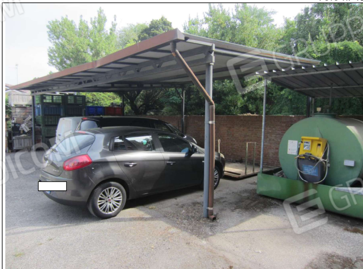
TETTOIA METALLICA MAPP. 239 SUB 9