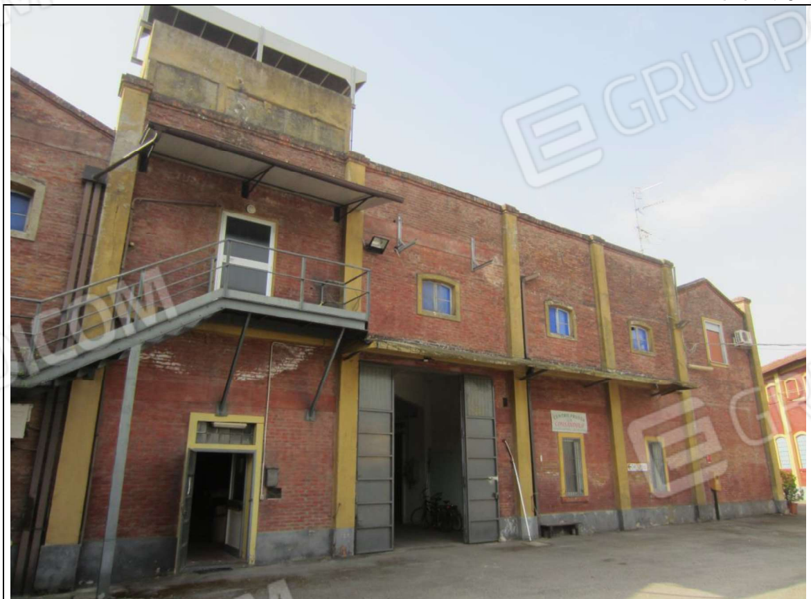
PROSPETTO GENERALE FABBRICATO CON LE UNITA' MAPPALI 239 SUB 5 E 239 SUB 7