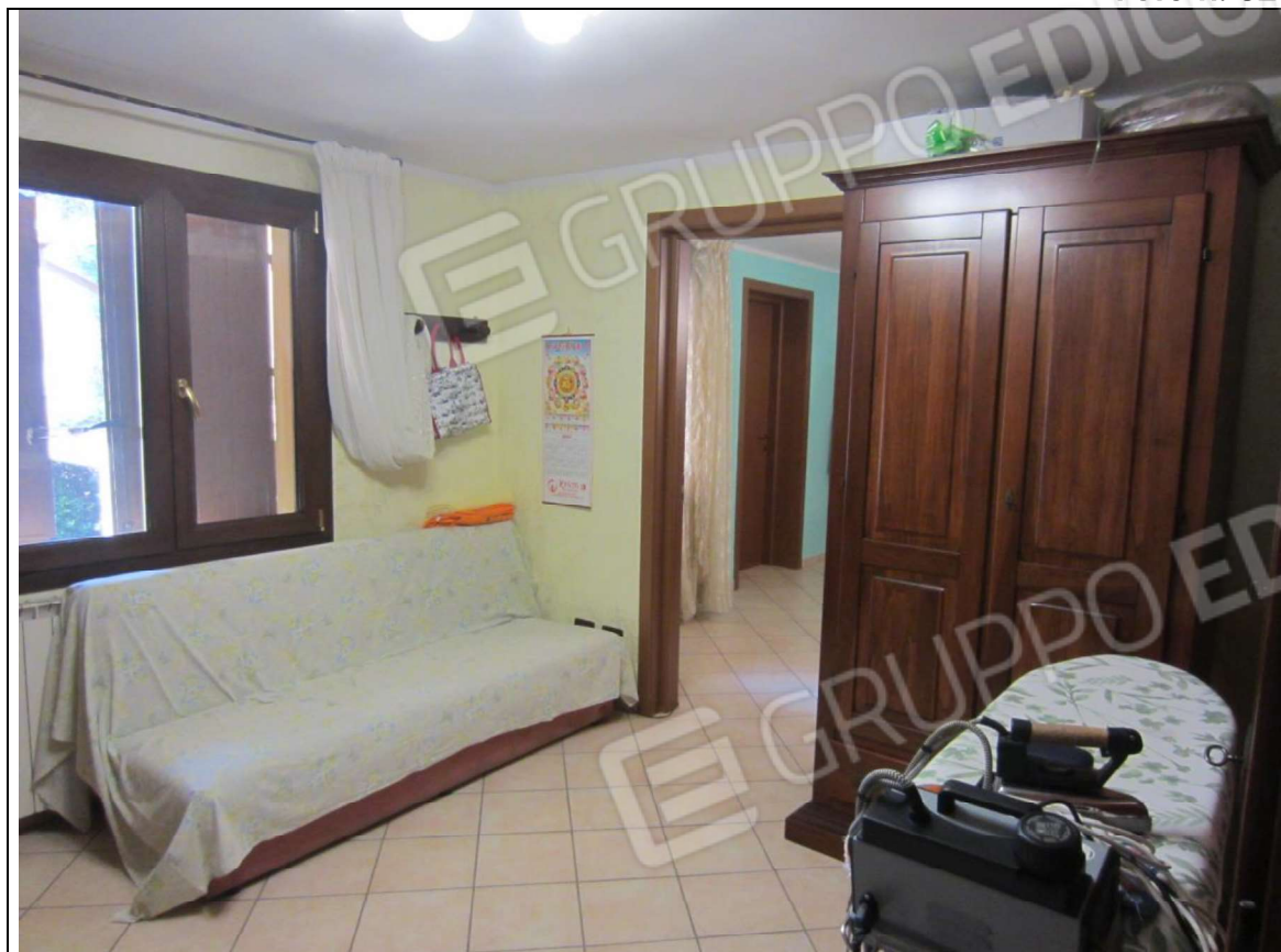
INTERNO UNITA' ABITATIVA MAPP. 239 SUB 6 - 35 SUB 28