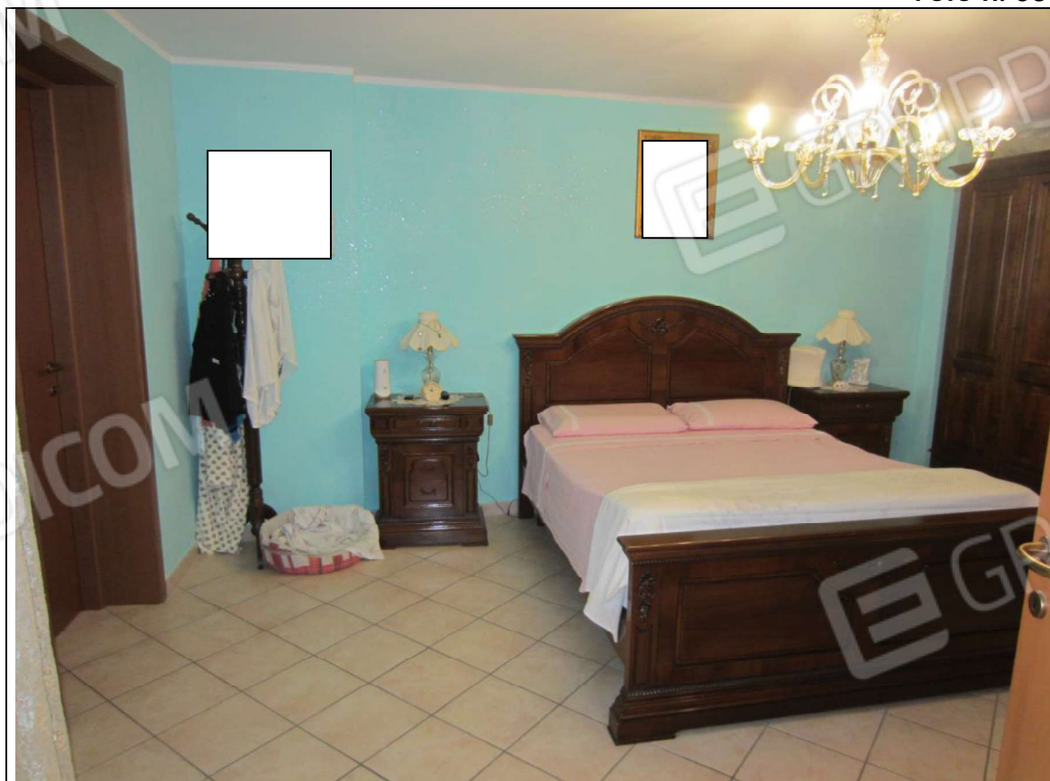
INTERNO UNITA' ABITATIVA MAPP. 239 SUB 6 - 35 SUB 28