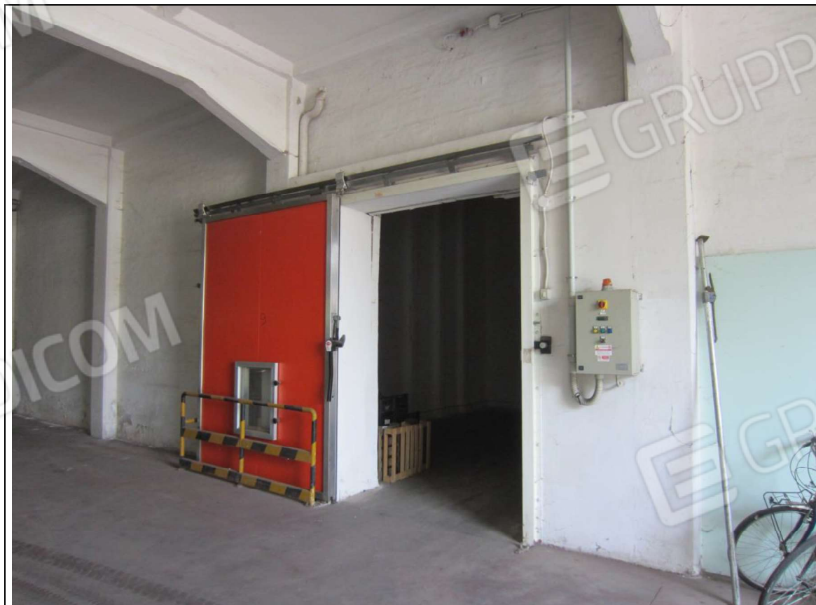
INTERNO MAGAZZINO-FRIGO-LAVORAZIONE MAPP. 239 SUB 5