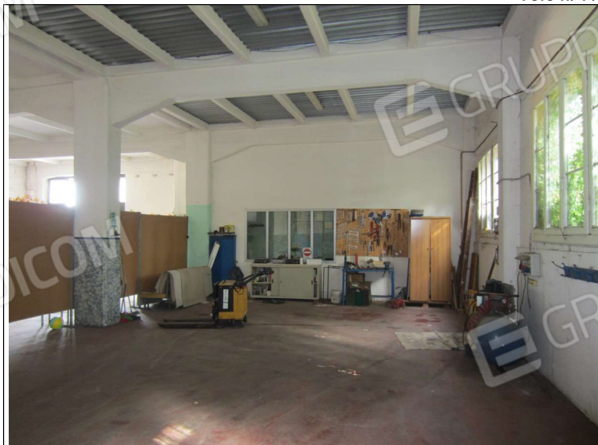
INTERNO MAGAZZINO-FRIGO-LAVORAZIONE MAPP. 239 SUB 5