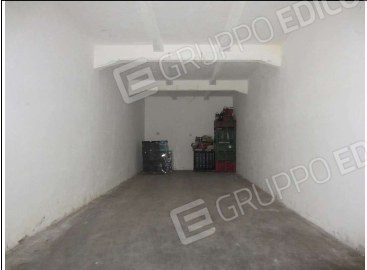
INTERNO MAGAZZINO-FRIGO-LAVORAZIONE MAPP. 239 SUB 5