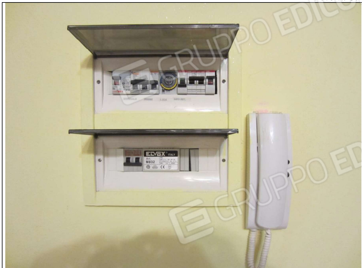
INTERNO UNITA' ABITATIVA MAPP. 239 SUB 6 - 35 SUB 28