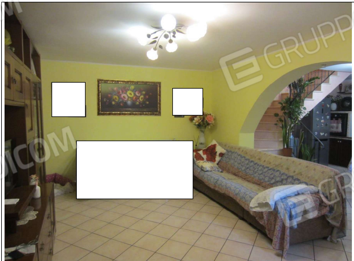
INTERNO UNITA' ABITATIVA MAPP. 239 SUB 6 - 35 SUB 28