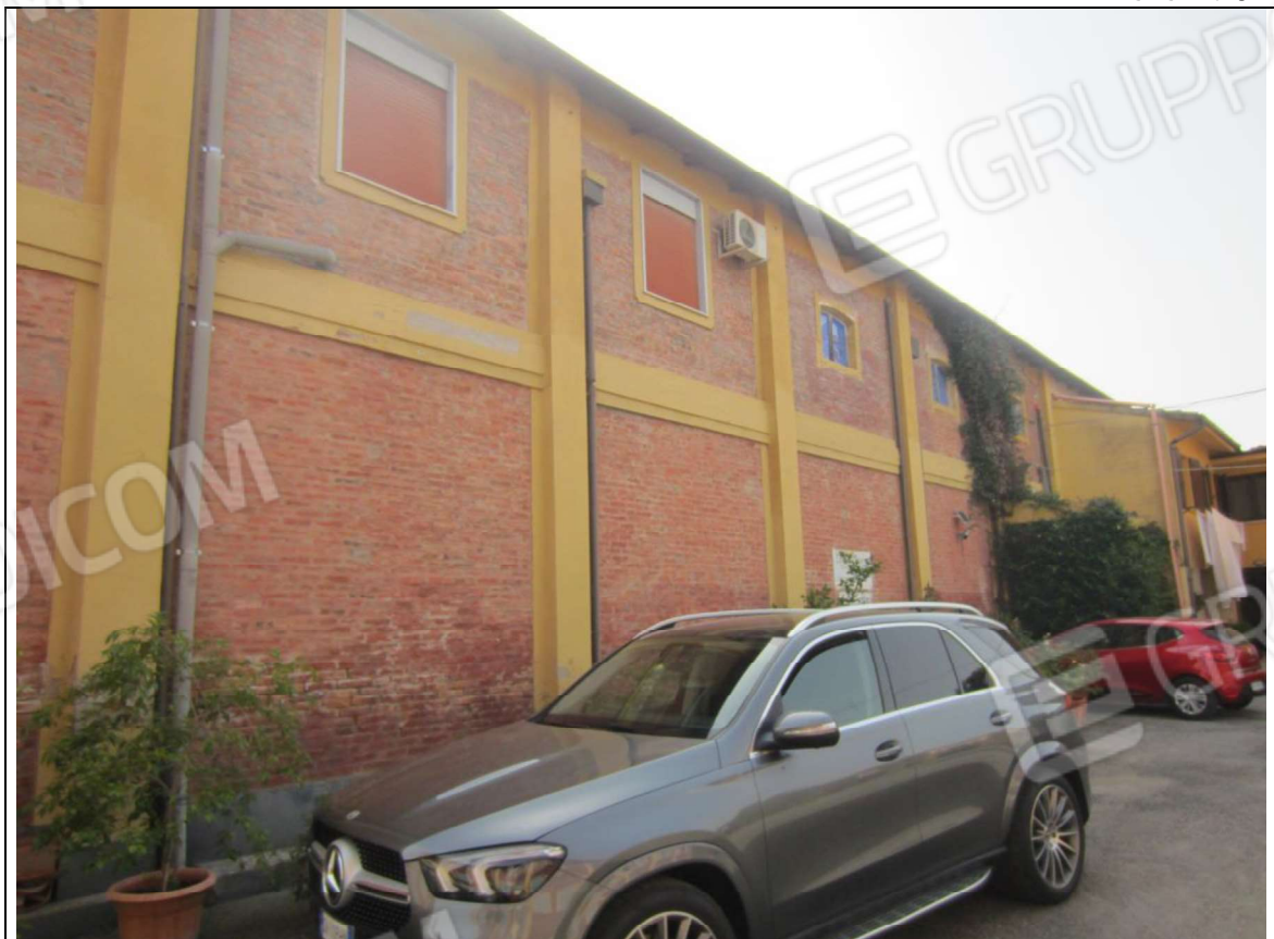
PROSPETTO GENERALE FABBRICATO CON LE UNITA' MAPPALI 239 SUB 5 E 239 SUB 7