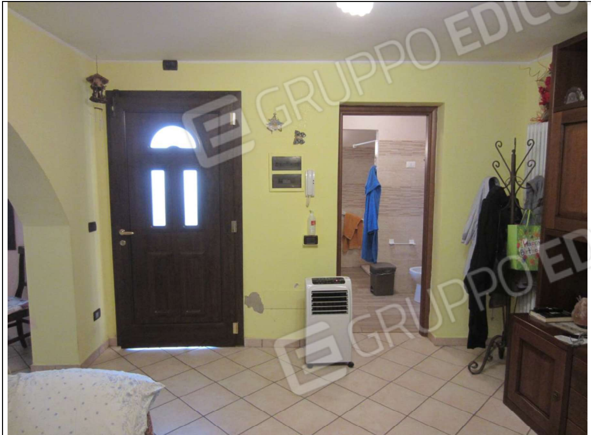
INTERNO UNITA' ABITATIVA MAPP. 239 SUB 6 - 35 SUB 28