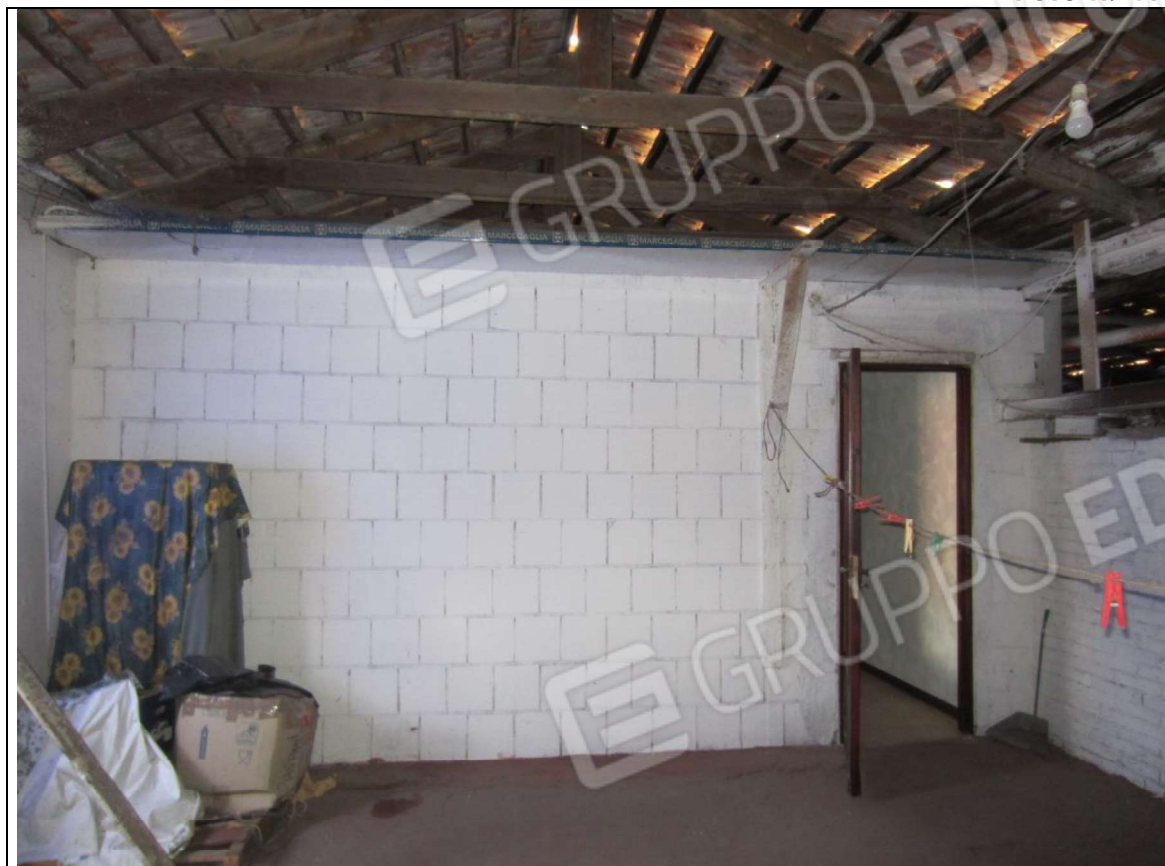
INTERNO UNITA' MAPP. 239 SUB 7 - PIANO PRIMO