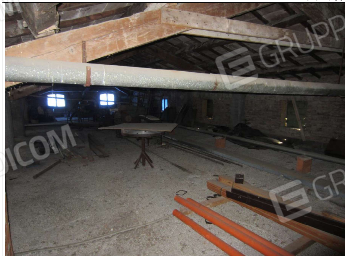
INTERNO UNITA' MAPP. 239 SUB 7 - PIANO PRIMO