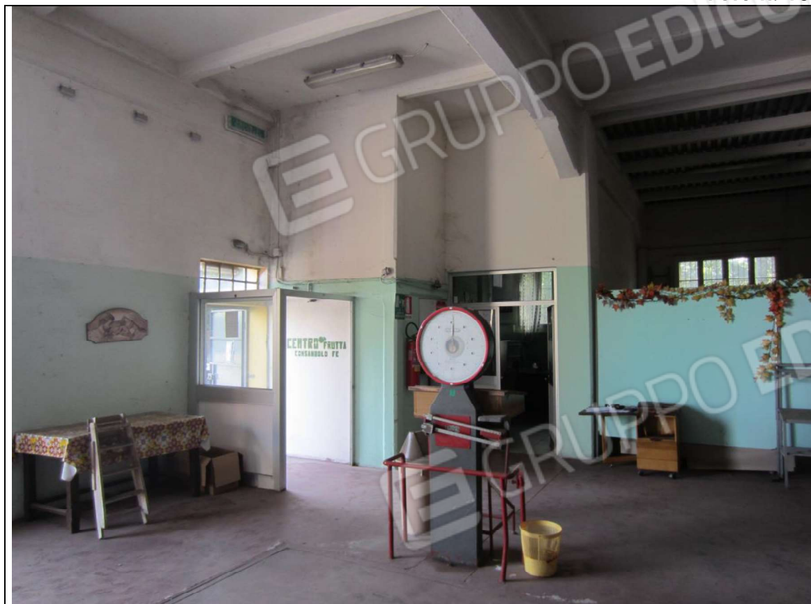
INTERNO MAGAZZINO-FRIGO-LAVORAZIONE MAPP. 239 SUB 5