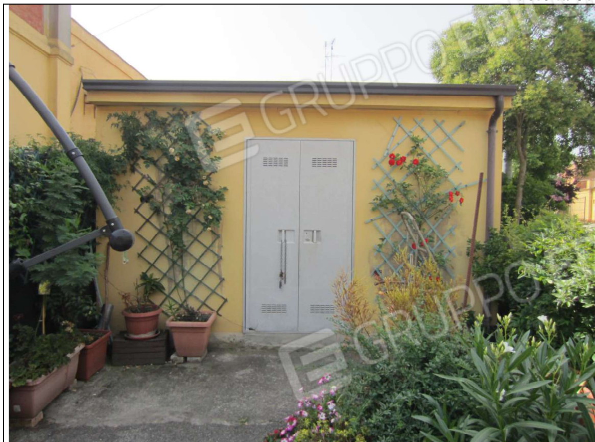
MANUFATTO INSISTENTE SU AREA MAPP. 239 SUB 8