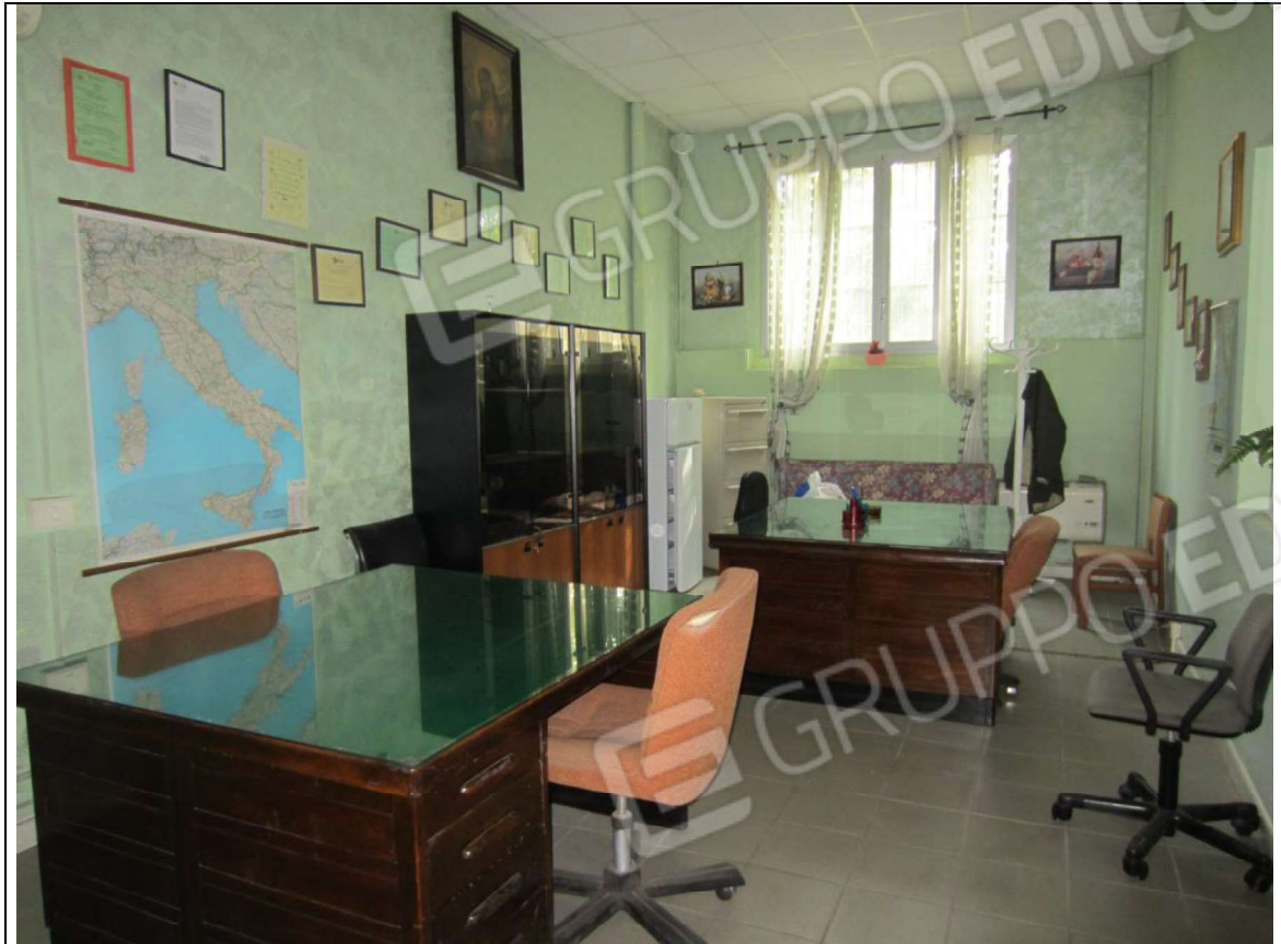
INTERNO MAGAZZINO-FRIGO-LAVORAZIONE MAPP. 239 SUB 5