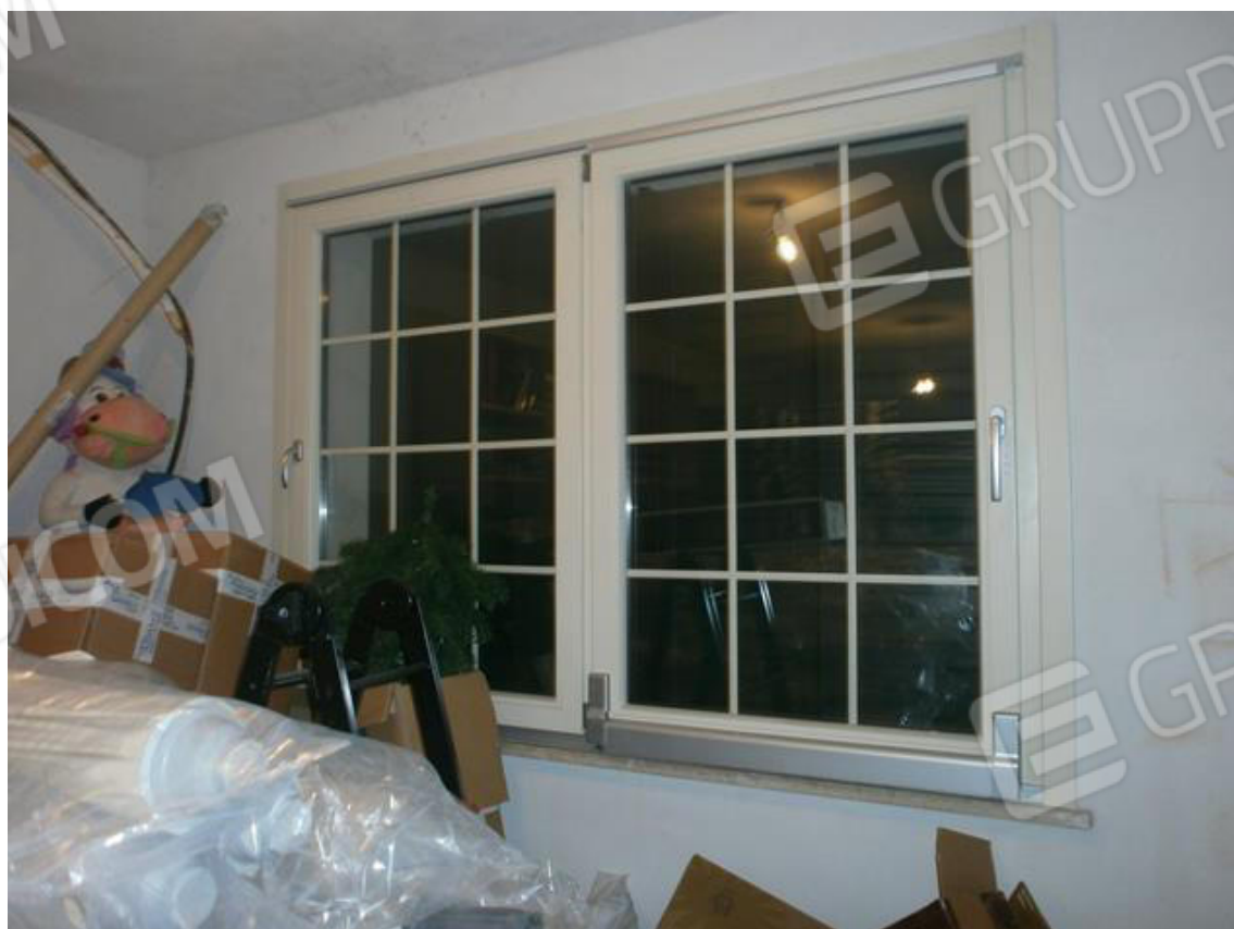
FOTO 10. Abitazione piano terra/rialzato: infissi del locale soggiorno/pranzo.