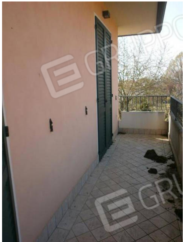
FOTO 18 e 19. Abitazione camera da letto con asola per la scala di accesso al piano sottotetto; terrazzo