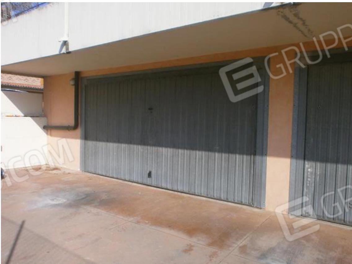
FOTO 21. Garage di pertinenza del LOTTO DUE: portone basculante di accesso