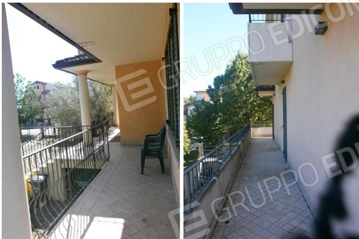
FOTO 8 e 9. Abitazione piano terra/rialzato: portici sul fronte e terrazzo perimetrale