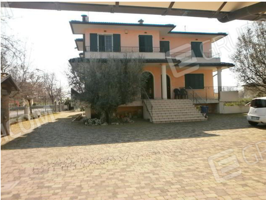
FOTO 2. Fabbricato bifamiliare: prospetto principale con gli accessi alle due abitazioni