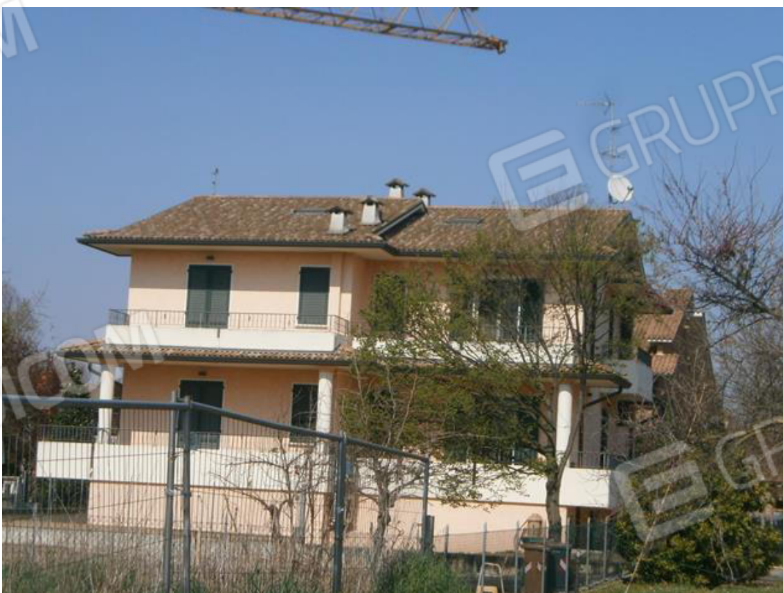
FOTO 4. Fabbricato bifamiliare: vista del retro dalla proprietà adiacente