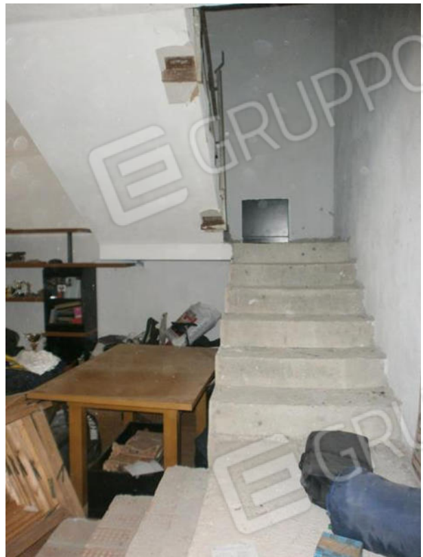
FOTO 12 e 13. Abitazione piano terra/rialzato: bagno e scala che sale al piano primo