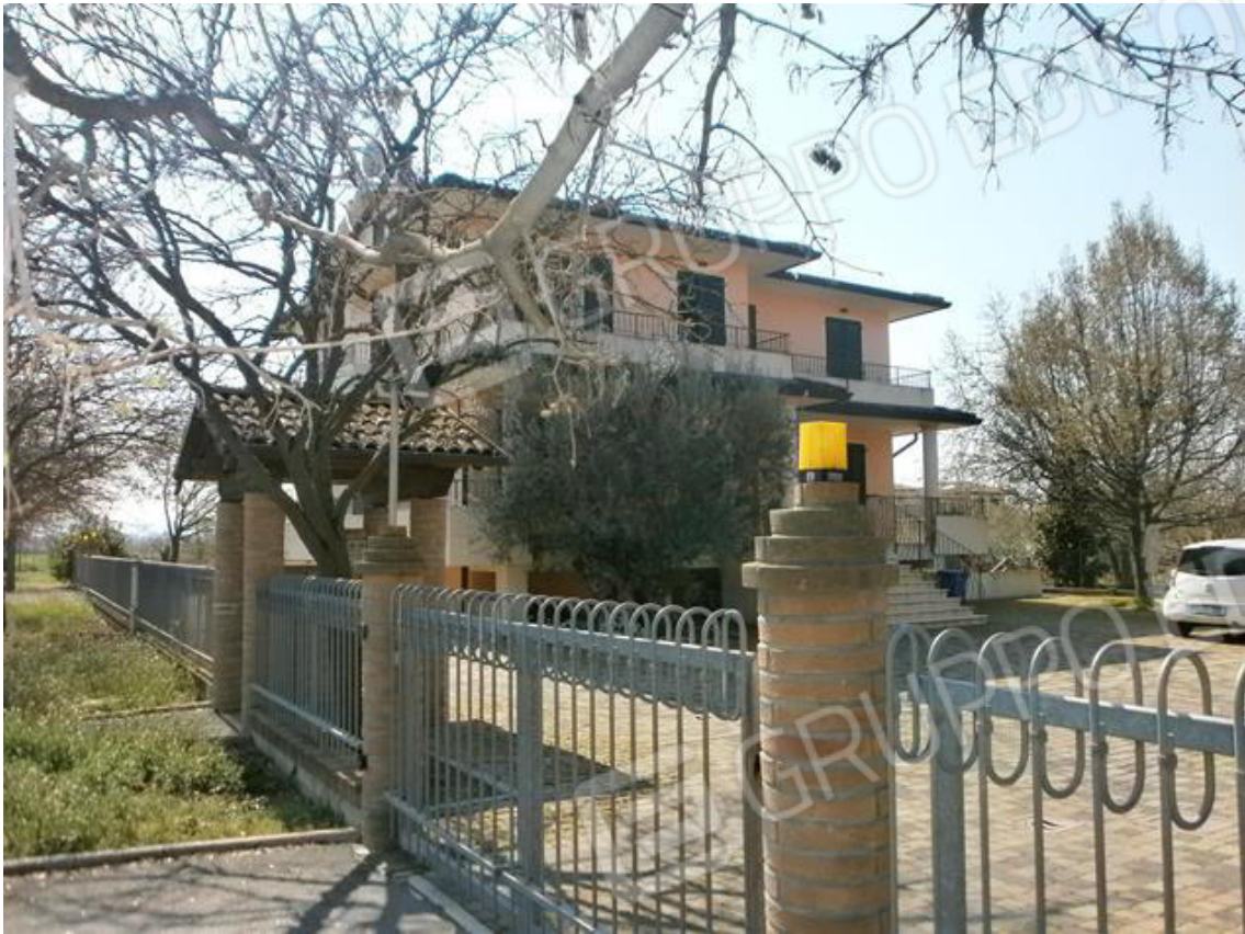
FOTO 1. Vista del fabbricato bifamiliare dalla Via Fernanda Viroli