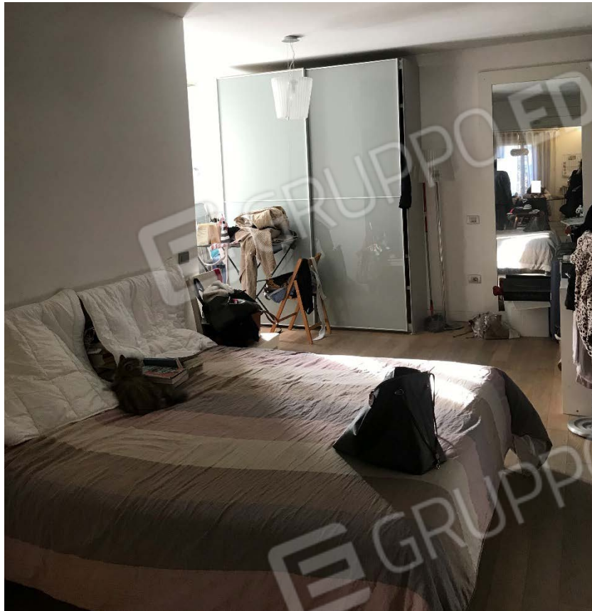
Vista zona notte