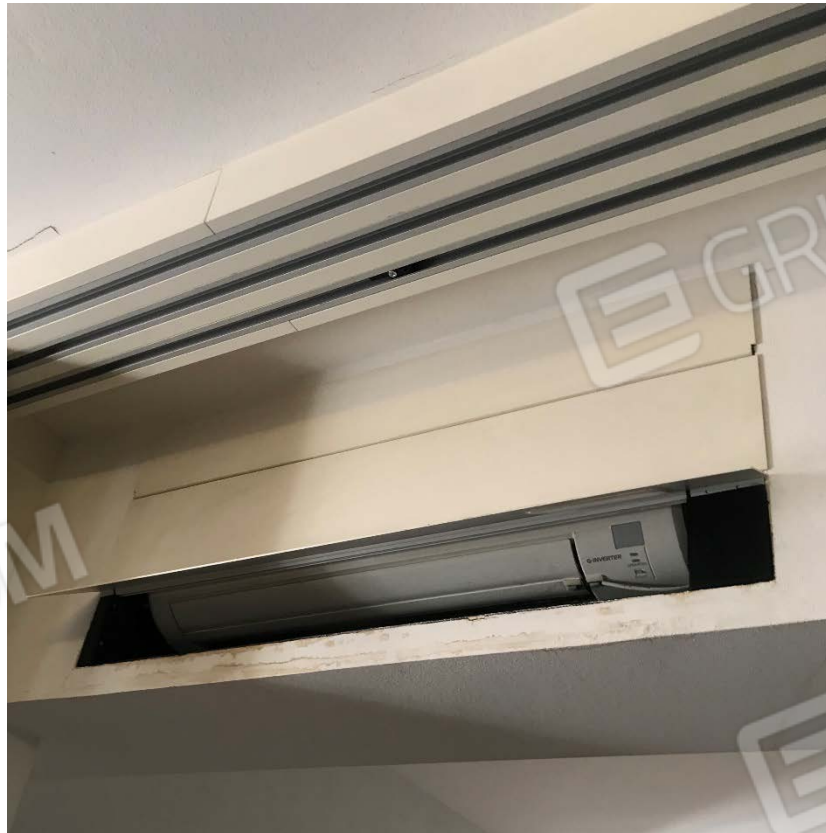
Split aria condizionata