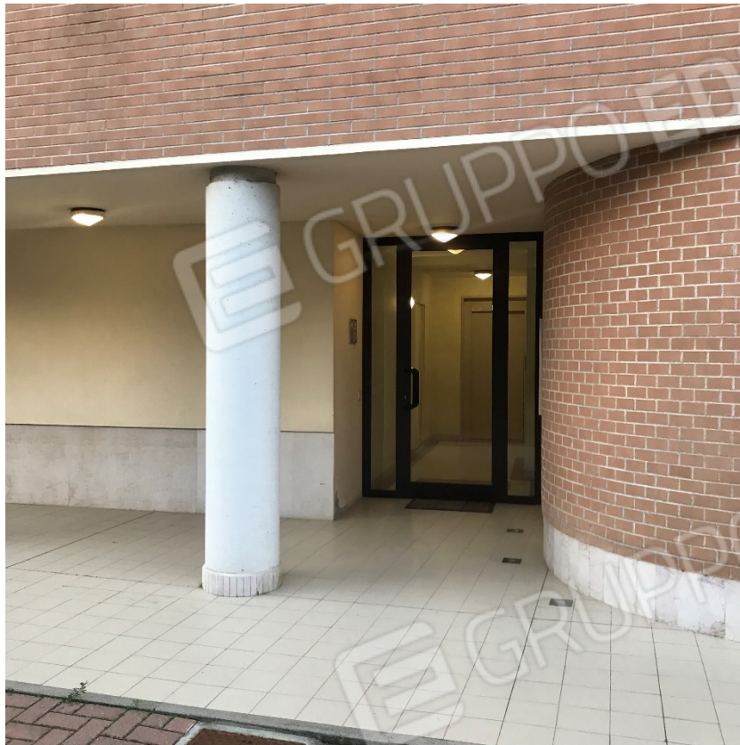
Ingresso al fabbricato