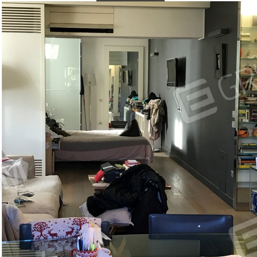
Vista interna con pannello divisorio in legno