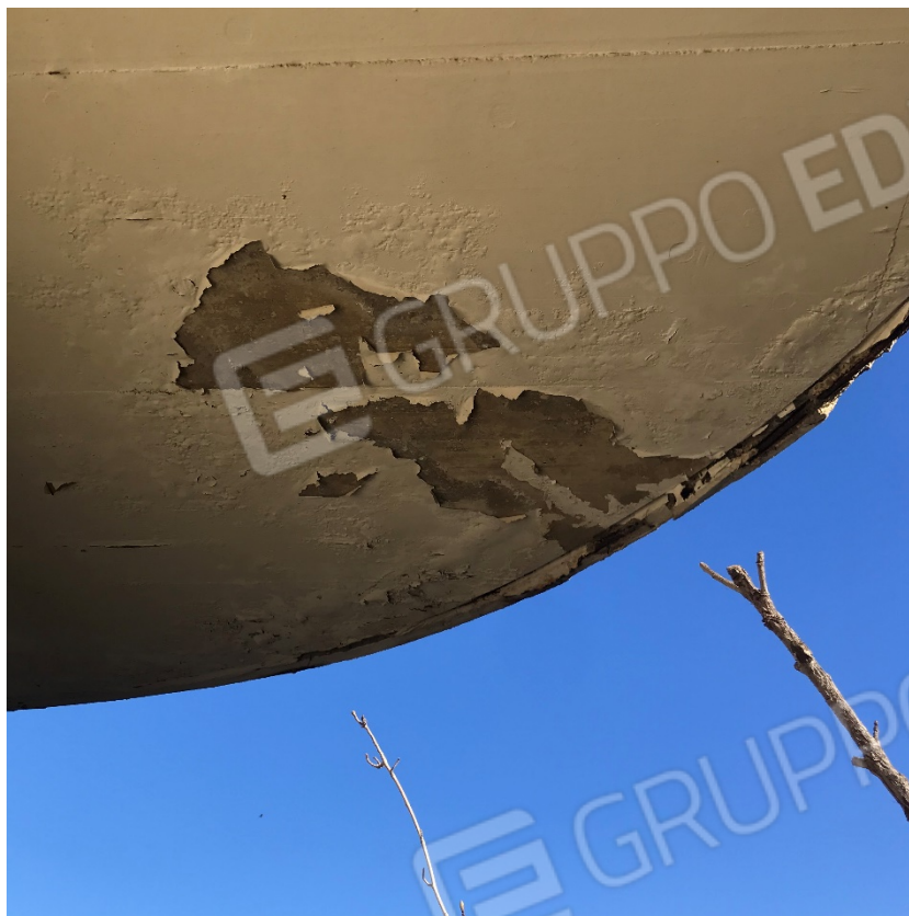
Danneggiamento intonaco del celino balcone soprastante