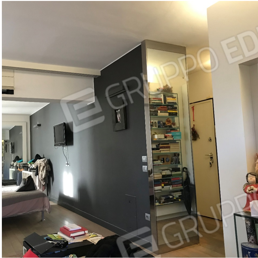
Ingresso dell'unità abitativa