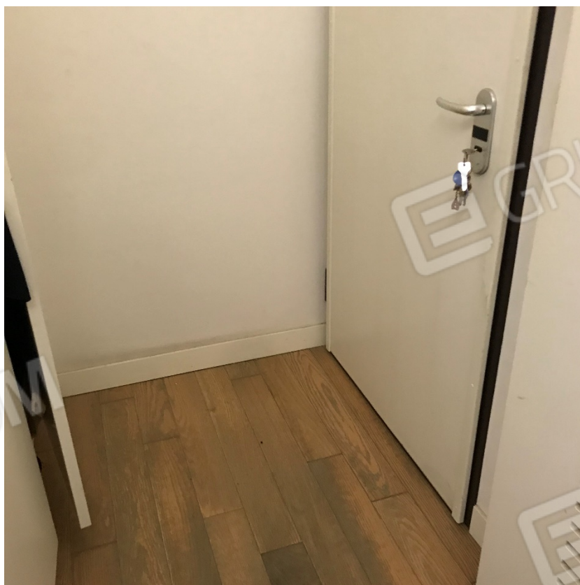
Accesso all'unità tramite portoncino blindato