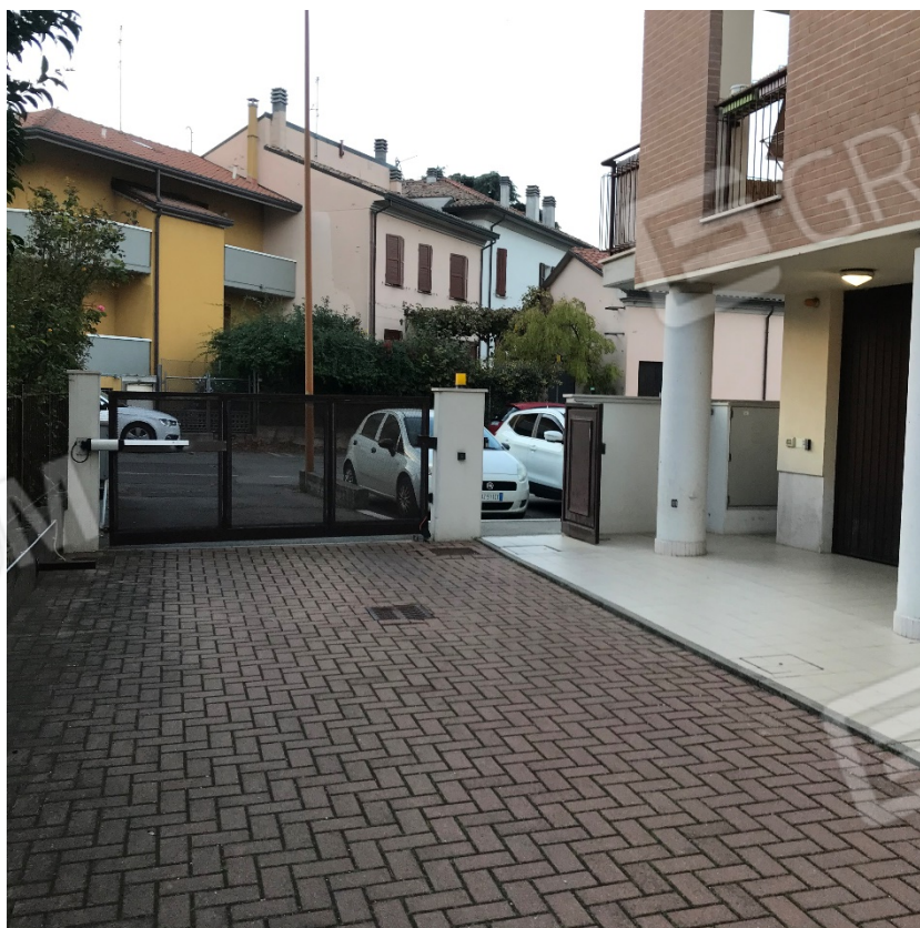
Accesso alla corte condominiale