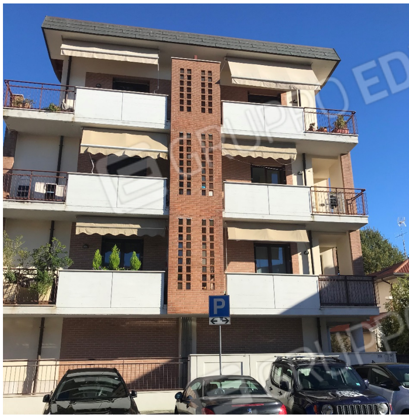
Foto esterna che ritrae il fronte del fabbricato che comprende l'unità oggetto di procedura