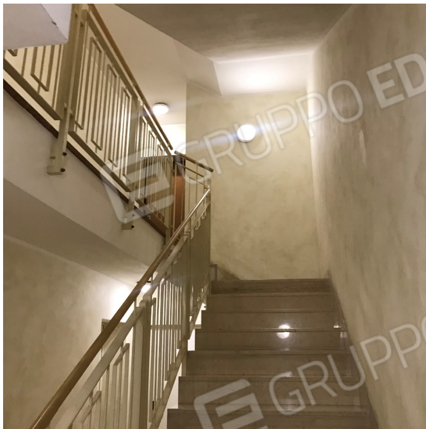
Vano scala comune