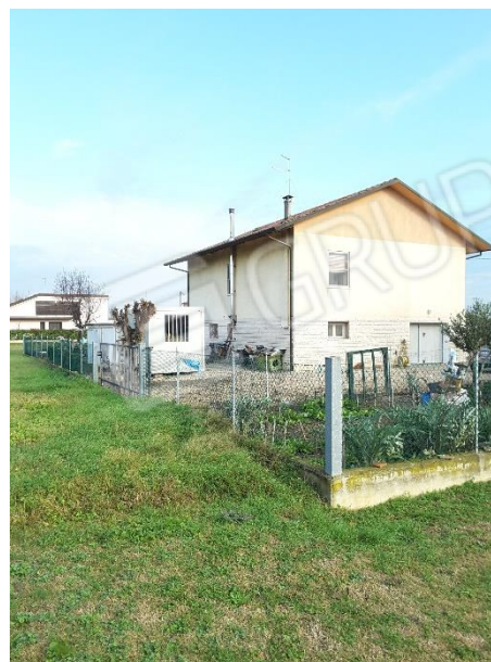
Vista delimitazioni sul lato interno a confine con la proprietà delle particelle 715 e 716