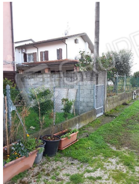
Vista accesso carrabile in confine con la particella 75; e vista accesso pedonale in confine con la particella 74