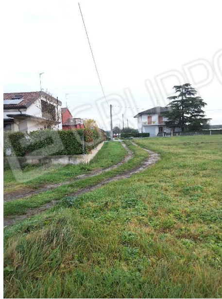
Vista delimitazioni del terreno sul lato in confine con la proprietà delle particelle 38, 957 e 958