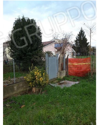
Vista delimitazioni sul lato in confine con la proprietà delle particelle 675 e 684