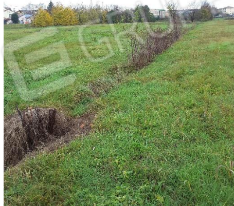
Vista delimitazioni sul lato in confine con la proprietà della particella 843, 842, 841, 854, 839