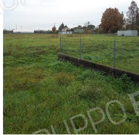
Vista delimitazioni sul lato in confine con la proprietà della particella 789, 837 e 836