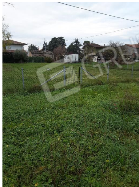
Vista delimitazioni sul lato in confine con la proprietà della particella 718

-Geom. Galassi Giampiero- Via Giordano Bruno n° 160-Cesena (FC) Mail: geom.galassi@virgilio.it Pec: giampiero.galassi@geopec.it