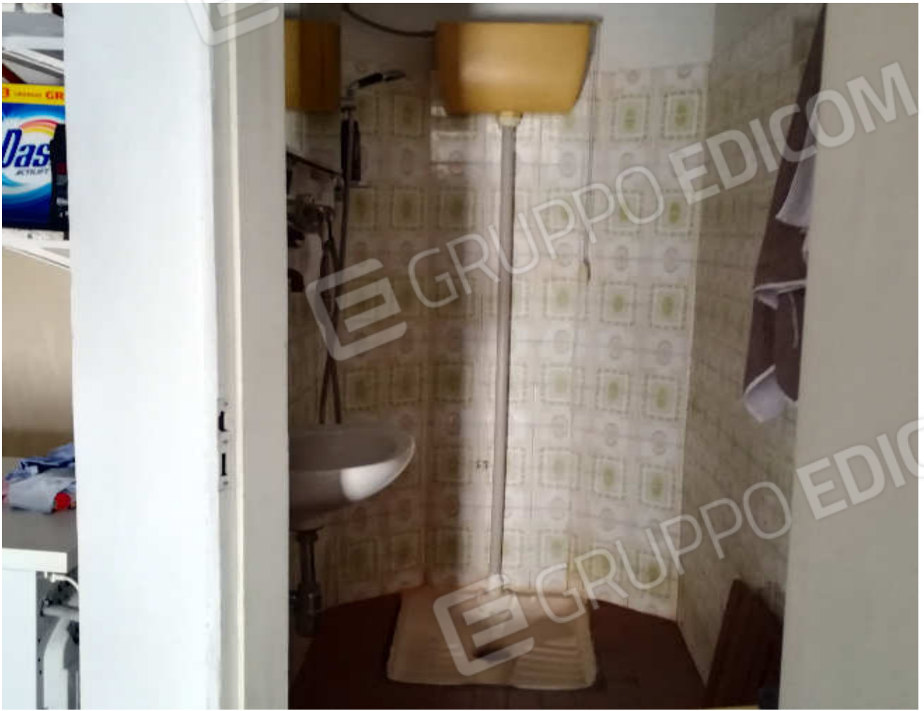
wc al piano terra