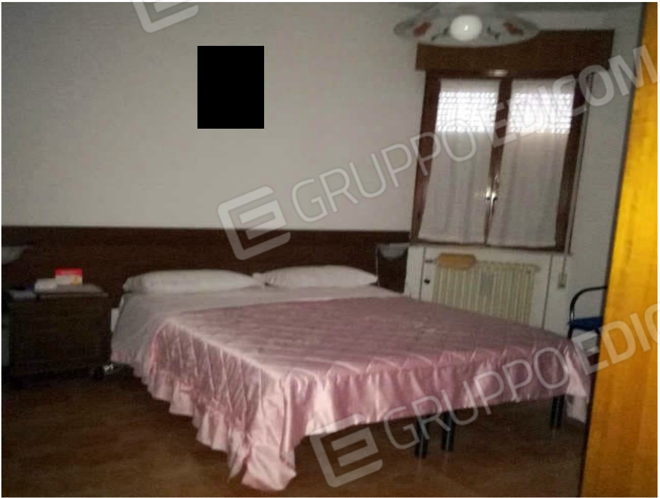
camera da letto