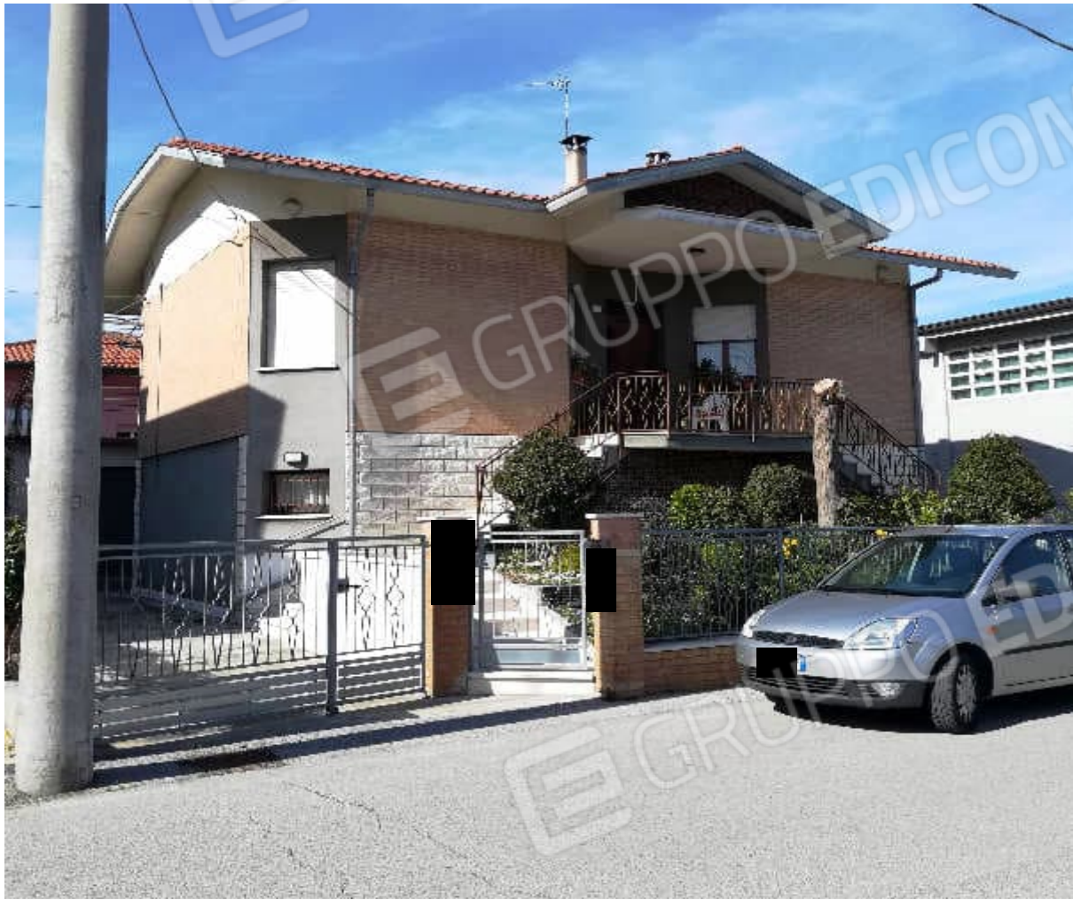
prospetto su via Merano