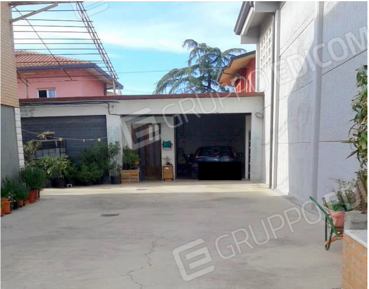
portico / autorimessa