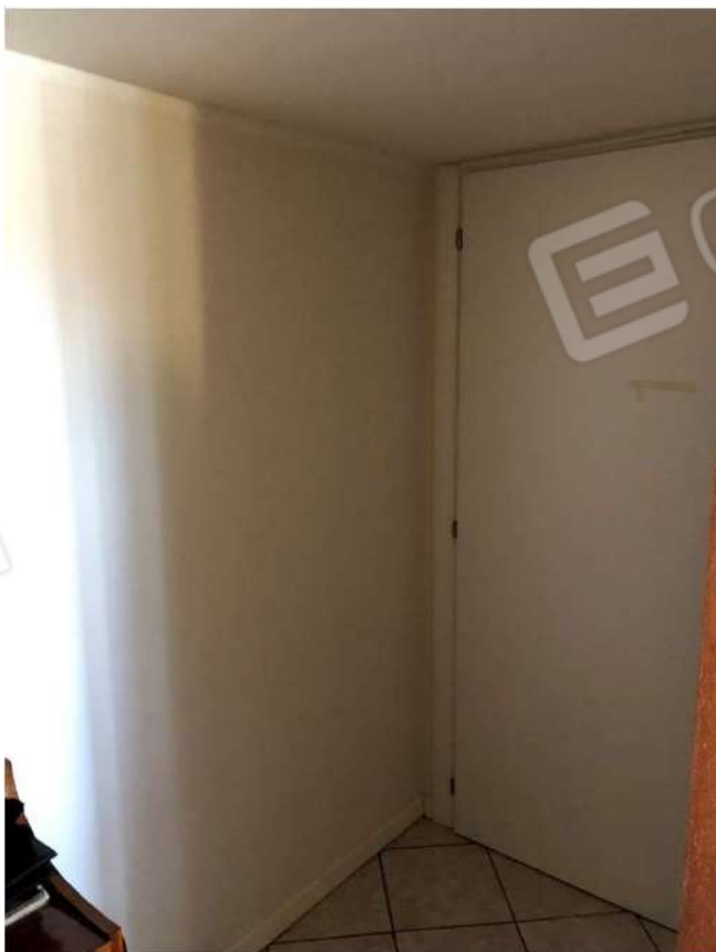
Foto 8 - sottotetto