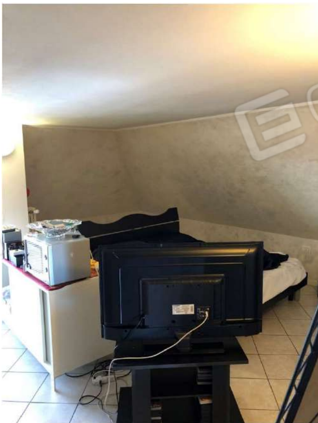
Foto 10 - sottotetto