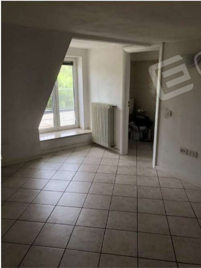
Foto 10 - lavanderia