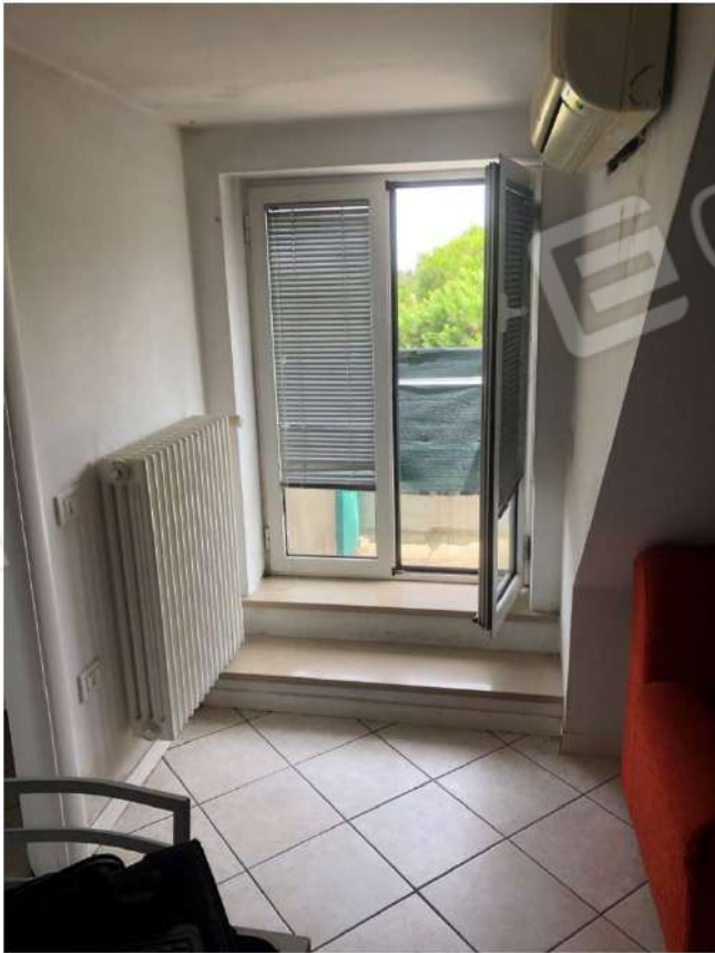
Foto 8 - sottotetto