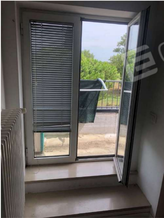
Foto 18 - terrazzo