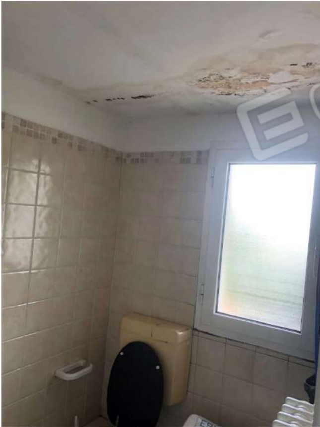
Foto 12 - sottotetto