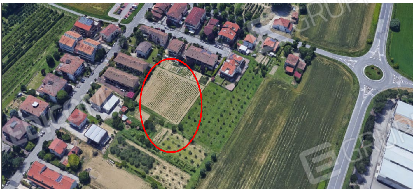
Forlì - via Bruciapecore