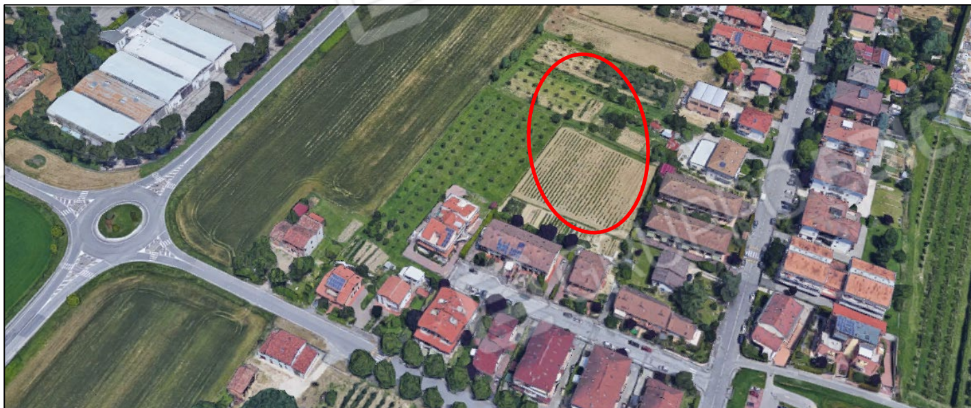
Forlì - via Bruciapecore

Comparto: Area Bruciapecore – Ex T4-10 – Tav. P29