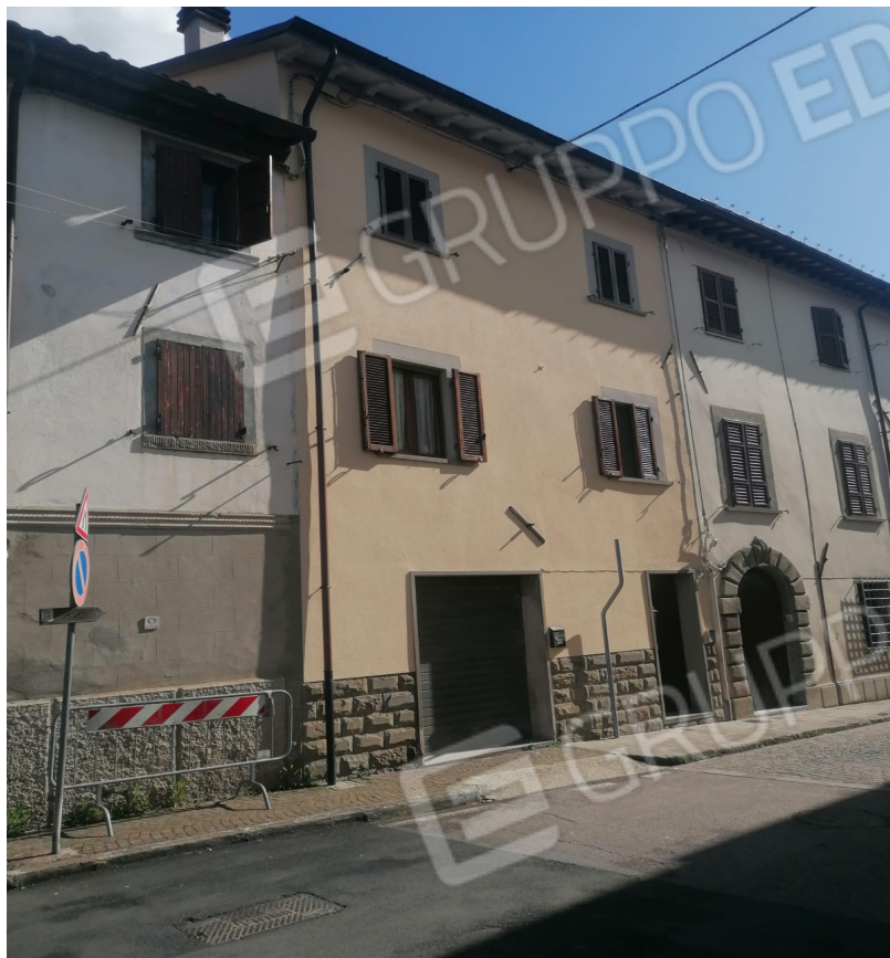
ingresso piano terra