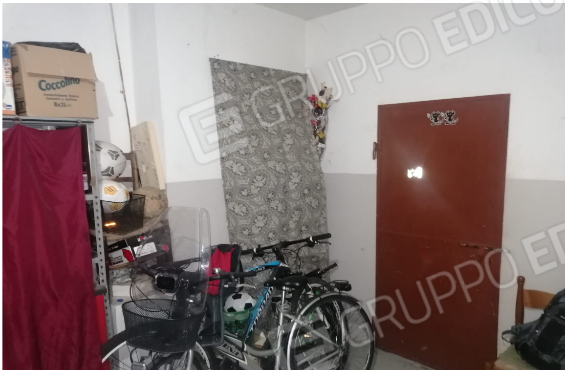
sottoscala piano terra - garage