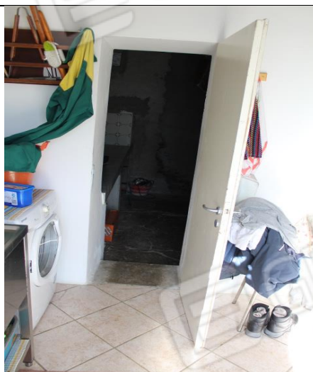
PRIMO VANO DI SERVIZIO