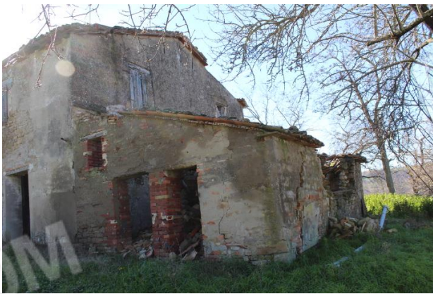
PARTICOLARE LATO NORD