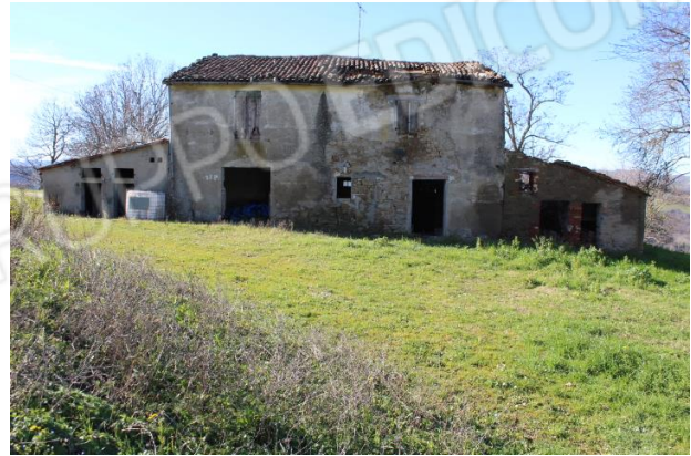
FABBRICATO COLLABENTE – PROSPETTO EST