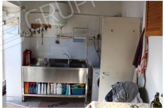
PRIMO VANO DI SERVIZIO