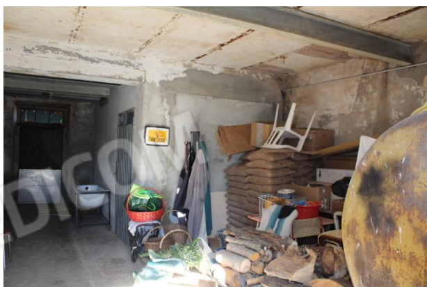
ALTRO VANO EX STALLA