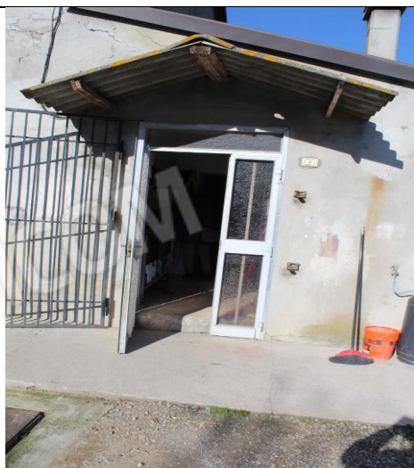
INGRESSO SERVIZI ALA EST DELLA CASA COLONICA