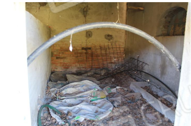
ALA LATO SUD