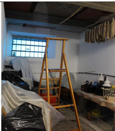
CANTINA DIFFORME RICAVATA ALL'INTERNO DEL LOCALE EX STALLA CON VISTA DEI RINFORZI STRUTTURALI IN ACCIAIO