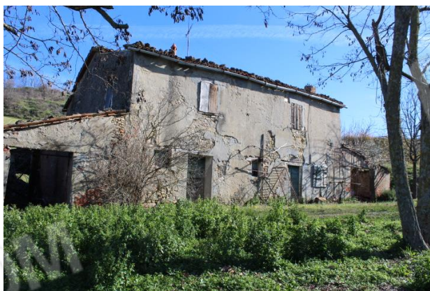
FABBRICATO COLLABENTE - PROSPETTO OVEST