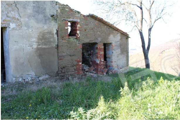
PARTICOLARE FABBRICATO PORZIONE A NORD