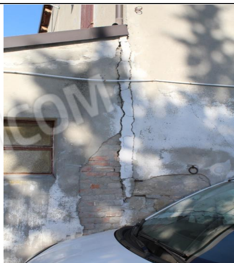
PARTICOLARE STRUTTURALE MURATURA ESTERNA