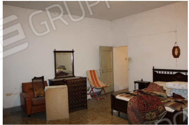
CAMERA DA LETTO 2