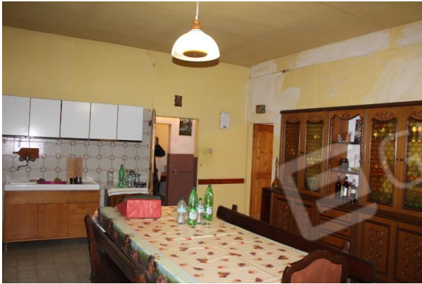
CUCINA-PRANZO CON PORTA DI COMUNICAZIONE AL SOGGIORNO-PRANZO