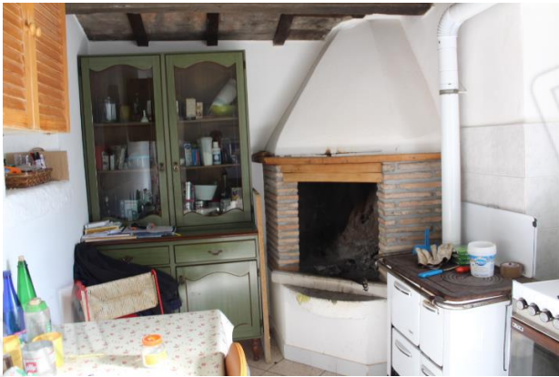
PRIMO VANO DI SERVIZIO