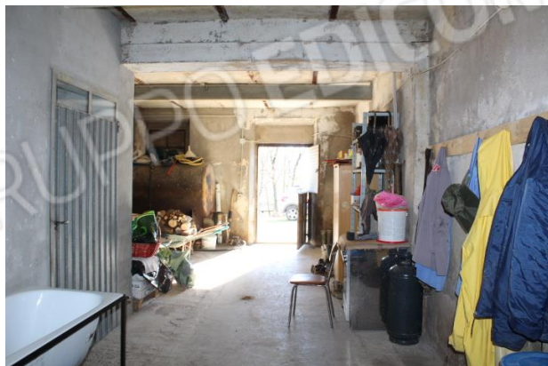
EX STALLA E VISTA DEI RINFORZI IN ACCIAIO