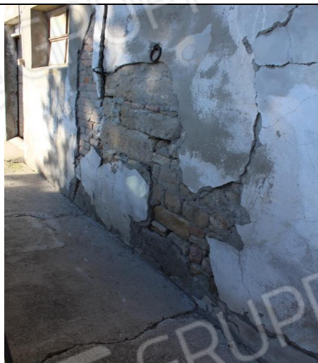
PARTICOLARE STATO DELLA MURATURA ESTERNA