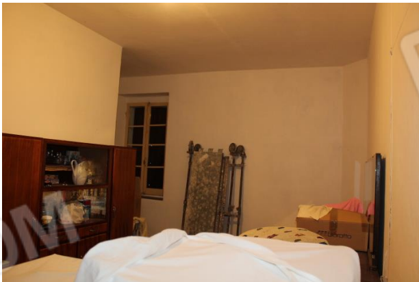
CAMERA DA LETTO 1