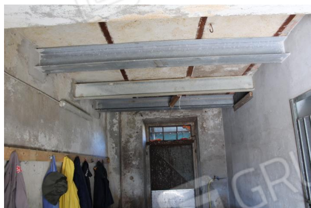
PARTICOLARE RINFORZI IN ACCIAIO DEL SOLAIO PIANO PRIMO