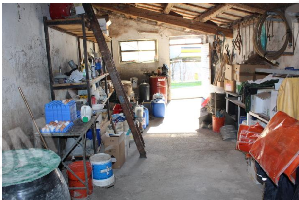
VANO DI SERVIZIO LATO OVEST ABITAZIONE