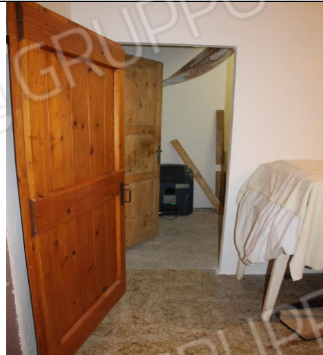
DALLA CAMERA DA LETTO ACCESSO AL RIPOSTIGLIO