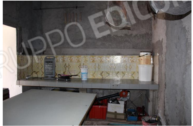
SECONDO VANO DI SERVIZIO