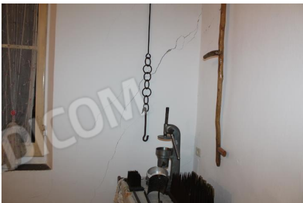
PARTICOLARE STRUTTURALE MURATURA PERIMETRALE