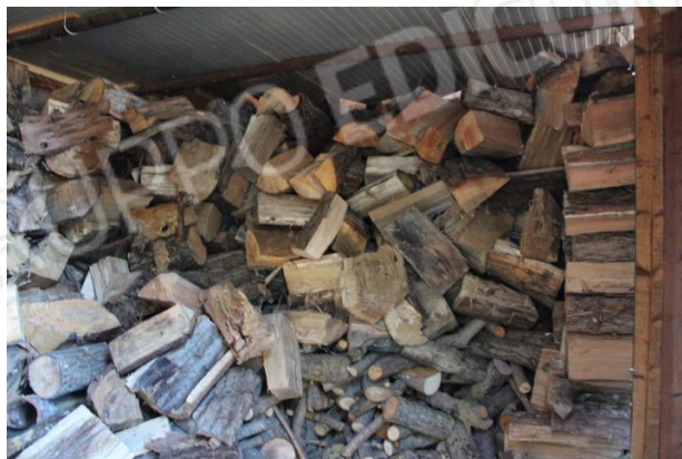
MANUFATTO 1, POSTO SUL RETRO DA DEMOLIRE