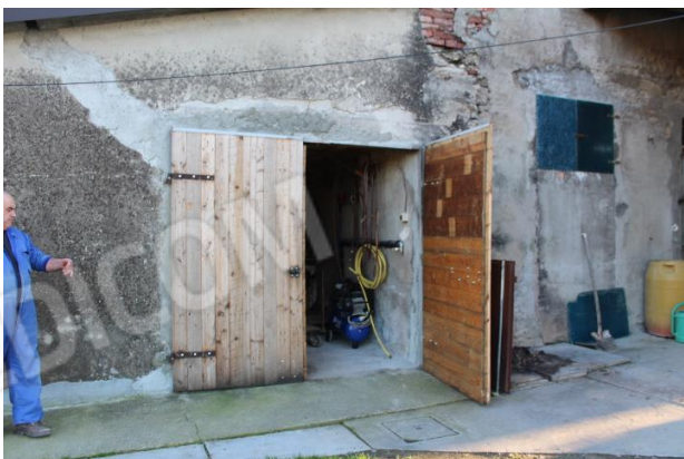
INGRESSO AL VANO CANTINA, DAL RETRO DELL'ABITAZIONE