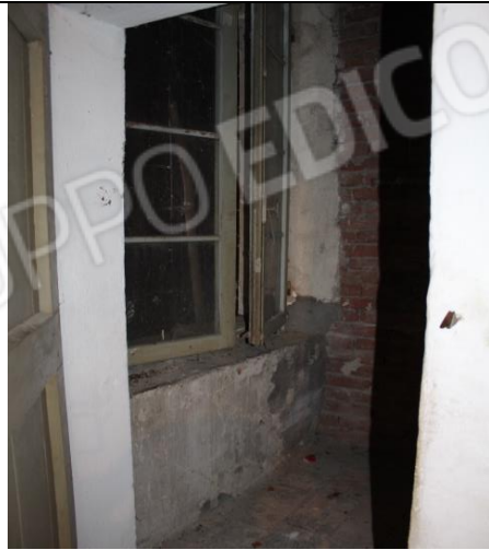
DA CAMERA DA LETTO 2, ACCESSO ALLA ZONA SOPRASCALA