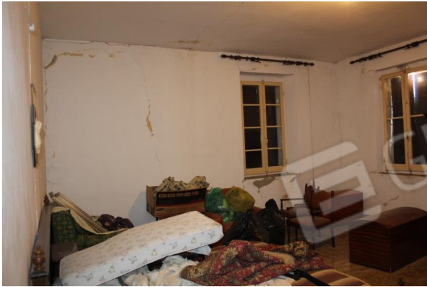
CAMERA DA LETTO 2