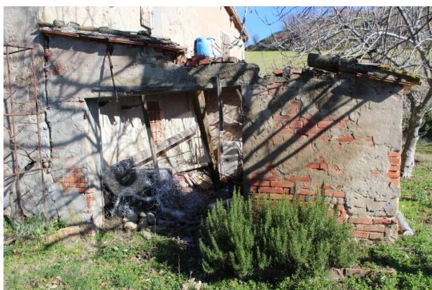
PARTICOLARE PARTE DI ABITAZIONE POSTA A SUD