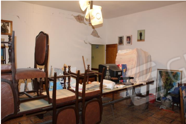
SOGGIORNO-PRANZO CON PARTICOLARE IN FONDO, DI DISTACCHI DI INTONACO DALLA PARETE DIVISORIA