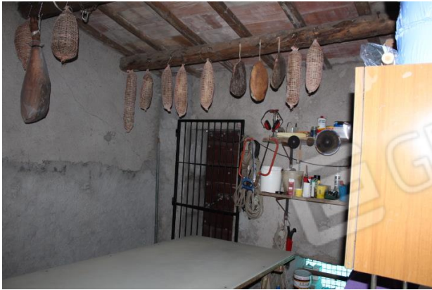
SECONDO VANO DI SERVIZIO