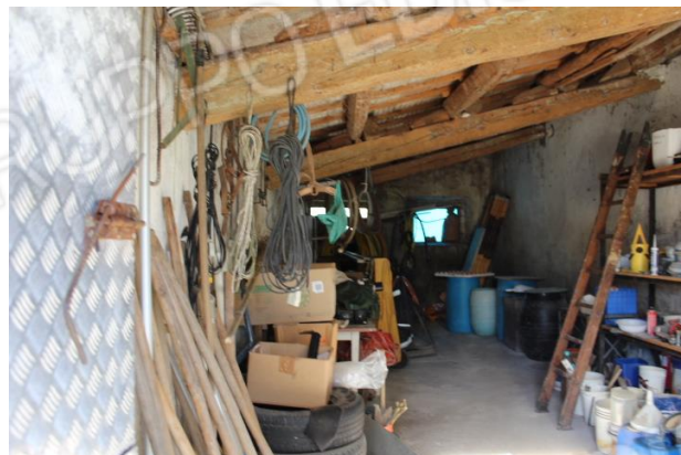
VANO DI SERVIZIO LATO OVEST ABITAZIONE