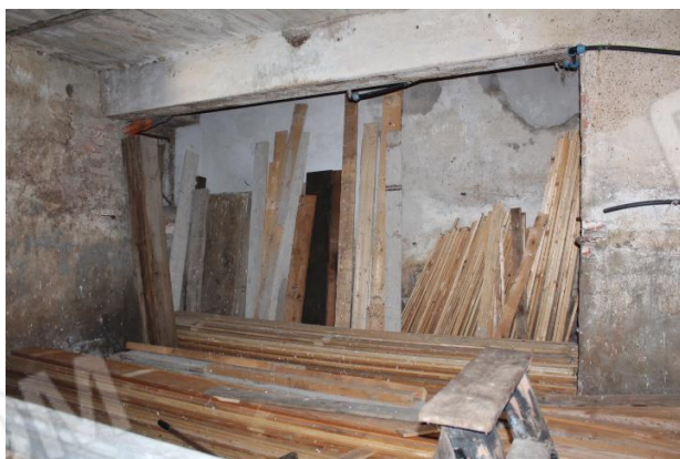
EX STALLA, VISTA DELLA ZONA SOTTOSCALA e BAGNO DEL PIANO PRIMO