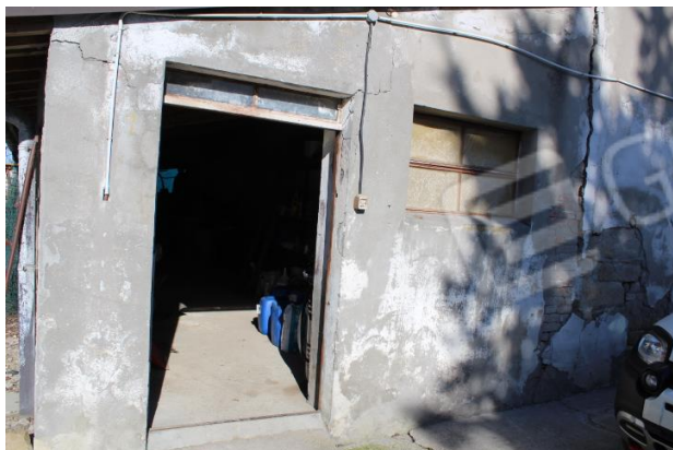
CASA COLONICA INGRESSO ALA SERVIZI LATO OVEST