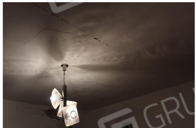
PARTICOLARE STRUTTURALE DEL SOLAIO DI COPERTURA