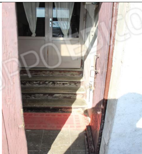
INGRESSO SCALA AL FABBRICATO COLONICO, PER ACCEDERE AL PIANO PRIMO