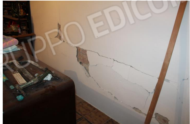
PARTICOLARE DI PARETE DIVISORIA FRA CUCINA e SOGGIORNO