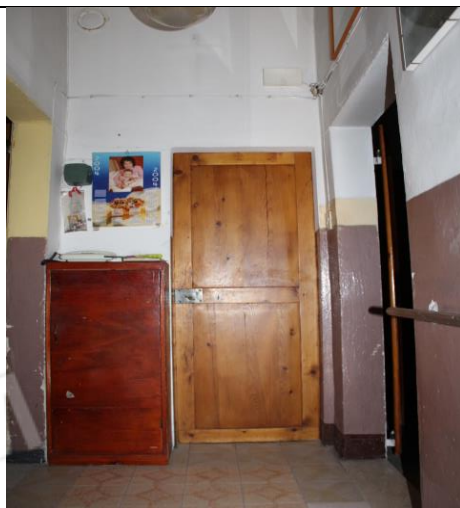
PIANEROTTOLO DI ARRIVO SCALA AL PIANO PRIMO