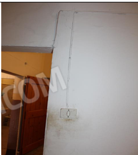
PARTICOLARE IMPIANTO ELETTRICO