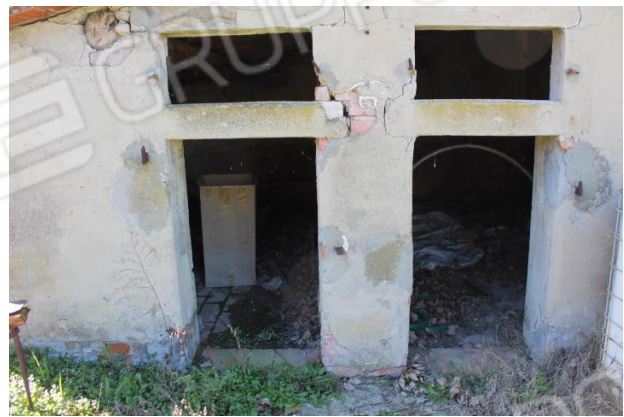
PARTICOLARE ALA LATO SUD