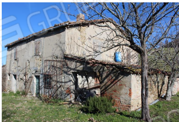
FABBRICATO COLLABENTE – PROSPETTO OVEST E LATO SUD