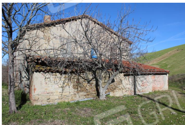
FABBRICATO COLLABENTE – LATO SUD