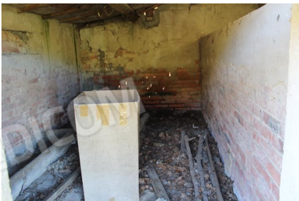
ALA LATO SUD