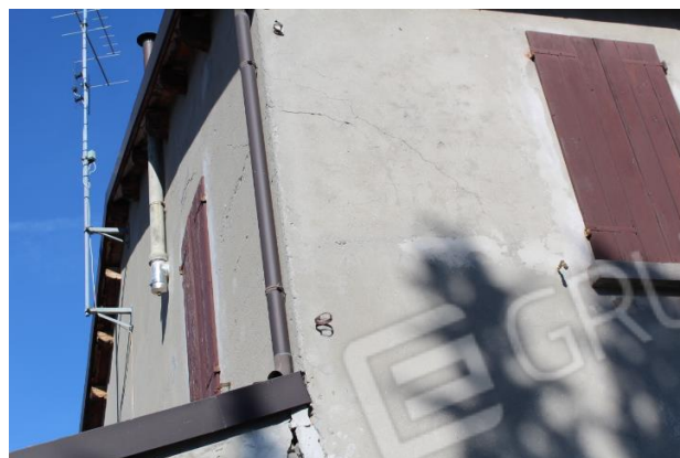
FESSURAZIONI DELLA MURATURA PORTANTE