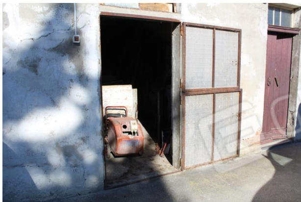
INGRESSO PARTE CENTRALE ABITAZIONE