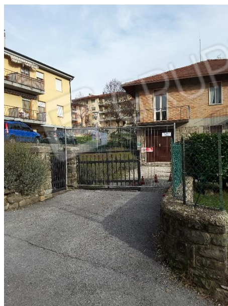
Vista su via dell'Orto della recinzione interrotta da un cancello carrabile e uno pedonale entrambi in profilati metallici e arretrati alla recinzione (verso l'area cortilizia di proprietà)