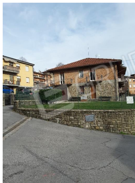
Vista della proprietà delimitata dalle due strade (via dell'Orto via del Faggio) per mezzo di un muro in muratura e sasso a vista, di varia altezza poichè segue l'andamento naturale del terreno, e sovrastante rete metallica plastificata sorretta da paletti in ferro