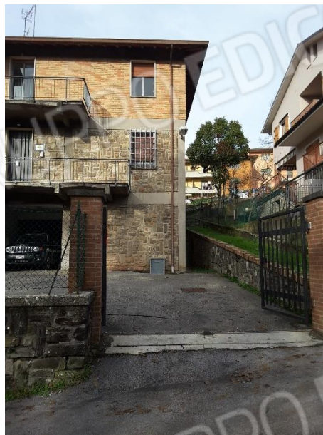
Vista su via Del Faggio della recinzione, interrotta da un cancello in ferro a due ante posto a filo della recinzione e sorretto da due colonne in mattoni faccia vista