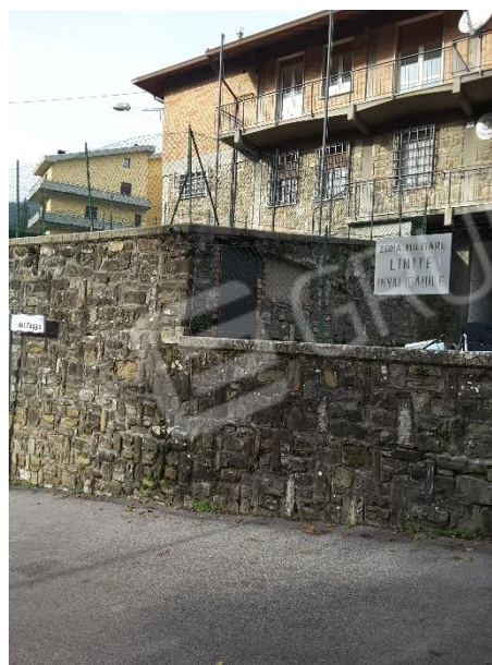
Vista esterna dell'immobile, le facciate sono in parte rivestite in pietra/sasso al piano terra e primo sottostrada ed in parte in muratura faccia vista ai piani superiori