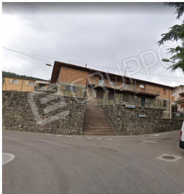
Vista esterna del fabbricato che comprende le porzioni immobiliari pignorate