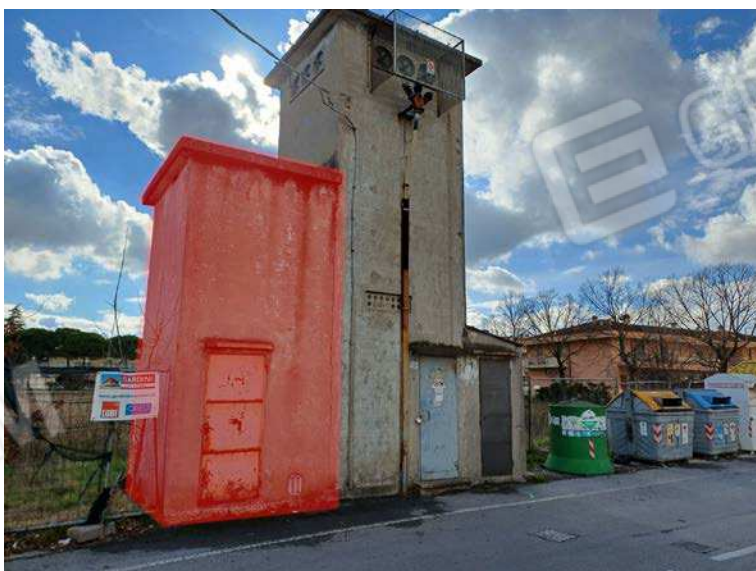
veduta del manufatto edificato sulla particella 1432 (velatura rossa)