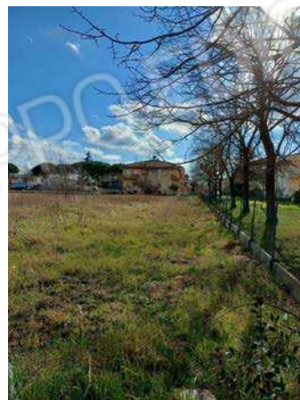
vedute della particella 1431