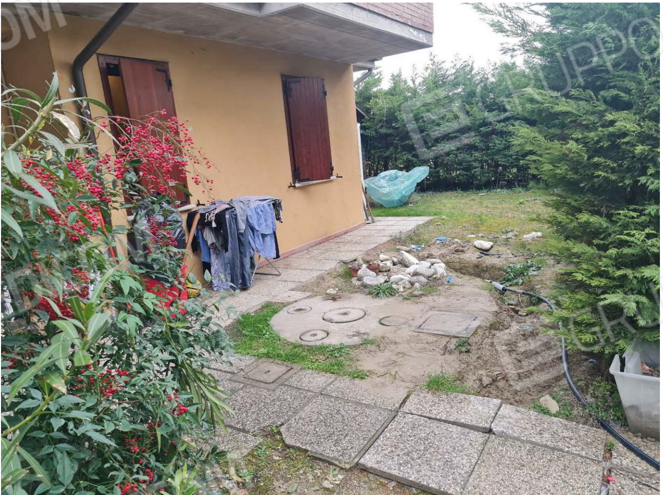
AREA CORTILIZIA LATO INGRESSO