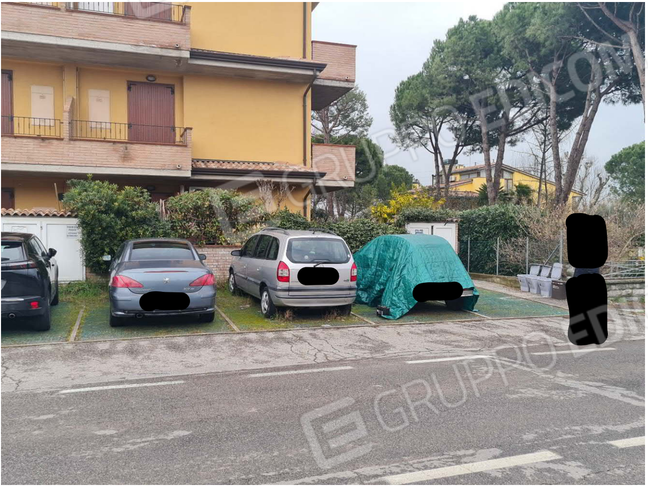
POSTO AUTO SCOPERTO