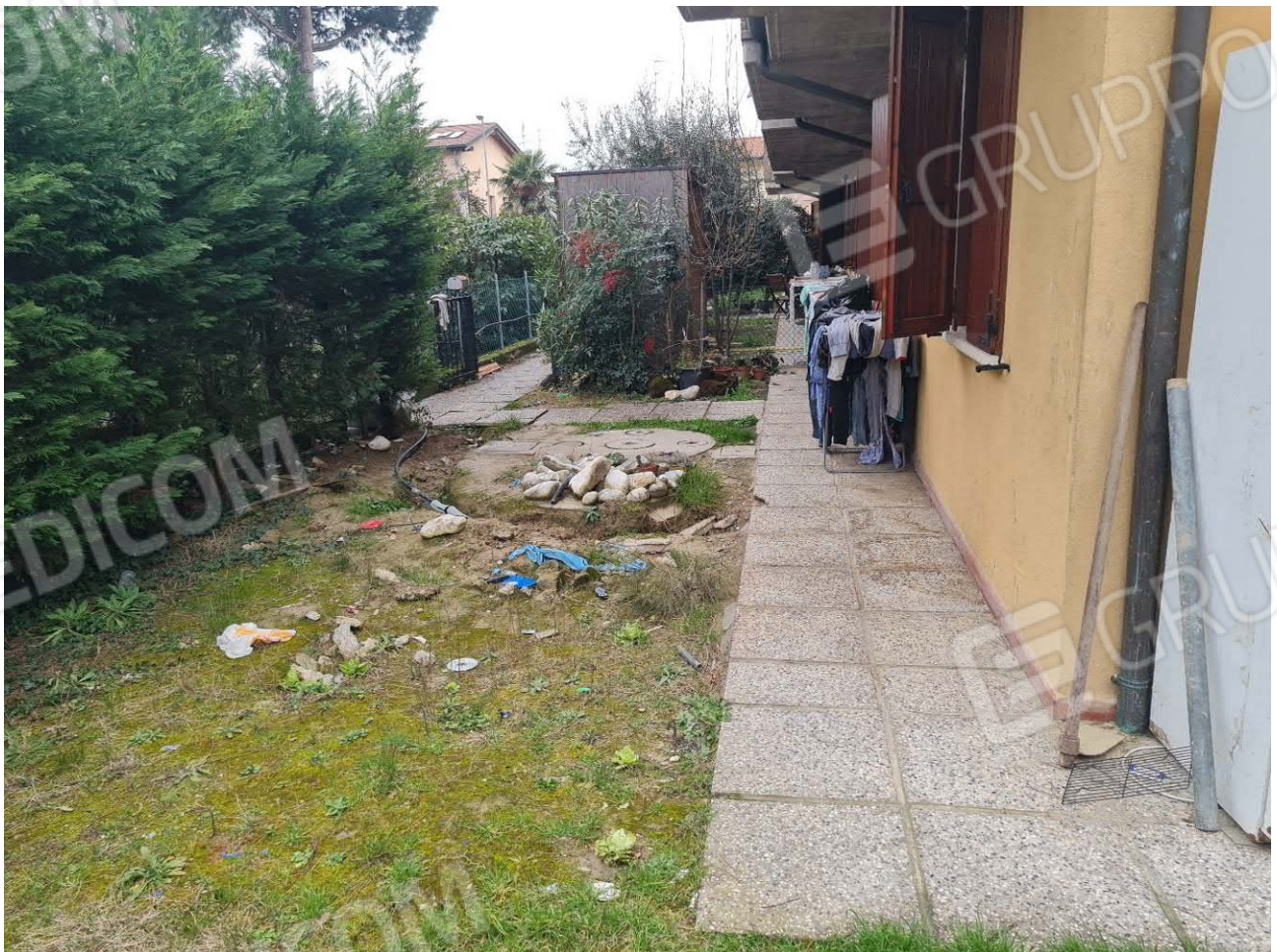
AREA CORTILIZIA LATO INGRESSO