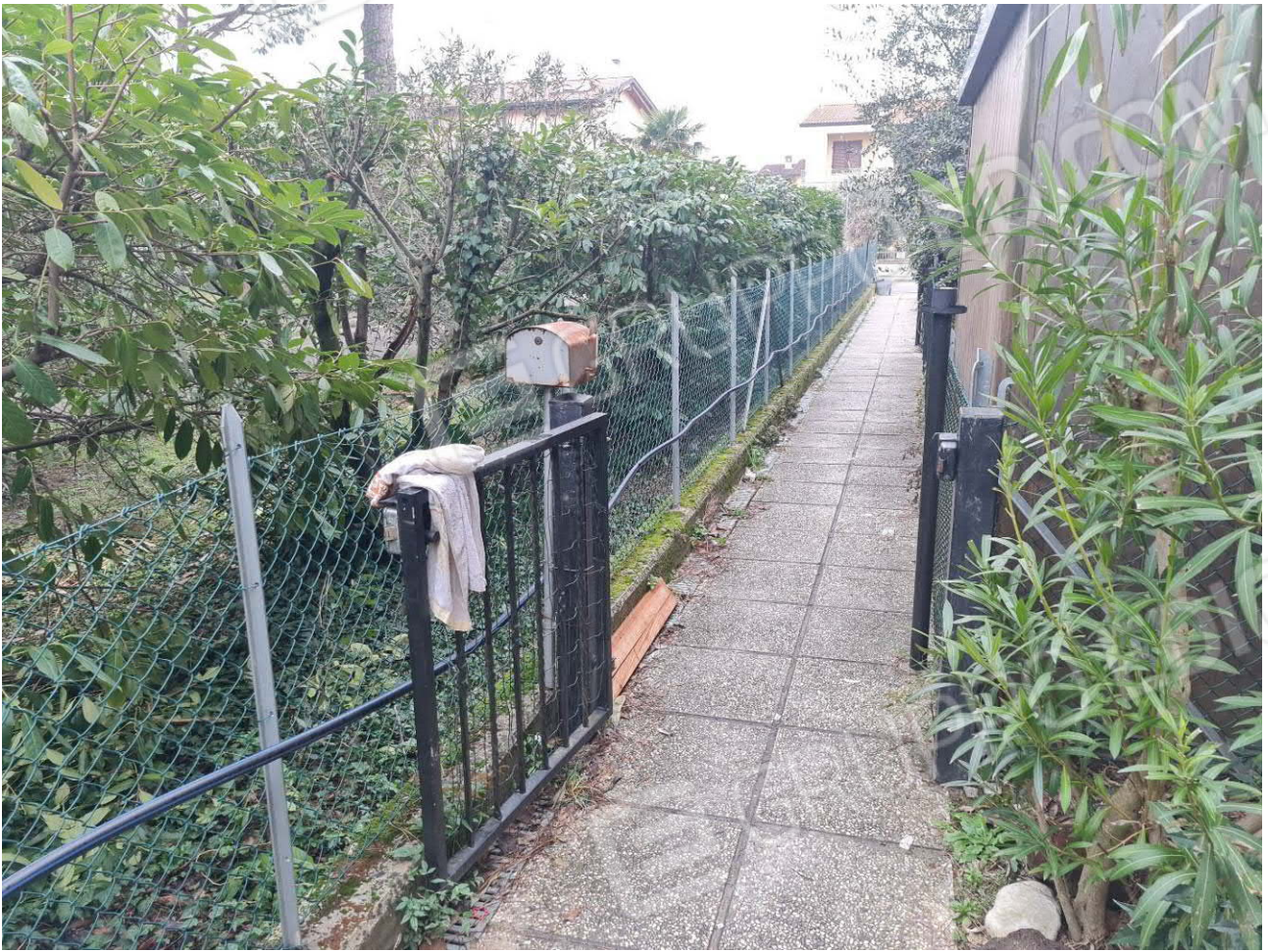
CORSELLO CONDOMINIALE DI ACCESSO ALLA ABITAZIONE