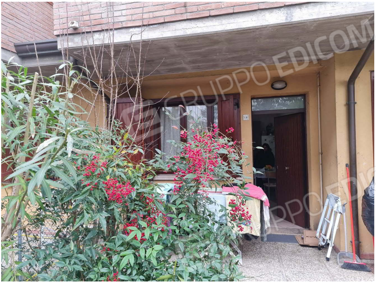
INGRESSO ABITAZIONE DA AREA CORTILIZIA DI PROPRIETA'