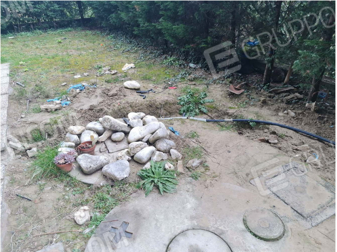
LINEA DA REINTERRARE