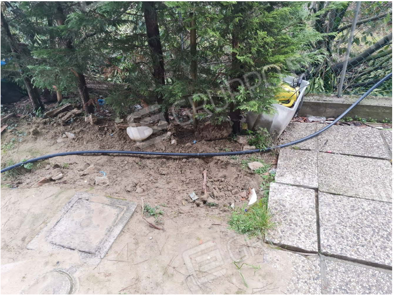
BYPASS LINEA ACQUA POTABILE