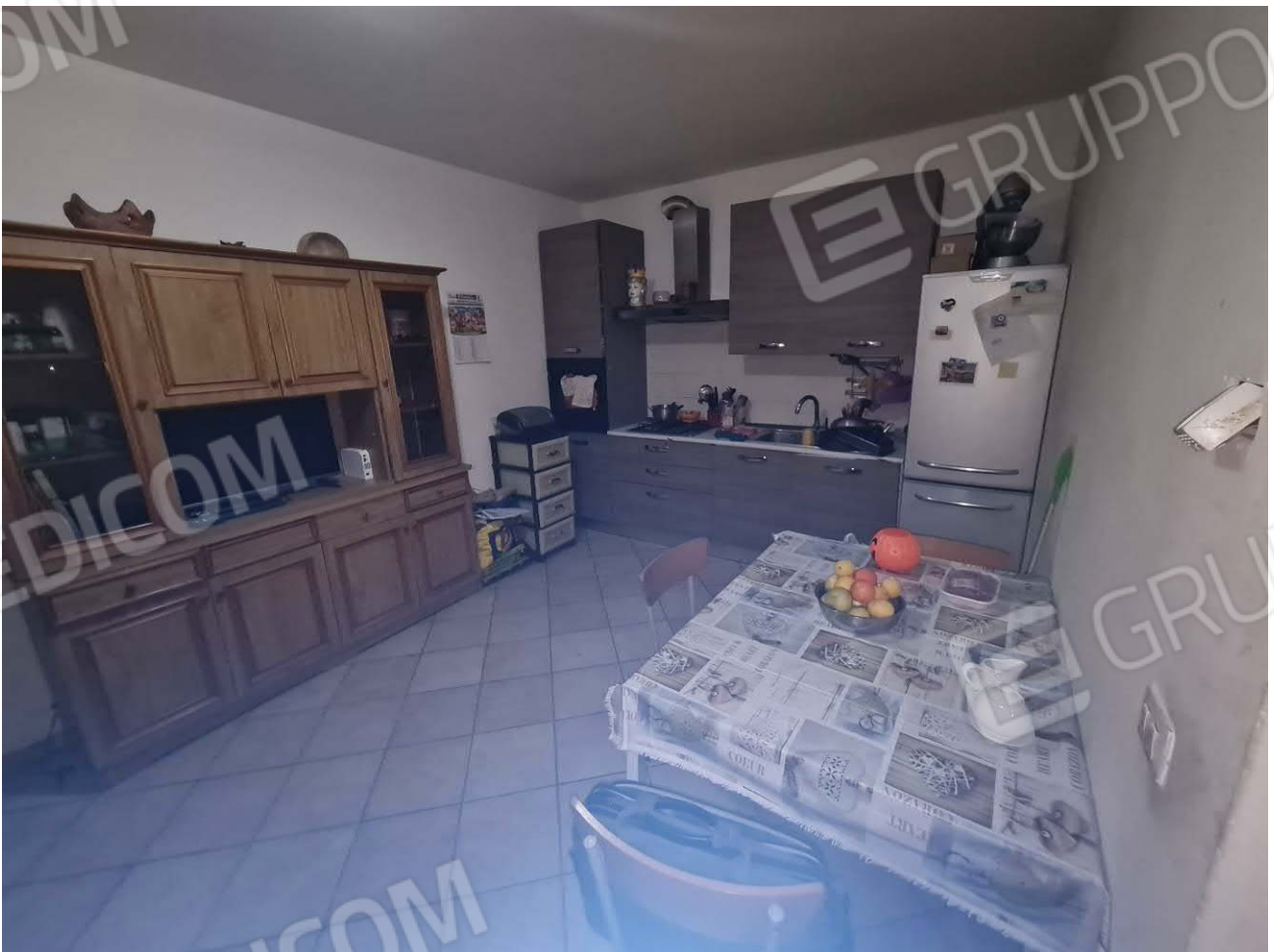
SOGGIORNO CON ANGOLO COTTURA