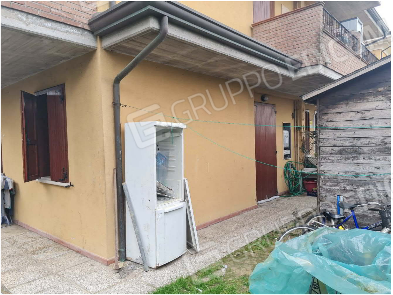
AREA CORTILIZIA RETRO