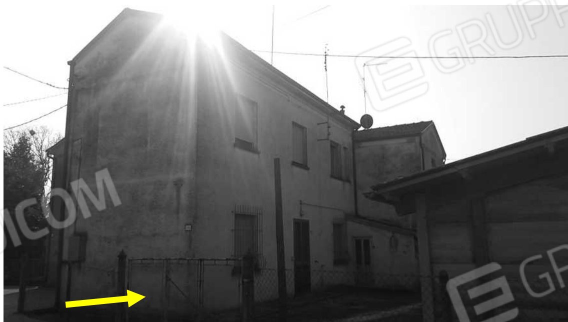
VISTA PROSPETTO OVEST ABITAZIONE CIV. 252 CON CORTE ESCUSIVA E SERVIZI ANTISTANTI