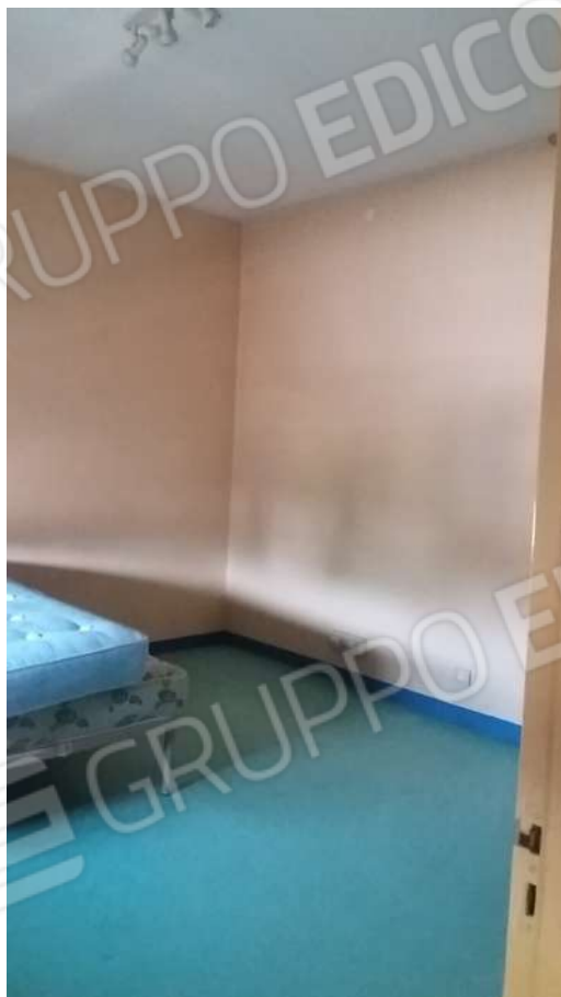
ABITAZIONE PIANO PRIMO: CAMERE E BAGNO