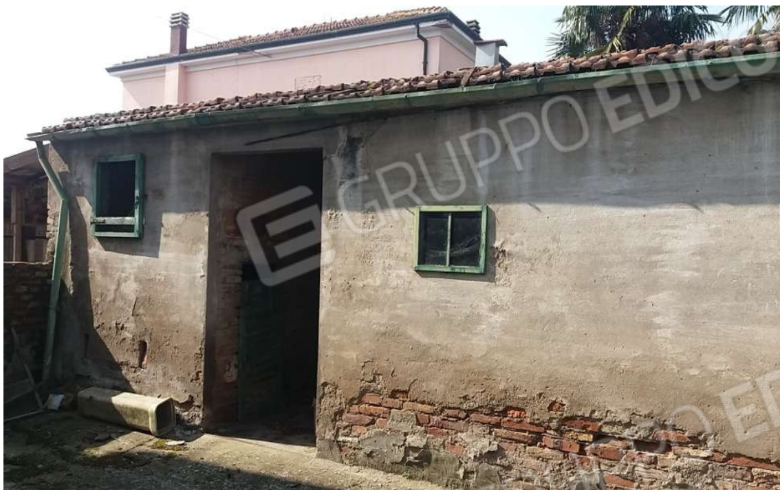
SERVIZI ESCLUSIVI – POLLAI – SGOMBERI – CANTINA E LEGNAIA E CORTE ESCLUSIVA CON ACCESSO CARRABILE