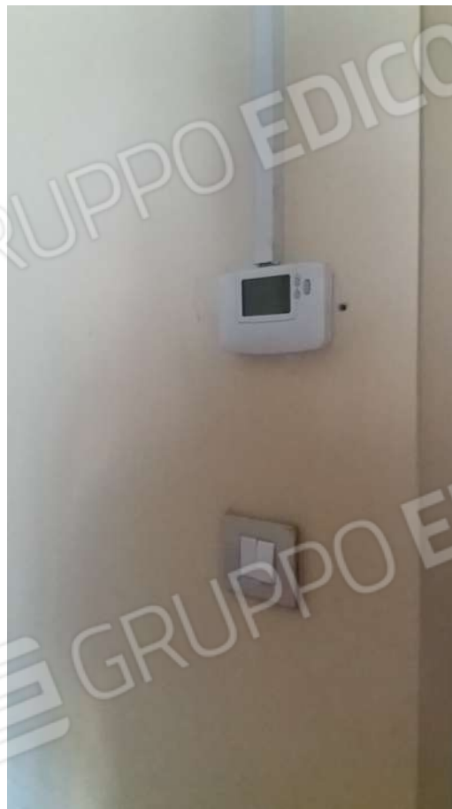
ABITAZIONE PIANO TERRA: SOGGIORNO E PARTICOLARI INGRESSO E VANO SCALA