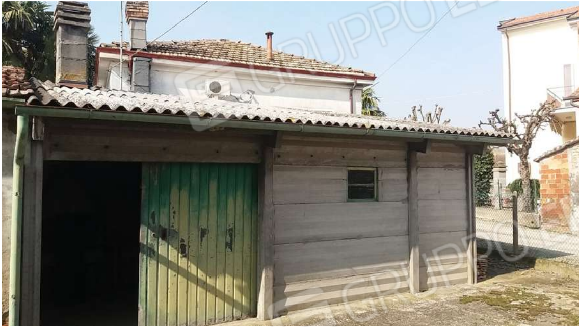
LEGNAIA E POLLAIO E CANTINA – VISTA PROSPETTO EST E INTERNI