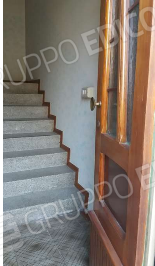
INGRESSO ABITAZIONE (FG. 19 MAPP. 19 SUB 1) PIANO TERRA