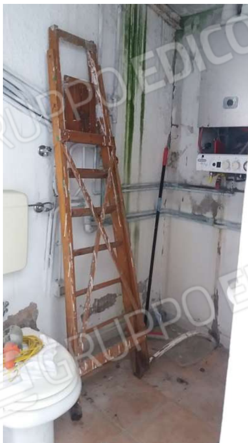
ABITAZIONE PIANO TERRA: VISTA PROSPETTO NORD CENTRALE TERMICA E INTERNI