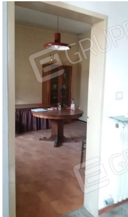
ABITAZIONE PIANO TERRA: SOGGIORNO E CUCINA