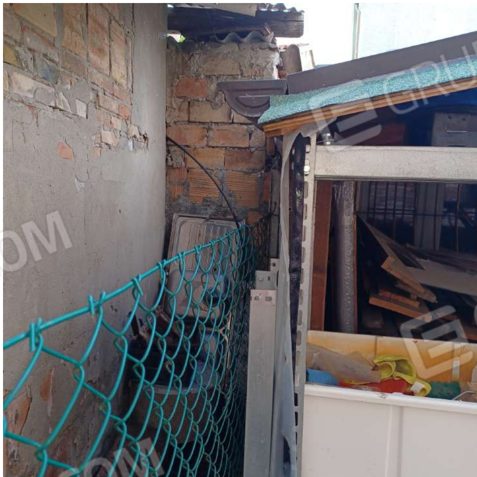
Passaggio esterno retro abitazione