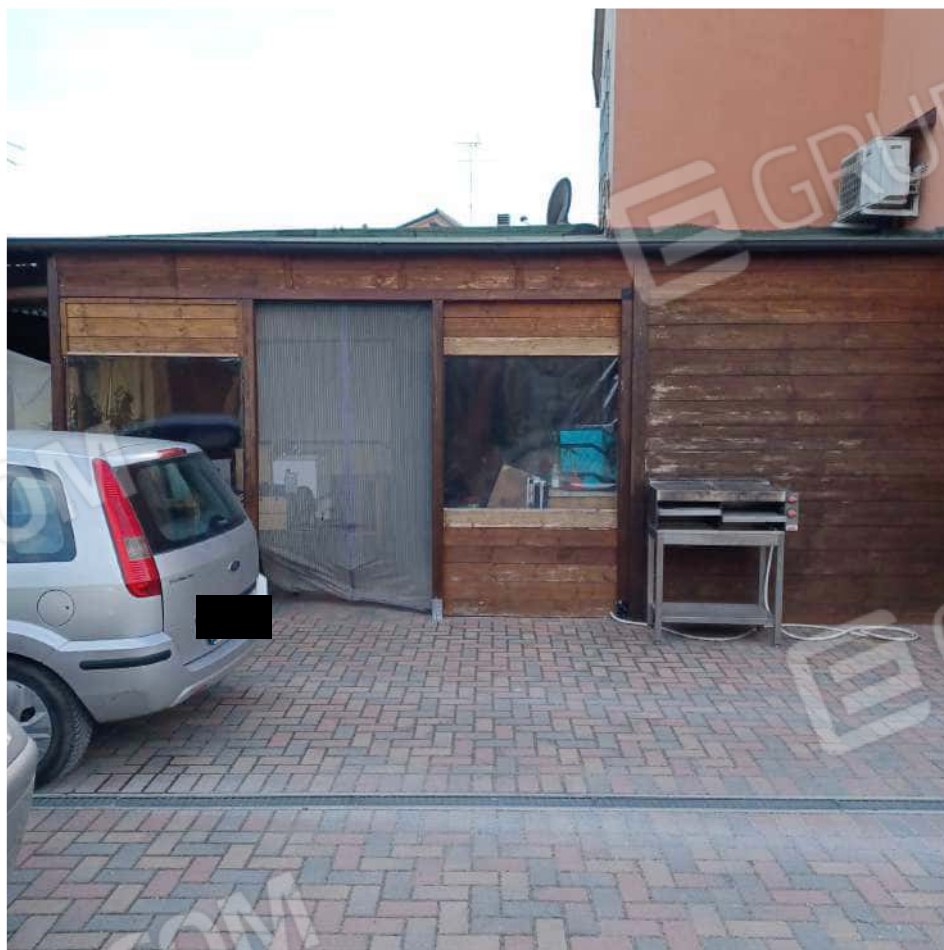
Opere in difformità esterne