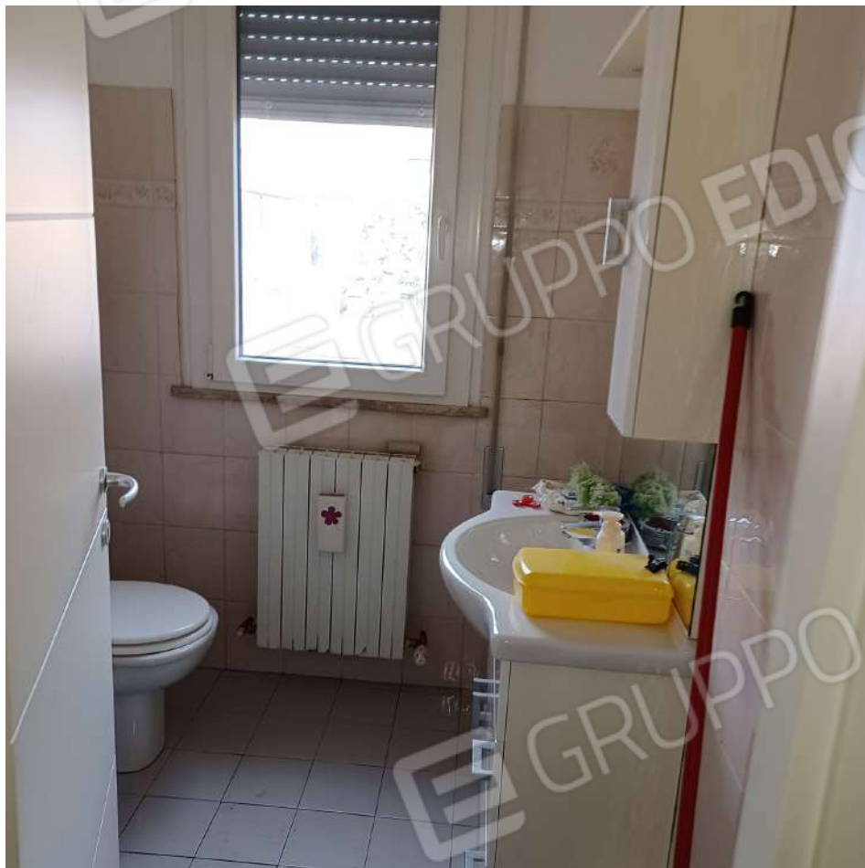
Bagno 2 P1