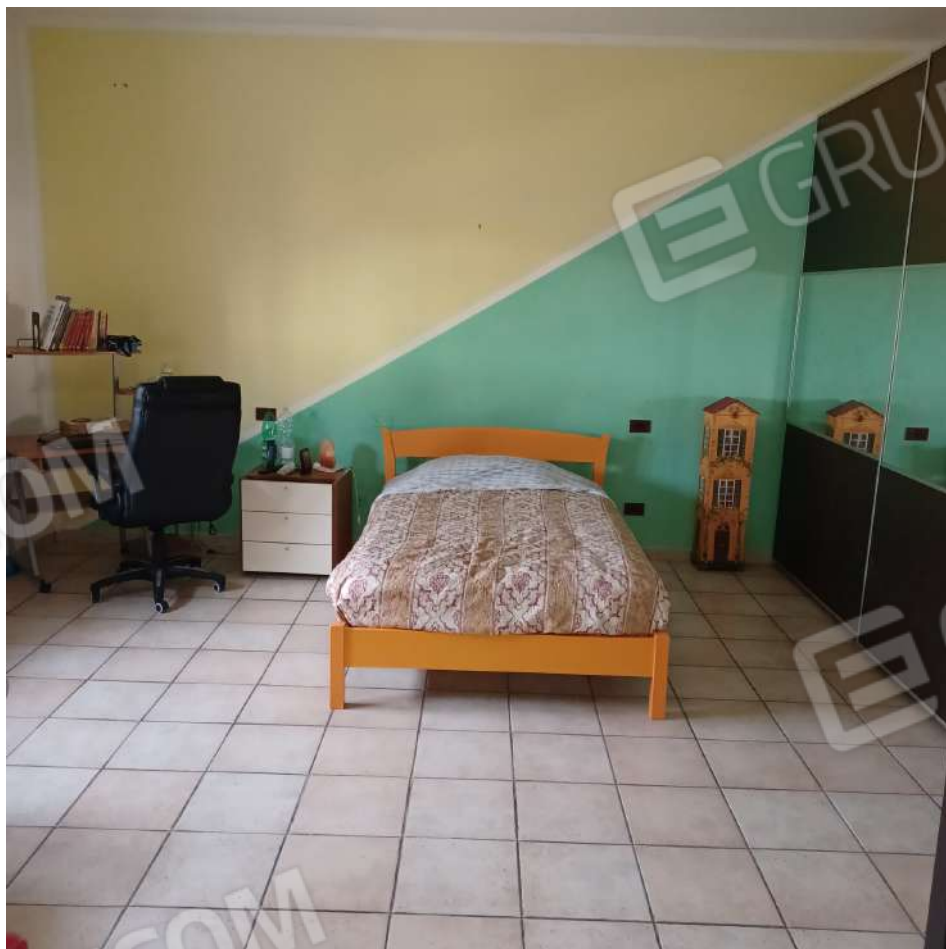
letto 1 P1