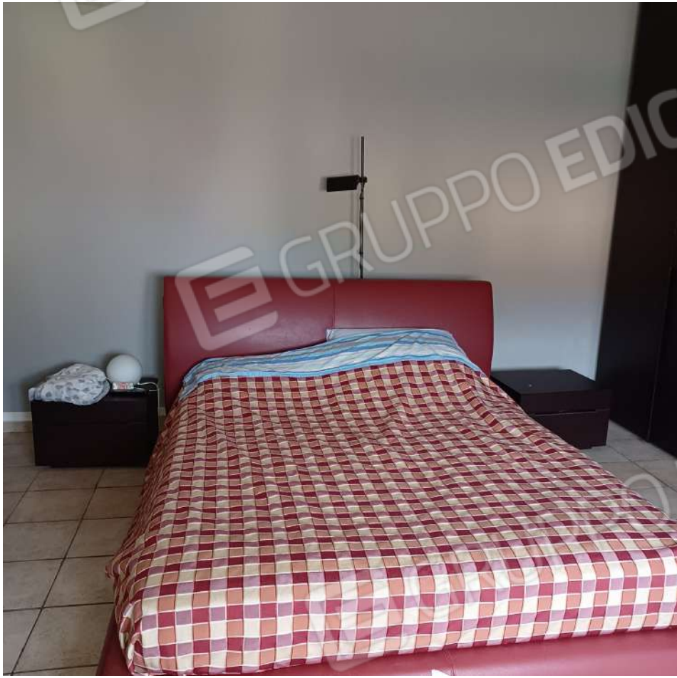
Letto 2 P1