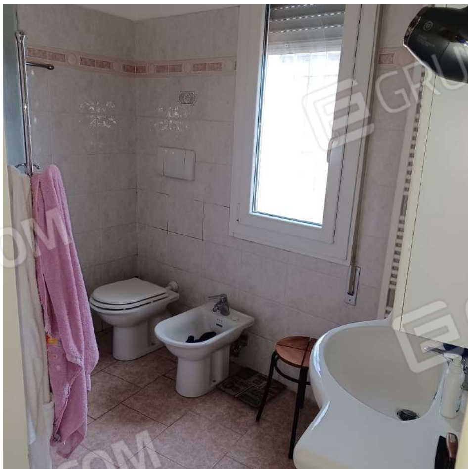
Bagno 1 P1