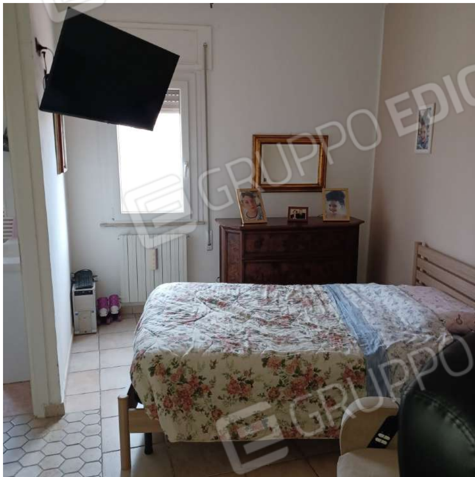
Ex Dis-Ripostiglio P1