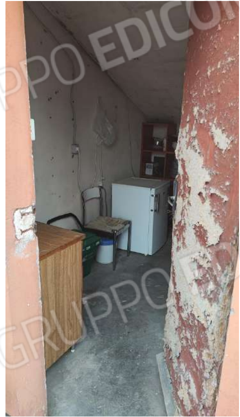
VANO SCALA CONDOMINIALE: PORTA DI ACCESSO AL PIANO 4° E INTERNO CANTINETTA DEL SUB 13