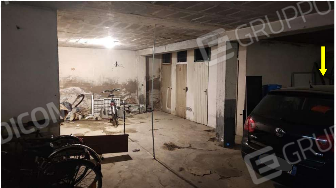
INTERNO DELLA RIMESSA COMUNE AL PIANO TERRA E INDICAZIONE DEL POSTO AUTO DEL SUB 13