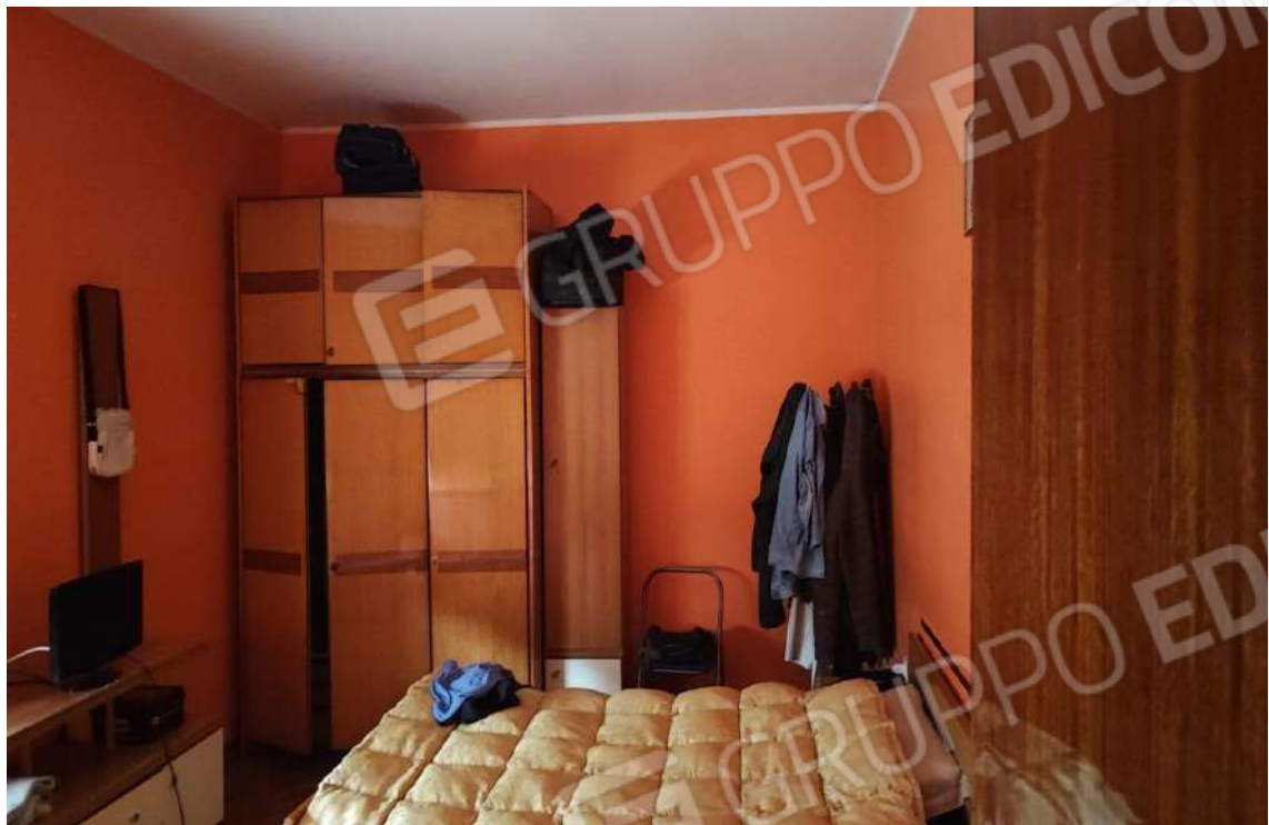
U.I. SUB 13: INTERNI ABITAZIONE PIANO 3° INT.9 ALTRA CAMERA E BAGNO