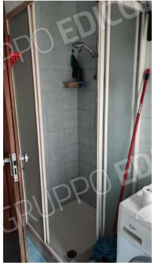
U.I. SUB 13: INTERNI ABITAZIONE PIANO 3° INT.9 PARTICOLARI (CALDAIA, BAGNO, PAVIMENTO IN LEGNO)