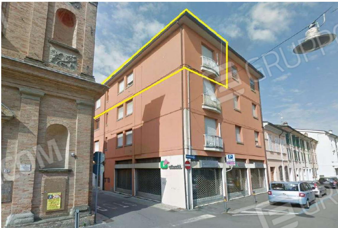
VISTA DA C.SO G. MATTEOTTI PROSPETTI EST E NORD DEL CONDOMINIO E INDICAZIONE DELL'U.I. SUB 13 IN OGGETTO