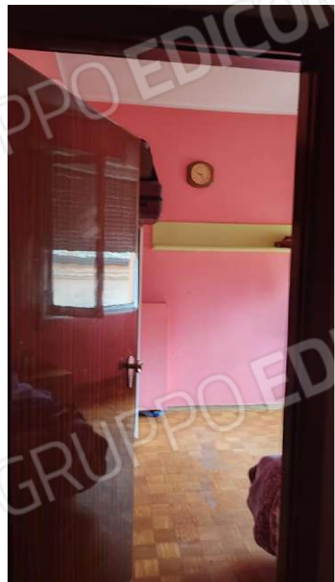
U.I. SUB 13: INTERNI ABITAZIONE PIANO 3° INT.9 CUCINA E CAMERA