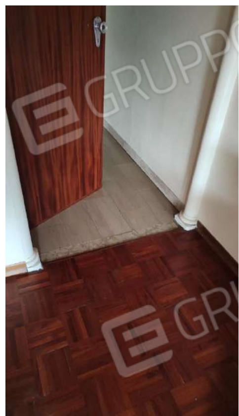
U.I. SUB 13: INTERNI ABITAZIONE PIANO 3° INT.9 RIPOSTIGLIO E PARTICOLARI DEL PAVIMENTO DEL SOGGIORNO