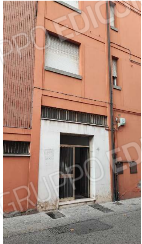
VISTA DA C.SO G. MATTEOTTI DEI PROSPETTI EST E NORD DEL CONDOMINIO CON INDICAZIONE DELL'U.I. SUB 13 IN OGGETTO AL PIANO 3° E DEGLI INGRESSI CONDOMINIALI