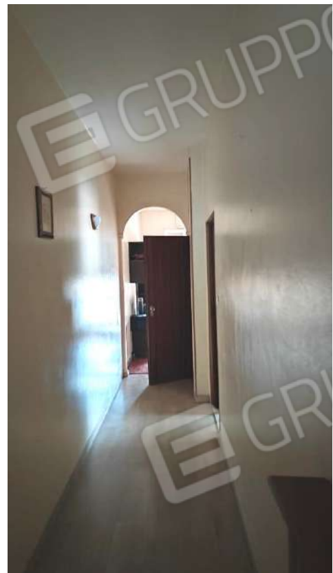
U.I. SUB 13: INTERNI ABITAZIONE PIANO 3° INT.9 INGRESSO E CORRIDOIO / DISIMPEGNO