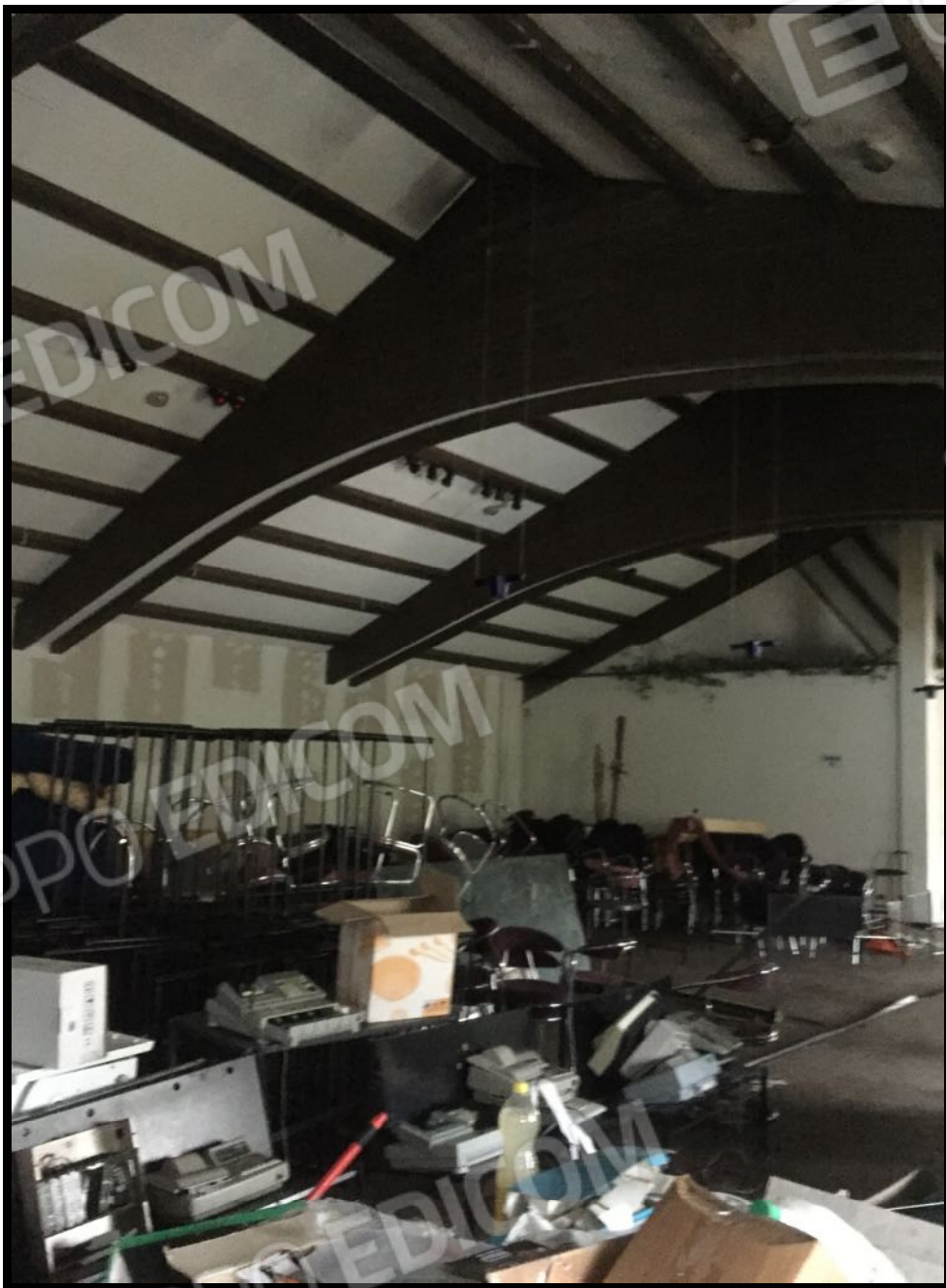
Ristorante a piano terra