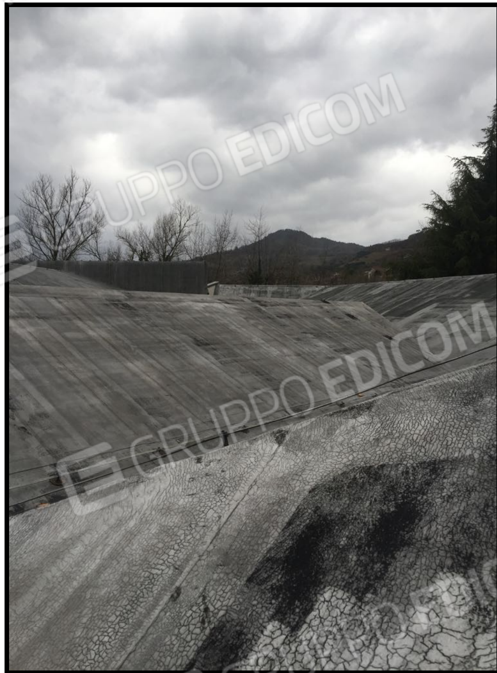
Vista delle coperture