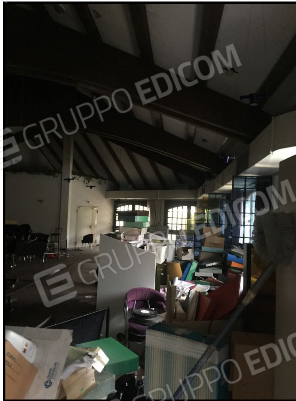
Ristorante a piano terra