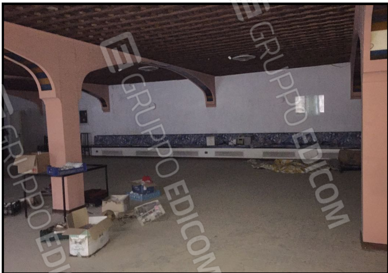
Sala ristorante a piano interrato