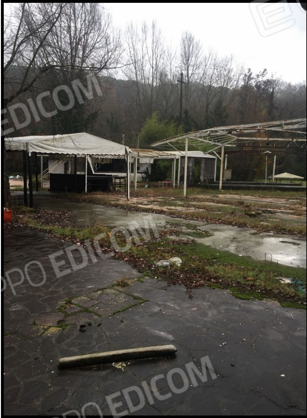
Manufatti nell'area cortilizia