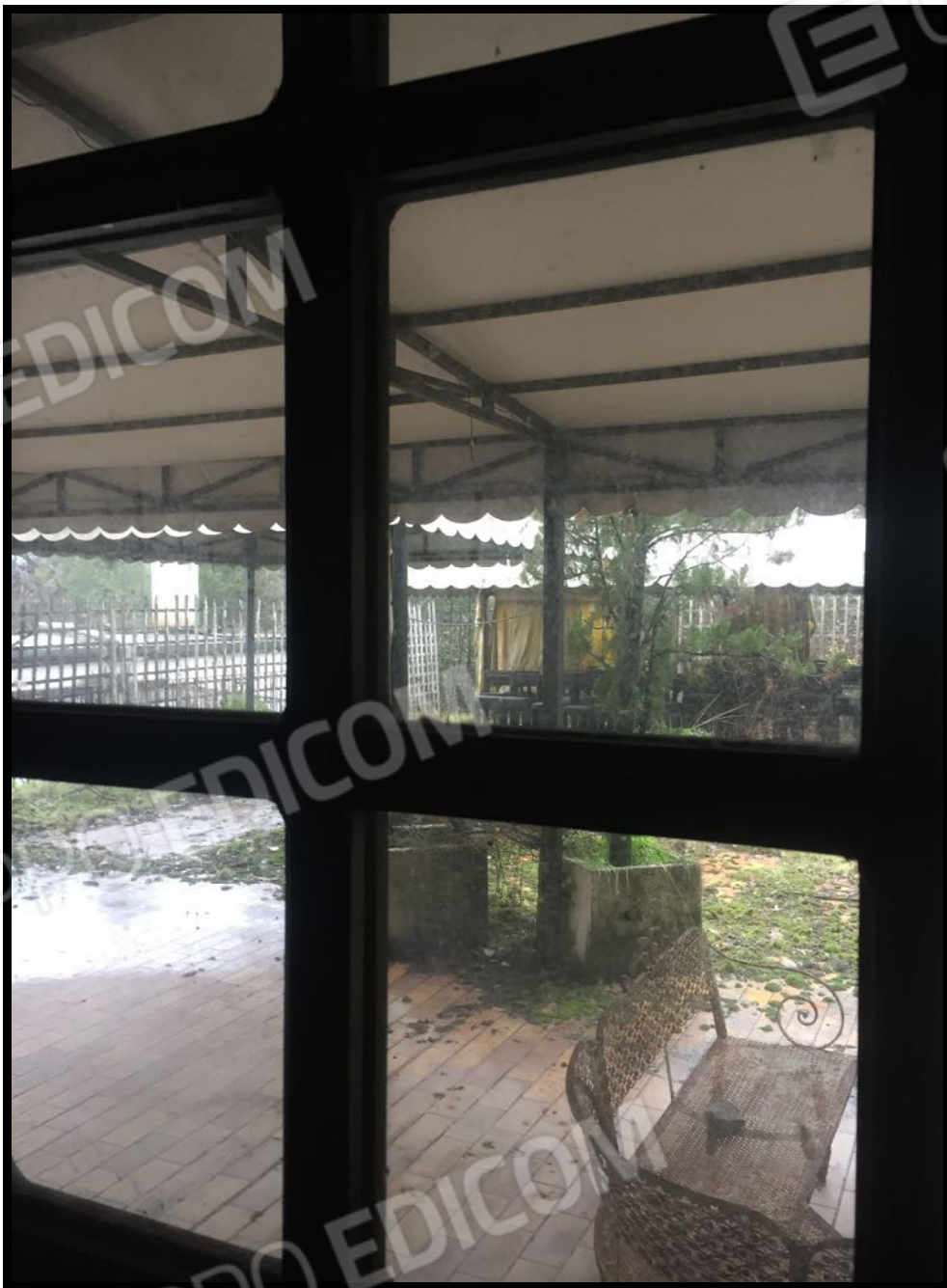
Terrazza a servizio del ristorante con tettoie