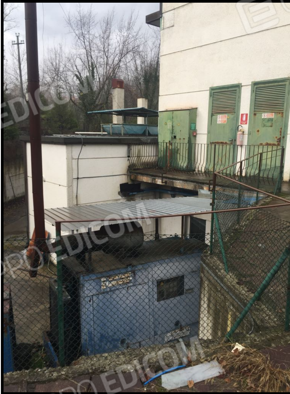
Area tecnica vista dall'esterno