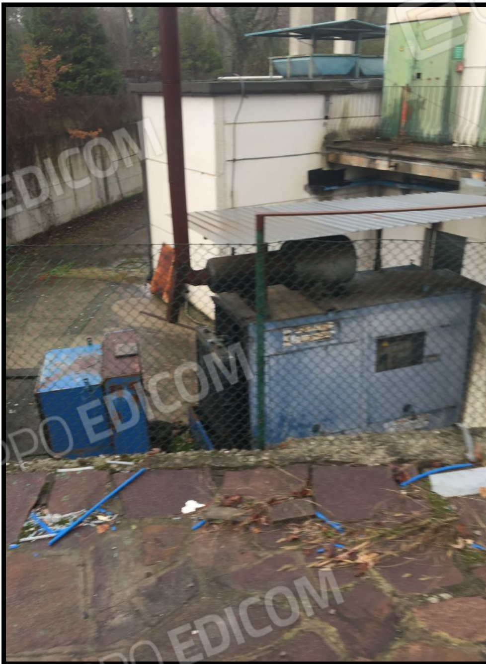
Vista della zona tecnica dall'esterno