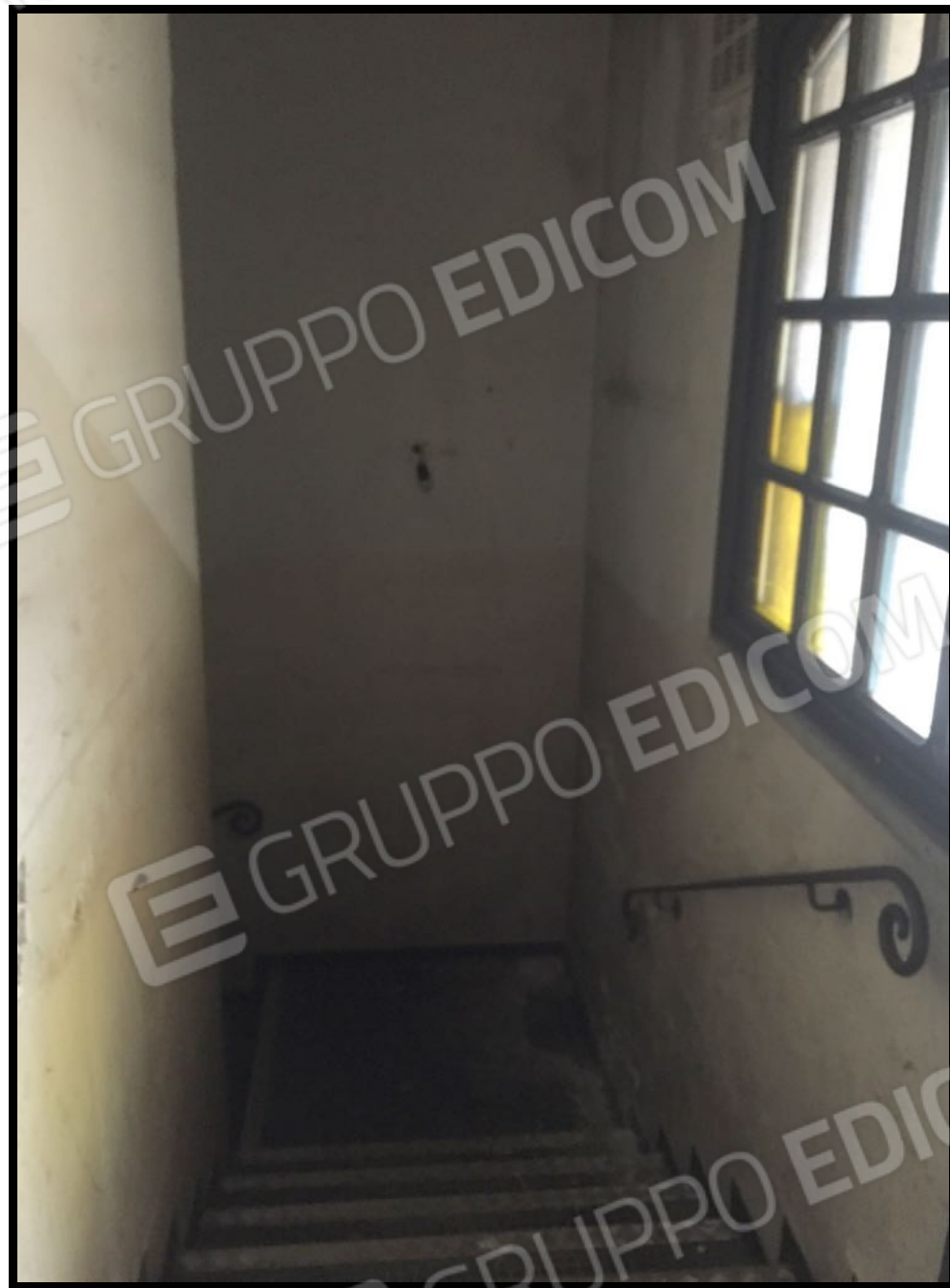
Scala di accesso a piano interrato