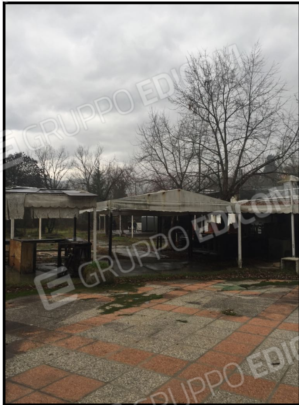
Tettoie/gazebo nell'area cortilizia