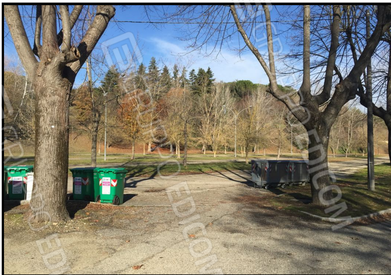
Vista dell'area a parcheggio