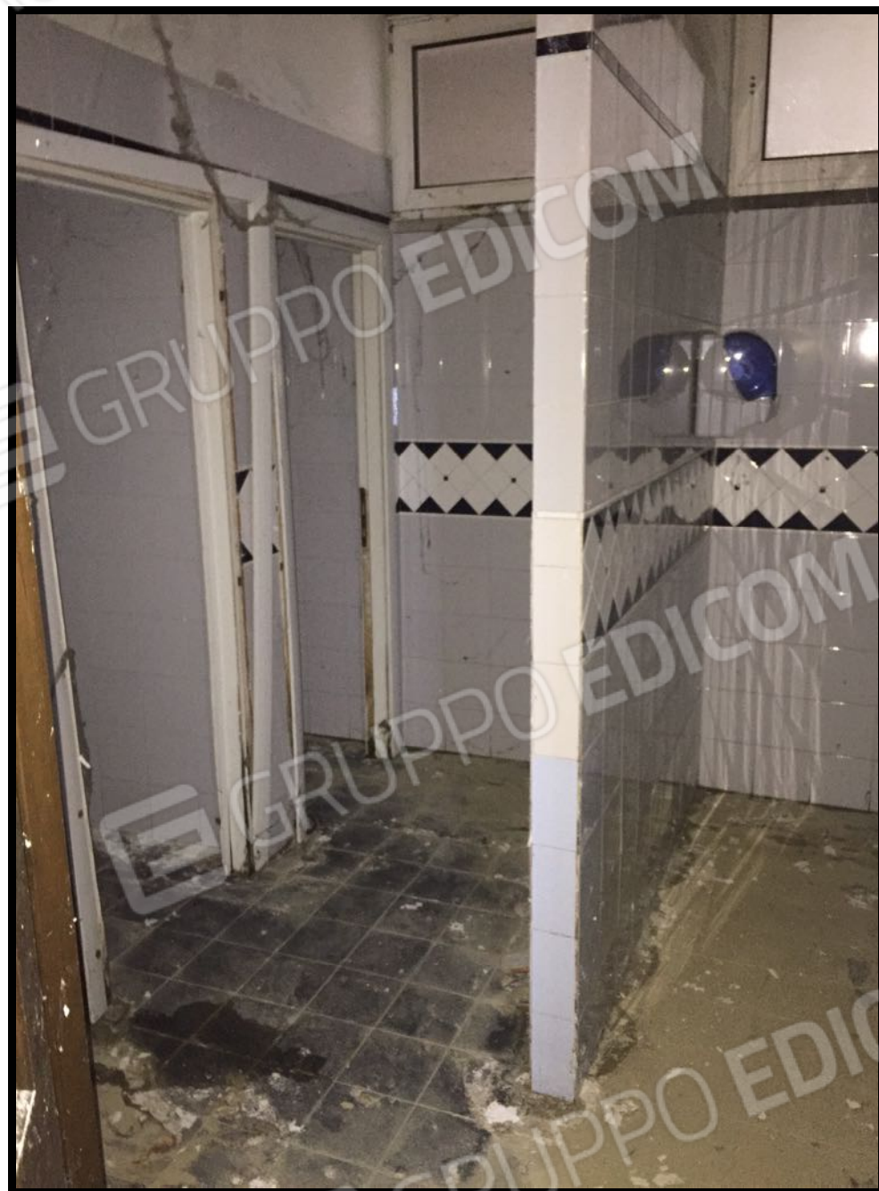
Vani tecnici a piano interrato