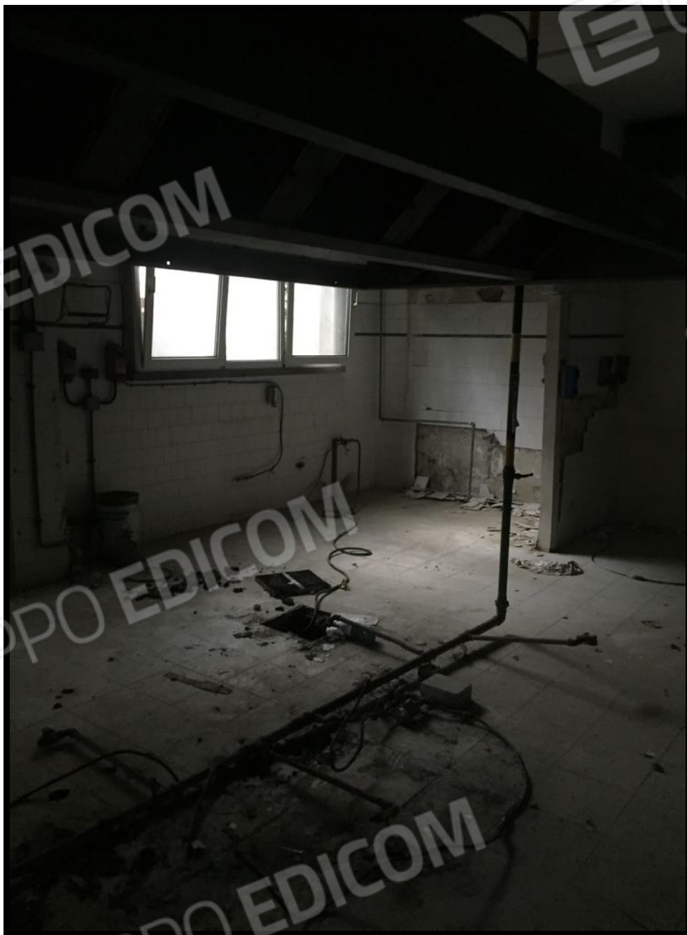
Cucina a piano interrato