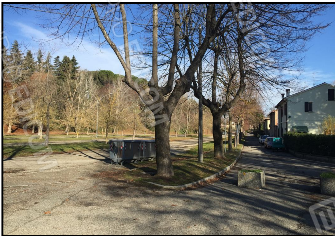
Vista dell'area a parcheggio