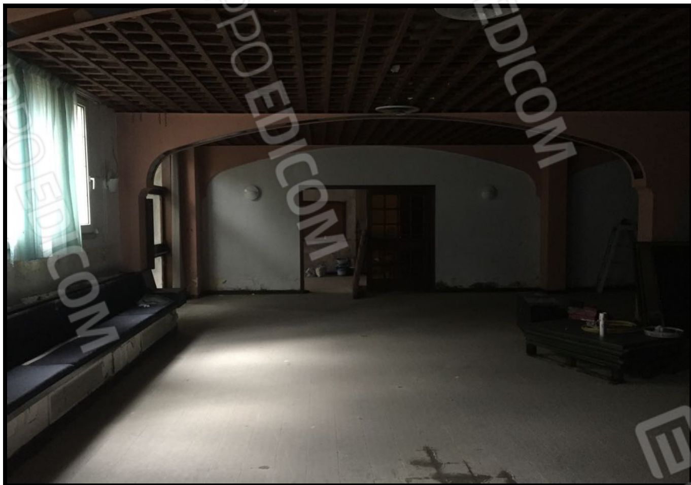
Sala ristorante a piano interrato