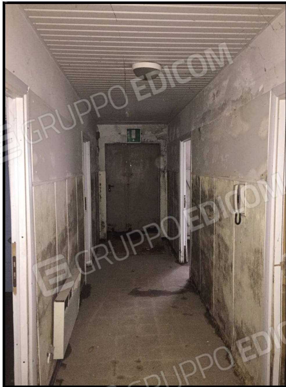
Camerini a piano interrato