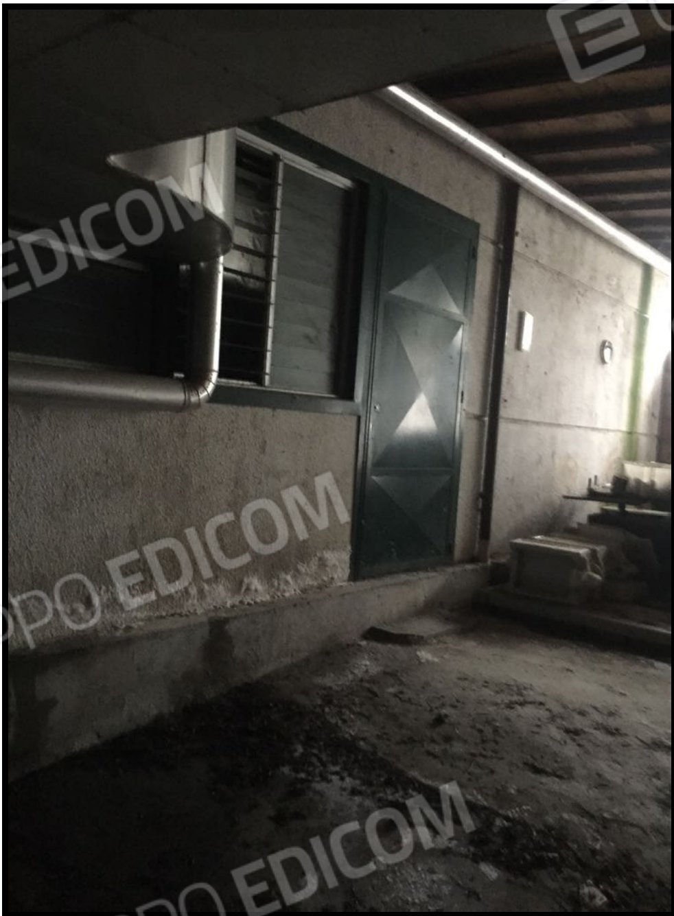
Tettoia a servizio dei vani tecnici