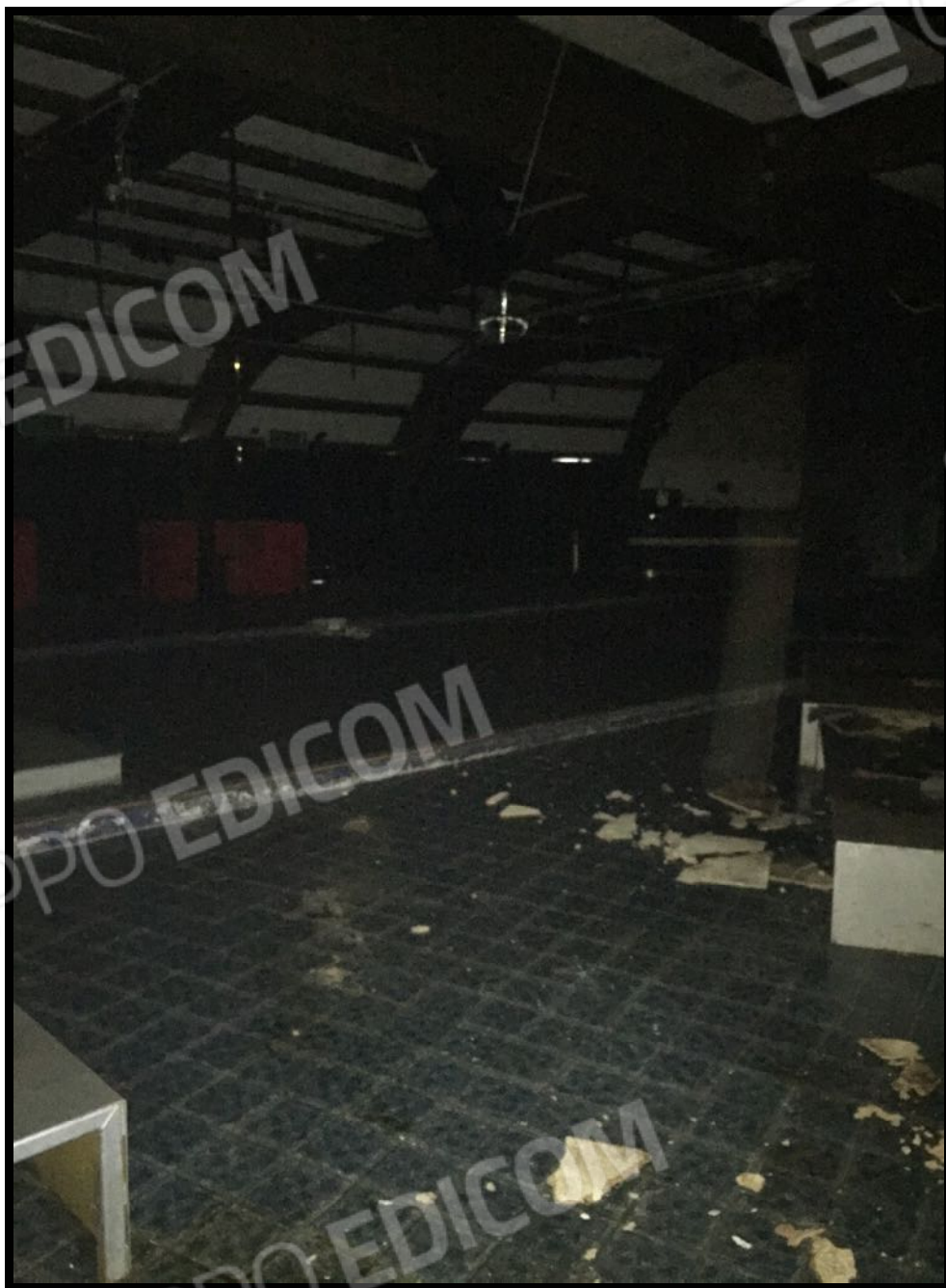
Discoteca: sala con evidenti infiltrazioni