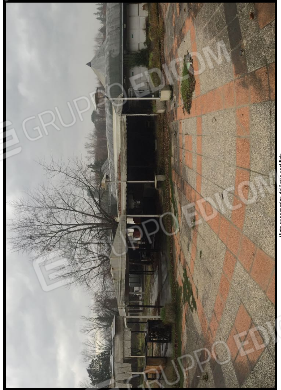
Vista panoramica dell'area cortilizia