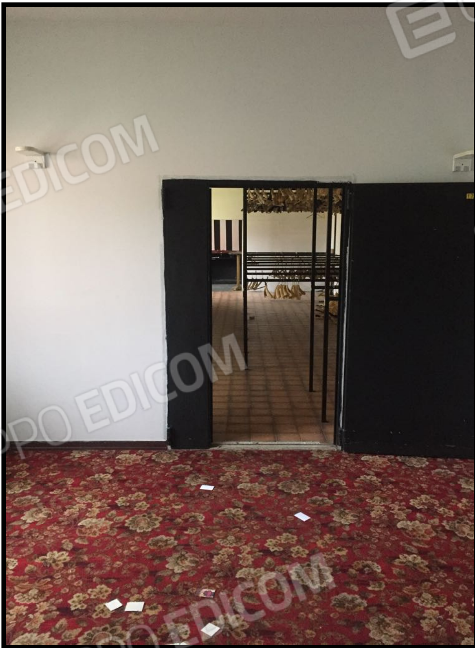
Ingresso e guardaroba