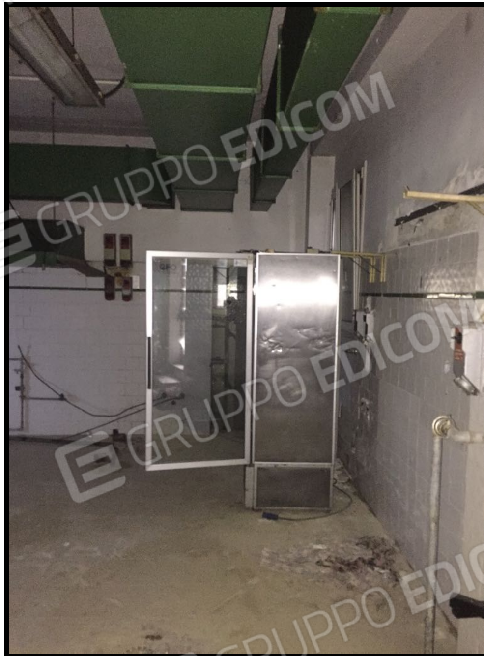
Cucina a piano interrato