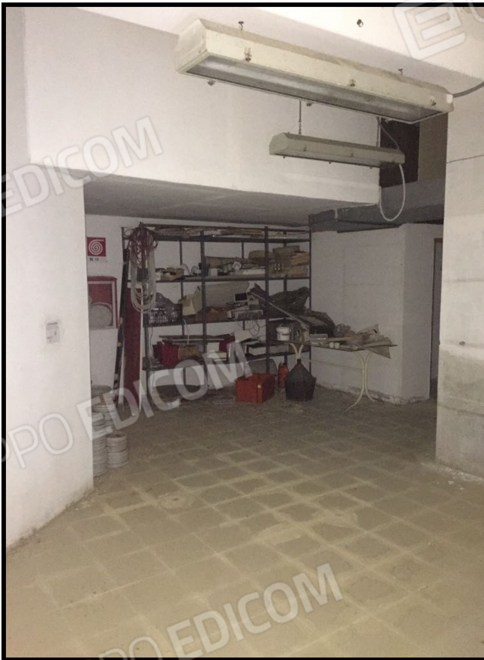
Vani tecnici a piano interrato