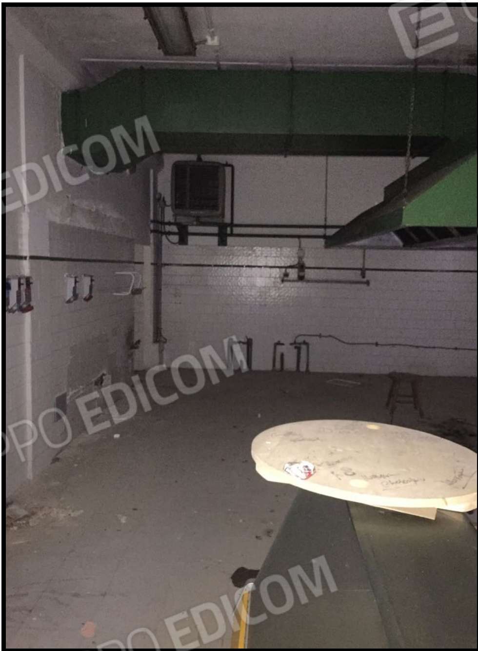
Cucina a piano interrato