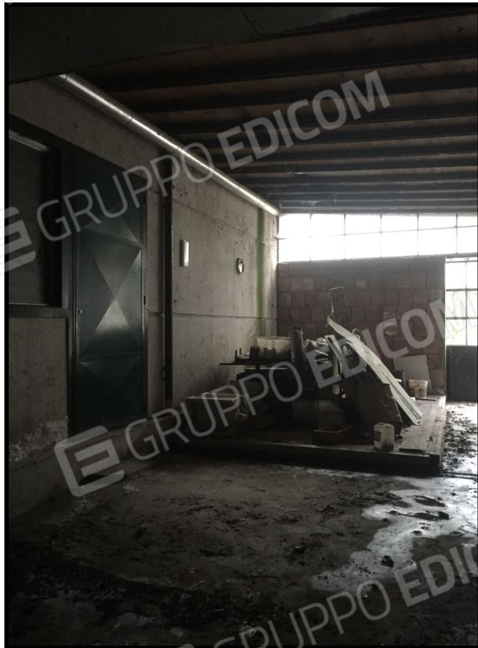
Tettoia a servizio dei vani tecnici