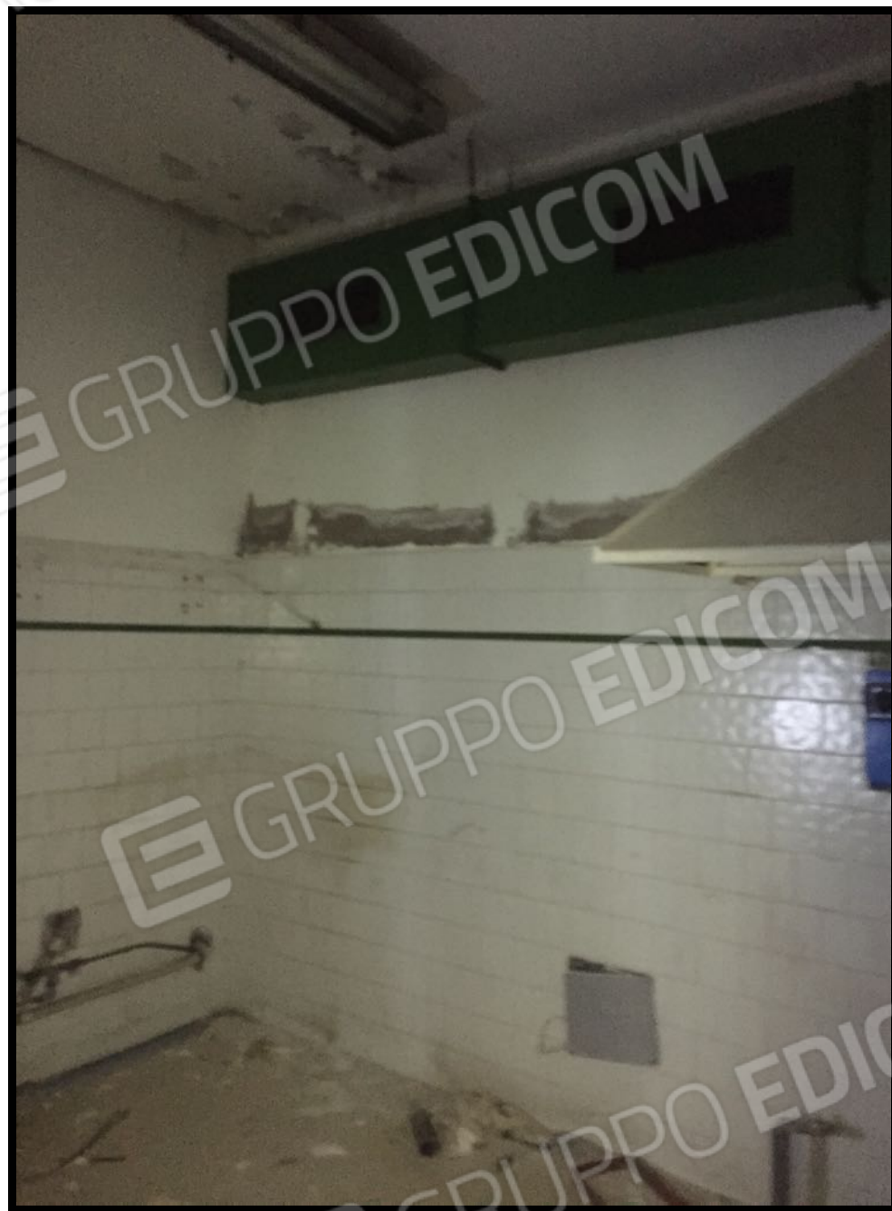
Cucina a piano interrato