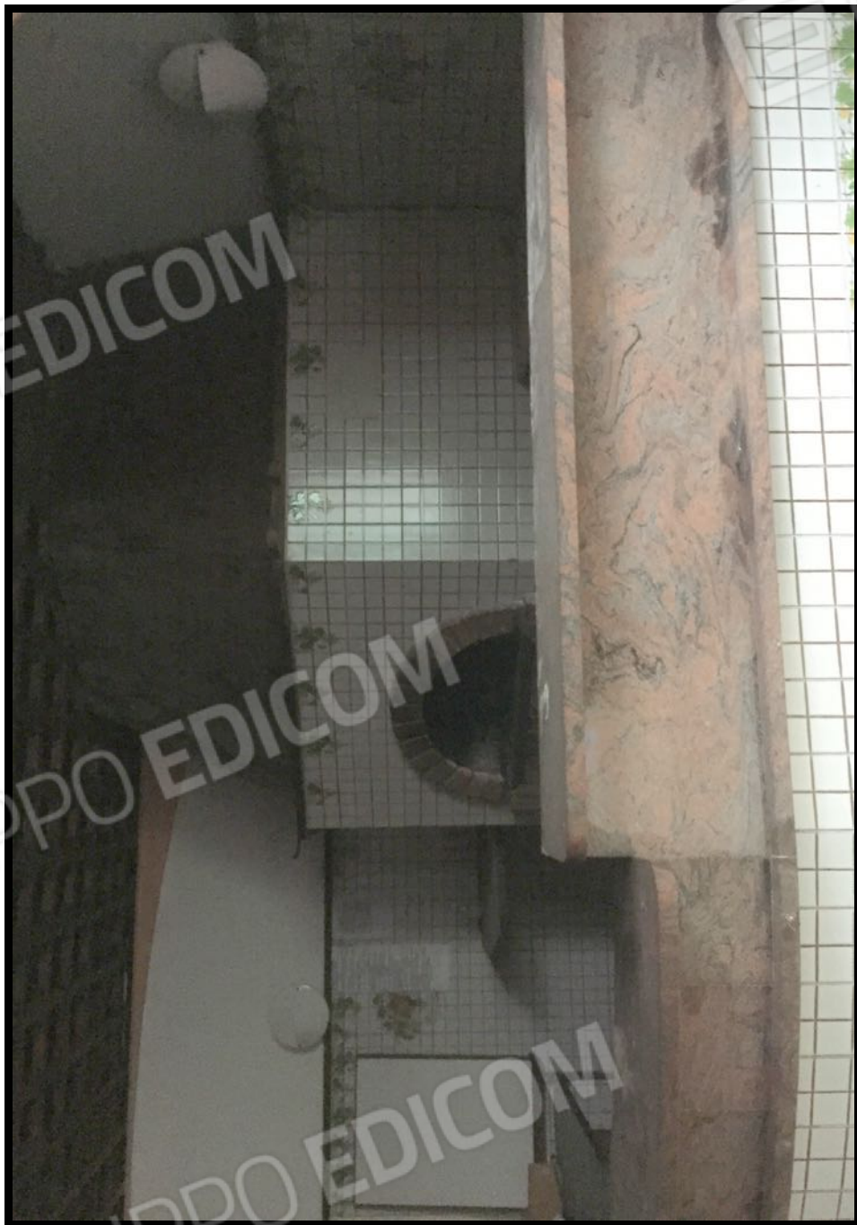
Pizzeria all'interno del ristorante