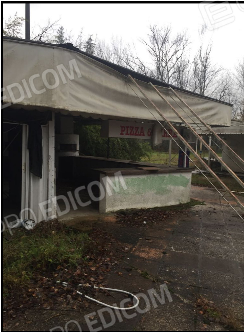
Pizzeria/cucina nell'area cortilizia