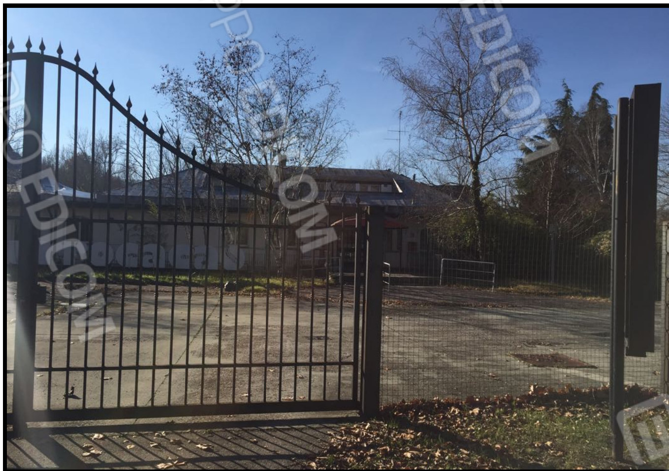
Vista del complesso dall'esterno