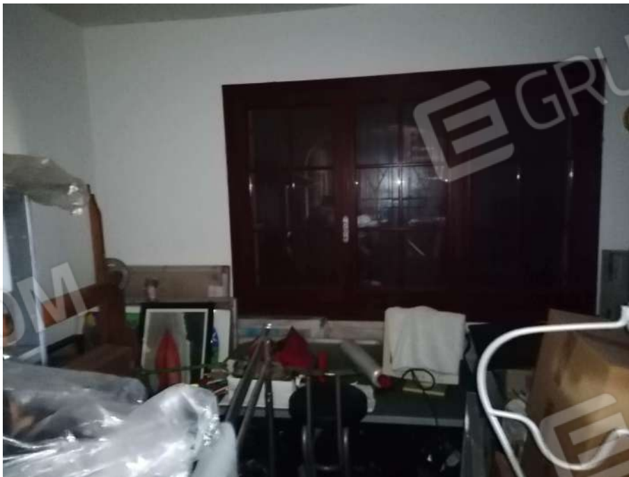
Foto n.11 Stanza