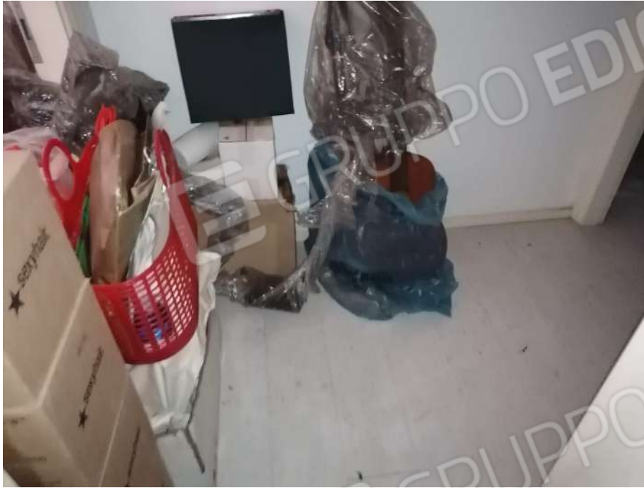
Foto n.10 disimpegno