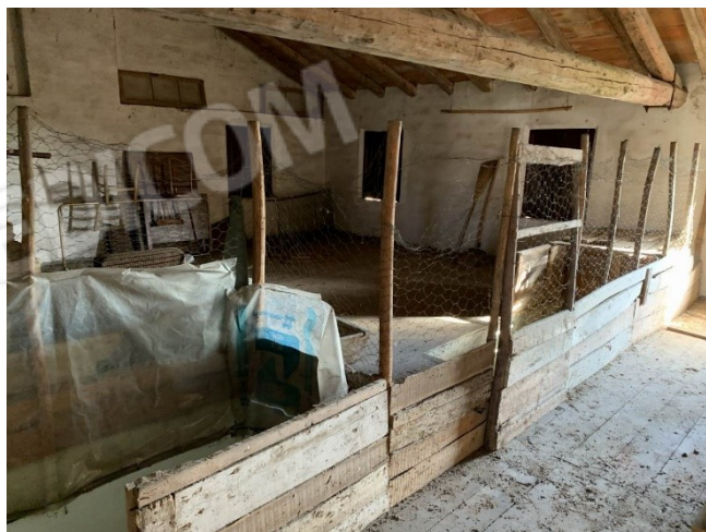
vista interna soffitta non divisa materialmente rispetto alla proprietà terzi