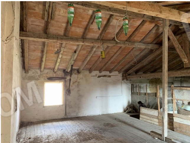
viste interne soffitta