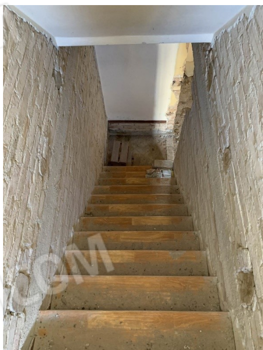
vista scala dal piano terra al primo piano