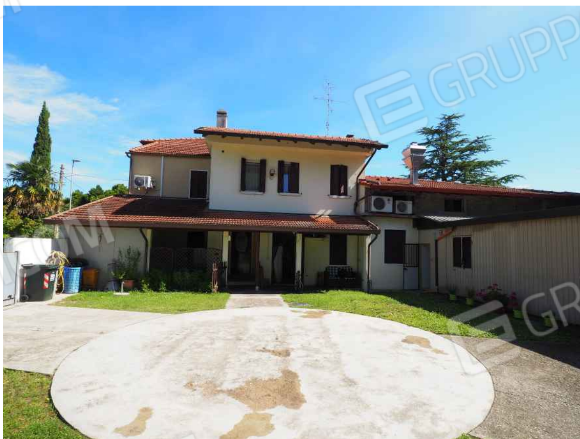
Porcia, via della Centa n. 1 e 3 – Il prospetto ovest e sud della palazzina.