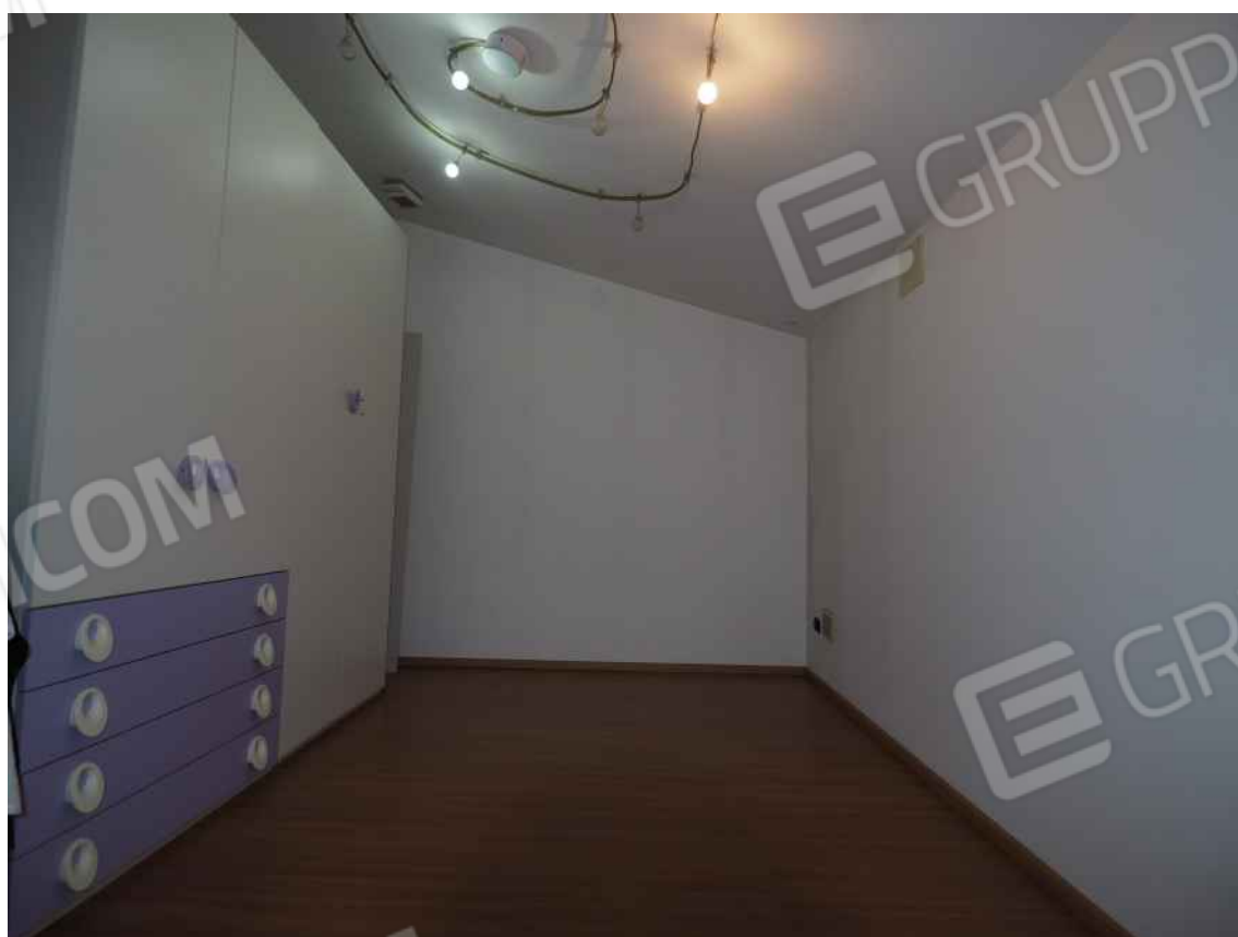
Porcia, via della Centa n. 3, piano I – Il ripostiglio con accesso dalla camera 2.