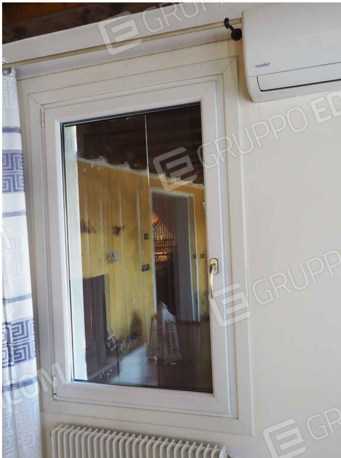
Porcia, via della Centa n. 3 – Particolare degli infissi.