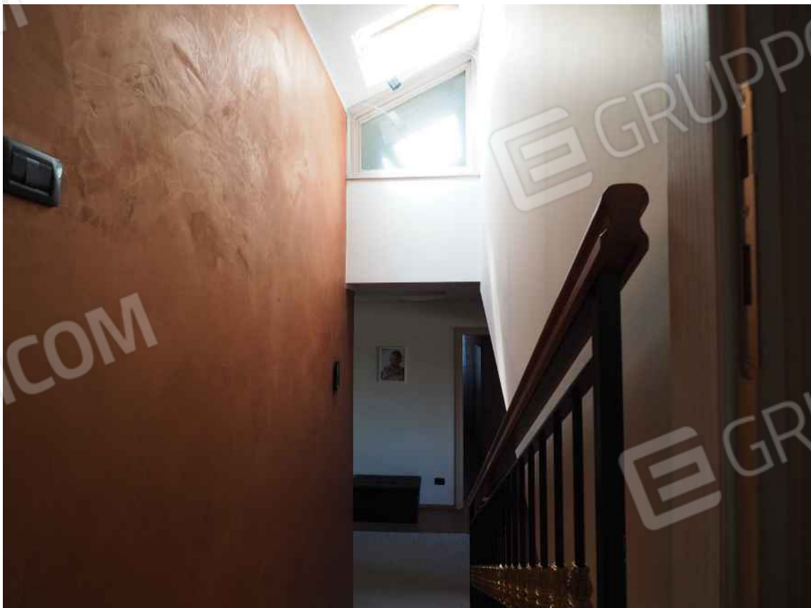
Porcia, via della Centa n. 3 - NCEU foglio 10, part. 19, sub. 8 – La scala che porta al sottotetto.