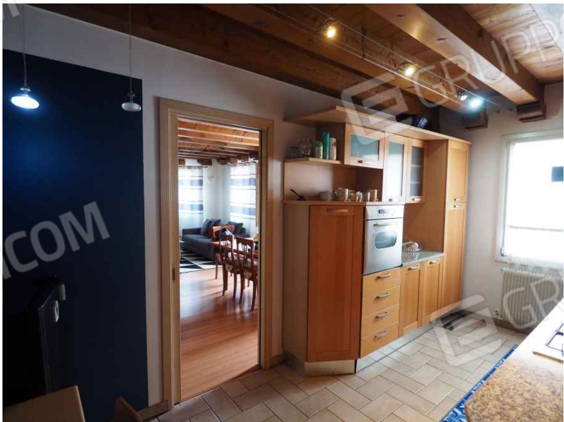
Porcia, via della Centa n. 3, P.I. - NCEU foglio 10, part. 19, sub. 8 – Il vano cucina.