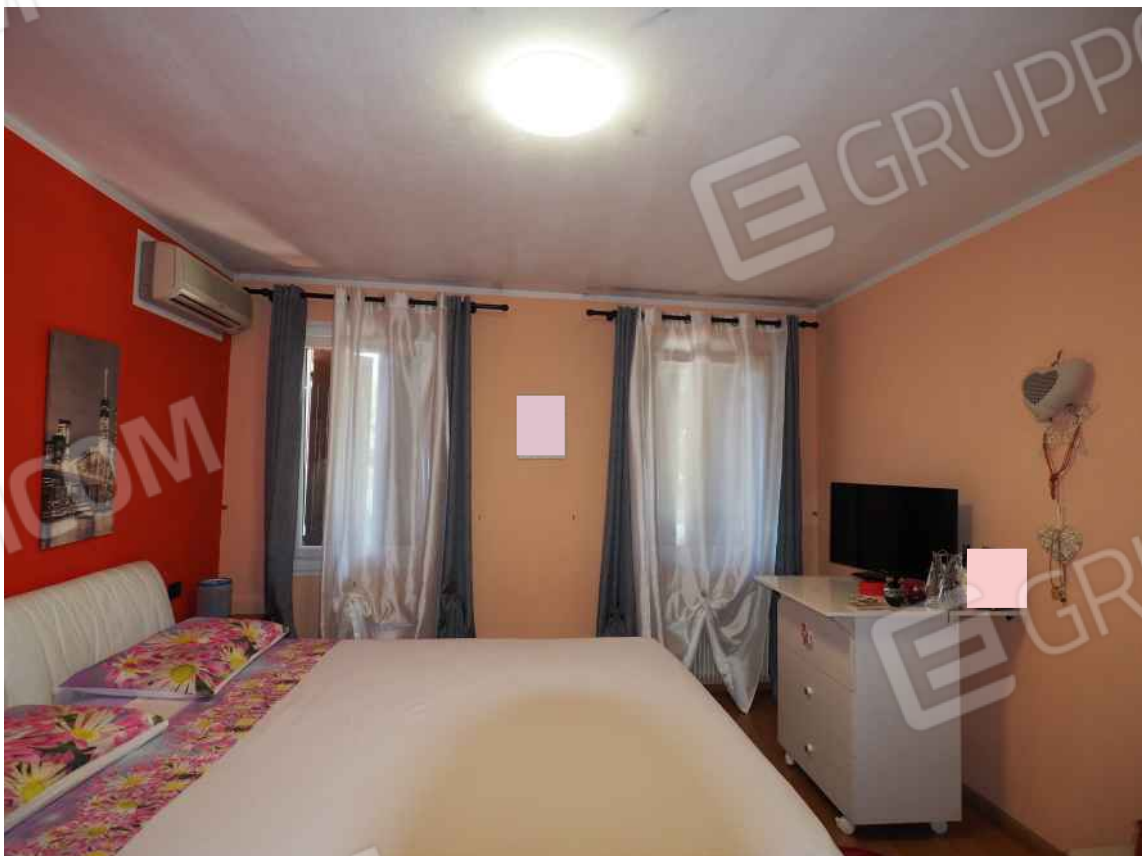
Porcia, via della Centa n. 3, P.I. - NCEU foglio 10, part. 19, sub. 8 – La camera 2.