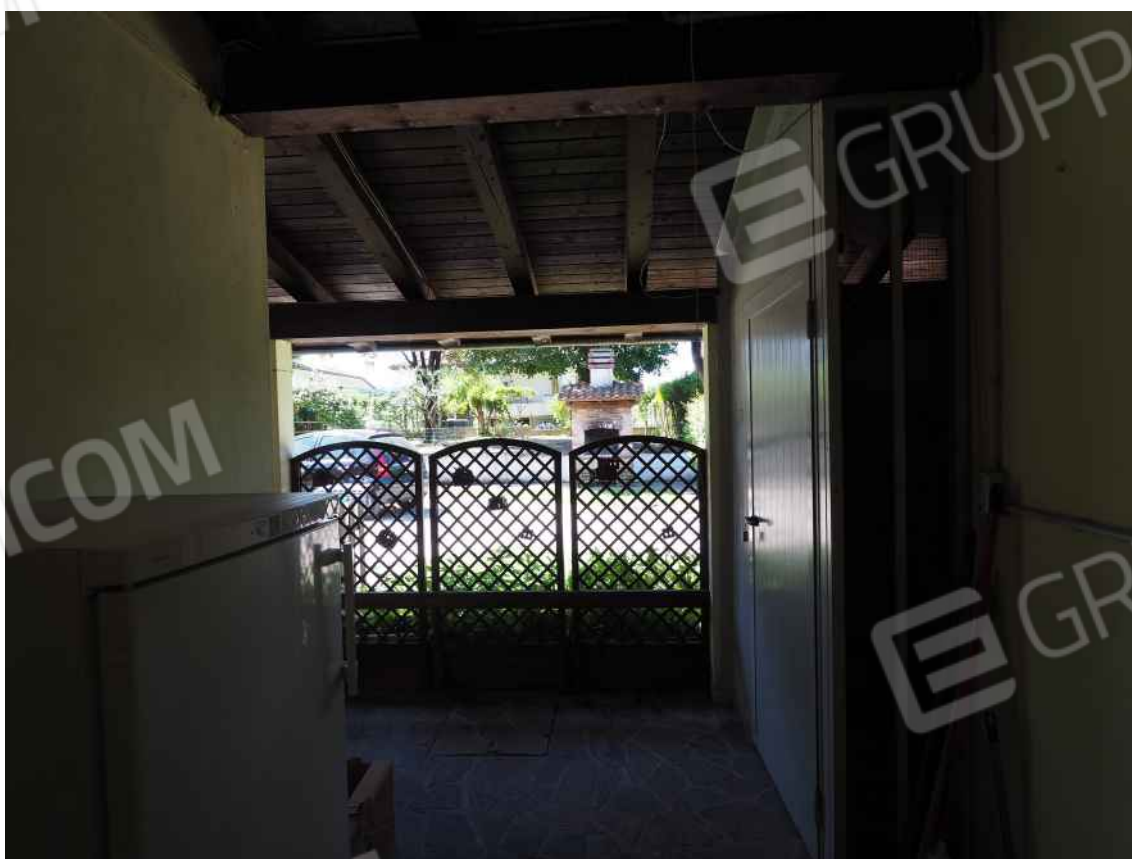
Porcia, via della Centa n. 3 – Il portico interno sul prospetto sud.