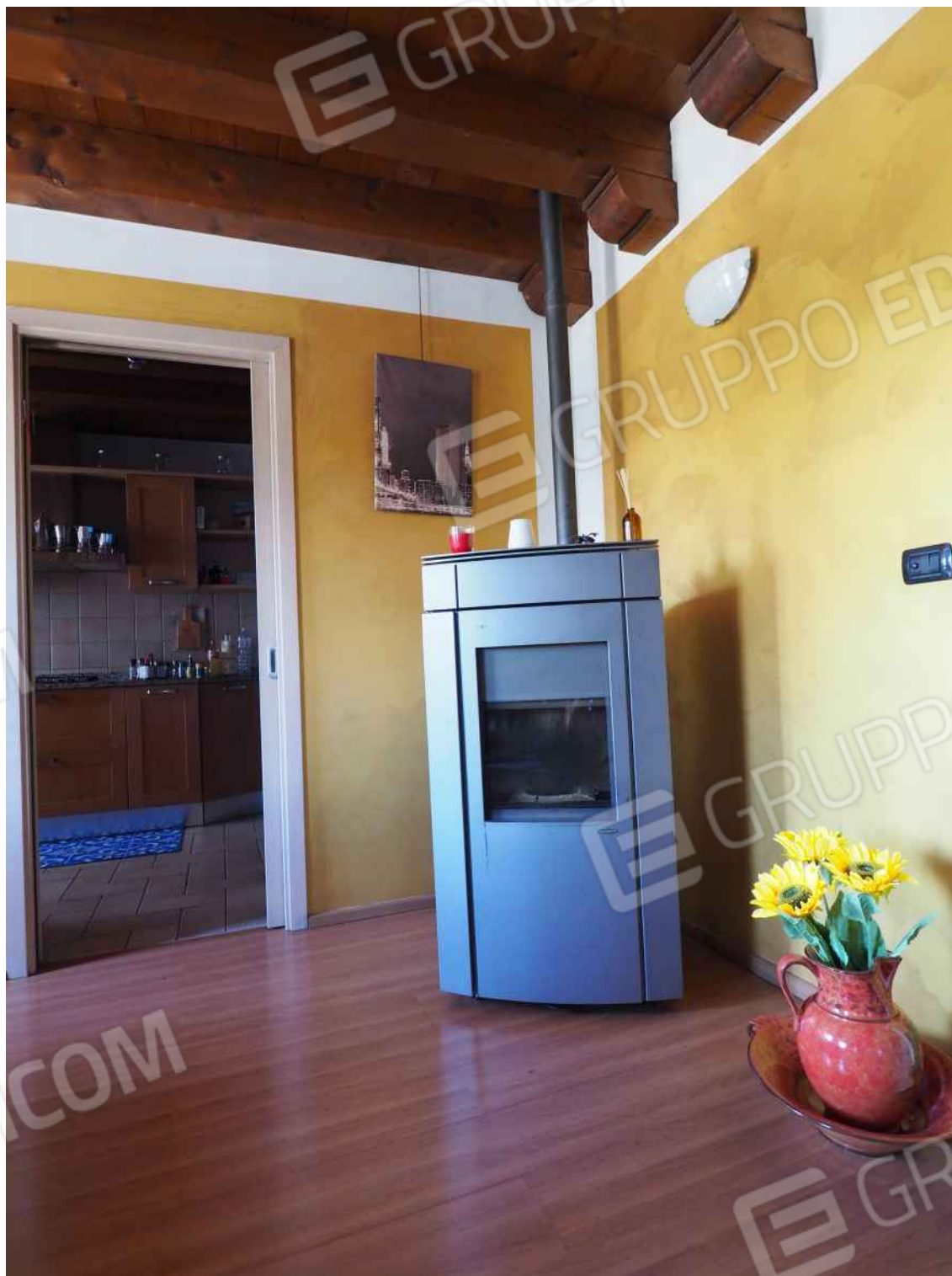
Porcia, via della Centa n. 3 – La stufa a pellet nel vano pranzo soggiorno.