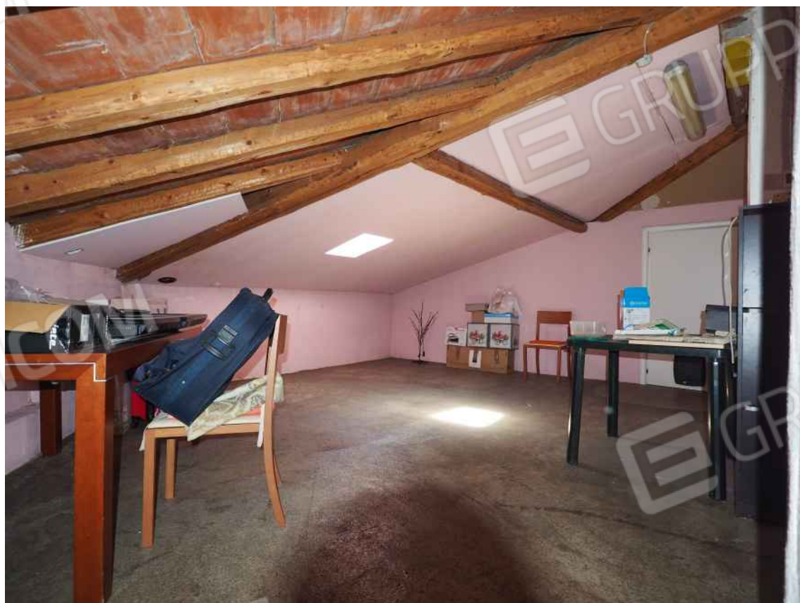
Porcia, via della Centa n. 3, P.I. - NCEU foglio 10, part. 19, sub. 8 – La soffitta.