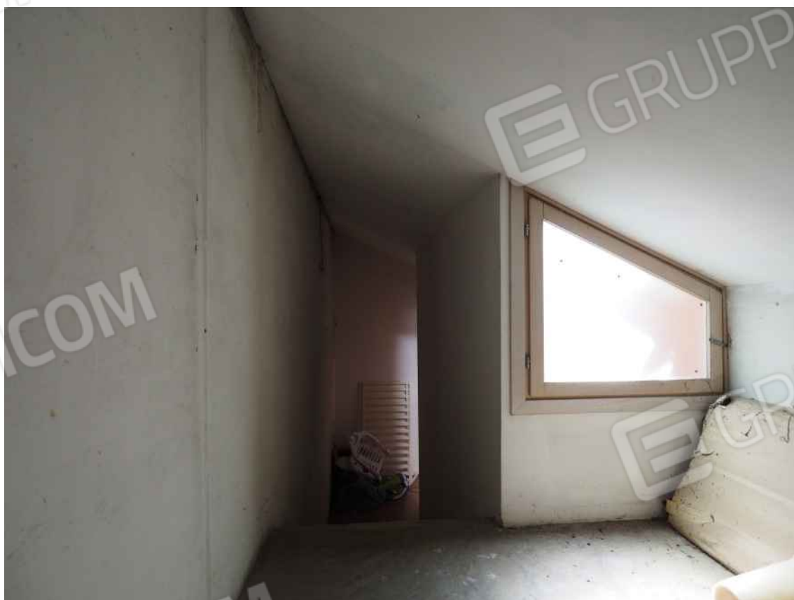
Porcia, via della Centa n. 3, P.II. - NCEU foglio 10, part. 19, sub. 8 – La soffitta.