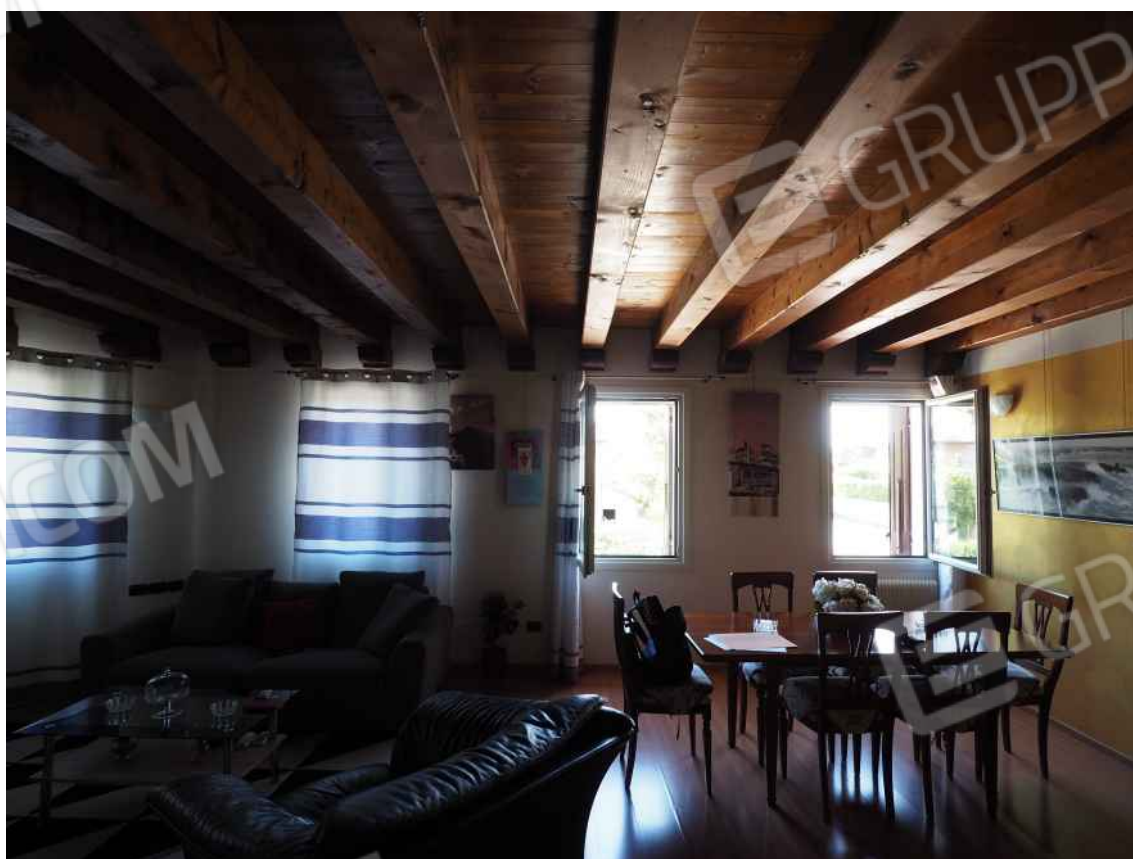
Porcia, via della Centa n. 3, P.I. - NCEU foglio 10, part. 19, sub. 8 – Il vano pranzo – soggiorno.