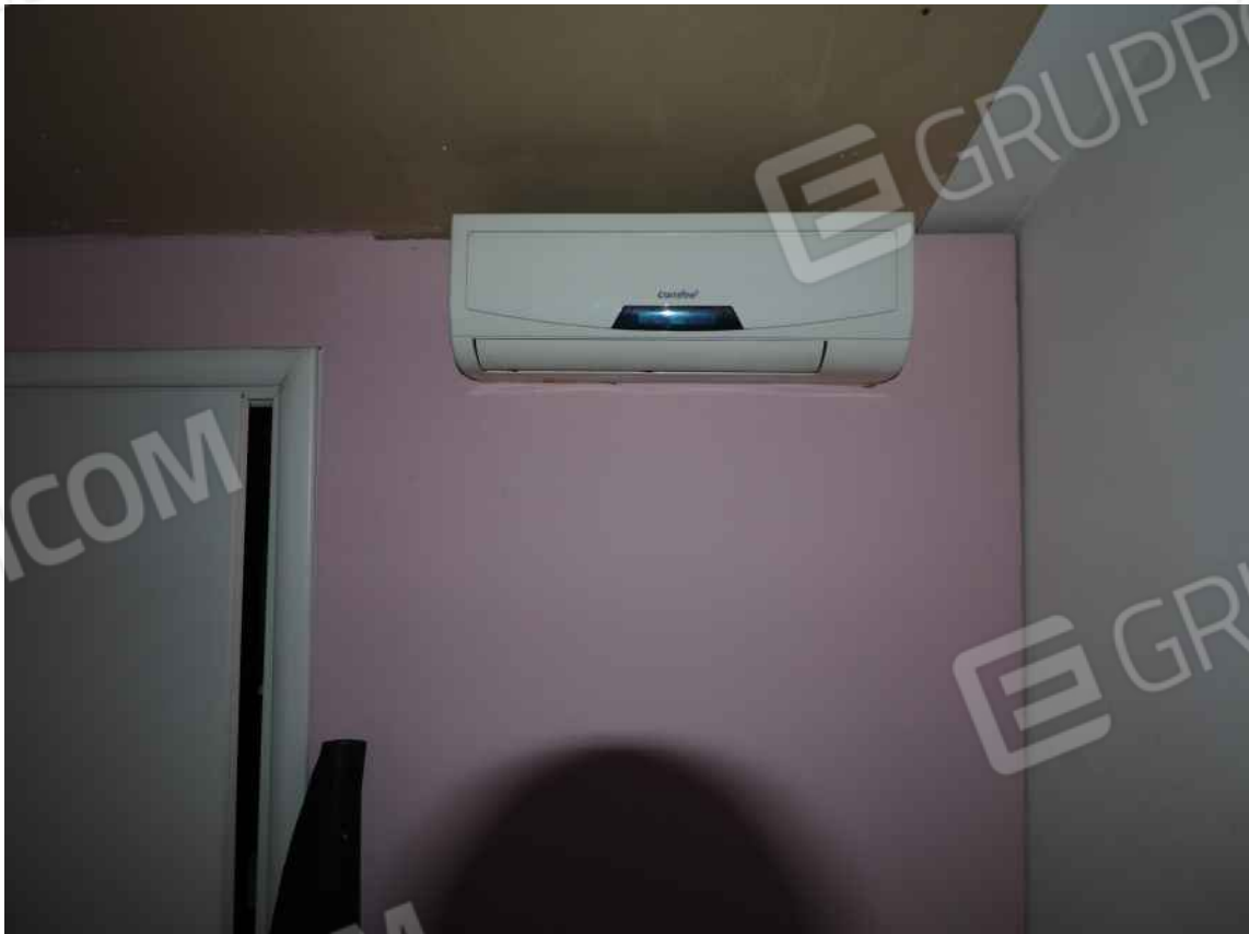
Porcia, via della Centa n. 3 – I condizionatori nella soffitta al piano I.