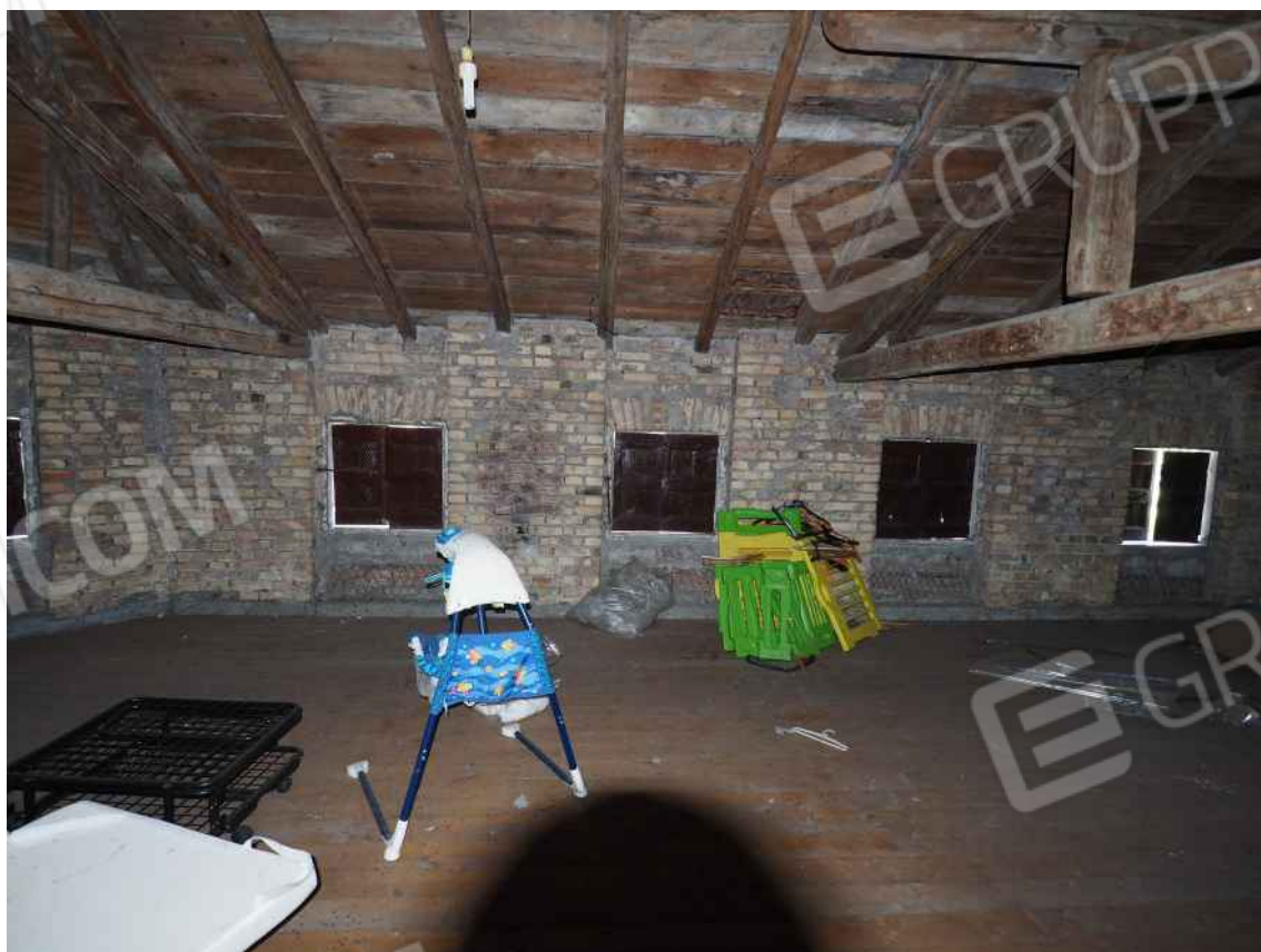
Porcia, via della Centa n. 3, P.II. - NCEU foglio 10, part. 19, sub. 8 – La soffitta.