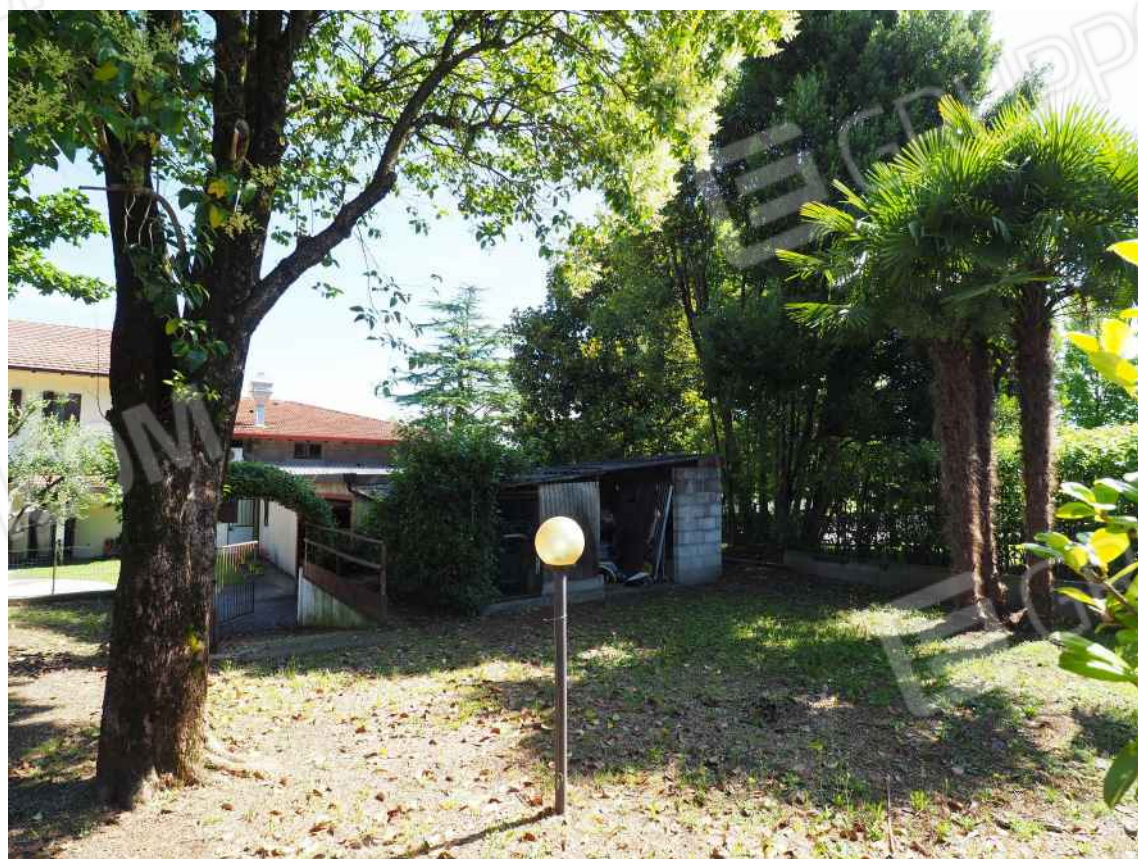
Porcia, via della Centa n. 3 - NCT al foglio 10, part. 429 – Il terreno.