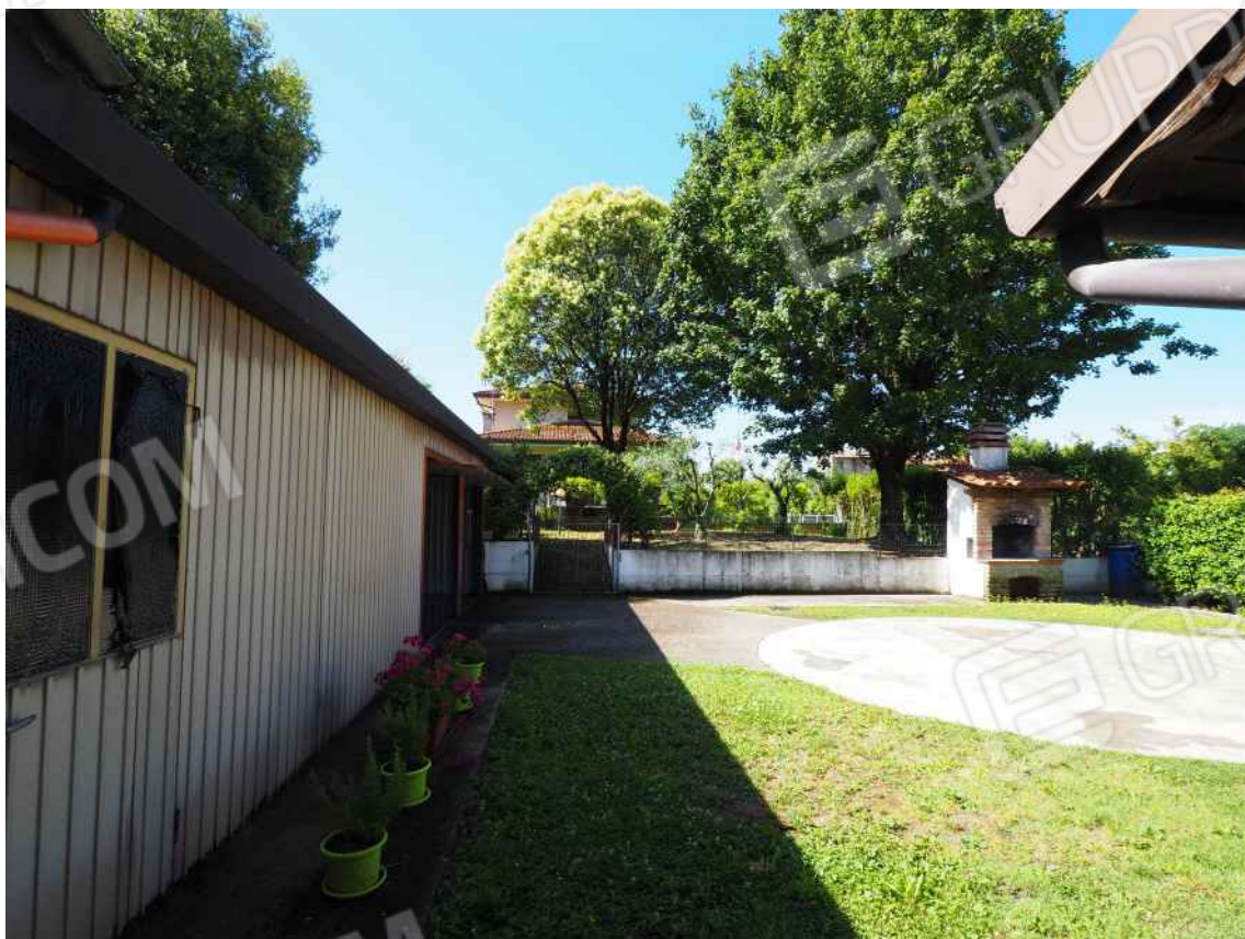
Porcia, via della Centa n. 3 – Il cortile interno.