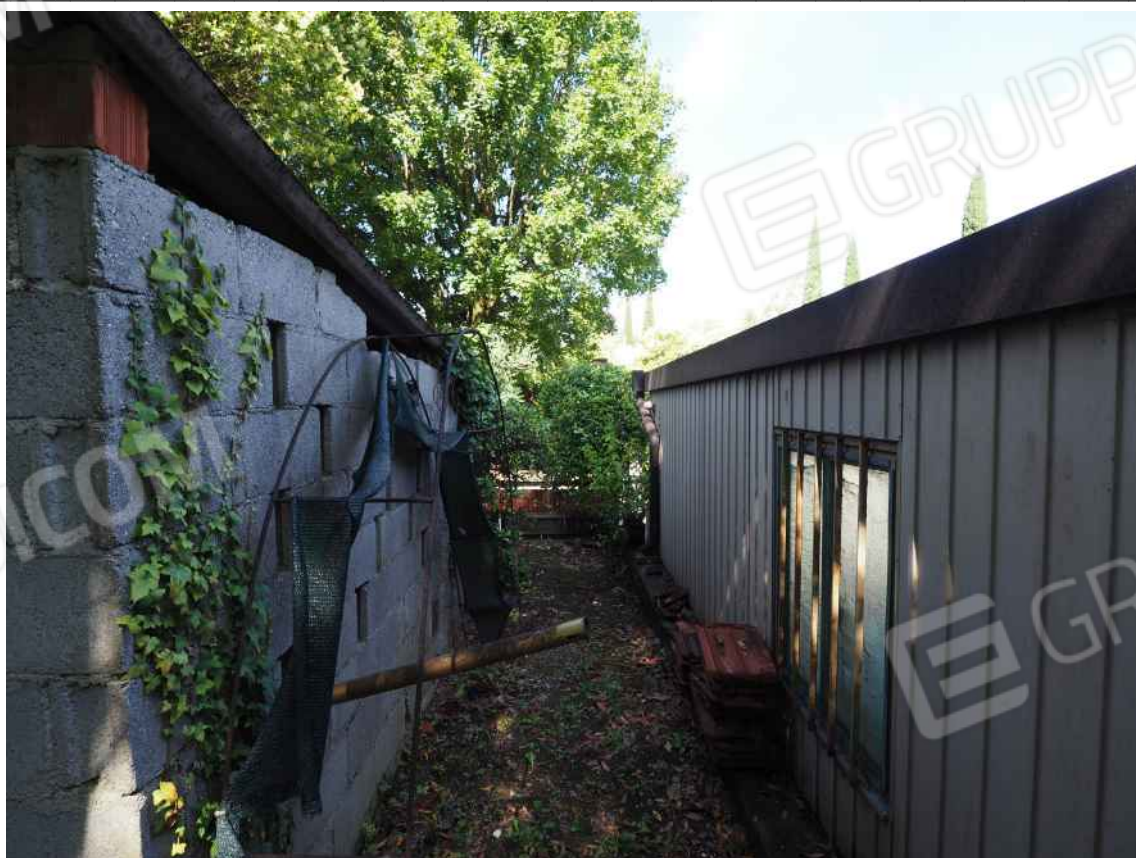
Porcia, via della Centa n. 3 - NCT al foglio 10, part. 429 – Il manufatto abusivo .