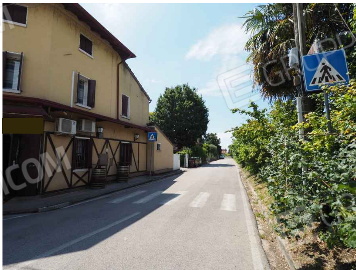
Porcia, via della Centa n. 1 e 3 – Il prospetto nord ed ovest della palazzina.