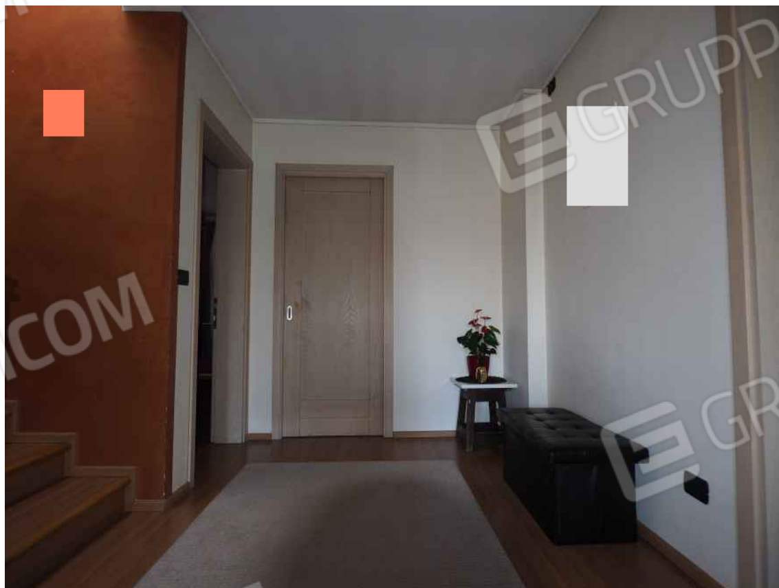
Porcia, via della Centa n. 3, P.I. - NCEU foglio 10, part. 19, sub. 8 – Il disimpegno.