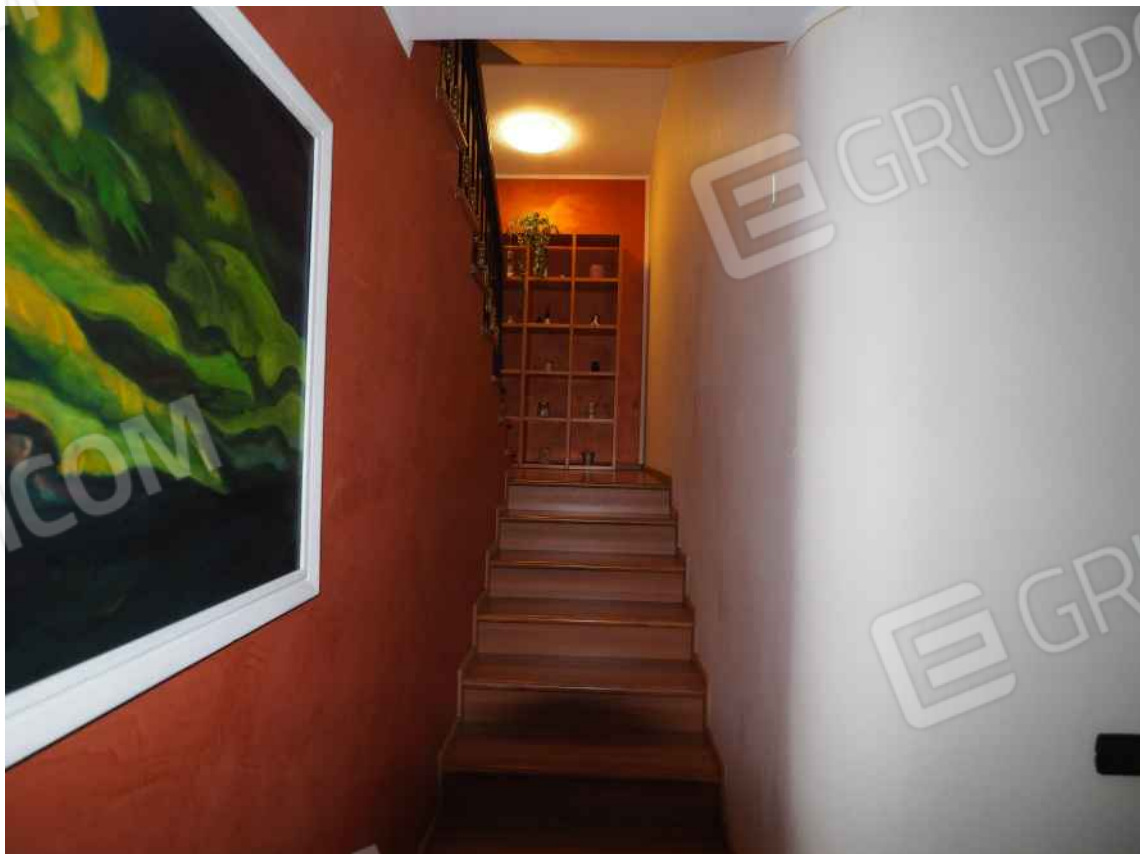
Porcia, via della Centa n. 3, P.T. - NCEU foglio 10, part. 19, sub. 8 – L'ingresso all'abitazione.