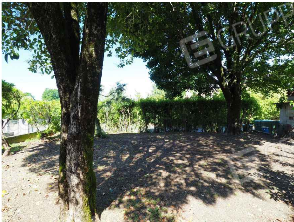
Porcia, via della Centa n. 3 - NCT al foglio 10, part. 429– Il terreno.