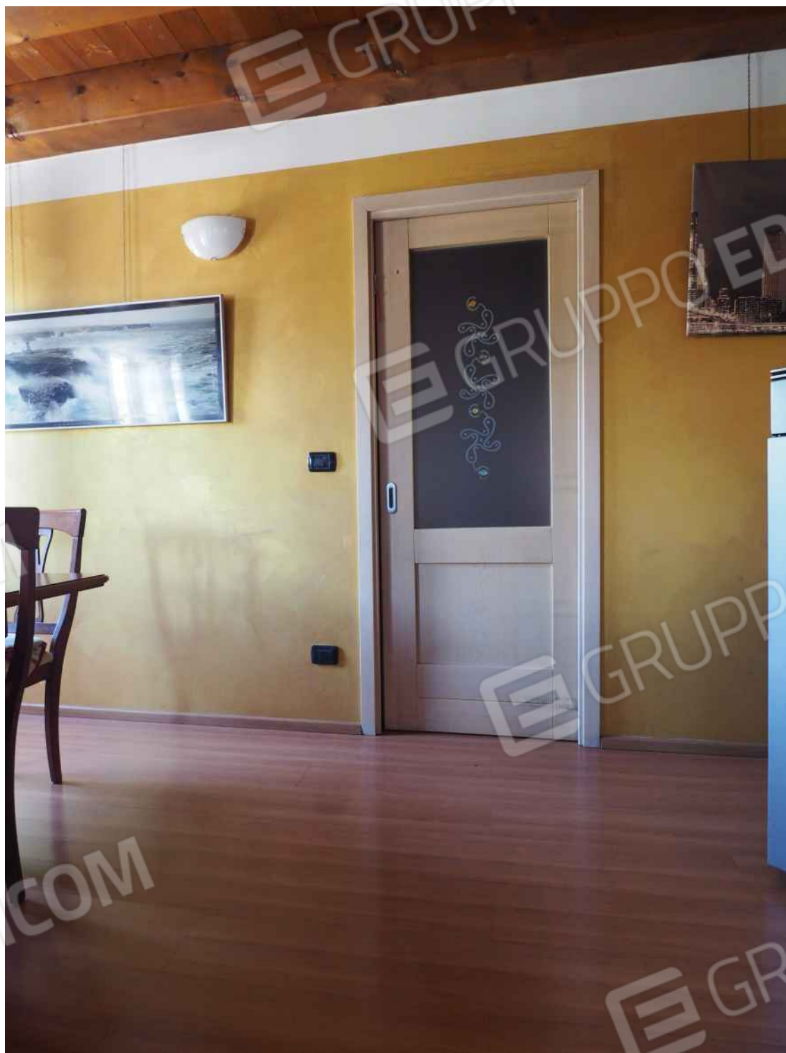
Porcia, via della Centa n. 3 – Particolare della porta interna nel vano pranzo soggiorno.