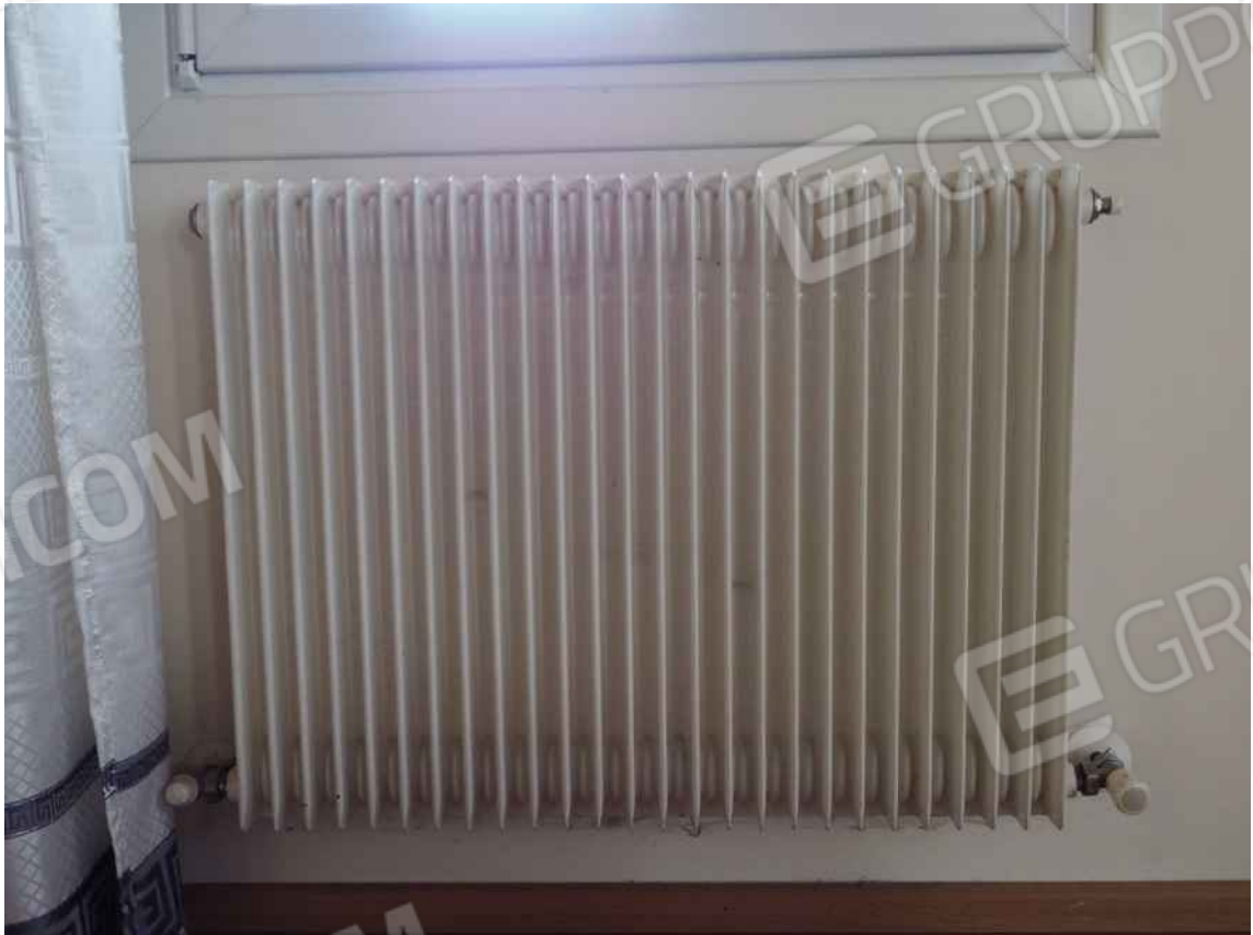
Porcia, via della Centa n. 3 – Il condizionatore ed il radiatore nel vano pranzo soggiorno.