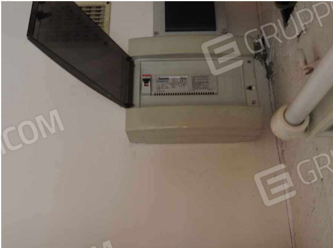
Porcia, via della Centa n. 3 – Sopra particolari degli interruttori e delle placchette, sotto un quadro elettrico ubicato nella soffitta.