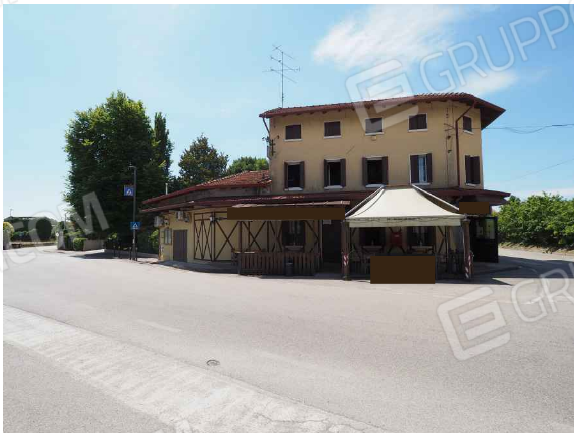
Porcia, via della Centa n. 1 e 3 – Sopra l'aerofotogrammetria, sotto il prospetto nord della palazzina.