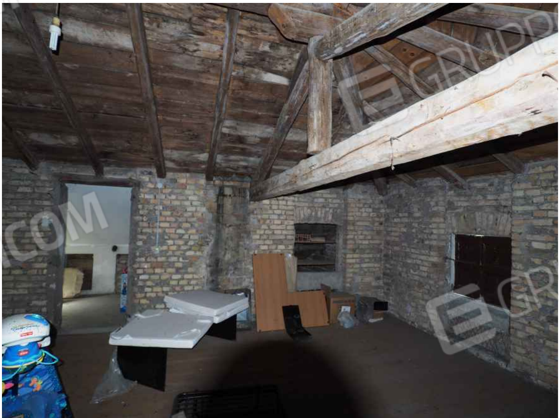
Porcia, via della Centa n. 3, P.II. - NCEU foglio 10, part. 19, sub. 8 – La soffitta.