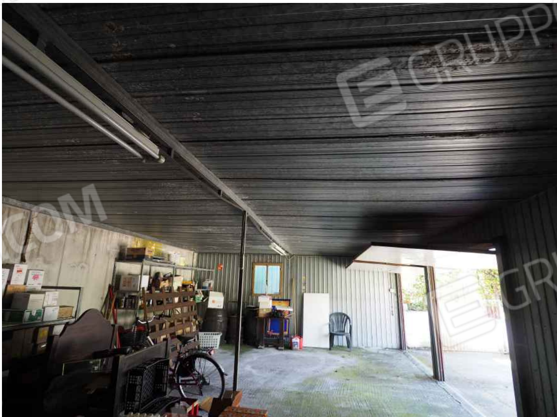
Porcia, via della Centa n. 3 - NCEU foglio 10, part. 19, sub. 11 – Il garage.