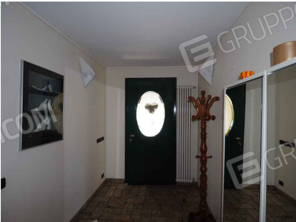
Porcia, via della Centa n. 3, P.T. - NCEU foglio 10, part. 19, sub. 8 – L'ingresso all'abitazione.