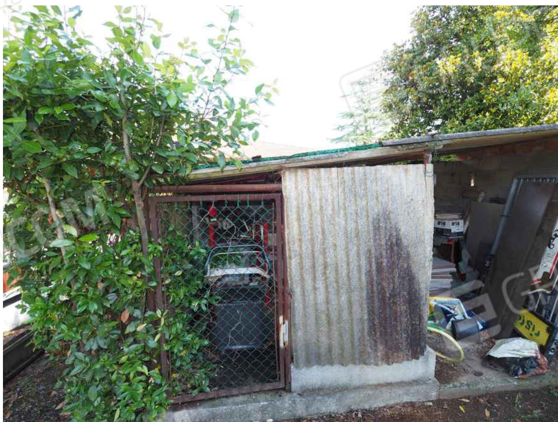
Porcia, via della Centa n. 3 - NCT al foglio 10, part. 429 – Il manufatto abusivo.