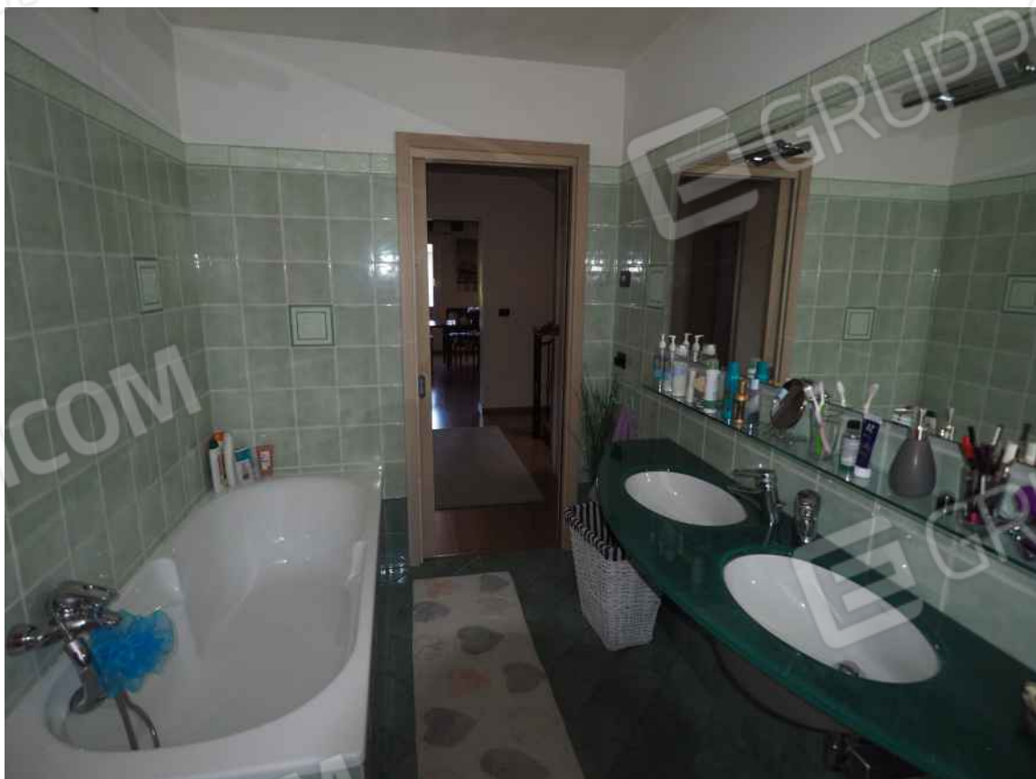
Porcia, via della Centa n. 3, P.I. - NCEU foglio 10, part. 19, sub. 8 – Il bagno.