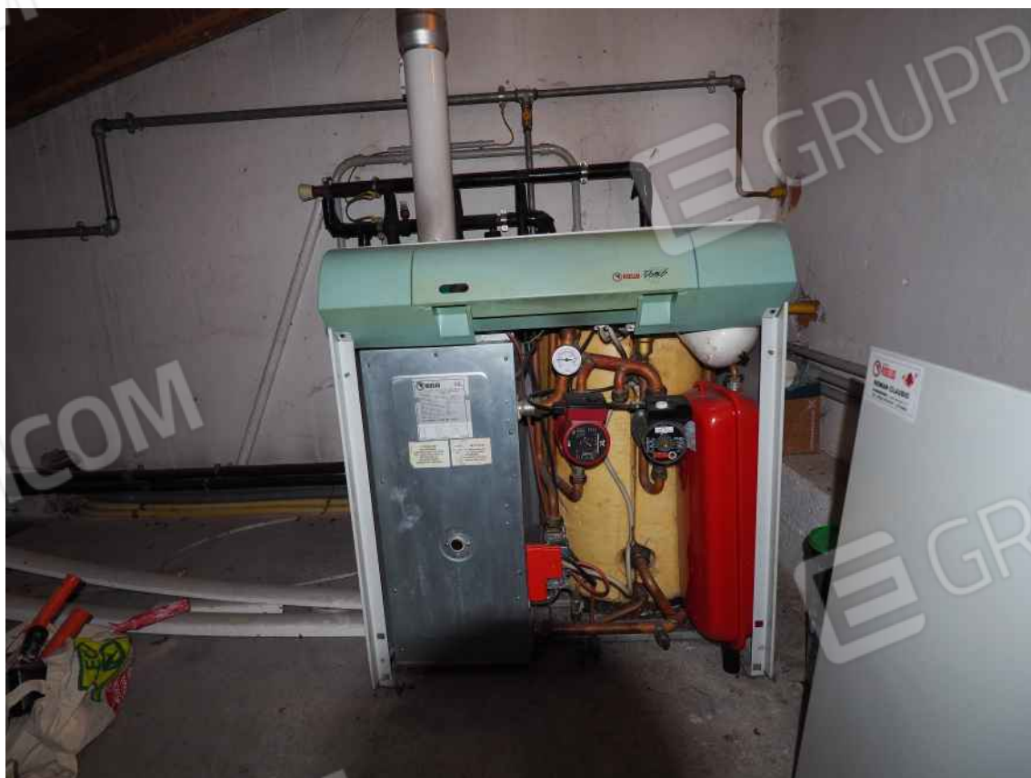
Porcia, via della Centa n. 3, P.I. - NCEU foglio 10, part. 19, sub. 8 – Il ripostiglio.