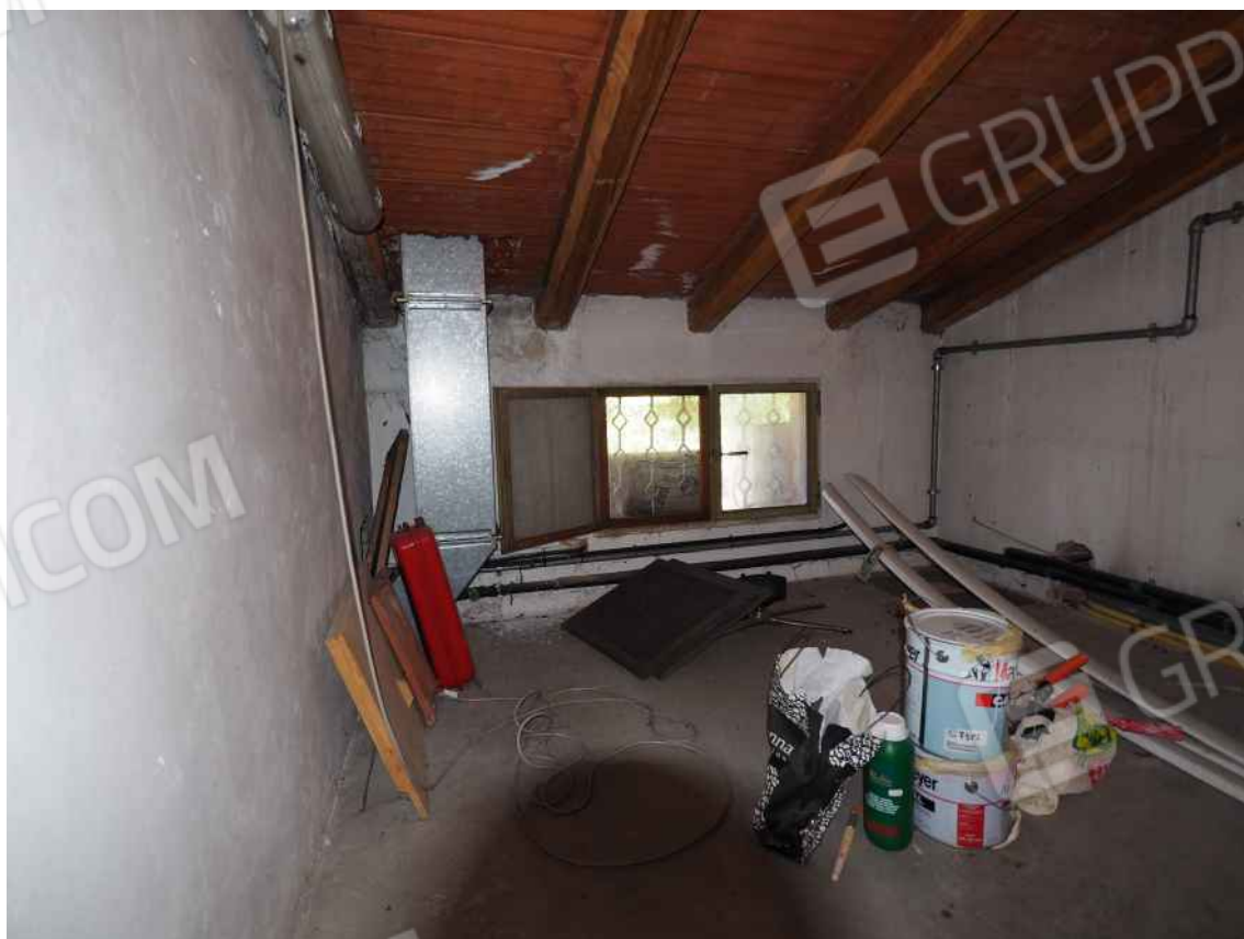
Porcia, via della Centa n. 3, P.I. - NCEU foglio 10, part. 19, sub. 8 – Sopra la soffitta, sotto il ripostiglio.