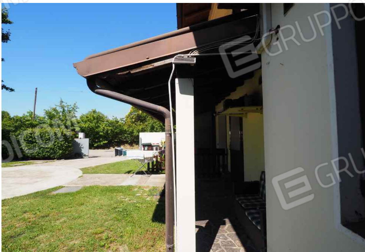
Porcia, via della Centa n. 3 – Il portico interno sul prospetto sud.