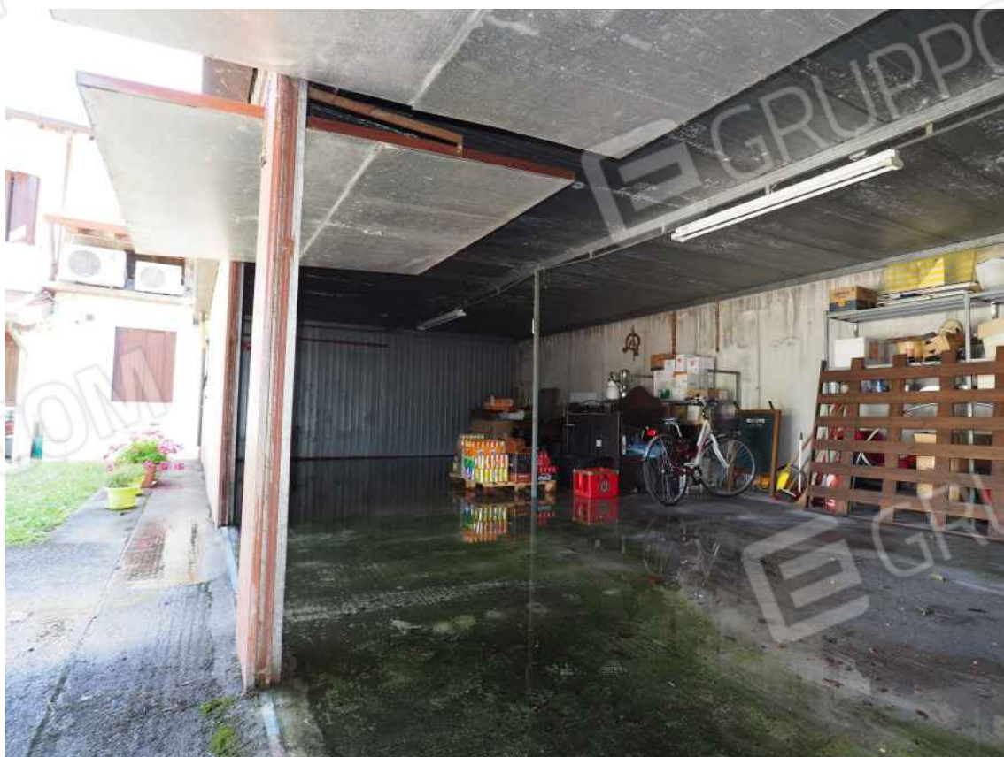
Porcia, via della Centa n. 3 - NCEU foglio 10, part. 19, sub. 11 – Il garage allagato dalle piogge.