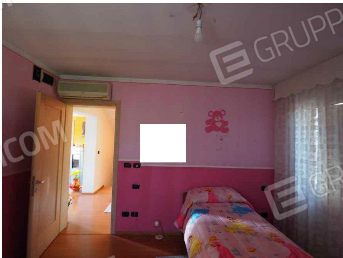
Porcia, via della Centa n. 3, P.I. - NCEU foglio 10, part. 19, sub. 8 – La camera 1.