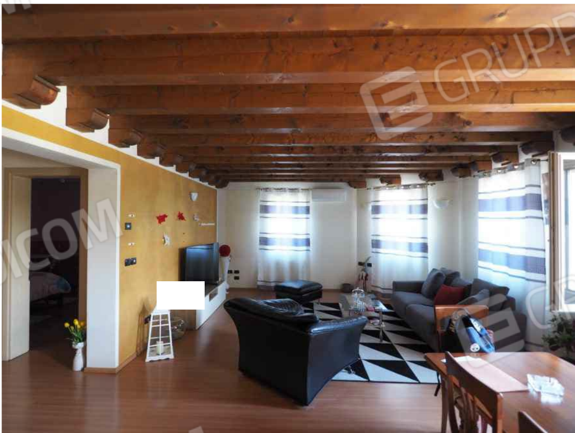
Porcia, via della Centa n. 3, P.I. - NCEU foglio 10, part. 19, sub. 8 – Il vano pranzo – soggiorno.