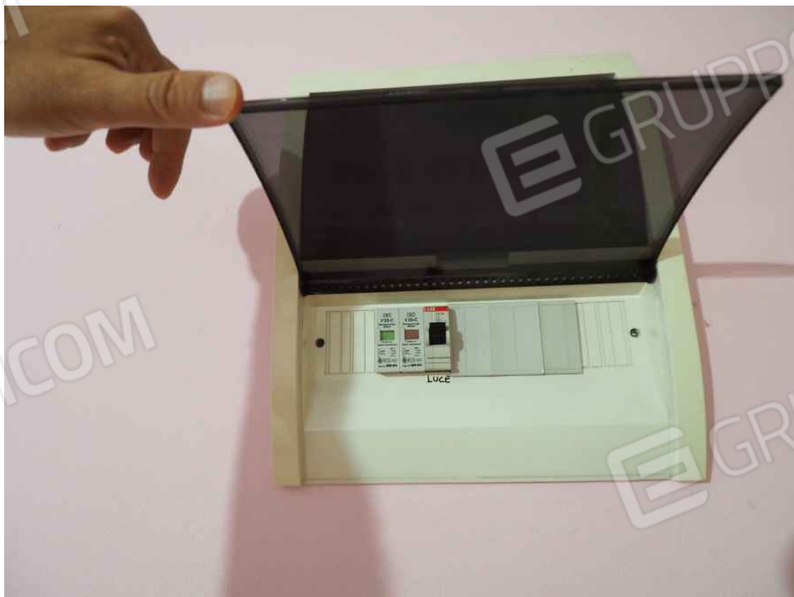
Porcia, via della Centa n. 3 – Due quadri elettrici ubicati nella camera 1.