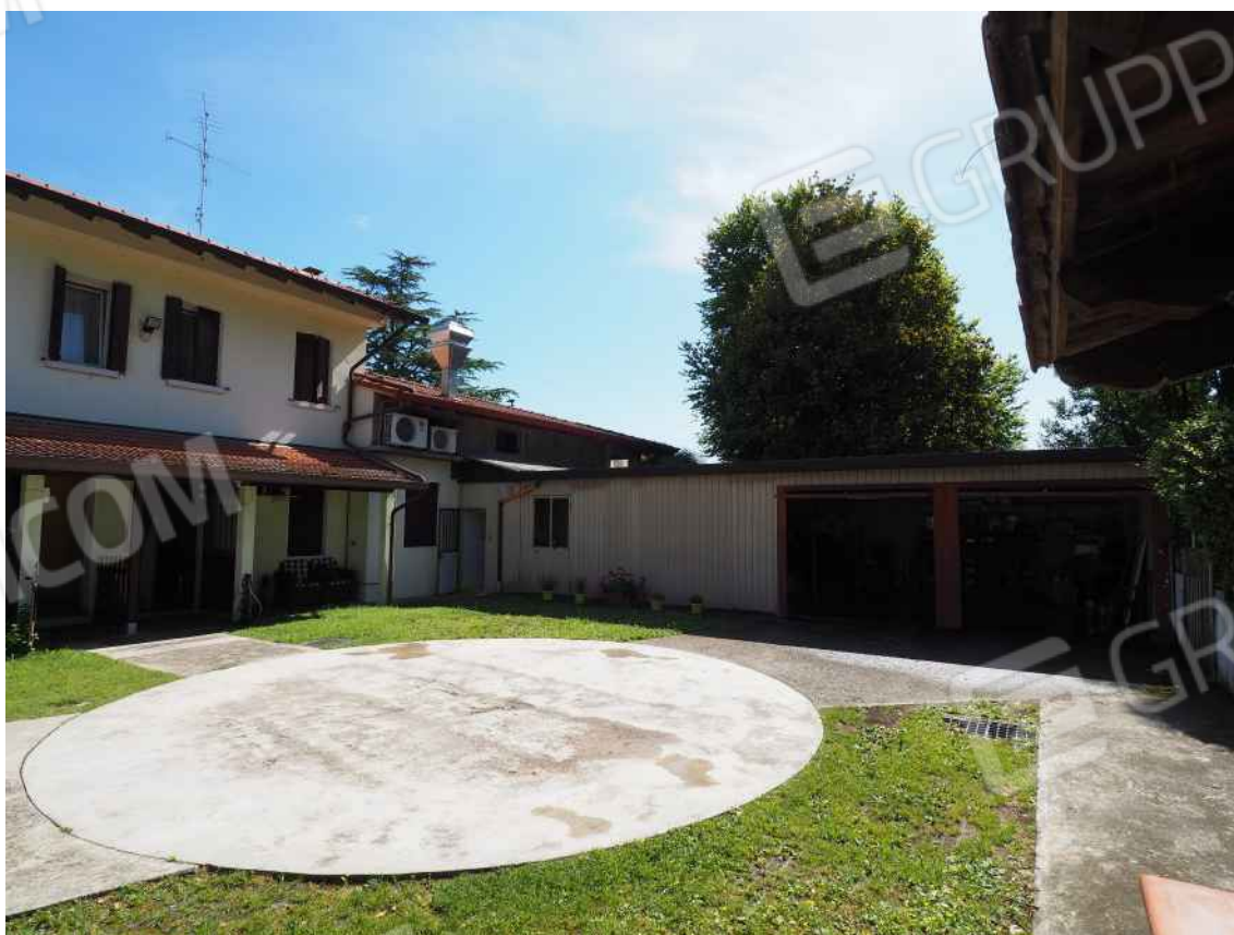
Porcia, via della Centa n. 3 – Il cortile interno.