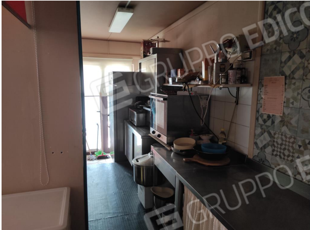
Vista parziale interna della zona preparazione alimenti nel retro bancone della zona bar.