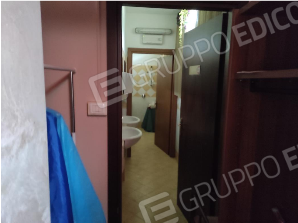
Vista parziale interna della zona servizi con antibagno e bagno.