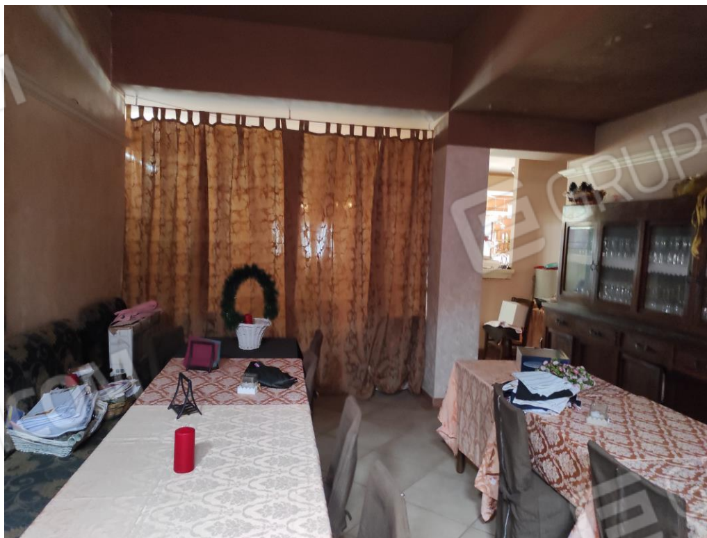
Vista parziale interna di parte della zona degustazione.