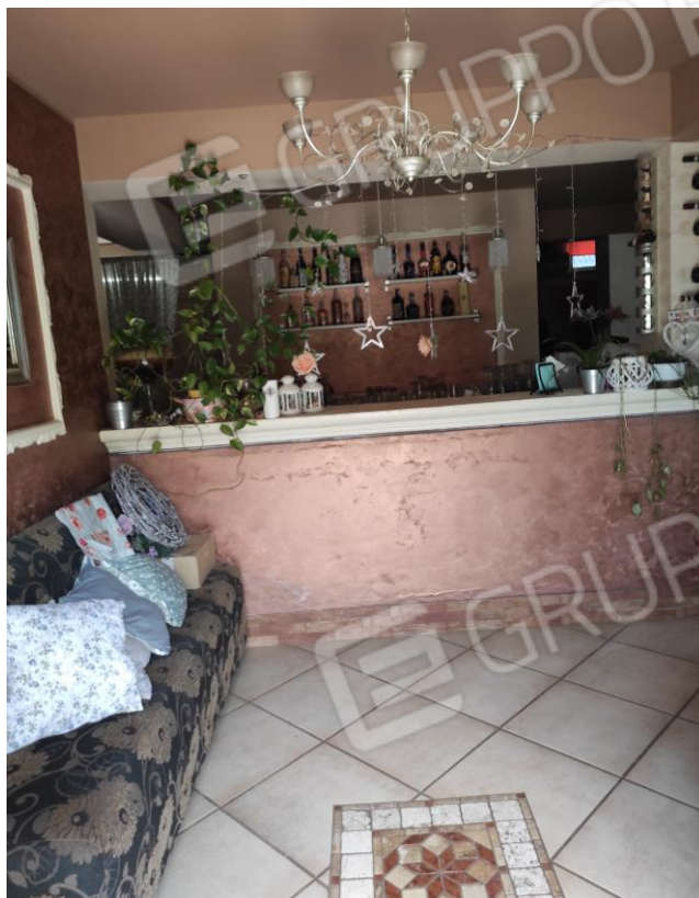
Viste parziali interne della zona bar del locale commerciale.

(Locale Commerciale a piano primo sottostrada ubicato nel Comune di Castrocielo (Fr) alla Via Grotta Scacciamosca, 23, in N.C.E.U., al Fg. 6 P.lla 374 Sub 5)