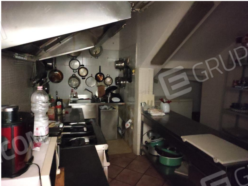
Vista parziale interna della zona preparazione alimenti della cucina.