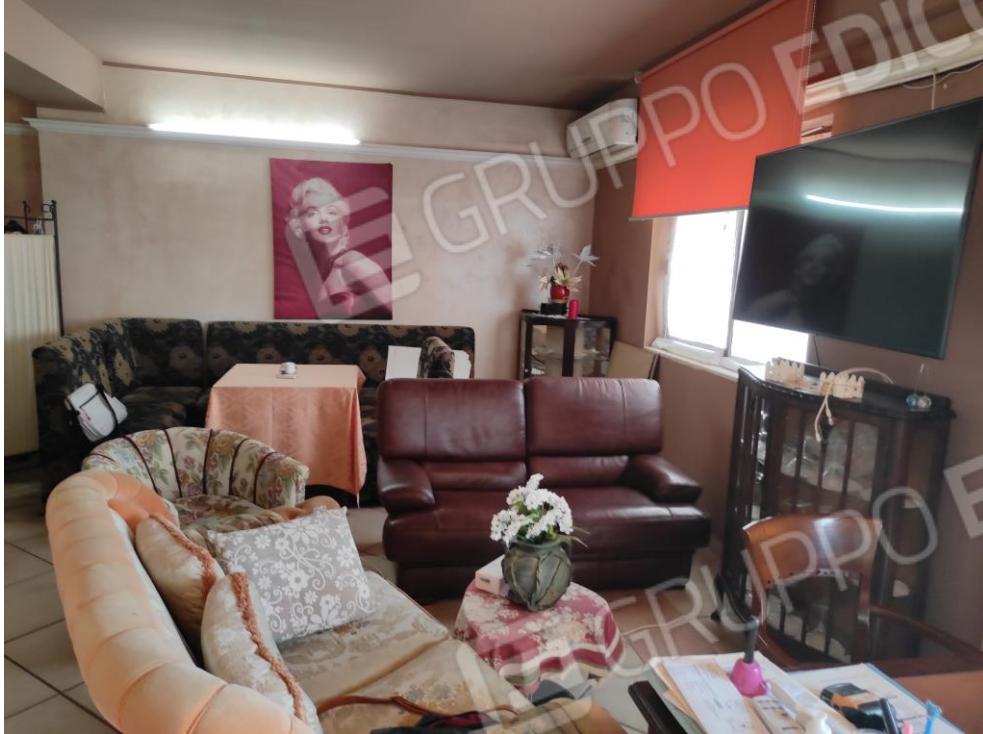
Vista parziale interna di parte della zona relax del locale commerciale.