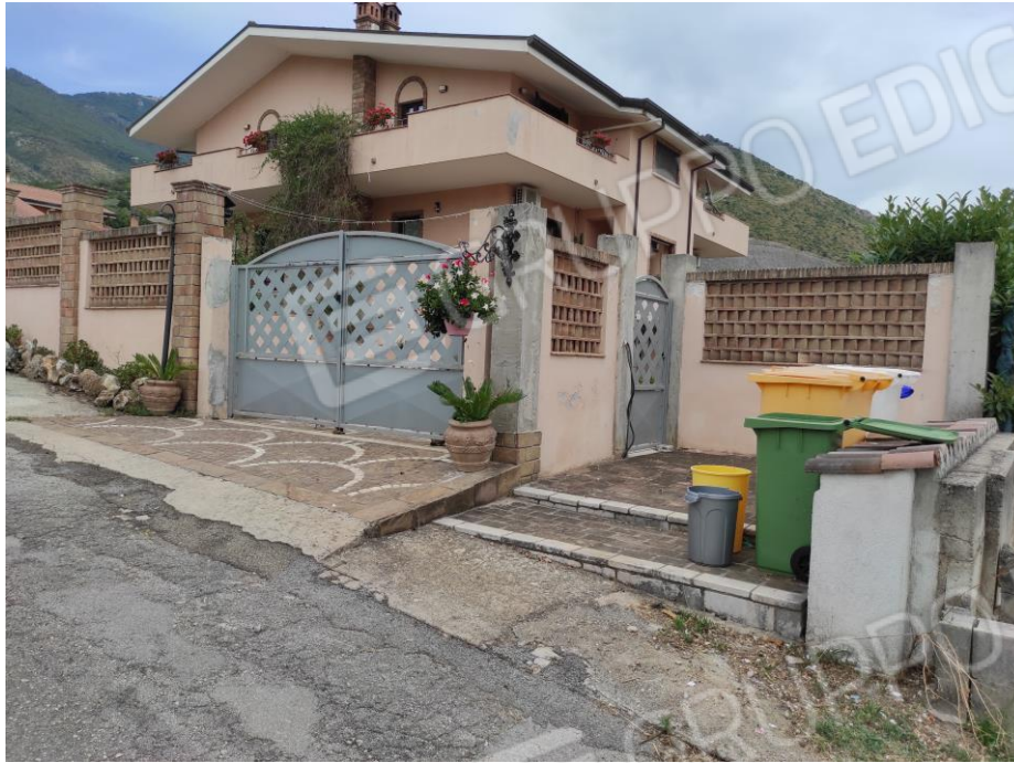
Vista generale del fabbricato da via Grotta Scacciamosca in cui sono ubicati i beni oggetto della presente Esecuzione Immobiliare. (lato sud-ovest)