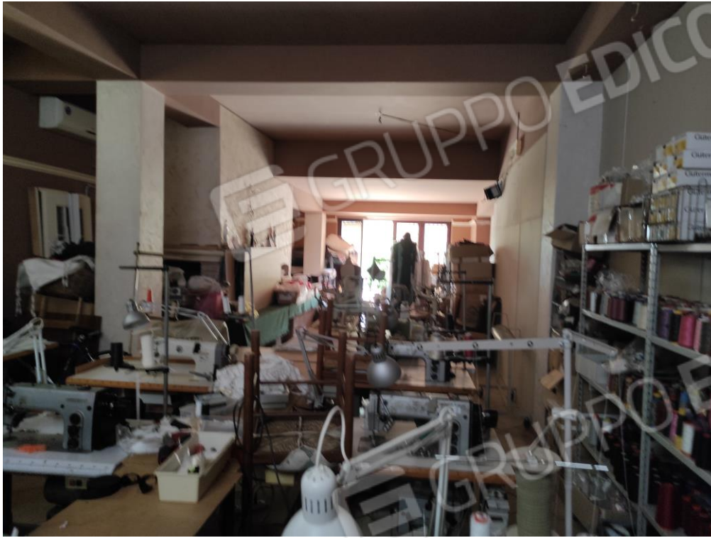
Vista parziale interna di parte del locale commerciale.