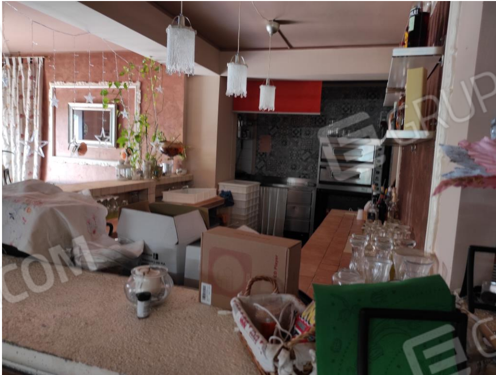
Vista parziale interna della zona bar del locale commerciale.