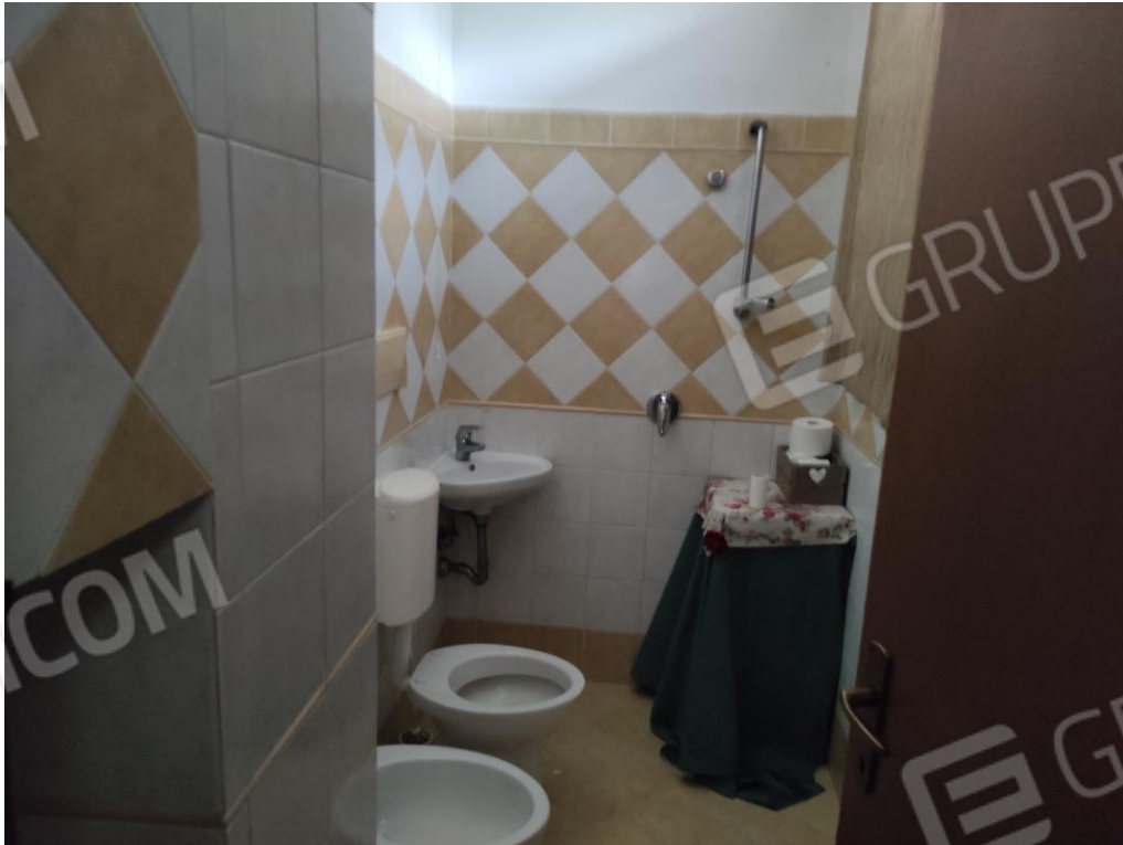
Vista parziale interna del bagno.