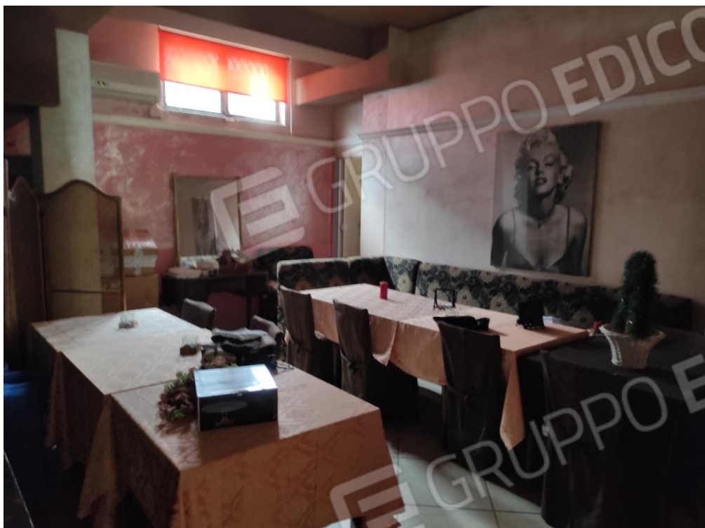
Vista parziale interna di parte della zona degustazione.