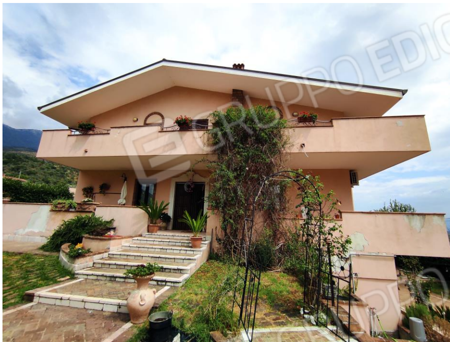
Prospetto frontale lato ingresso del fabbricato in cui sono ubicati i beni oggetto della presente Esecuzione Immobiliare (lato ovest). In cui si evince l'ingresso dei beni n. 1, 3 e 4 contraddistinti con i sub 6,7,8.