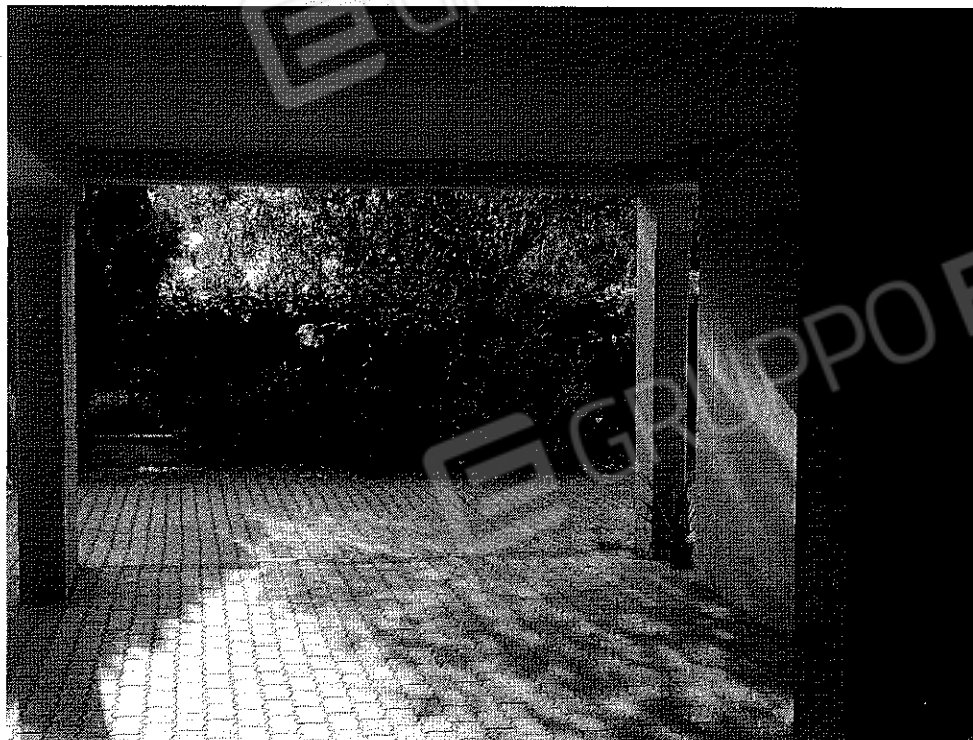
FOTO N° 4 Porzione di Fabbricato adibito ad Abitazione di tipo Civile (A/2) al Piano Terra e Secondo ubicato in Via Cappella Snc - PART. POSTO AUTO COPERTO - PIANO TERRA

FOTO N° 3 Porzione di Fabbricato adibito ad Abitazione di tipo Civile (A/2) al Piano Terra e Secondo ubicato in Via Cappella Snc - PART. POSTO AUTO COPERTO - PIANO TERRA