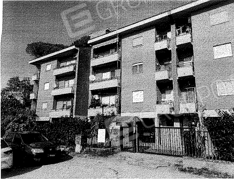
FOTO N° 2 Porzione di Fabbricato adibito ad Abitazione di tipo Civile (A/2) al Piano Terra e Secondo ubicato in Via Cappella Snc - PROSPETTO OVEST

FOTO N° 1 Porzione di Fabbricato adibito ad Abitazione di tipo Civile (A/2) al Piano Terra e Secondo ubicato in Via Cappella Snc - PROSPETTO OVEST