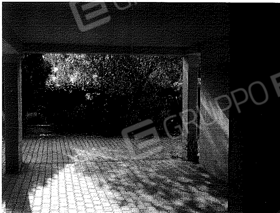
FOTO N° 4 Porzione di Fabbricato adibito ad Abitazione di tipo Civile (A/2) al Piano Terra e Secondo ubicato in Via Cappella Snc - PART. POSTO AUTO COPERTO - PIANO TERRA

FOTO N° 3 Porzione di Fabbricato adibito ad Abitazione di tipo Civile (A/2) al Piano Terra e Secondo ubicato in Via Cappella Snc - PART. POSTO AUTO COPERTO - PIANO TERRA