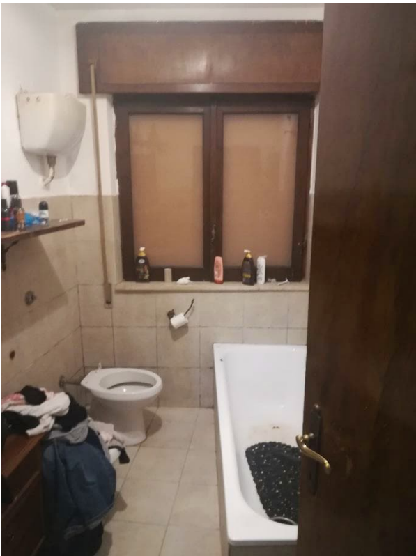
BAGNO A PIANO PRIMO