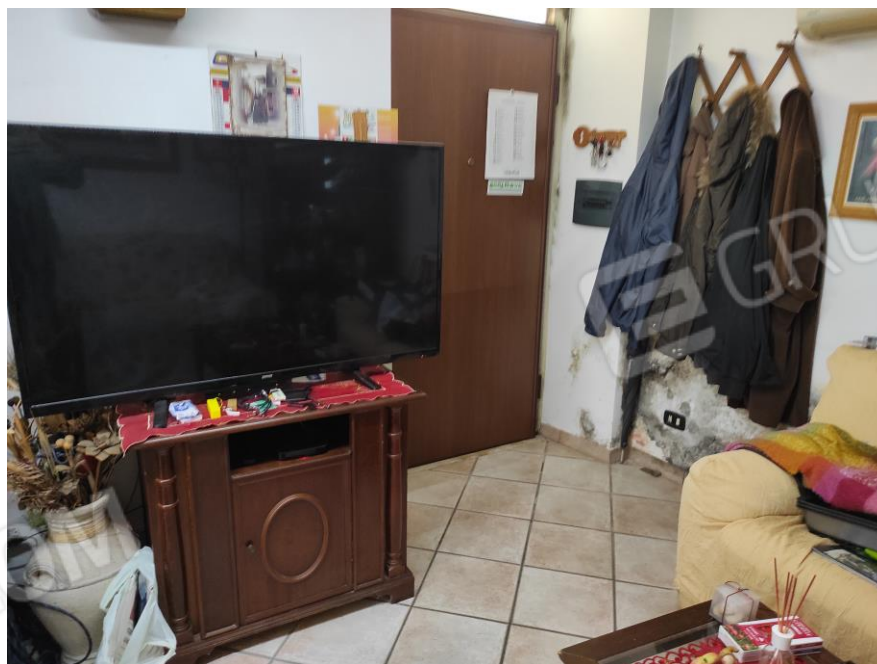
Vista parziale interna dell'ingresso sala da pranzo in cui si evincono le rifiniture e le macchie di umidità.