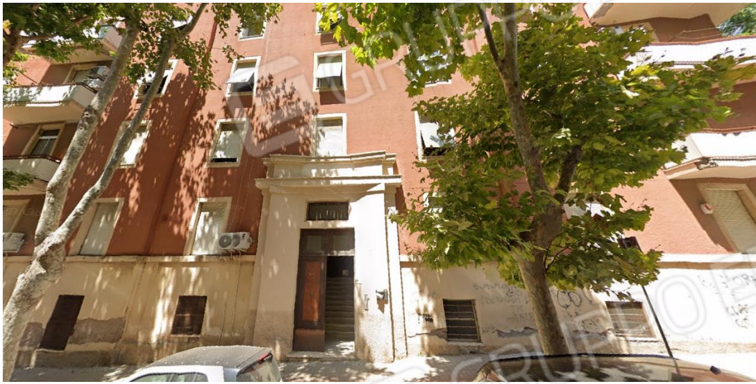
ESTERNO – INGRESSO EDIFICIO