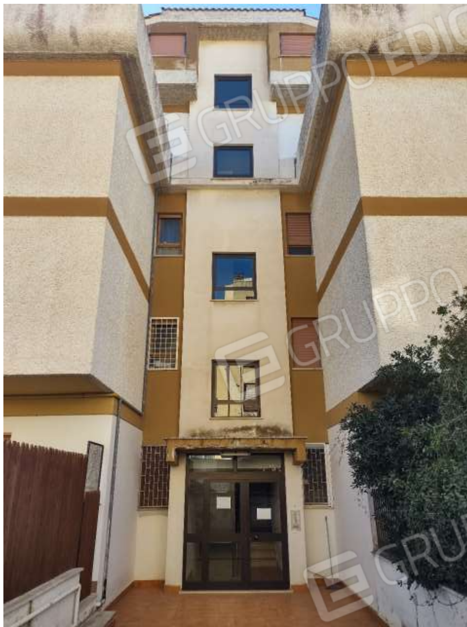
ESTERNO INGRESSO FABBRICATO NORD