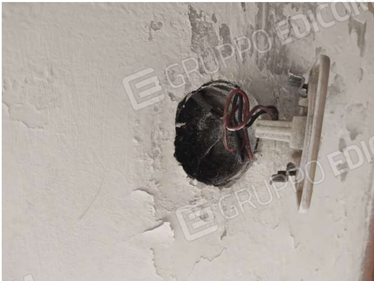
PARTICOLARE IMPIANTI ELETTRICI