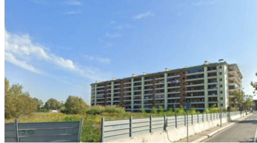
FOTO 2: Esterno edificio – lato Nord/Ovest