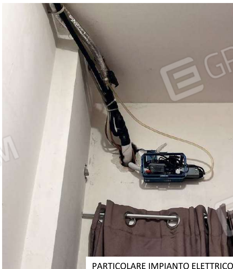
PARTICOLARE IMPIANTO ELETTRICO