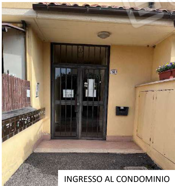
INGRESSO AL CONDOMINIO