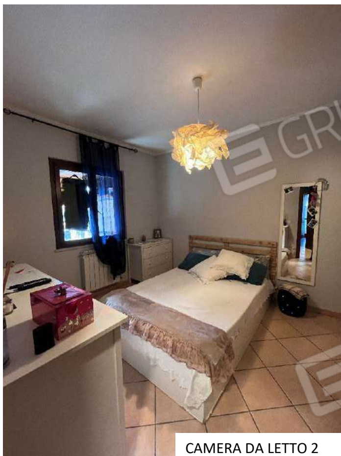
CAMERA DA LETTO 2