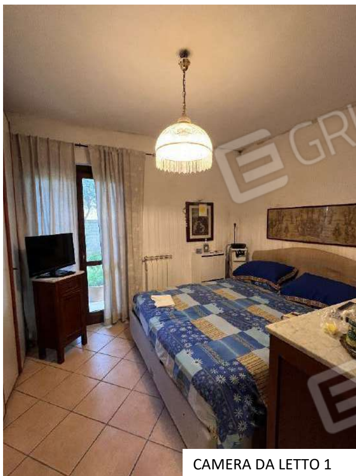
CAMERA DA LETTO 1