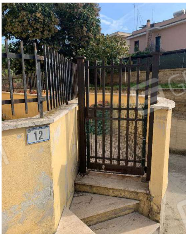
CANCELLO PEDONALE DI ACCESSO DIRETTO ALLA CORTE