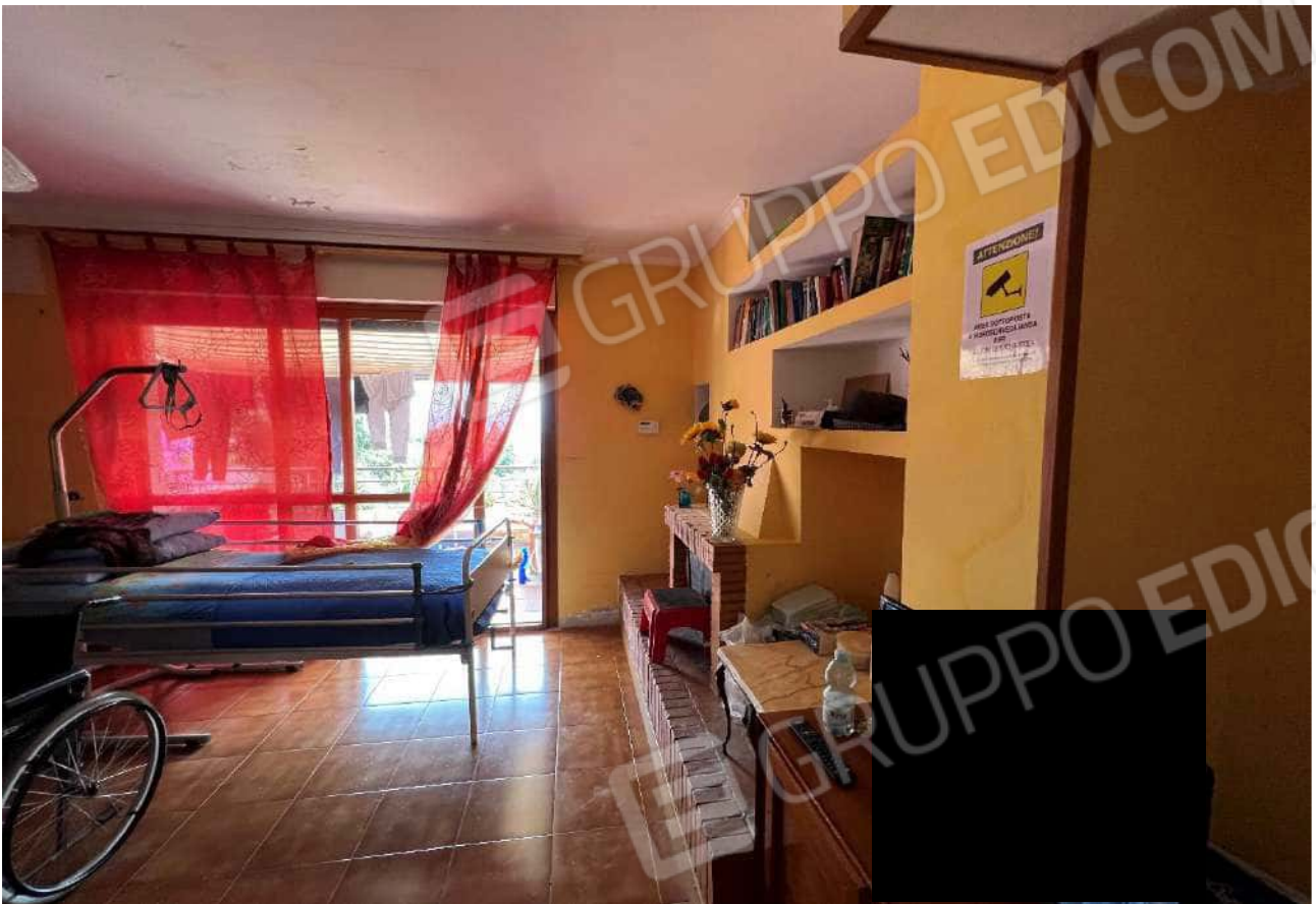
FOTO 7: Veduta interna vano soggiorno abitazione piano secondo, sub. 19