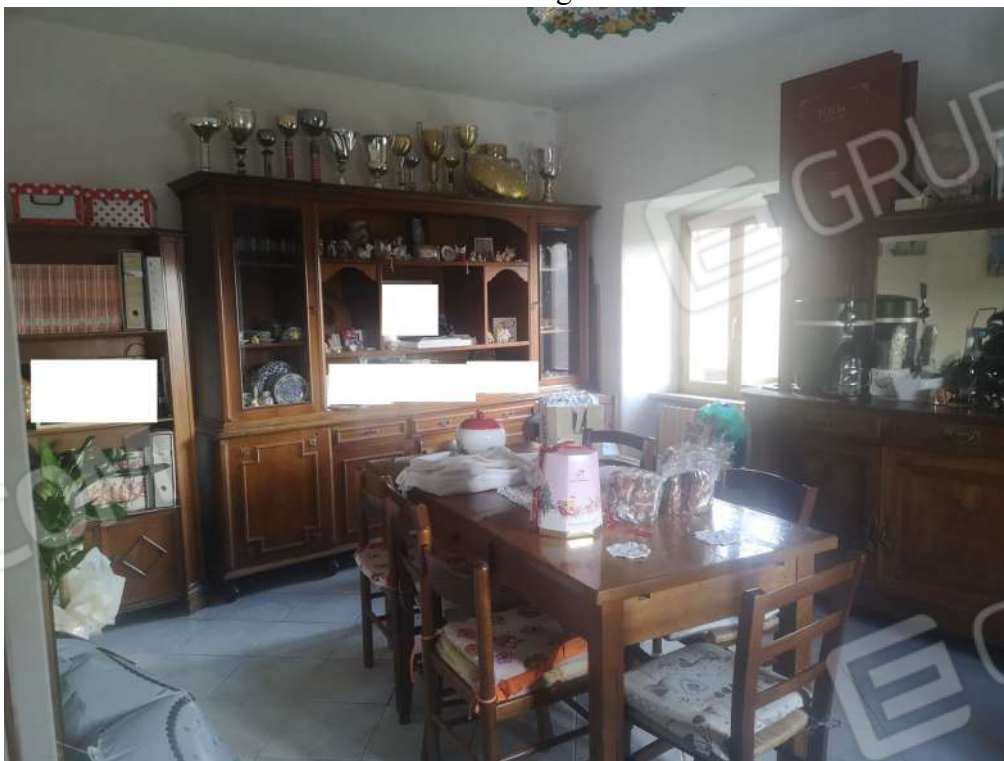
Foto n. 7 - Soggiorno