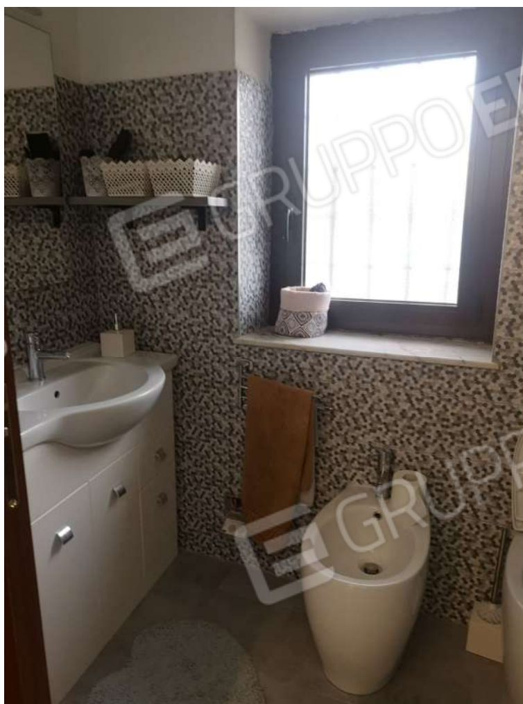
Foto n. 8 - Wc al piano terra