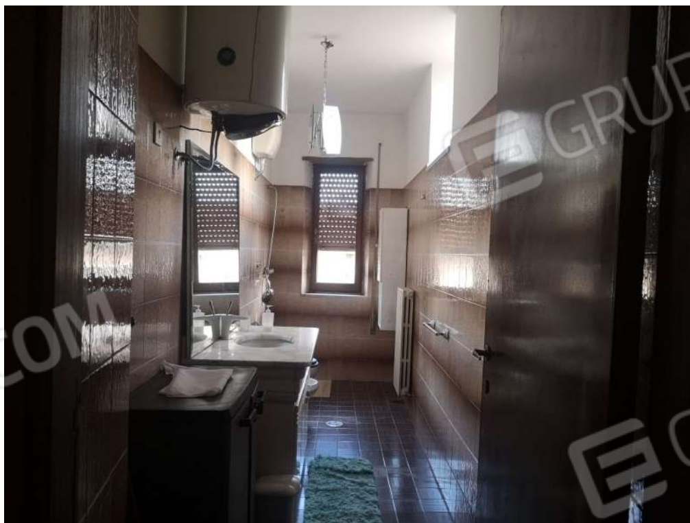
Foto n. 11 -Wc al piano primo