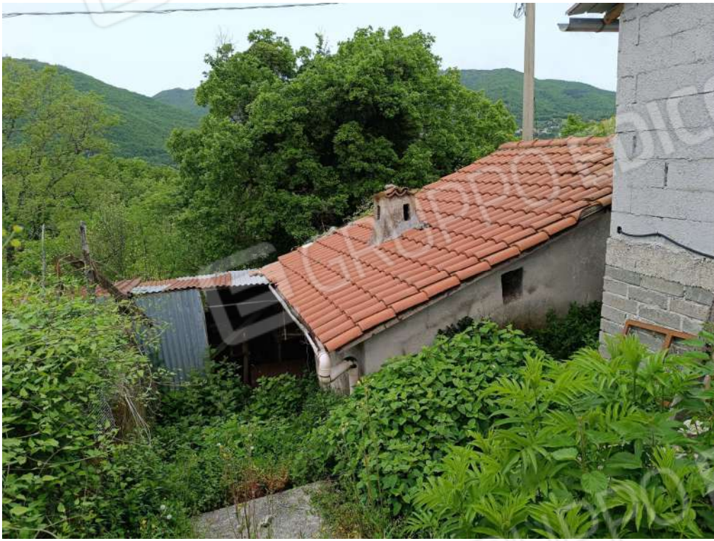
Foto n. 18 - Foglio 133 p.lla 536 - Magazzino