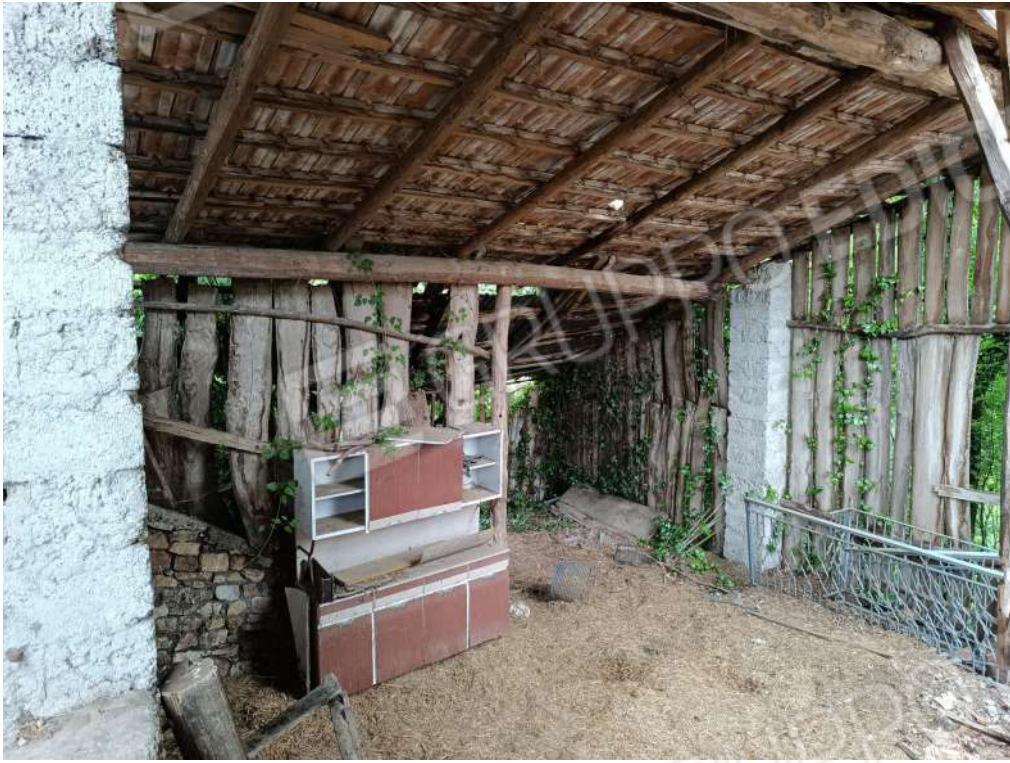
Foto n. 7 - Foglio 133 p.lla 566 - Rimessa