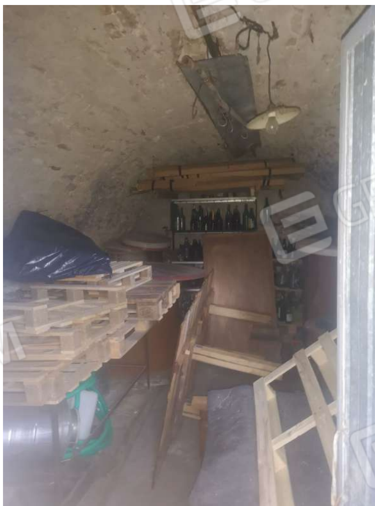
Foto n. 13 - Cantina al piano seminterrato