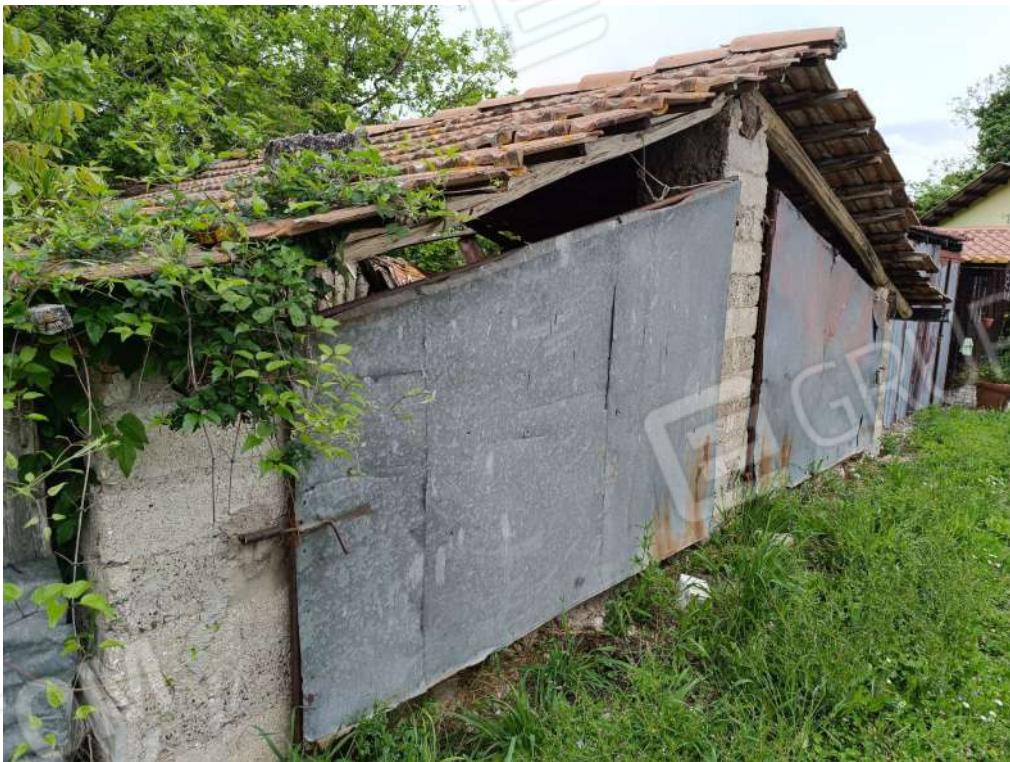
Foto n. 19 - Foglio 133 p.lla 566 - Rimessa