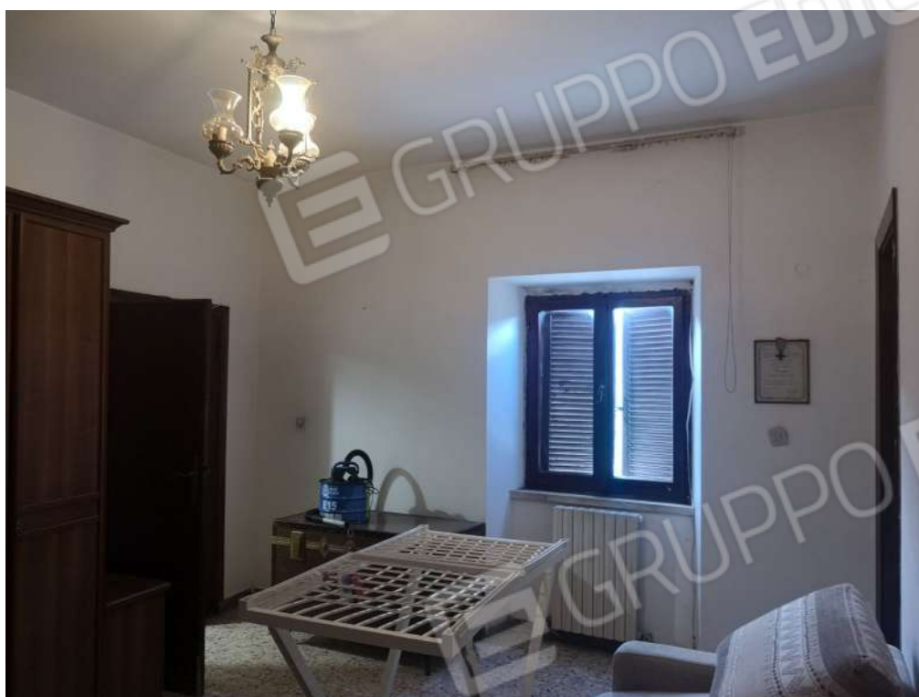
Foto n. 10 - Disimpegno al piano primo