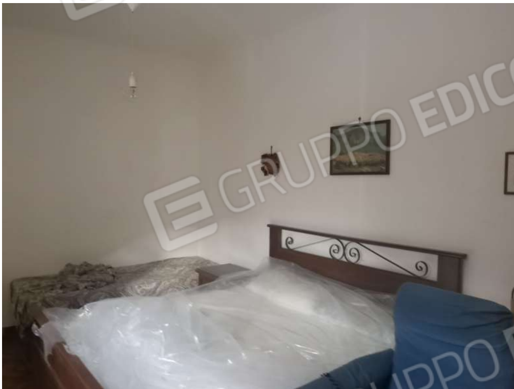
Foto n. 12 - Camera da letto al piano primo