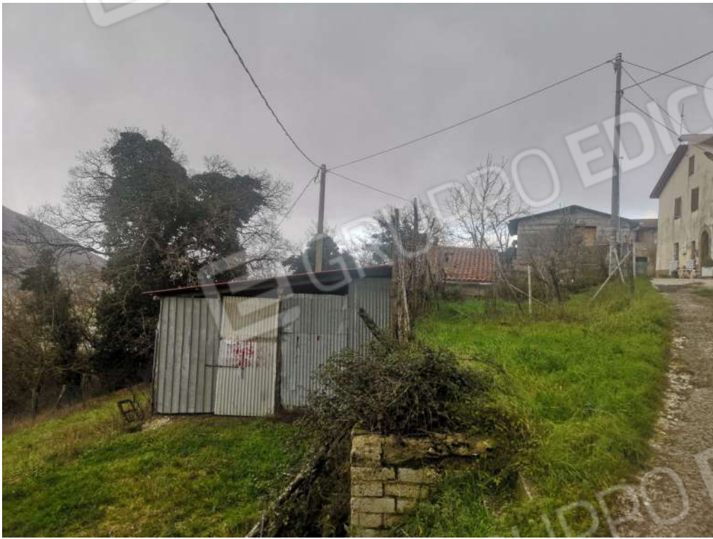
Foto n. 14 - Foglio 133 p.lla 599 - Tettoia chiusa