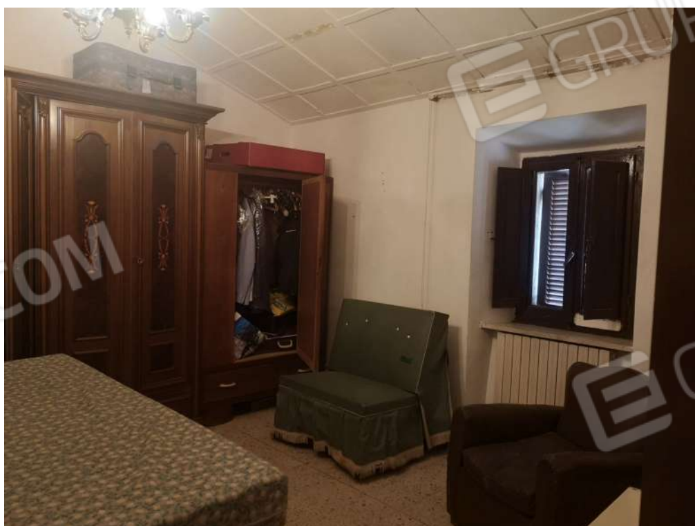
Foto n. 9 - Camera da letto al piano primo