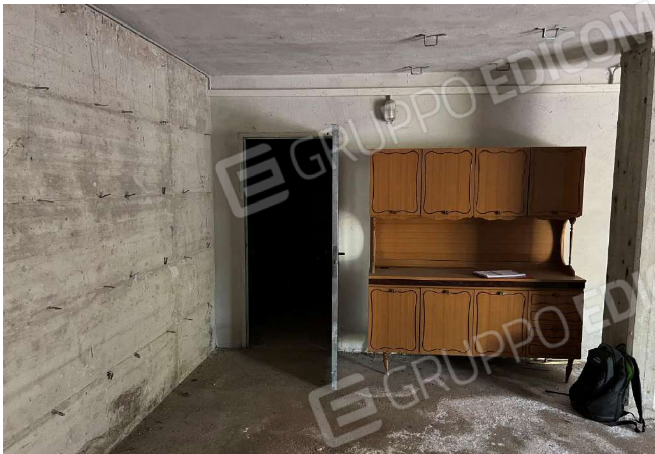
FOTO 21: Veduta interna garage censito al sub. 14 Lotto 1 corpo B piano terra