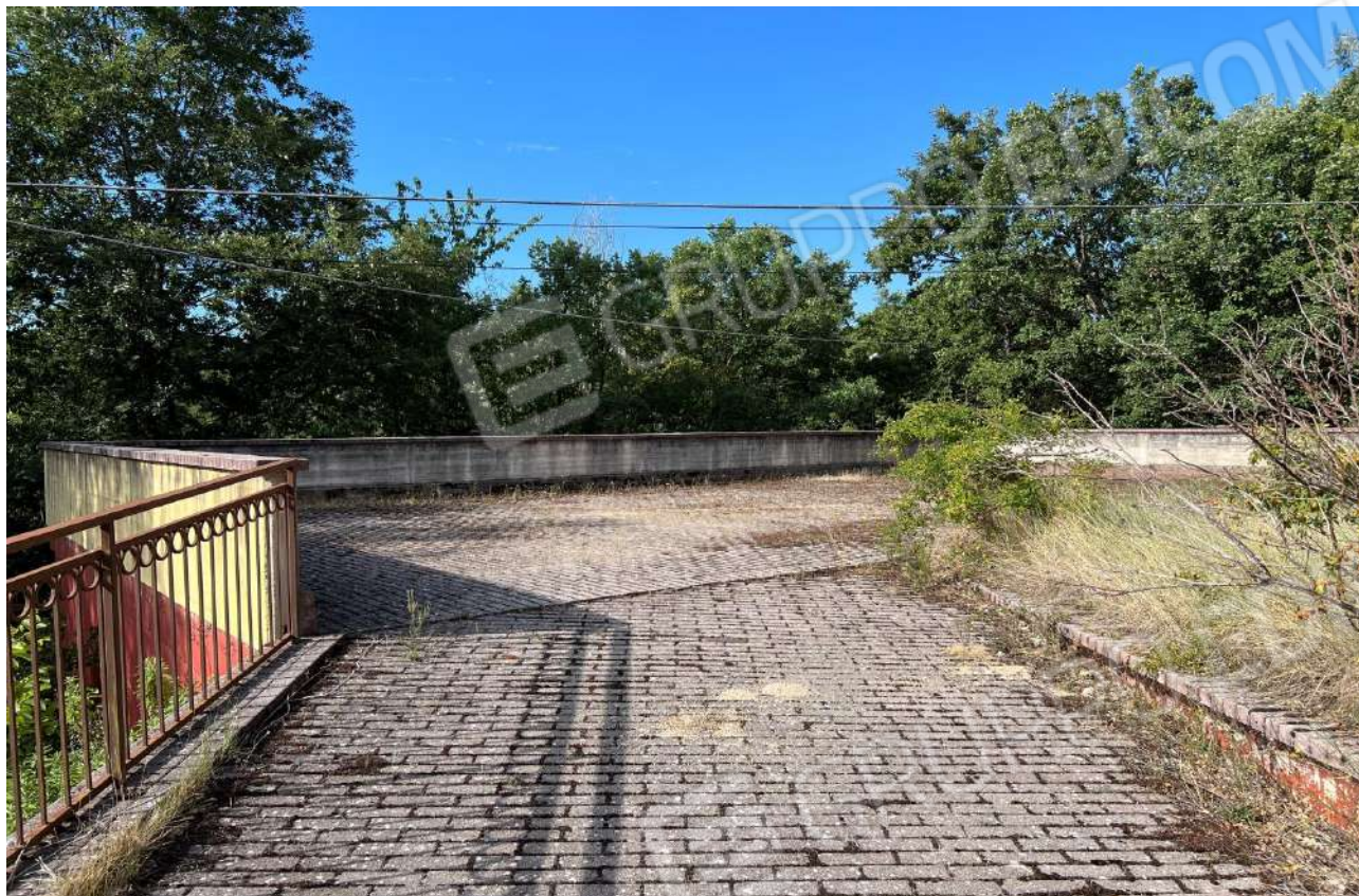
FOTO 5: Veduta esterna corte comune soprastante i garage interrati