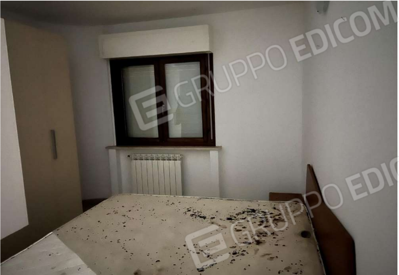
FOTO 17: Veduta interna vano camera da letto Lotto 2, Corpo A-piano terra