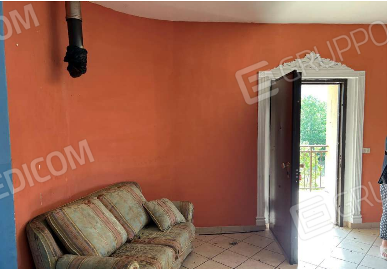
FOTO 8: Veduta interna vano soggiorno angolo cottura Lotto 1, Corpo A-piano primo