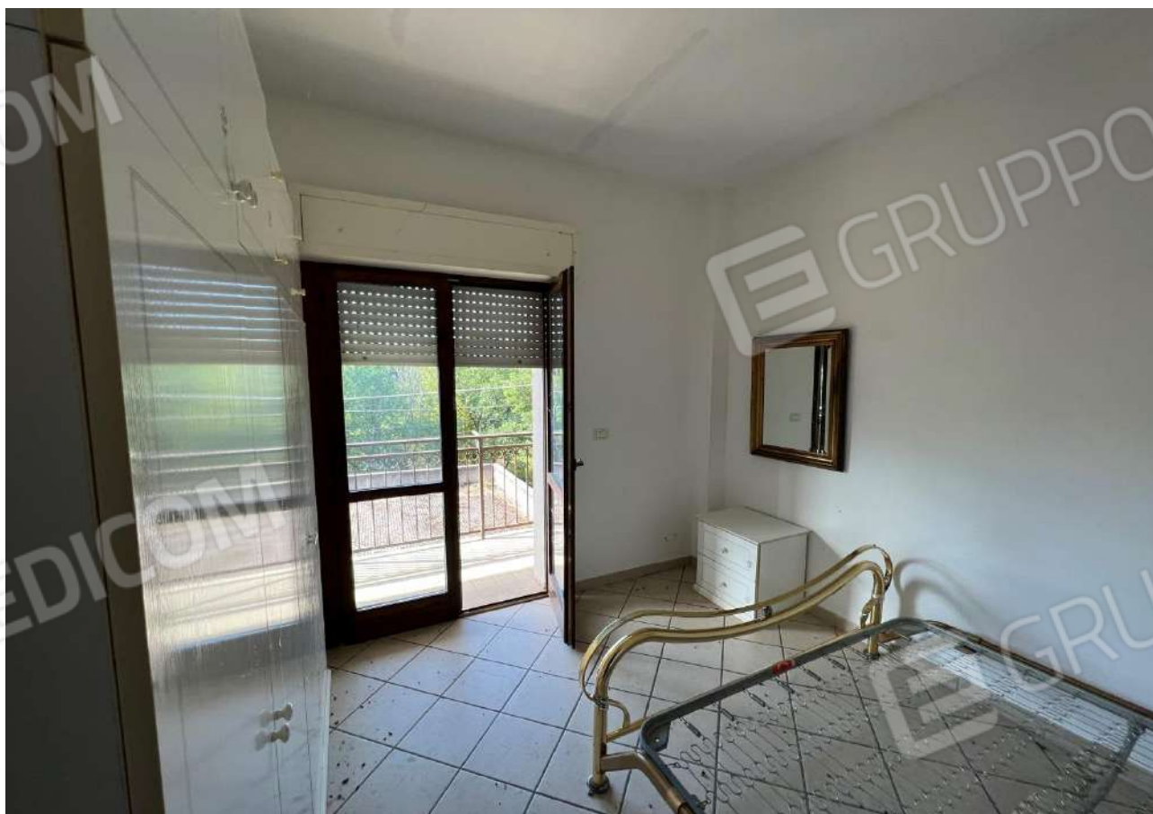
FOTO 10: Veduta interna vano camera da letto Lotto 1, Corpo A-piano primo