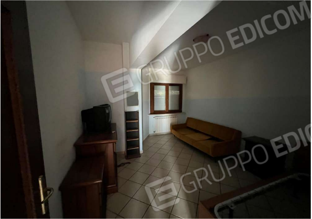
FOTO 11: Veduta interna vano camera da letto Lotto 3, Corpo A-piano secondo