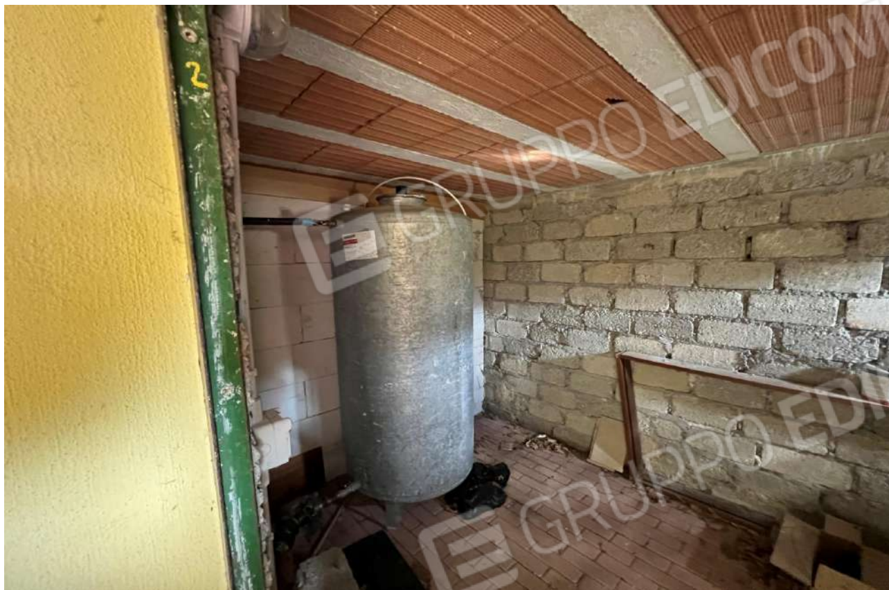
FOTO 13: Veduta interna vano cantina di pertinenza Lotto 3, Corpo A-piano terra