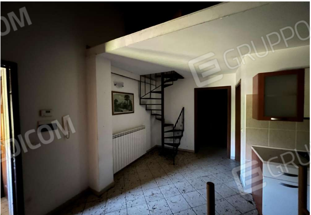
FOTO 16: Veduta interna vano soggiorno/angolo cottura Lotto 2, Corpo A-piano terra