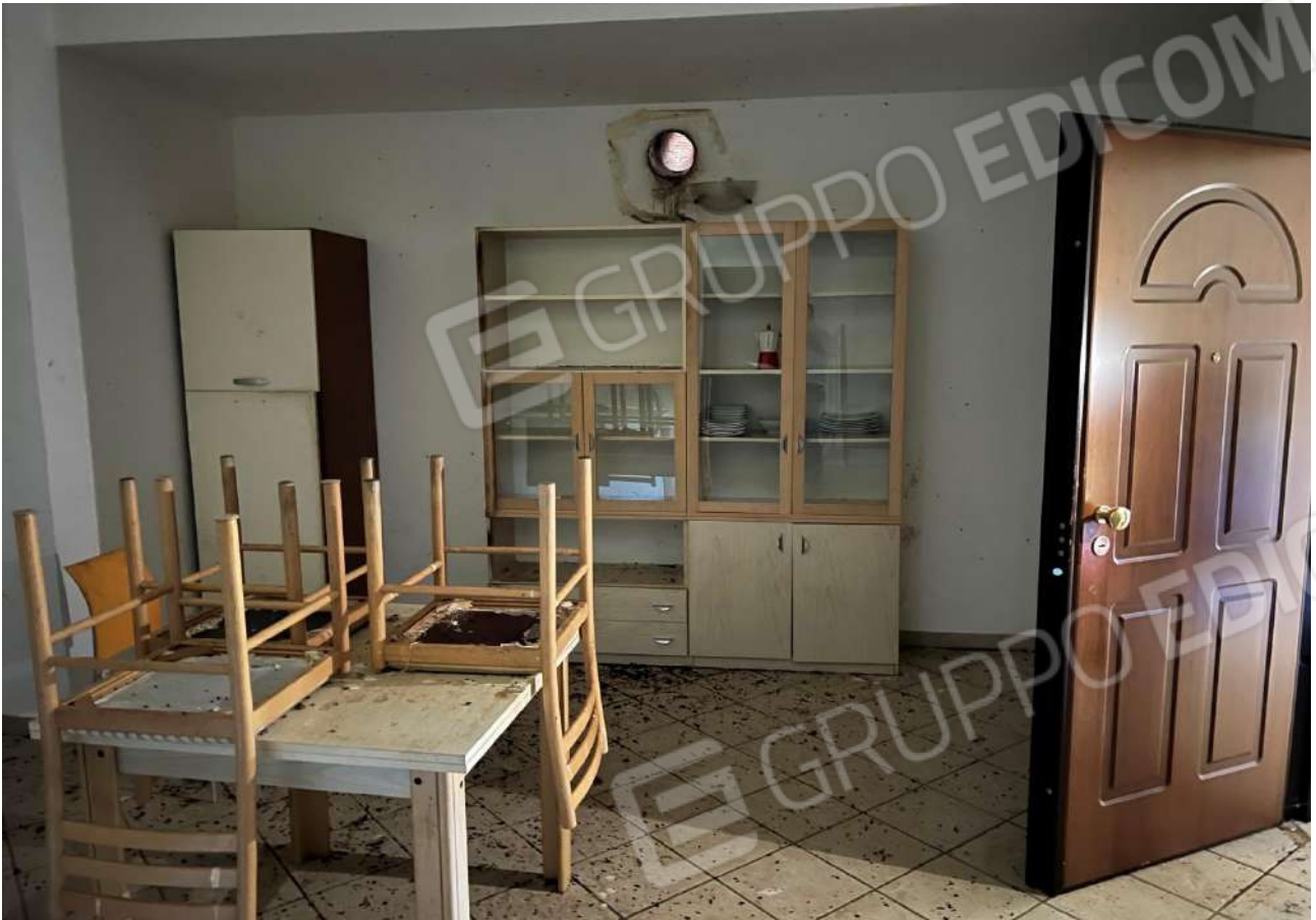
FOTO 15: Veduta interna vano soggiorno/angolo cottura Lotto 2, Corpo A-piano terra