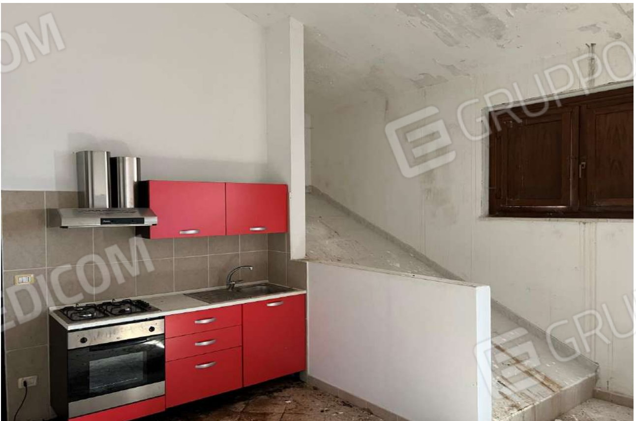
FOTO 12: Veduta interna vano soggiorno/angolo cottura Lotto 3, Corpo A-piano secondo