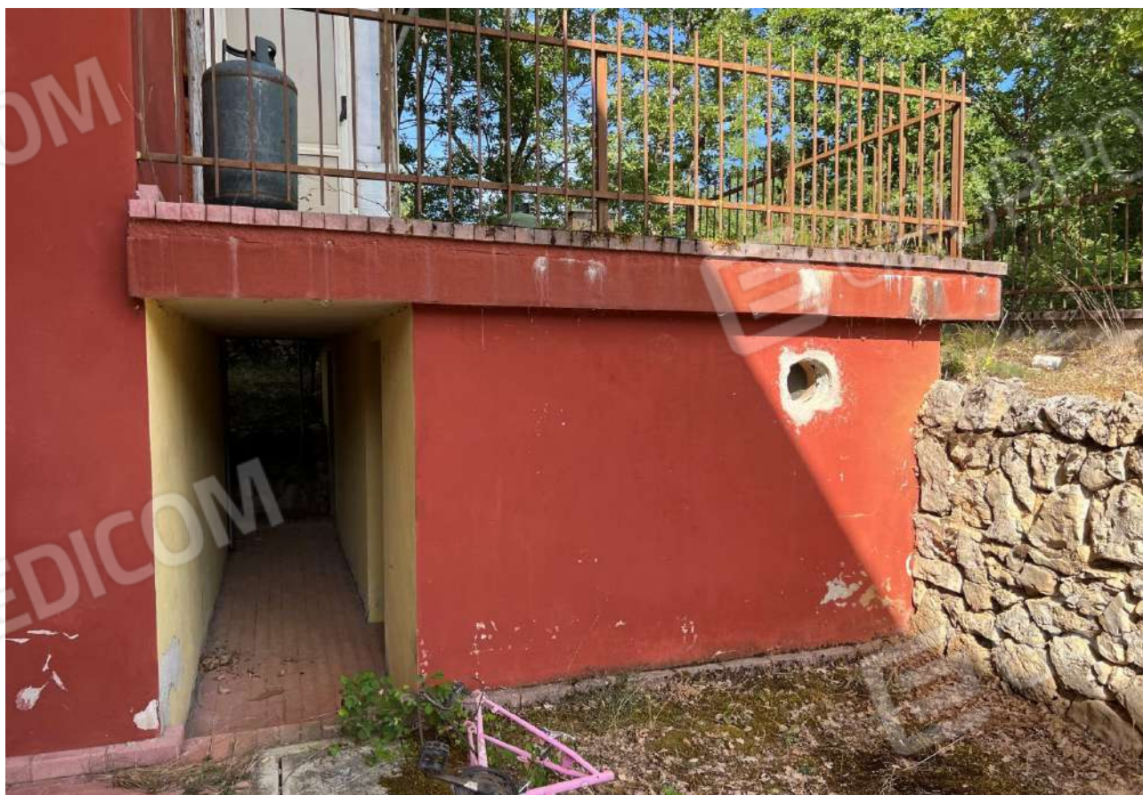
FOTO 14: Veduta esterna vano cantina di pertinenza Lotto 3, Corpo A-piano terra