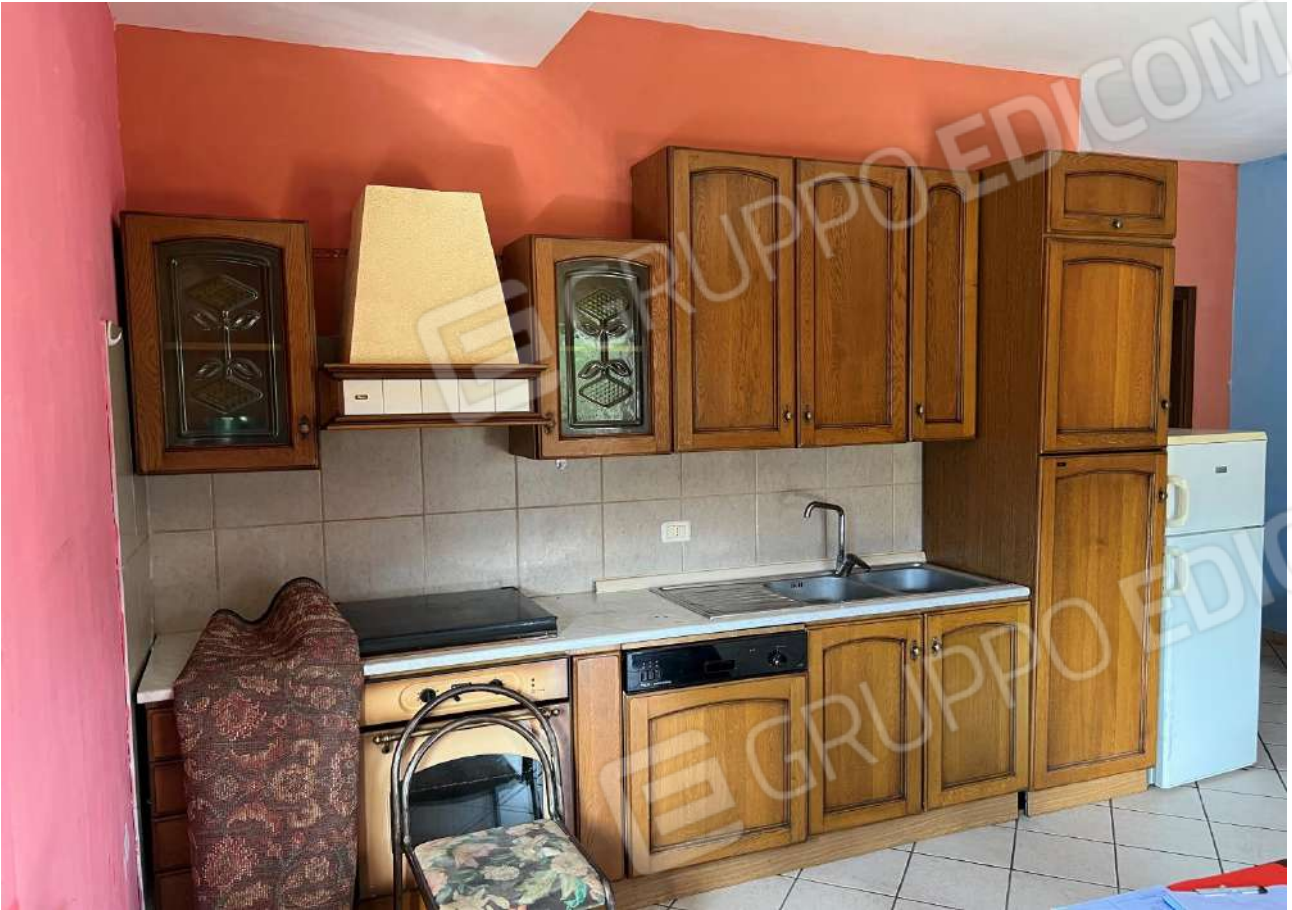
FOTO 7: Veduta interna vano soggiorno angolo cottura Lotto 1, Corpo A-piano primo