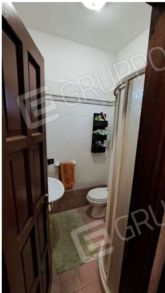
Vedute interne – bagno nella camera matrimoniale