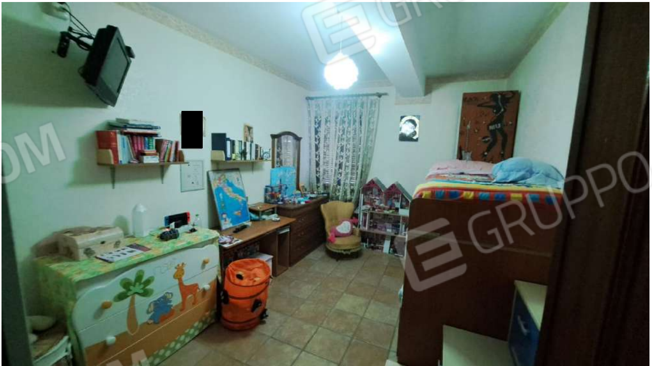
Vedute interne – camere