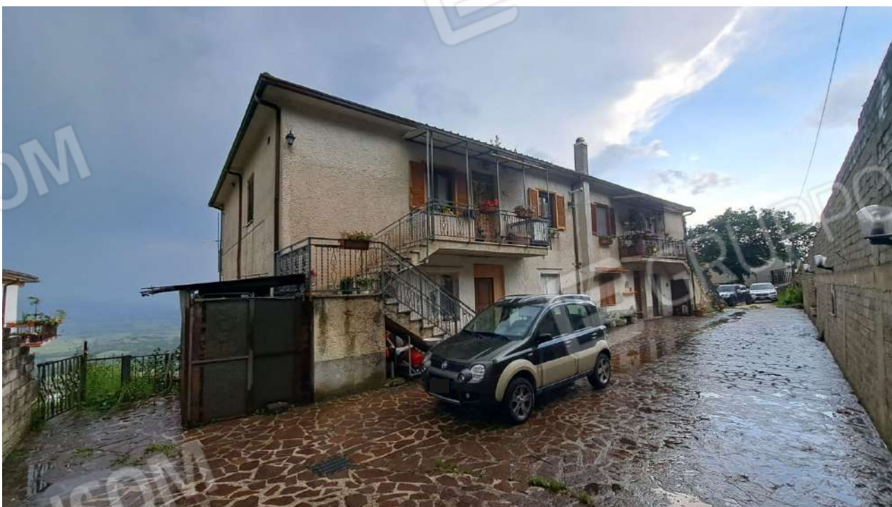
Vedute esterne del fabbricato