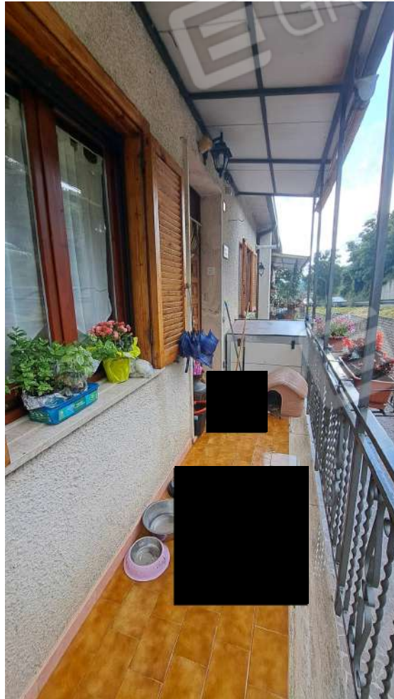
Vedute esterne del fabbricato – aree di accesso