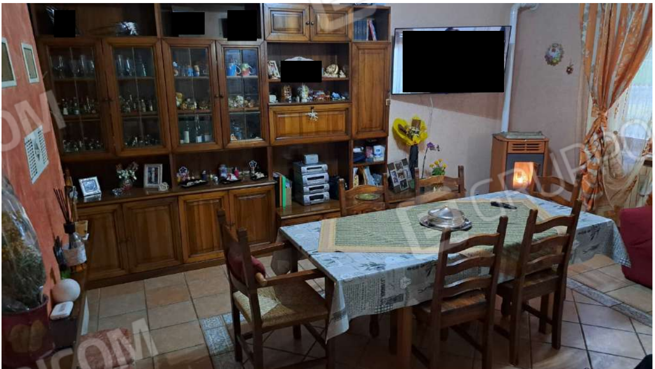
Vedute interne - soggiorno