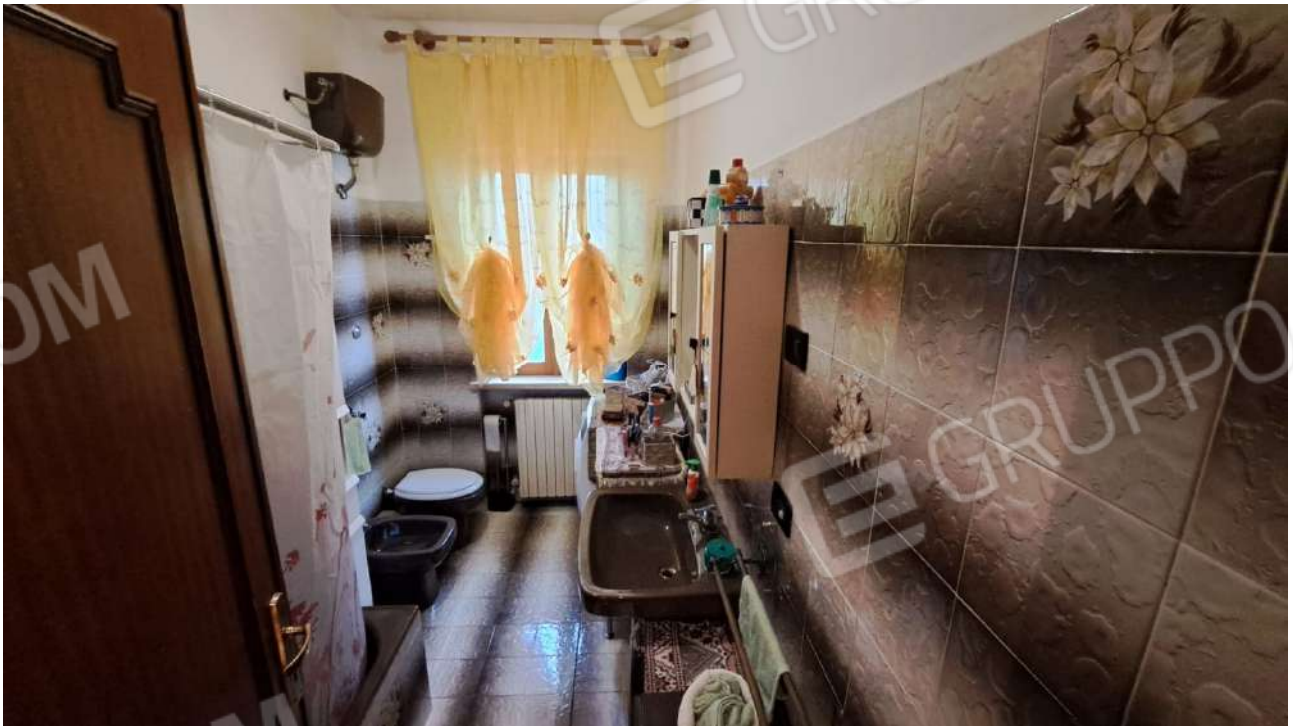
Vedute interne – camera doppia e bagno