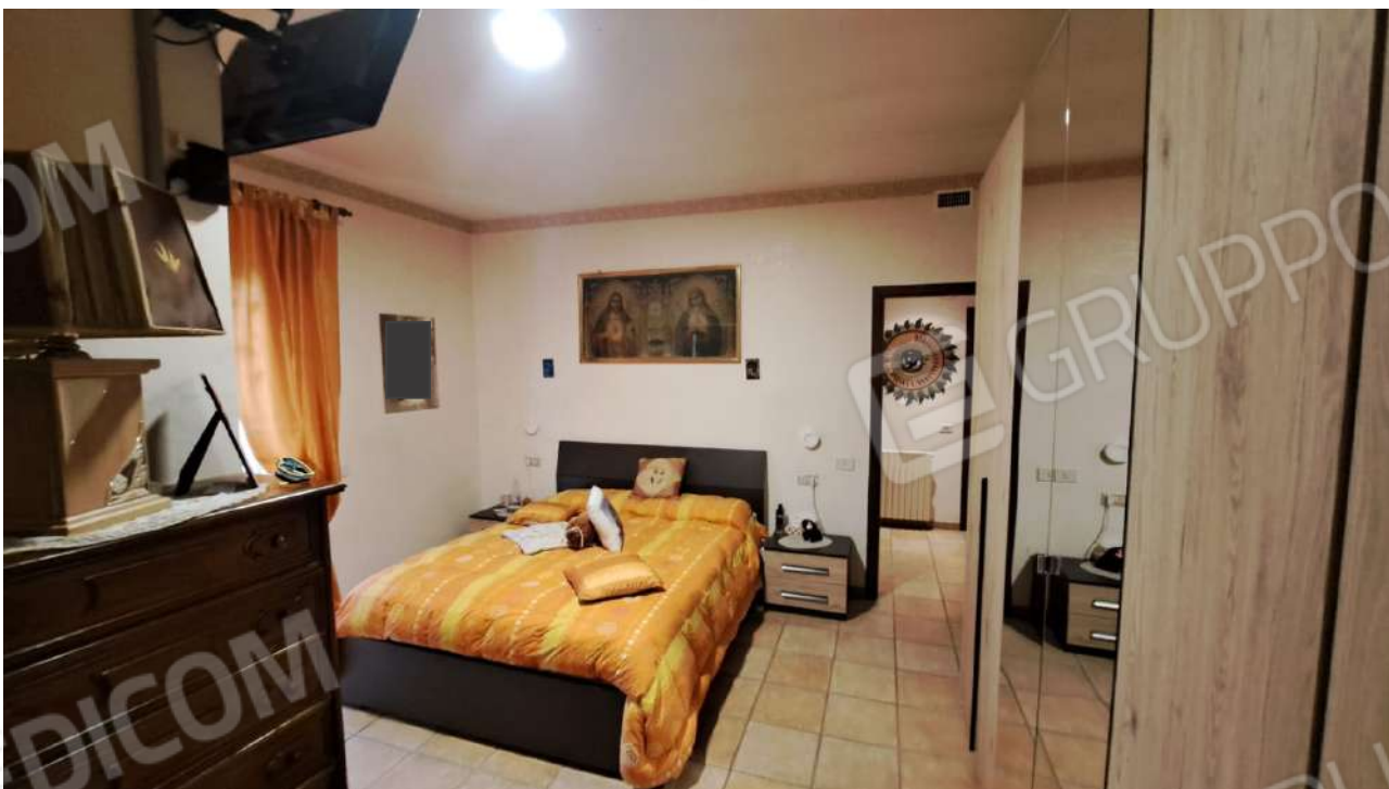
Vedute interne – camera matrimoniale