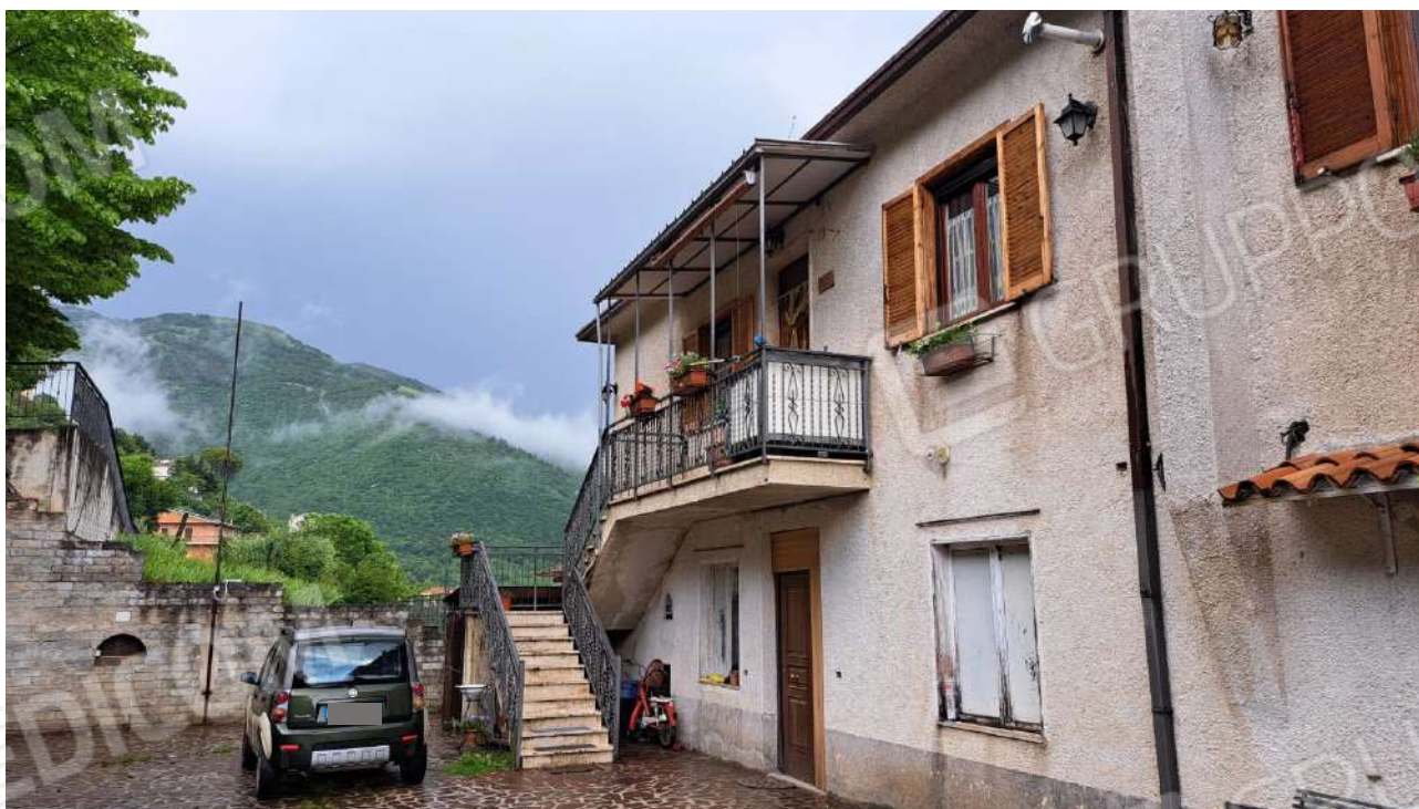
Vedute esterne del fabbricato e delle aree di accesso