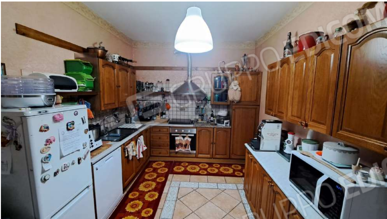
Vedute interne – angolo cottura