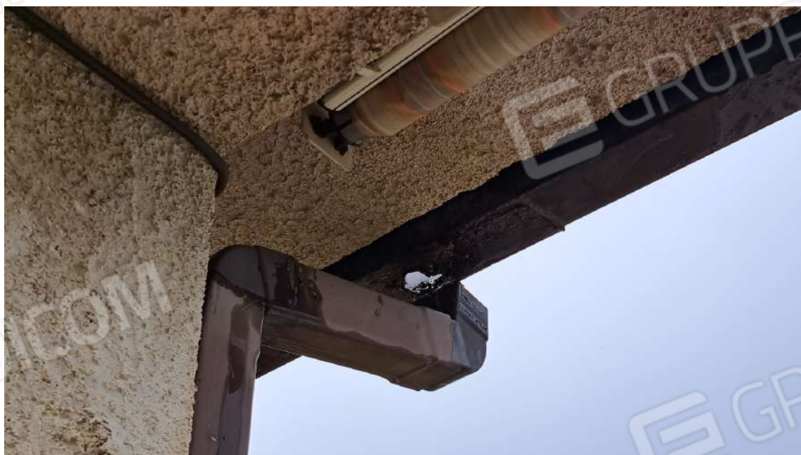
Vedute esterne delle porzioni che necessitano opere di manutenzione straordinaria