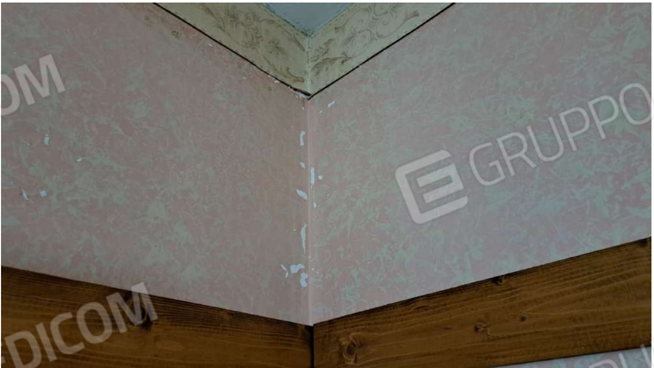
Vedute esterne delle porzioni che necessitano opere di manutenzione straordinaria