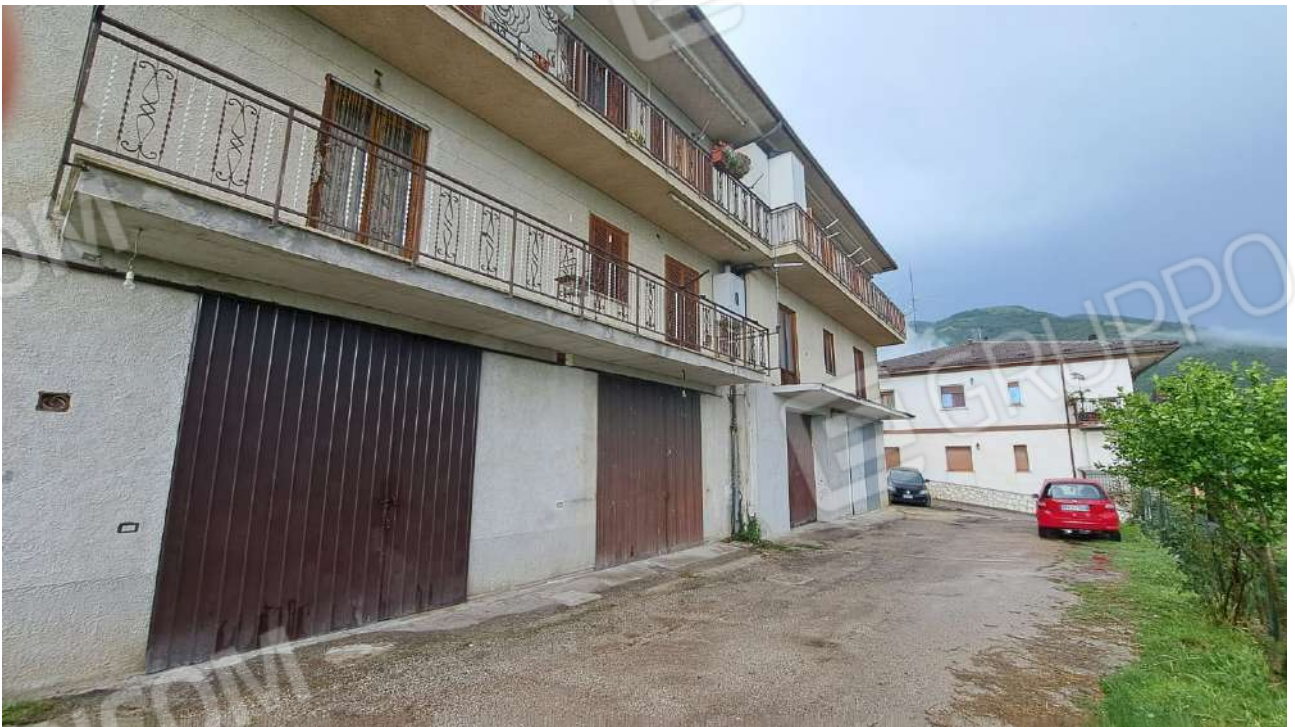
Vedute esterne del fabbricato