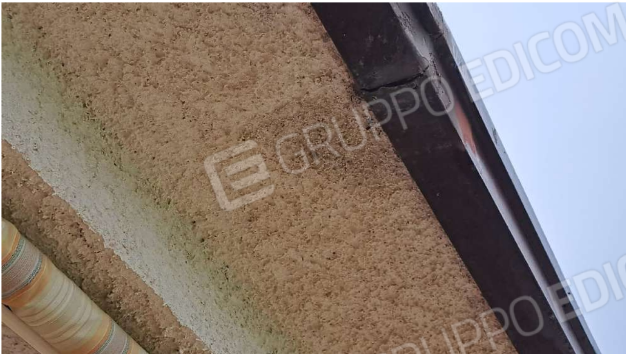
Vedute esterne delle porzioni che necessitano opere di manutenzione straordinaria