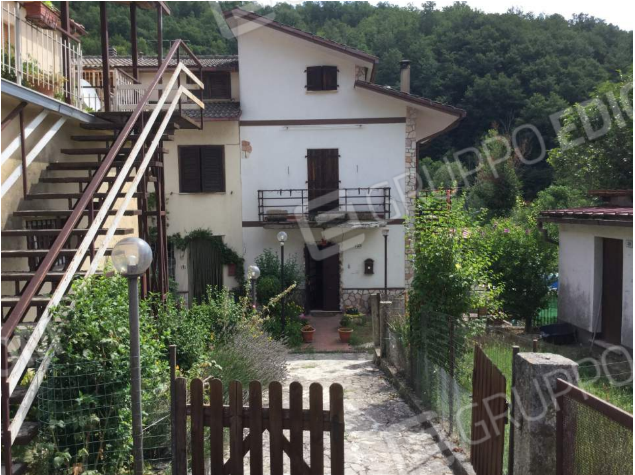
Foto n. 1- In Comune di Rieti, loc. Cerchiara, via Canera, edificio di civile abitazione da cielo a terra, individuato al NCEU al fg. 136 part. 388 catg. A/3 classe 4 consistenza vani 5 superficie catastale mq 116 mq escluse aree scoperte mq 112 mq, Rendita € 206,58, con diritti alla corte comune circostante part. 389.