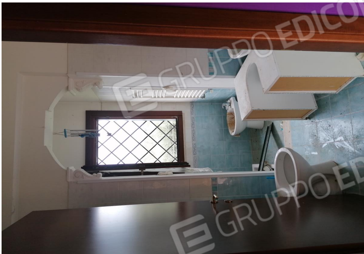
Foto 7 Bagno