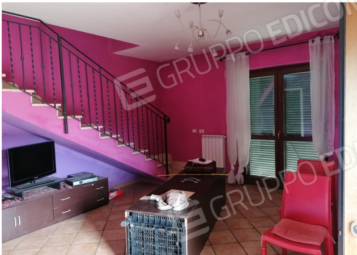
FOTO 5 Salone con scala accesso zona notte