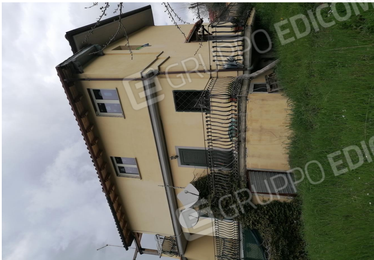
FOTO 3 Prospetto posteriore e corte