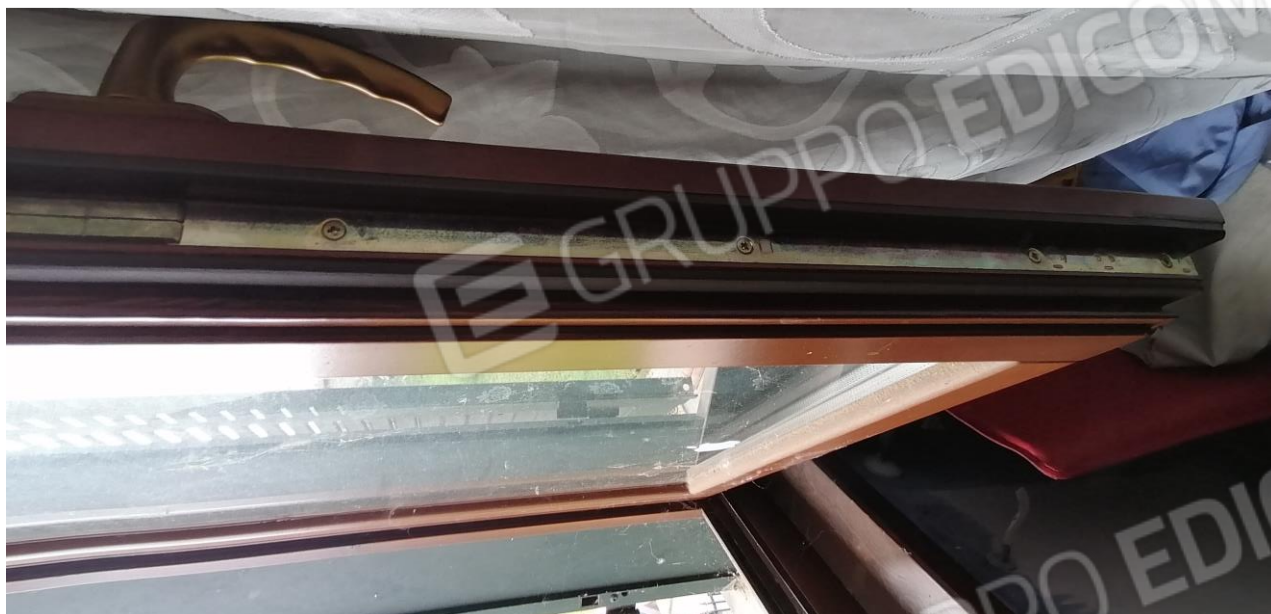
FOTO 11 Particolare infisso