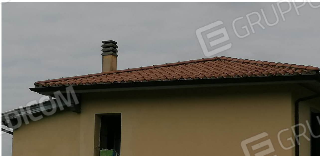
FOTO 16 Particolare copertura