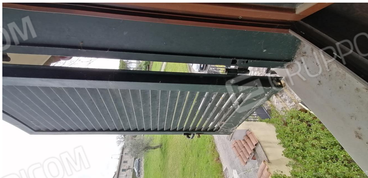
FOTO 12 Particolare infisso con persiana