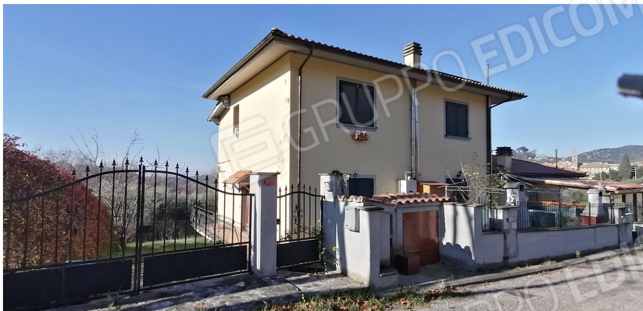
FOTO 1 VISTA DA STRADA COMUNALE