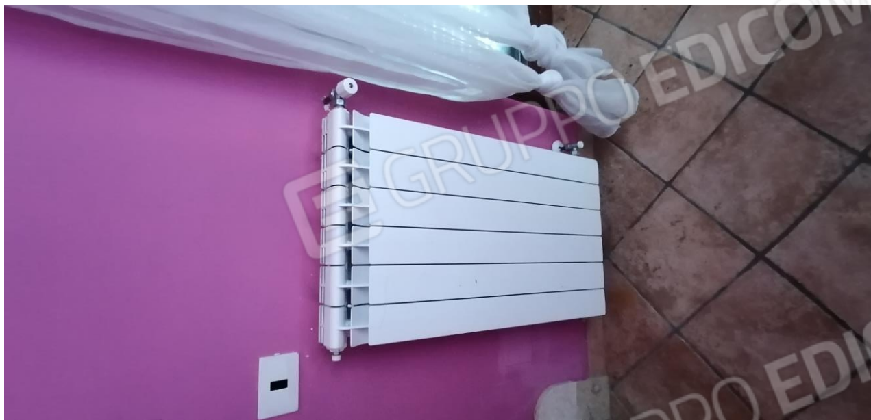
FOTO 13 Particolare elemento radiante