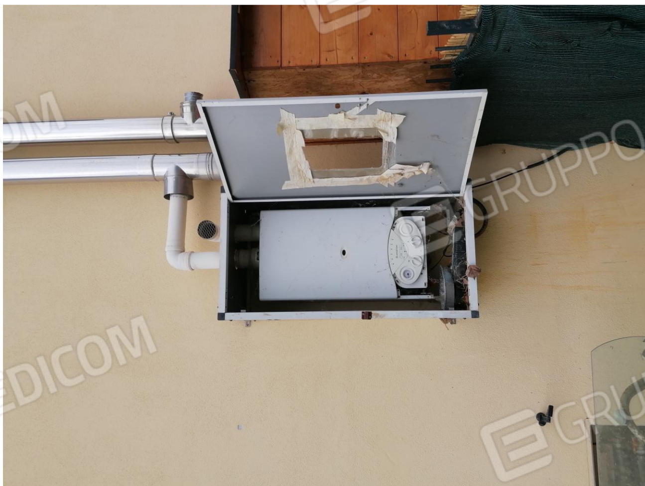
FOTO 14 Caldaia murale esterna