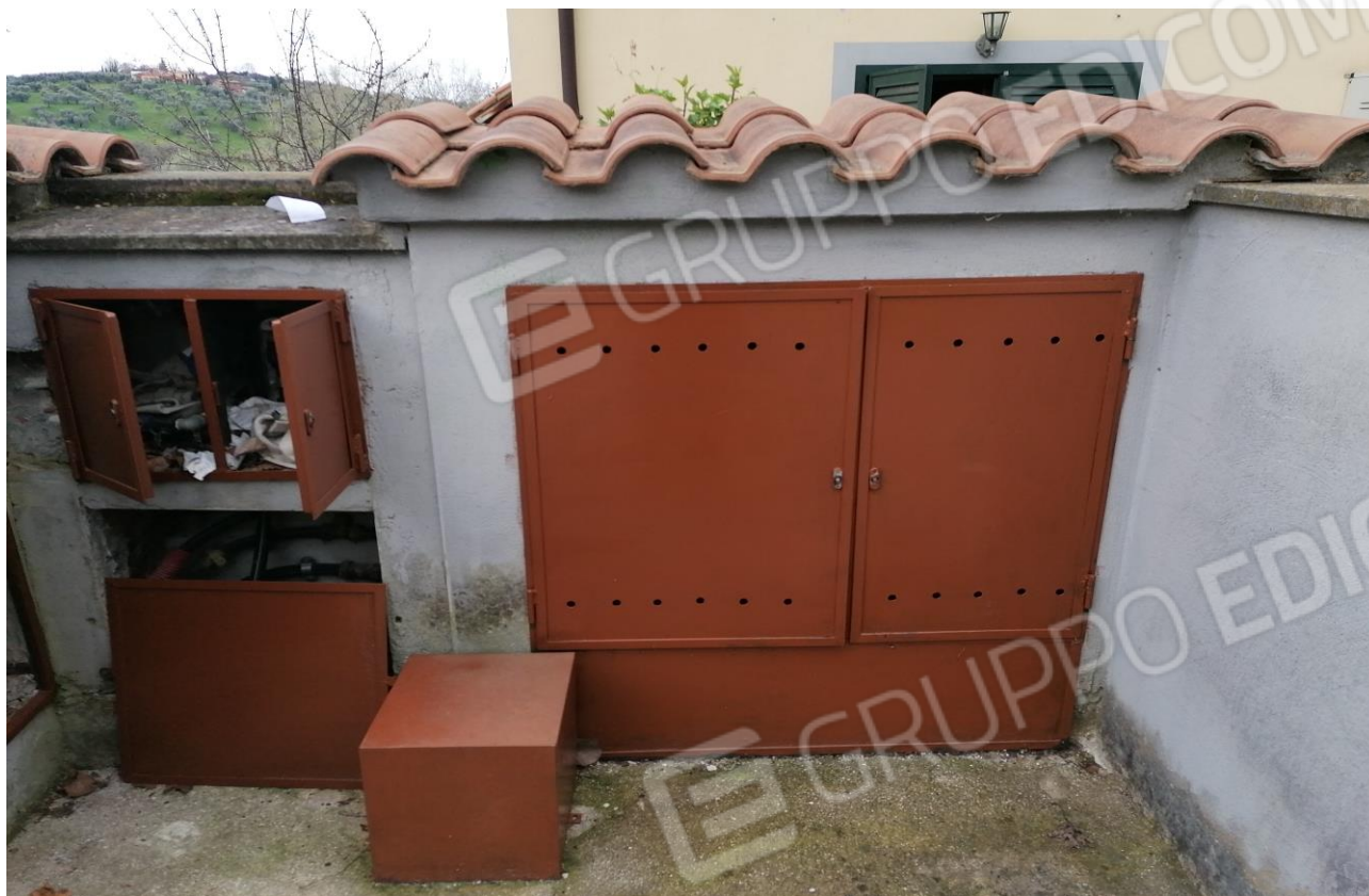
FOTO 15 Allaccio utenze