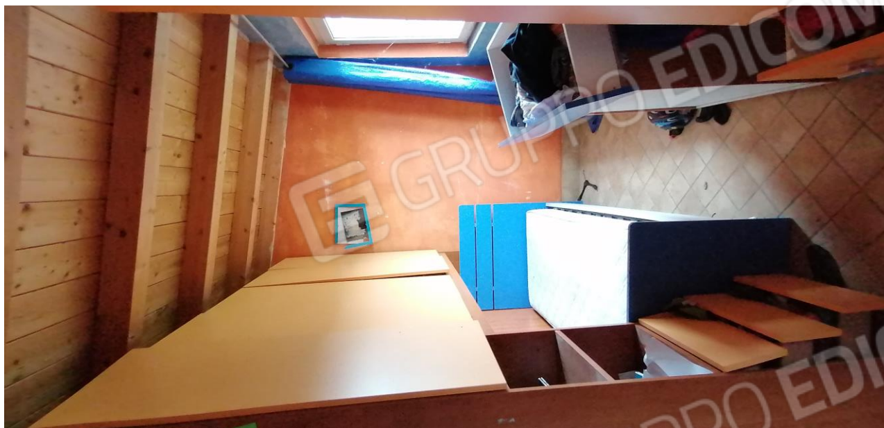
FOTO 9 Vano ricavato dalla tamponatura del balcone