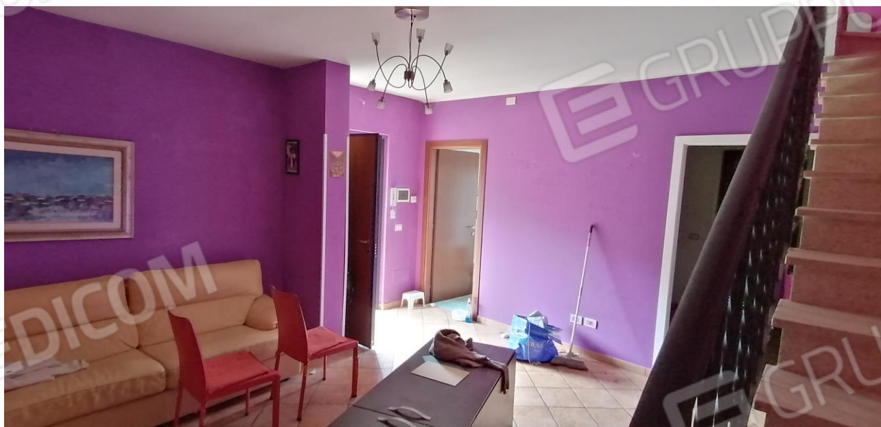
FOTO 4 Salone ed ingresso