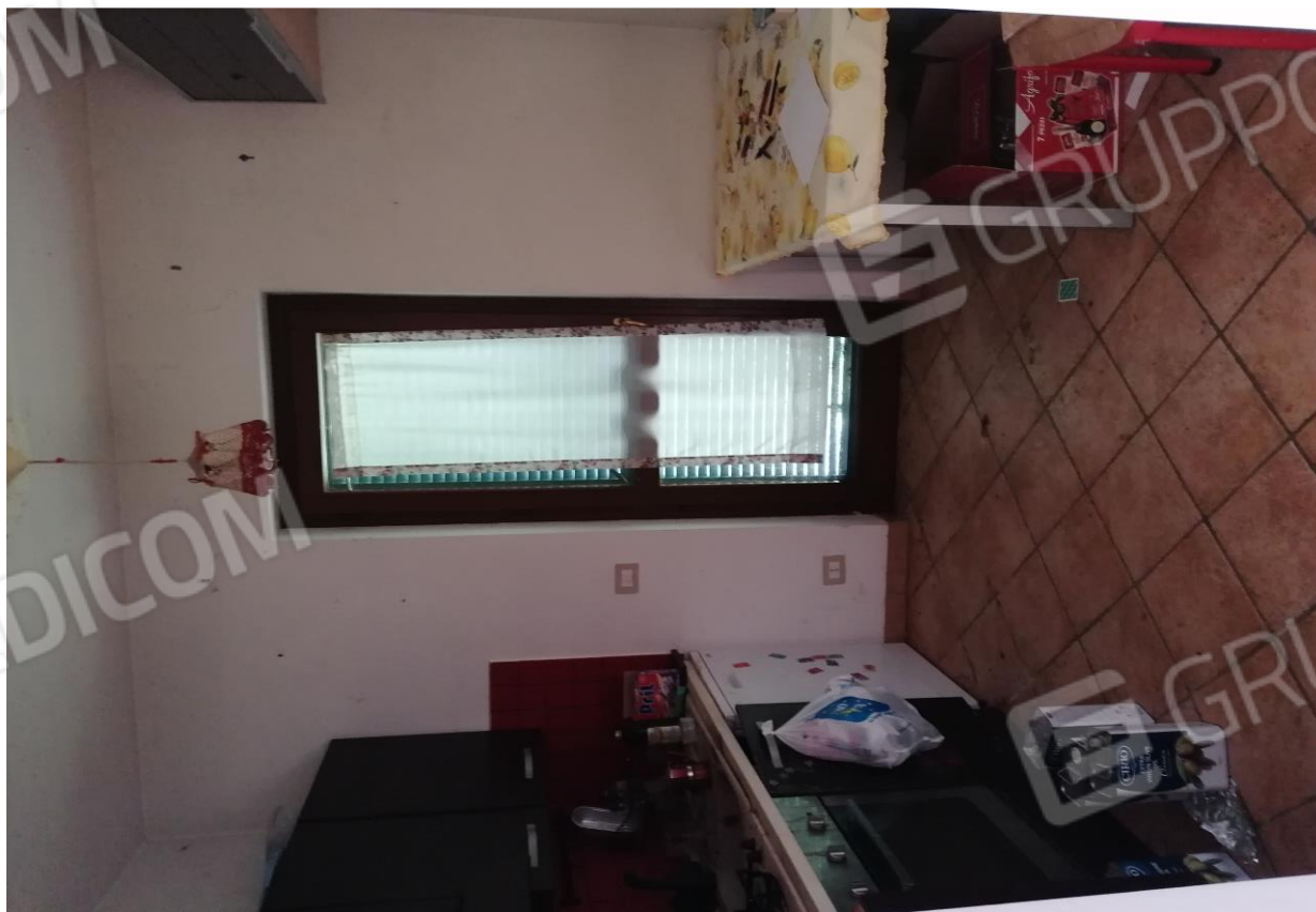
FOTO 6 cucina