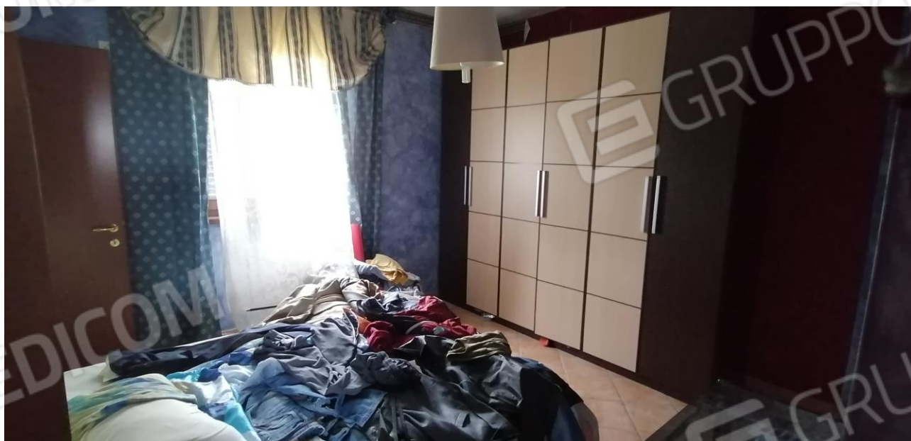
FOTO 8 Vano letto