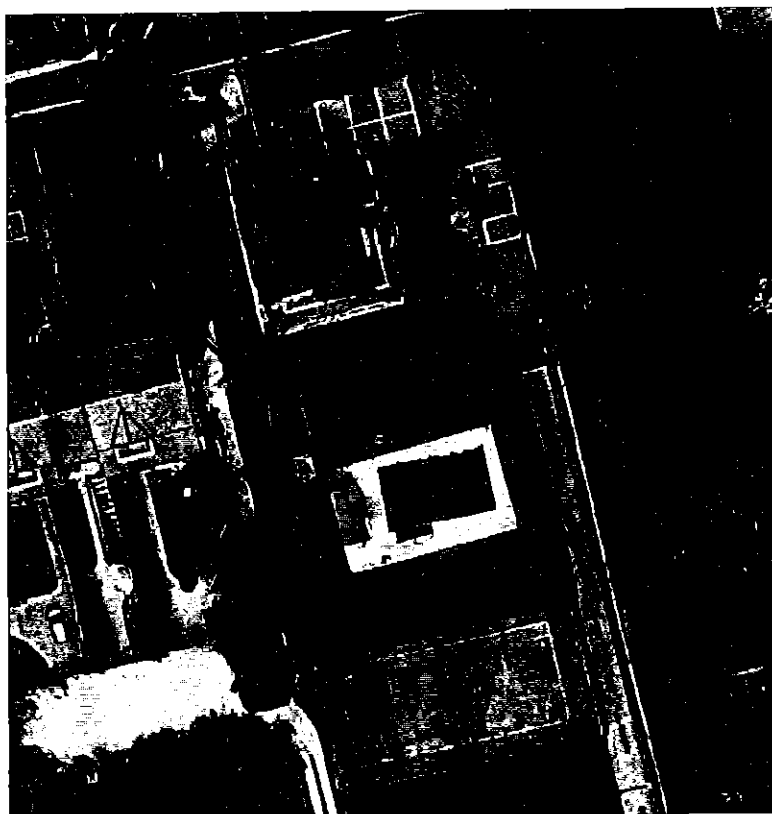
Foto 2 - Foto aerofotogrammetria