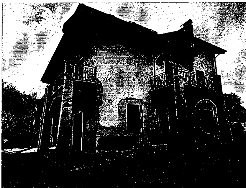
Foto 5 - prospetto principale