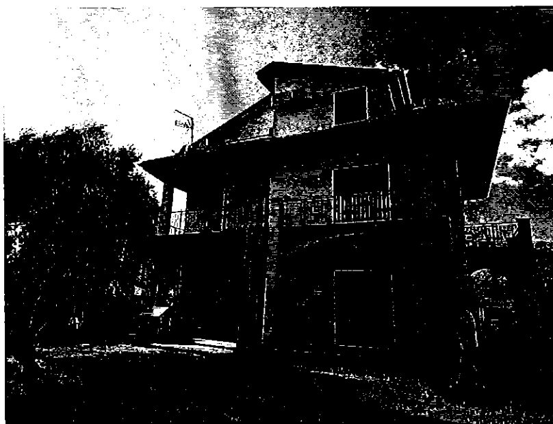
Foto 6 - prospetto principale

Esternamente come si vede nella foto 4 e 5 l'area è a verde naturale e sono presenti localmente muri di recinzione e diversi annessi.