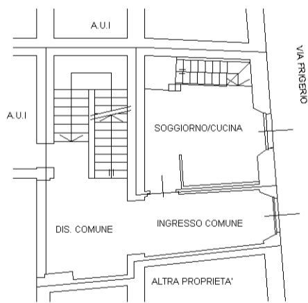
PIANO PRIMO H.=2,78