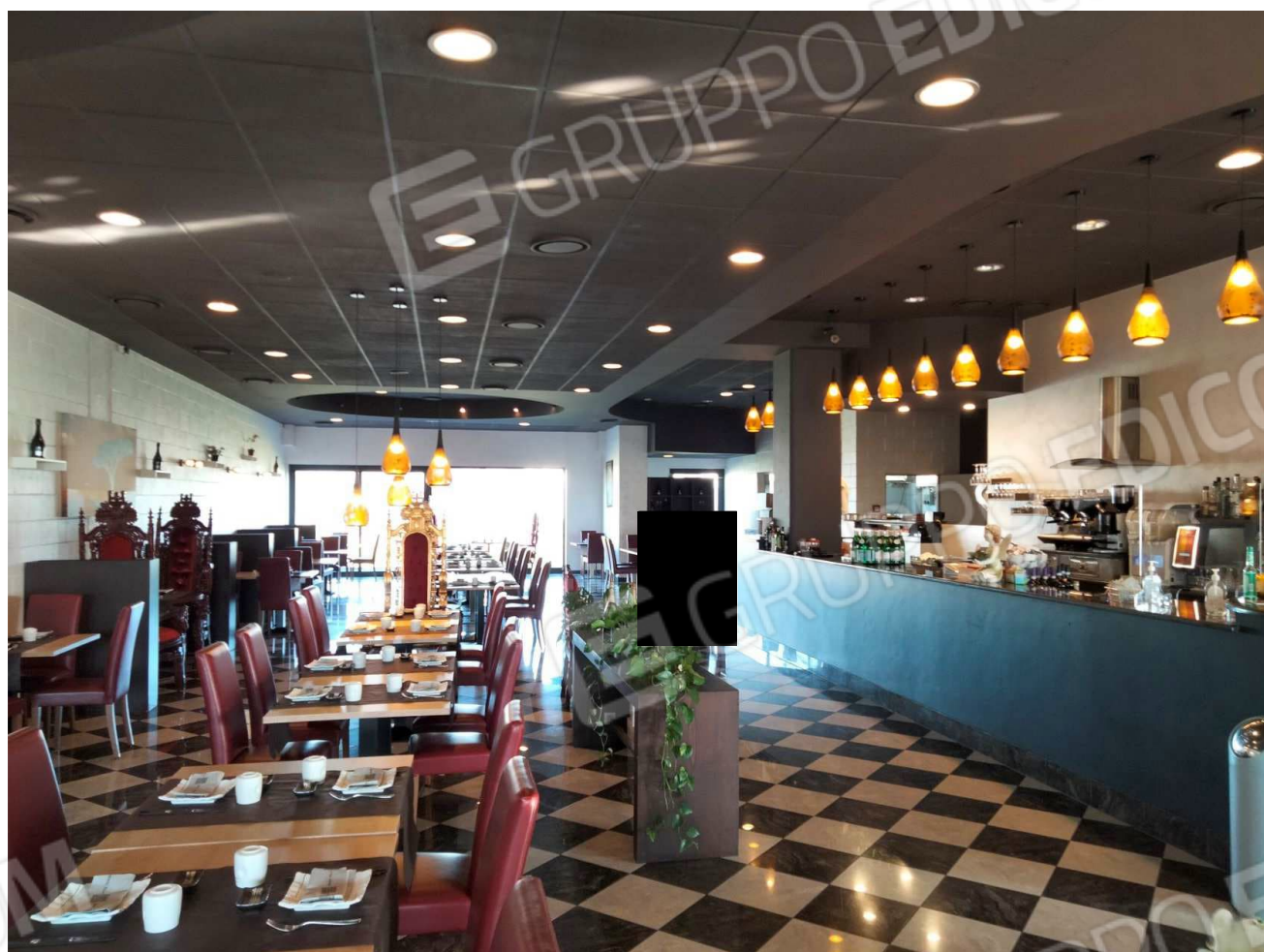
3 Sala ristorante.jpg