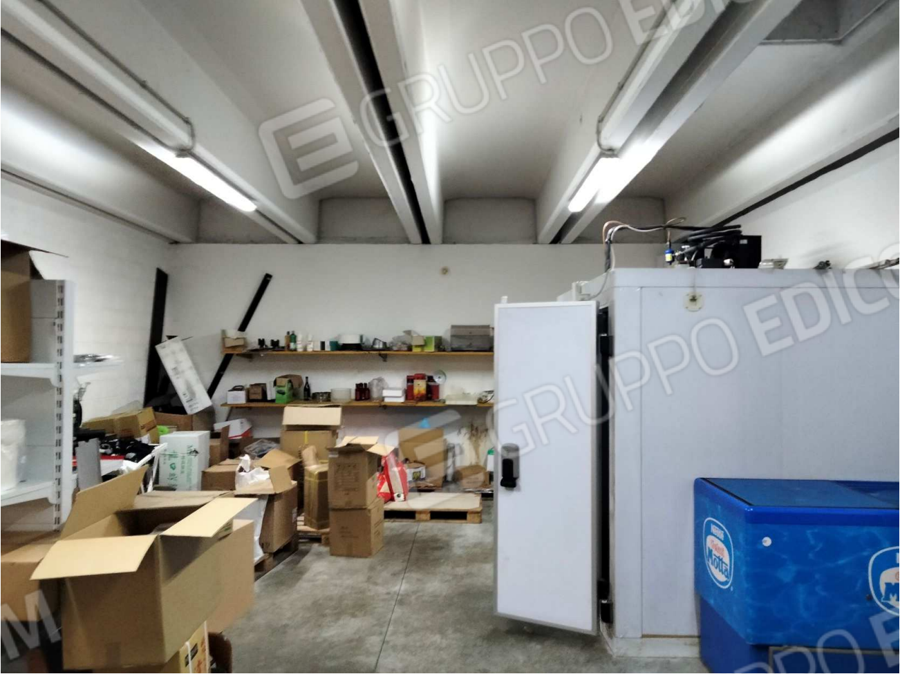
11 Magazzino 1.jpg