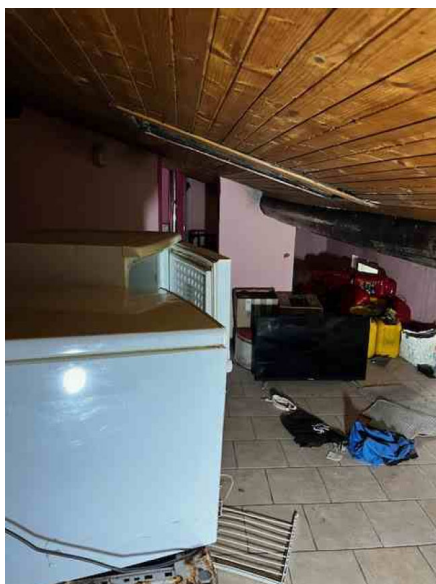
Appartamento piano terzo sottotetto in condizioni precarie di sicurezza antinfortunistica per la presenza di materiali ingombranti