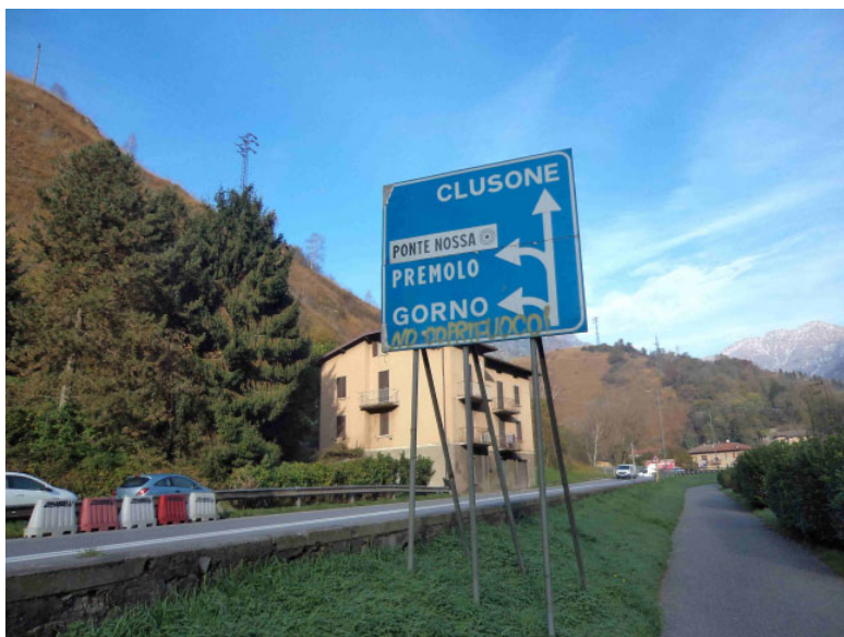
Fabbricato lato sud-est