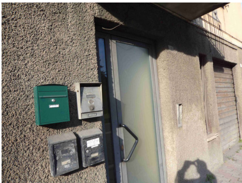
Fabbricato Porta d'ingresso